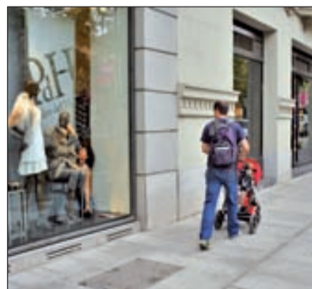
El lujo es la seña del Barrio de Salamanca

Más conocida como la ‘Milla de Oro’ de Madrid. Juan Bravo, Ortega & Gasset, Jorge Juan y Serrano conforman el eje comercial