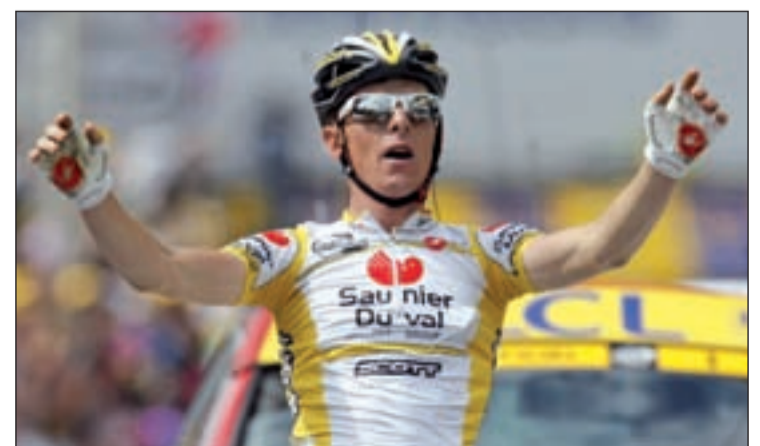
El transalpino vivió tardes de gloria con el equipo Saunier Duval

metido, Riccò reconoció que estos problemas de salud se habían derivado de una autotransfusión realizada a partir de sangre en mal estado. Aunque el propio corredor ha negado esa declaración posteriormente, lo cierto es que el futuro de uno de los ciclistas más prometedores de los últimos años podría estar seriamente en entredicho.