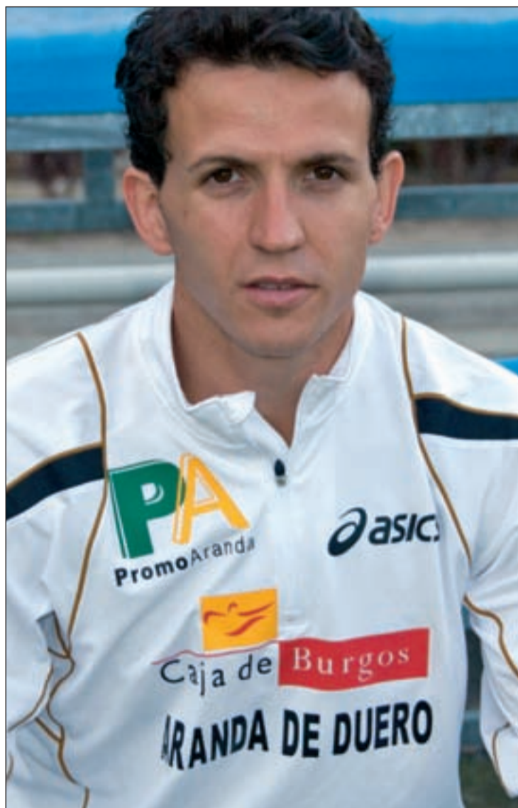
El atleta burgalés ha pasado varios meses en el dique seco

No sé si en esta ocasión en Valencia, pero espero que este año sea, aunque tengo otra oportunidad en los campeonatos al aire libre en Málaga, en agosto.