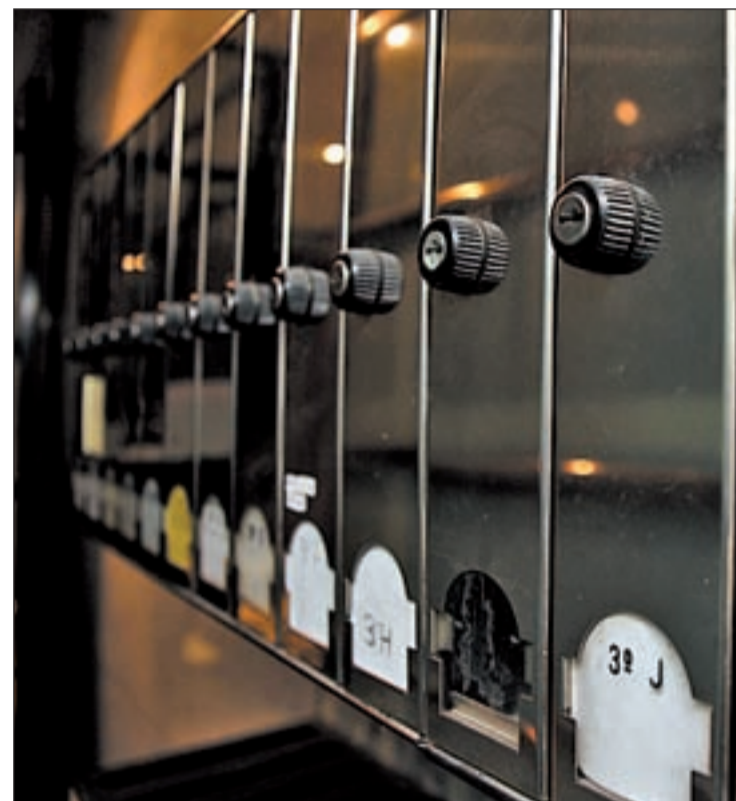
Los principales conflictos vecinales surgen por malos entendidos

La mediación vecinal elimina la verticalidad de la justicia. Tras el mutuo acuerdo, infractor y víctima se sientan cara a cara en busca de una “justicia horizontal”. Sólo hay tres reglas sencillas: “confidencialidad, voluntariedad y afán de solucionar el problema a través del diálogo”, des-