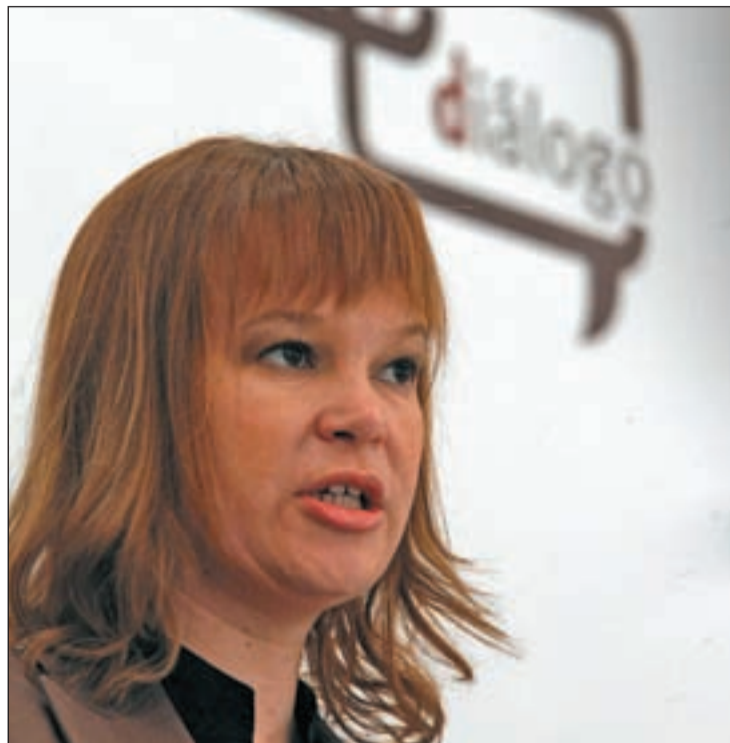
La ministra de Sanidad, Leire Pajín, durante la comparecencia

En la misma línea, Sanidad también ha anunciado que presentará próximamente la resolución que permitirá a los farmacéuticos el fraccionamiento de los envases en aquellos casos para los