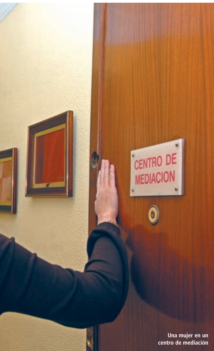
Una mujer en un centro de mediación