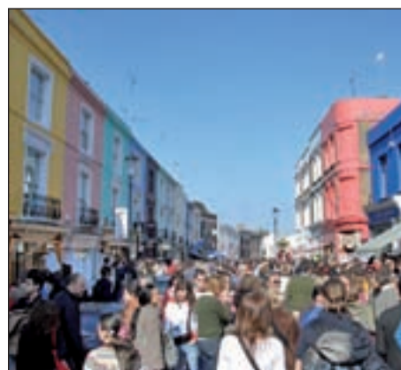
Portobello, lugar de compras londinense

Esta ciudad eleva el ‘todo vale’ a la máxima potencia. Portobello Road, Notting Hill y Candem Town son los lugares clásicos para hacer una ruta de compras. La Old Truman