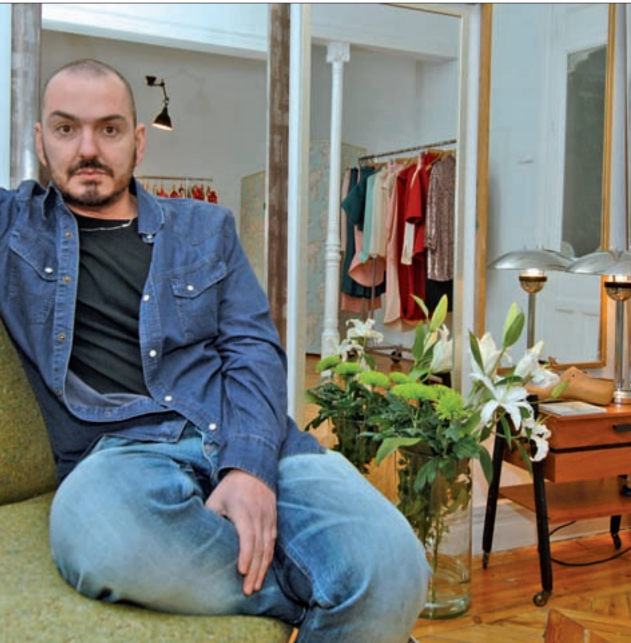
su colección de fondo