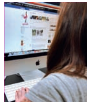
Una chica navega en 'Soy Cibelino'

lendario de Cibeles el 23 de febrero a las 20 horas. En esta pasarela desfilarán los finalistas de un concurso convocado en las redes sociales. Los participantes son jóvenes amantes de las nuevas tendencias que mostrarán su look ante un jurado experto para ser el chico y la chica cibelina de esta temporada.