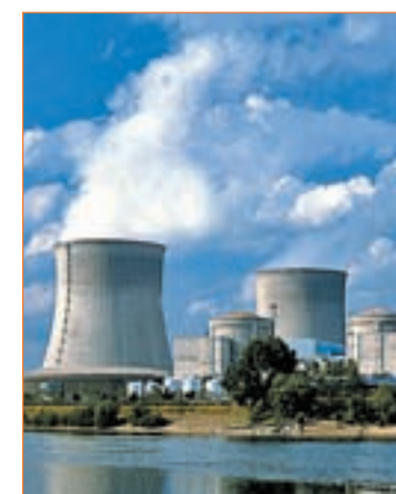
Central nuclear de Garoña

Para el representante de los nacionalistas catalanes, “esta enmienda pone fin a un debate ideológico innecesario que ha presentado a la renovables como energías de progreso y progresistas ya la nuclear como anacrónica y retrógrada”, ha afirmado Duran, quien ha afirmado que “necesitamos ambas fuentes de energía”. Asimismo, ha remarcado que enmienda es “independiente” de la posibilidad de que se instale el ATC en Ascó, provincia de Tarragona.