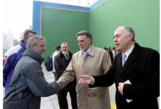
En Palencia, se han construido o renovado 8 equipamientos deportivos.

El nuevo frontón de Campos Góticos tiene una superficie de 30 metros cuadrados y las dos pistas de tenis son de césped artificial. Estas instalaciones cuentan con un cerramiento perimetral, siste-