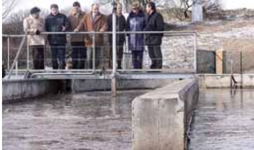
El 88% de la población de la provincia dispone de depuradora.

En la actualidad, el 88% de la población de la provincia dispone de depuradora en funcionamiento y el 10,3% cuenta con una instalación en fase de puesta en marcha