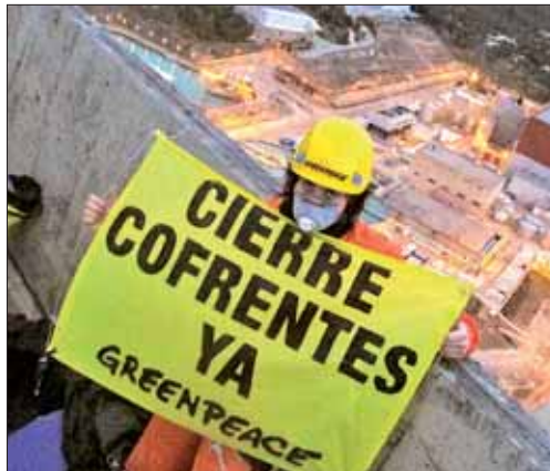
Uno de los activistas que se colaron en la central de Cofrentes

Las centrales nucleares podrán ampliar su vida útil más allá del horizonte de 40 años, que hasta ahora condicionaba su cierre. El pasado martes, entre otros aspectos de la Ley de Economía Sostenible, el Congreso aprobó la enmienda del Senado, auspiciada por PNV y CiU, por la que desaparecerá este plazo de cuatro décadas. Una decisión que ha reabierto la puerta de la polémica sobre el futuro de la energía nuclear en España, alentada por la 'ocupación' durante más de once horas de una de las torres de la central de Cofrentes, en Valencia de un grupo de 16 activistas de Greenpeace. Tras el incidente el Consejo de Seguridad