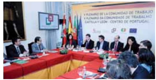
Imagen del Plenario celebrado para el traspaso de la presidencia de turno.

PLENARIO DE LA COMUNIDAD DE TRABAJO CON LA REGIÓN CENTRO PORTUGUESA