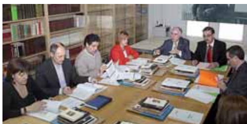
Un momento de la reunión del patronato.

Por otro lado, la Comisión Informativa de Urbanismo dictaminó también favorablemente iniciar el expediente de cesión gratuita a la entidad Provilva de una parcela de titularidad municipal ubicada en la Avenida de Madrid, cerca del campus universitario de La Yutera , para que se construyan viviendas sujetas a algún sistema de protección pública.