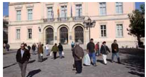
Imagen de archivo de la Plaza Mayor de Palencia.