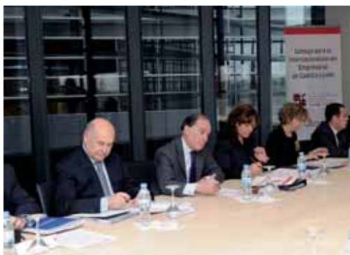
Villanueva presidió la reunión del Consejo para la Internacionalización.