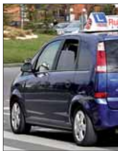
Un coche de autoescuela

El autobús escolar podría atravesar una época de vacas flacas. El subsecretario de Interior, Justo Zambrana, ha anunciado que ya está en el Consejo de Ministros la propuesta que levanta la veda al volante a los jóvenes mayores de 16 años. Esta iniciativa es una novedad que la DGT quiere incluir en el Plan de Seguridad Vial que regirá la conducción durante la próxima década, en consonancia con la estrategia de la UE para reducir la siniestralidad. De recibir el