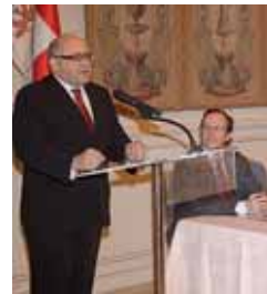
Acto de entrega del galardón.

Por último, afirmó que Palencia Abierta es "un ejemplo que va a permitir lanzar con mucha