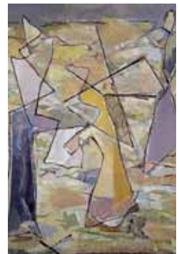
Imagen de una de las obras.

Por otro lado, la Fundación ha cedido temporalmente el