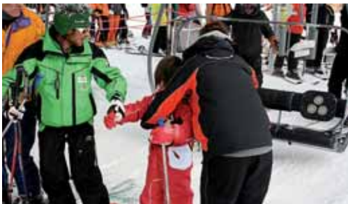
El niño se incorpora en el telesilla junto al Magnestick que le sujeta.

Passar una buena jornada de esquí es lo deseable tras un largo desplazamiento, pero poder degustar productos típicos y conocer la cultura y las costumbres de la zona se hace necesario en un país pequeño, pero con muchas posibilidades.