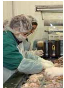
caso de trabajo.

Las bases establecen de esta forma que los beneficiarios de las ayudas son los promotores de nuevas iniciativas empresariales cuya actividad se centre en el ámbito de los denominados nuevos yacimientos de empleo; los que promuevan proyectos innovadores y/o de base tecnológica; aquellos que inicien una actividad que suponga un complemento a la oferta comercial existente y los promotores de proyectos empresariales que afecten a colectivos con especiales dificultades de acceso al mer-