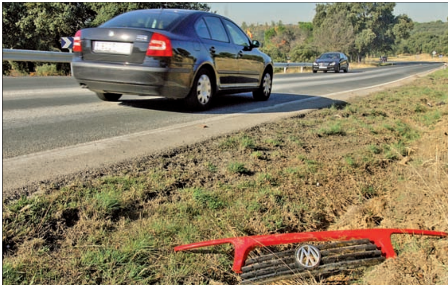
España ha superado el objetivo de la UE de reducir en un 50% la cifra de víctimas mortales en las carreteras