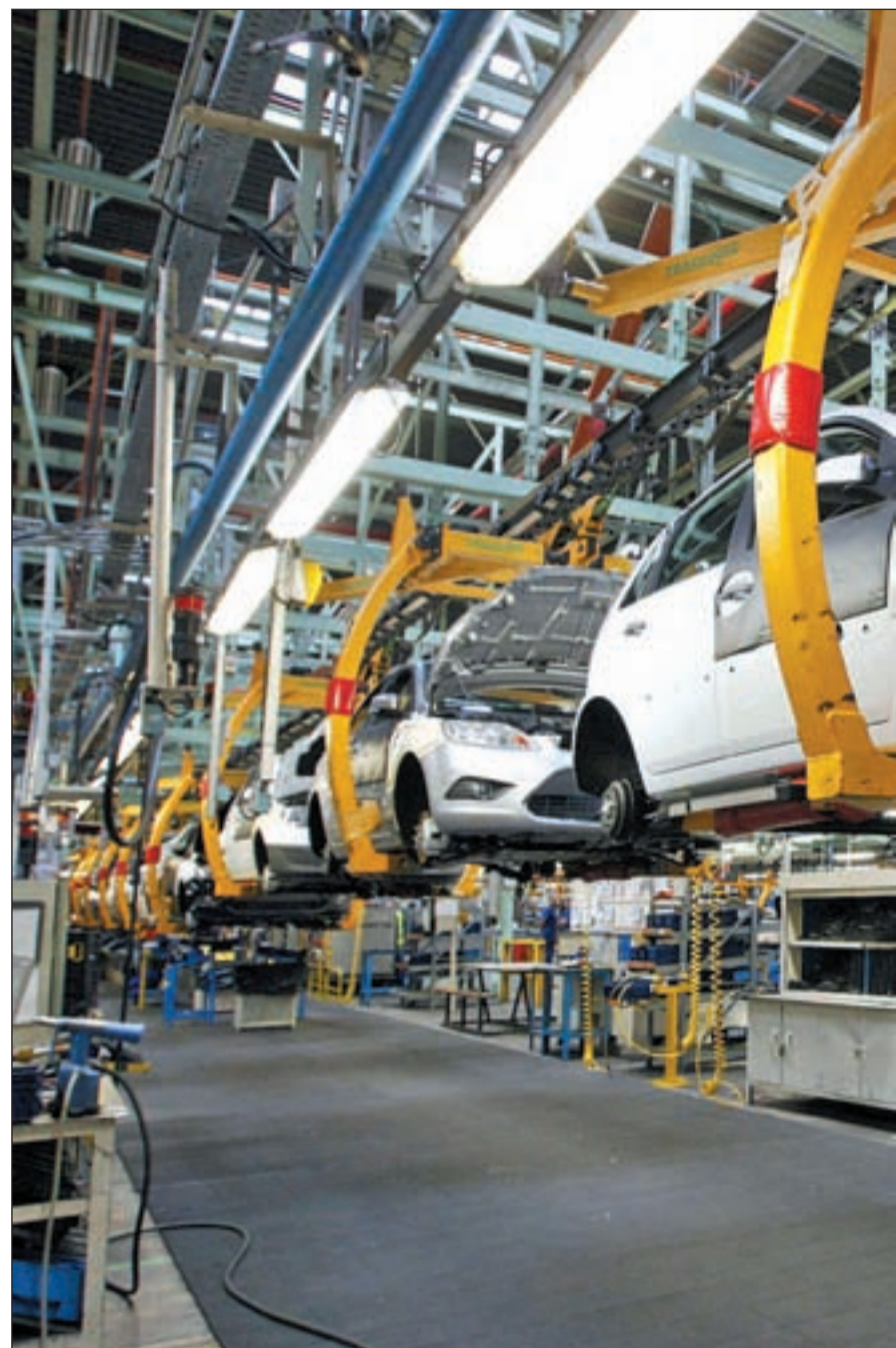
Se ha producido un ligero aumento de ventas en 2010 pero las patronales insisten en que

En este sentido, indicaron que el comprador español puede estar influenciado por la falta de confianza en los factores eco-