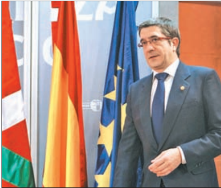
Patxi López, lehendakari vasco, tras valorar el comunicado de ETA

La mediación internacional y los varapalos policiales a la banda podrían estar detrás de este nuevo rumbo y haber desbloqueado los engranajes de cuatro décadas de terror. En respuesta al comunicado, locutado en euskera y en castellano, el Gobierno de- tuvo apenas 10 horas después, a