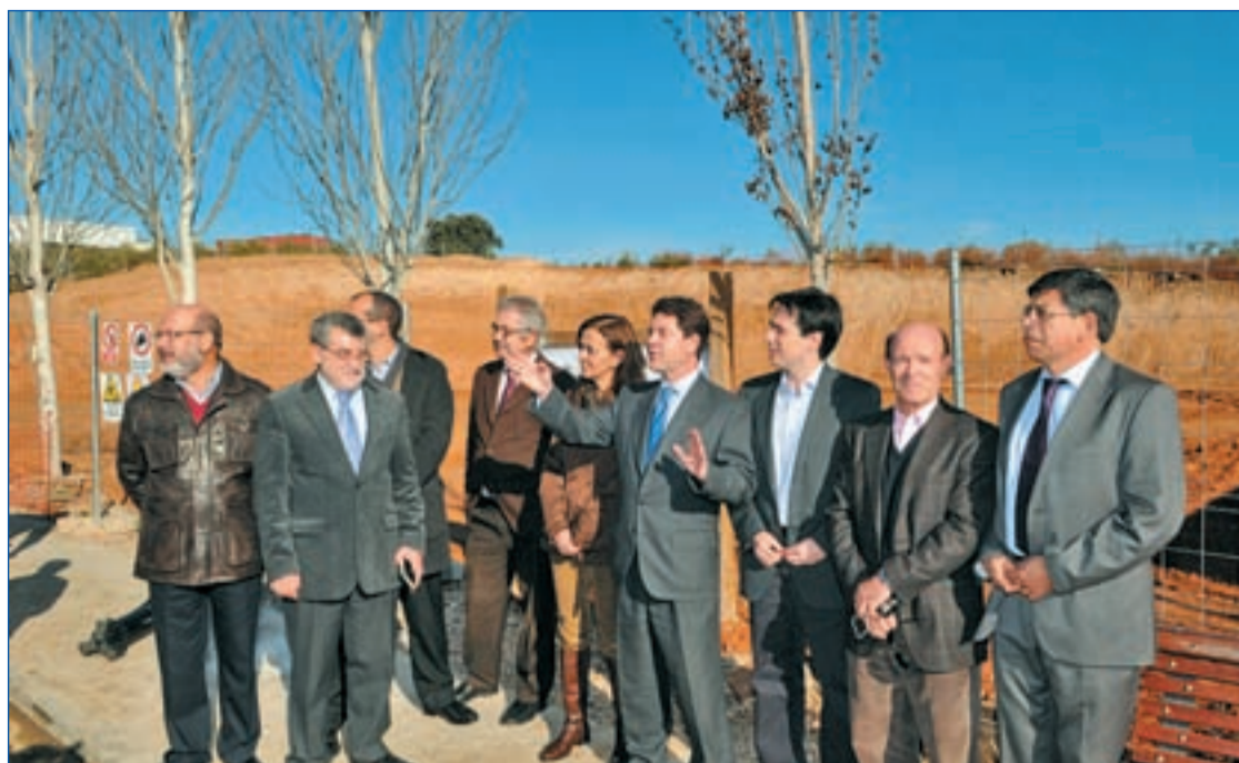
AYUNTAMIENTO DE TOLEDO

El pasado martes el Consejo de Gobierno aprobó unas ayudas a las que podrán acogerse entidades públicas y privadas para el desarrollo de servicios y programas de atención a la infancia y la familia. Para su desarrollo contarán con una inversión de casi 12 millones de euros. El objetivo de estas subvenciones es promover la integración familiar, la autonomía personal y la atención especializada de menores, personas con discapacidad y personas mayores y paliar situaciones puntuales o prolongadas de estos colectivos sociales más vulnerables.