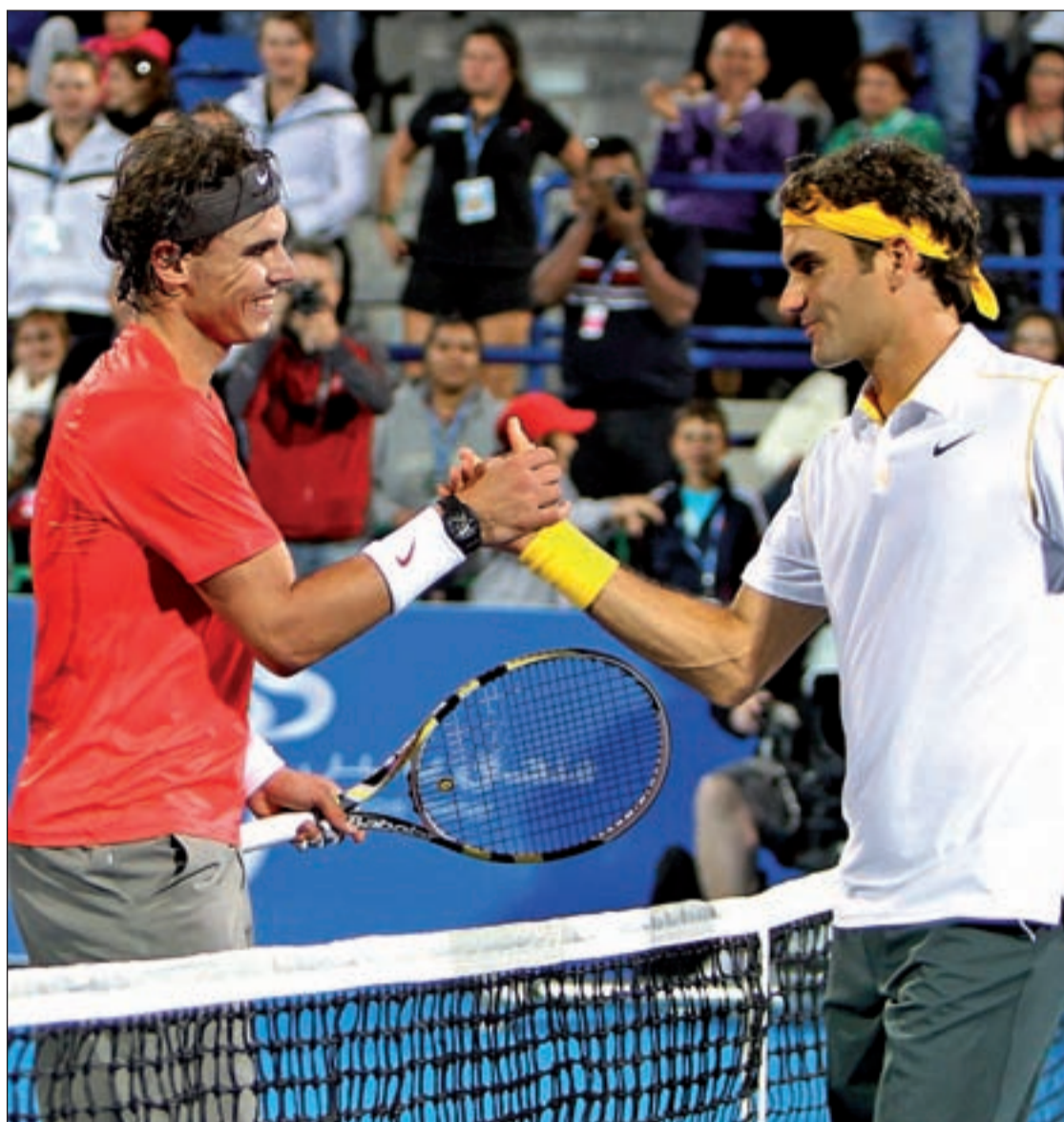
Nadal y Federer se vieron las caras en la final del torneo de exhibición de Abu Dhabi

Los dos primeros de la clasificación ATP parten como claros favoritos en el primer 'grand slam' del año • El suizo defiende su título de 2010