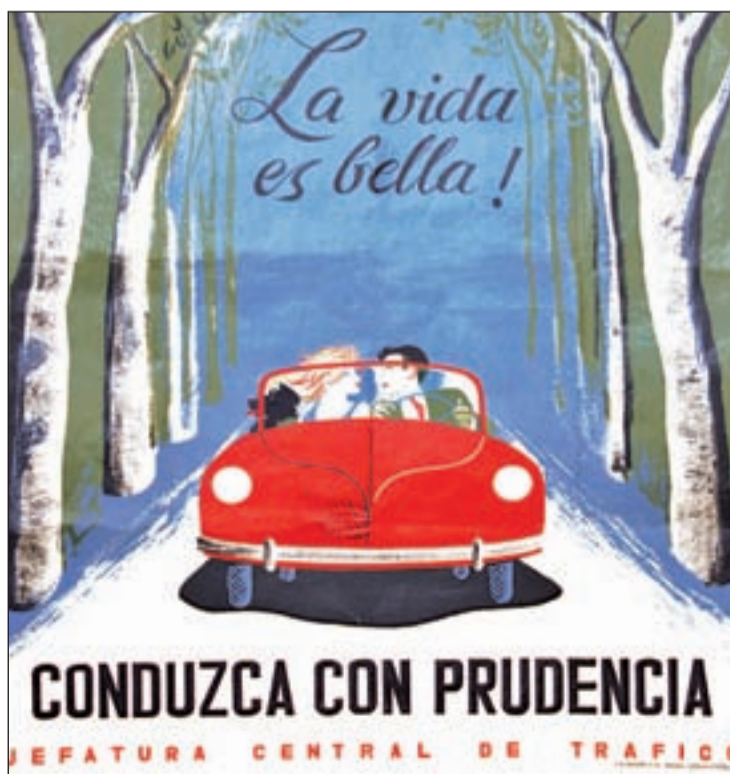
Cartel de la Jefatura de Tráfico del año 1961

En 2010 se registraron 7.954 heridos graves en accidentes de tráfico (aquellos que están más de 24 horas hospitalizados, muchos de los cuales son dados de alta sin mayores consecuencias pero muchos otros sufren secuelas permanentes). Son 1.021 menos que en 2009 (8.975) y 10.990 menos que en 2001, cuando se alcanzó la cifra de 18.994 heridos graves. Así pues, el descenso acumulado desde