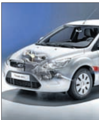
Ford se hace más ecológico

confirmado y pronto llegarán los avances de al menos otros tres modelos. Según el fabricante, la velocidad máxima del vehículo será de 136 kilómetros por hora. La principal ventaja competitiva sería el tiempo de recarga de las baterías de ion-litio, que será un 50 por ciento inferior a las de cualquier otro eléctrico.