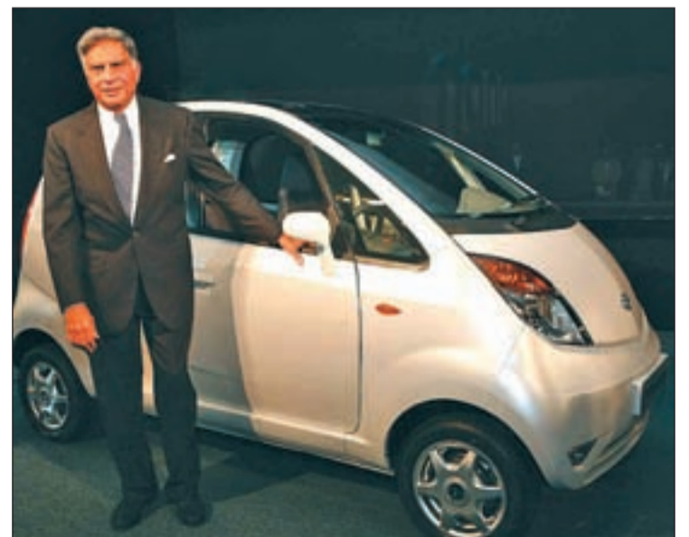
Los fabricantes del Tata Nano Motors lanzaron en 2009 este utilitario de 1.880 euros en la India con la intención de exportarlo por todos los países. Pero no se han logrado los resultados que esperaban.

En Estados Unidos, la compañía india ha hecho un nuevo esfuerzo para intentar recuperar las ventas de su micro car Nano y parece que los cambios están empezando a dar resultados. El coche, que en este país se vende a un precio de 2.900 dólares, ha visto ampliada su garantía, mejorada su financiación y, además, cuenta con una nueva campaña de publicidad que incluye un anuncio de televisión.