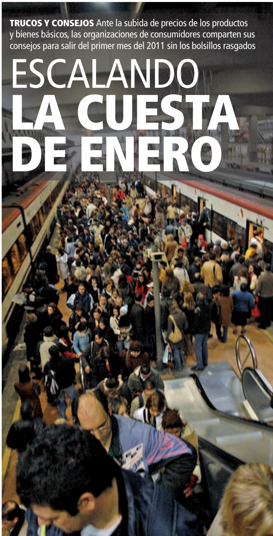
Ciudadanos en una estación de trenes de cercanía, uno de los servicios que se encarecen