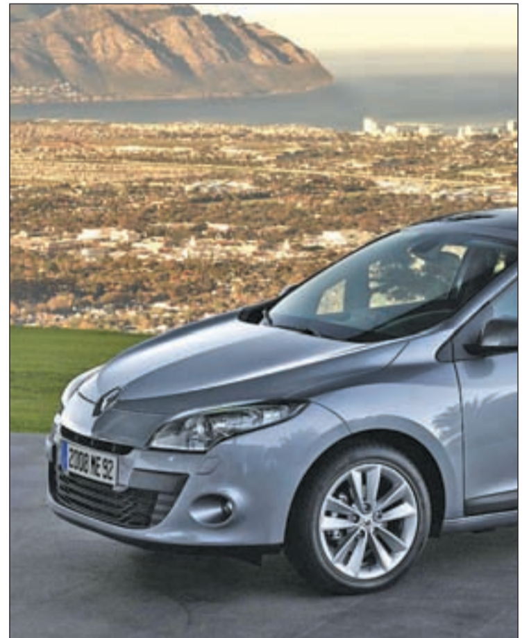
Renault Mégane: el coche más vendido del año

En el segmento de las berlinas medias, grandes y familiares, el ganador ha sido el Volkswagen Passat, seguido del Opel Insignia y el Audi A4. La cuarta plaza ha sido para el Mercedes Clase C, la quinta para el Citroën C5 y la sexta para el Seat Exeo. Les siguen el Skoda Octavia, el BMW