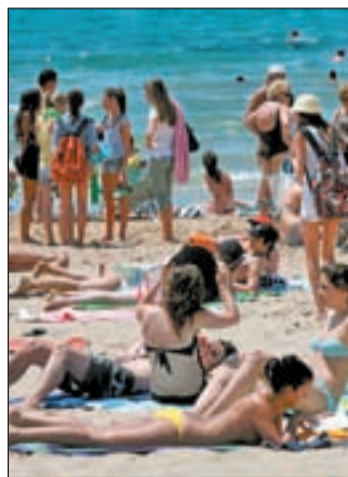
Imagen de una playa española

El pasado año España redujo su dependencia de Reino Unido y Alemania, gracias a una mayor diversificación hacia otros mercados. El sector turístico español cerró el año 2010 con un aumento del 1,4% de las llegadas de tu-