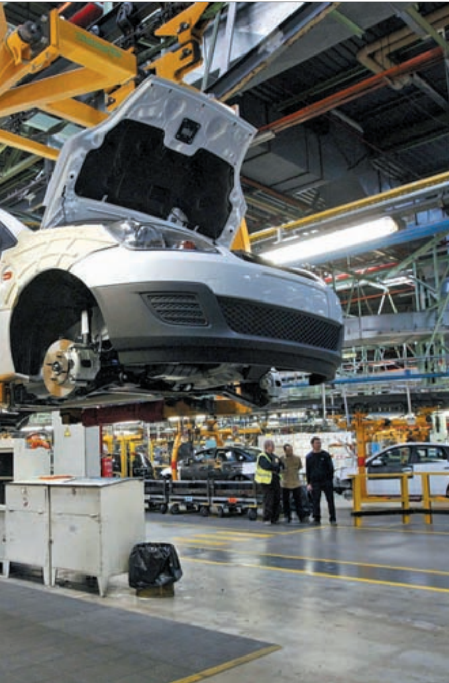
el mercado español debería superar el millón de unidades vendidas

y Madrid registraron subidas de las ventas entre enero y diciembre, mientras que en el último mes del año, todas las comunidades registraron descensos de matriculaciones. El 71% de los