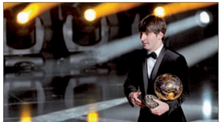
El argentino recibió el premio de manos de Guardiola

El premio de mejor entrenador recayó en la figura del luso José Mourinho, gracias a su labor con el Inter de Milán con el que logró el ansiado 'triplete'.