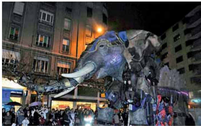
El alcalde de León recibió a los Reyes Magos en la Estación. Posteriormente, tuvo lugar la Cabalgata y el espectáculo 'Pedaleando hacia el cielo'.