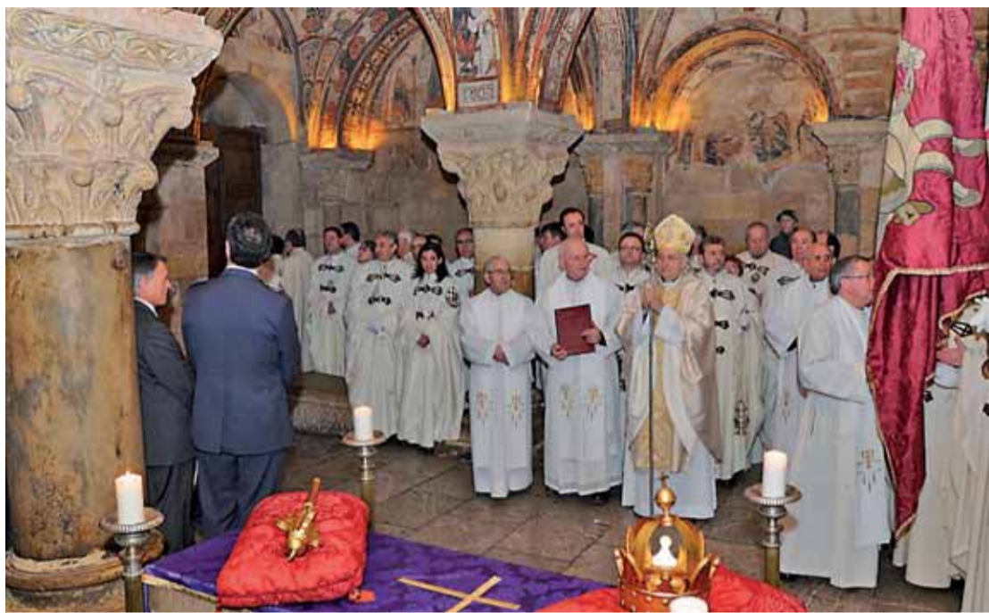
El Panteón Real acogió el 6 de enero un especial 'Responso Real' al coincidir con el 1.100 Aniversario del Reino de León.

El remate del 1.100 Aniversario fue incluso más especial que el inicio, pero en el mismo lugar: el Panteón de los Reyes de León de San Isidoro. El 6 de enero, como es tradicional, se celebró el 'Solemne Responso Real' presidido por el obispo Julián López. Esta vez, y de forma excepcional, se invitaron al histórico acto a las corporaciones municipales de Astorga y León que asistieron acompañadas, respectivamente