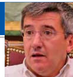
Alcalde de León

El Ayuntamiento ya no es una mochila pesada para los ciudadanos sino un instrumento de futuro al haber desarrollado proyectos muy importantes en un escenario de crisis"