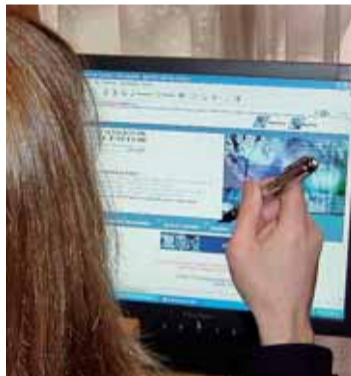
Inscripciones del 13 al 31 de enero.

La mayoría de estas acciones formativas, con una duración que oscila entre 20 y 50 horas, está