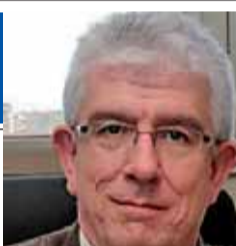
Rector de la Universidad de León

Me he enfrentado probablemente a las peores circunstancias y creo que hemos salido bastante bien parados, con nota. Seguiremos la proyección internacional y la excelencia de la ULE"