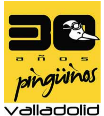
Cartel de la edición de 2011.

La ONCE dedica el cupón del sábado 8 de enero a la concentración motera 'Pingüinos 2011', que se celebra en Valladolid entre los días 6 y 9 de enero. En la imagen de los cinco millones de cupones aparece el logotipo de la concentración de este año, junto a las fechas y el lugar de celebración, y una imagen de la propia concentración. Así, la organización se suma a la cita internacional de invierno de motoristas más numerosa de España, que este año conmemora su 30 edición.