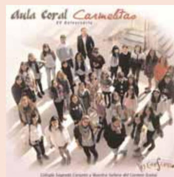
La Coral de las Carmelitas ya tiene su disco CD con 13 canciones.