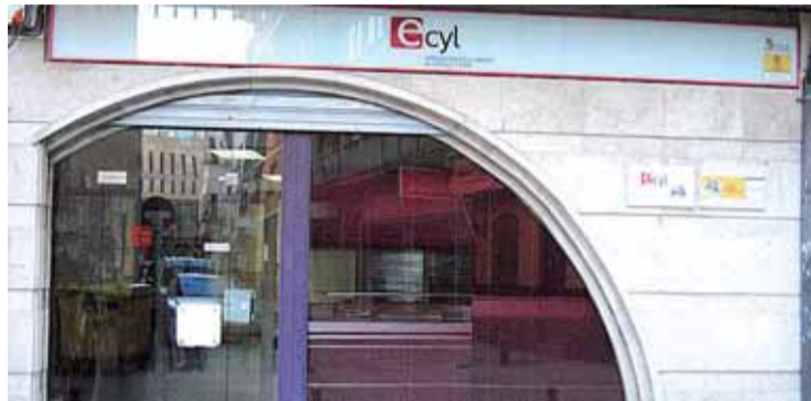
El paro registrado en las oficinas de empleo aumentó un 3,01% en diciembre.

Todas las provincias experimentaron un incremento de parados en relación con el mismo mes de 2009, más significativo en Soria (13,7%), Ávila (13,26%) y Zamora (10,46%). Por detrás se sitúan los aumentos de desempleados del 9,18% en Segovia; 8,19% en Salamanca; 5,74% en León; 5,59% en Burgos; 5,24% en Palencia, y, final-