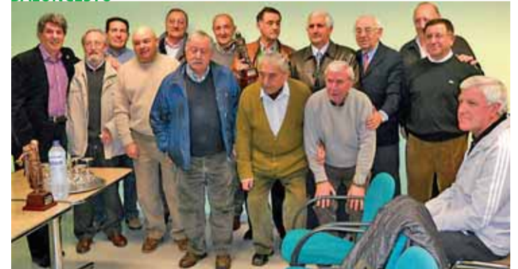
Foto de familia de los profesores homenajeados.