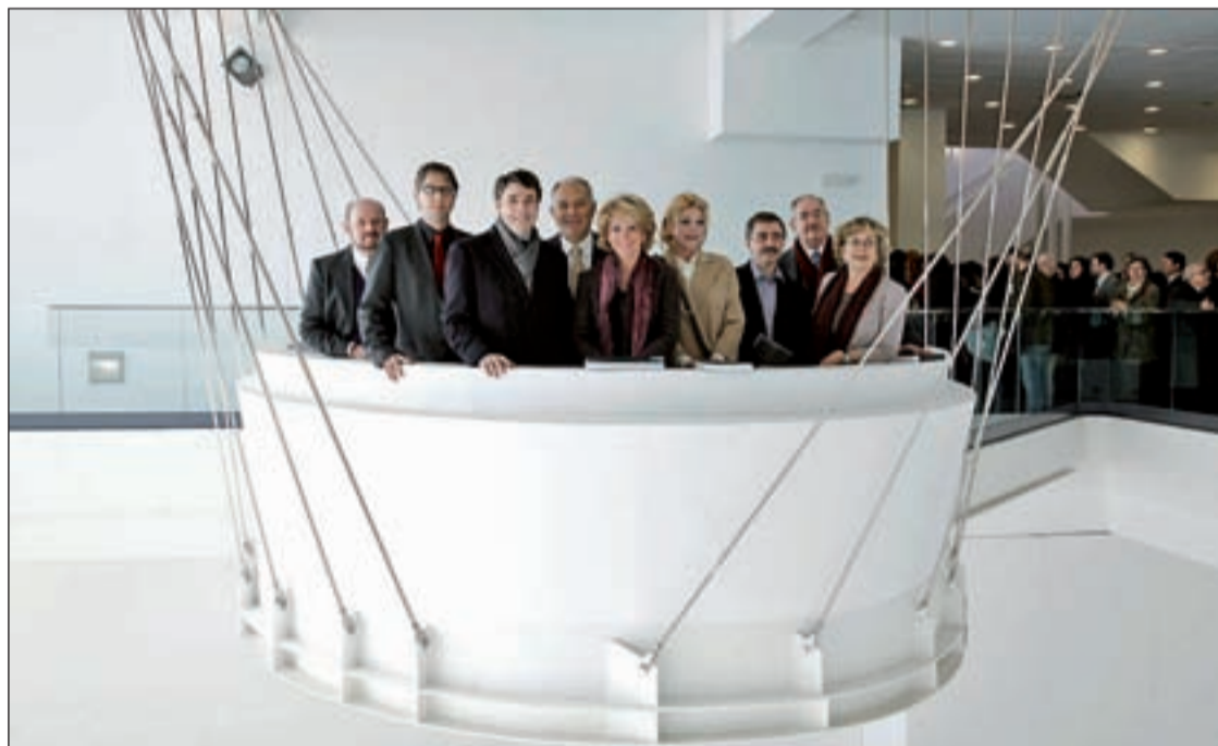
Esperanza Aguirre, en el centro, junto a Esteban Parro y el resto de personalidades que acudieron al CA2M

El museo mostoleño ofrecerá a sus visitantes sesenta obras del catálogo regional hasta el próximo mes de abril. Aguirre inauguró la muestra Pág. 4