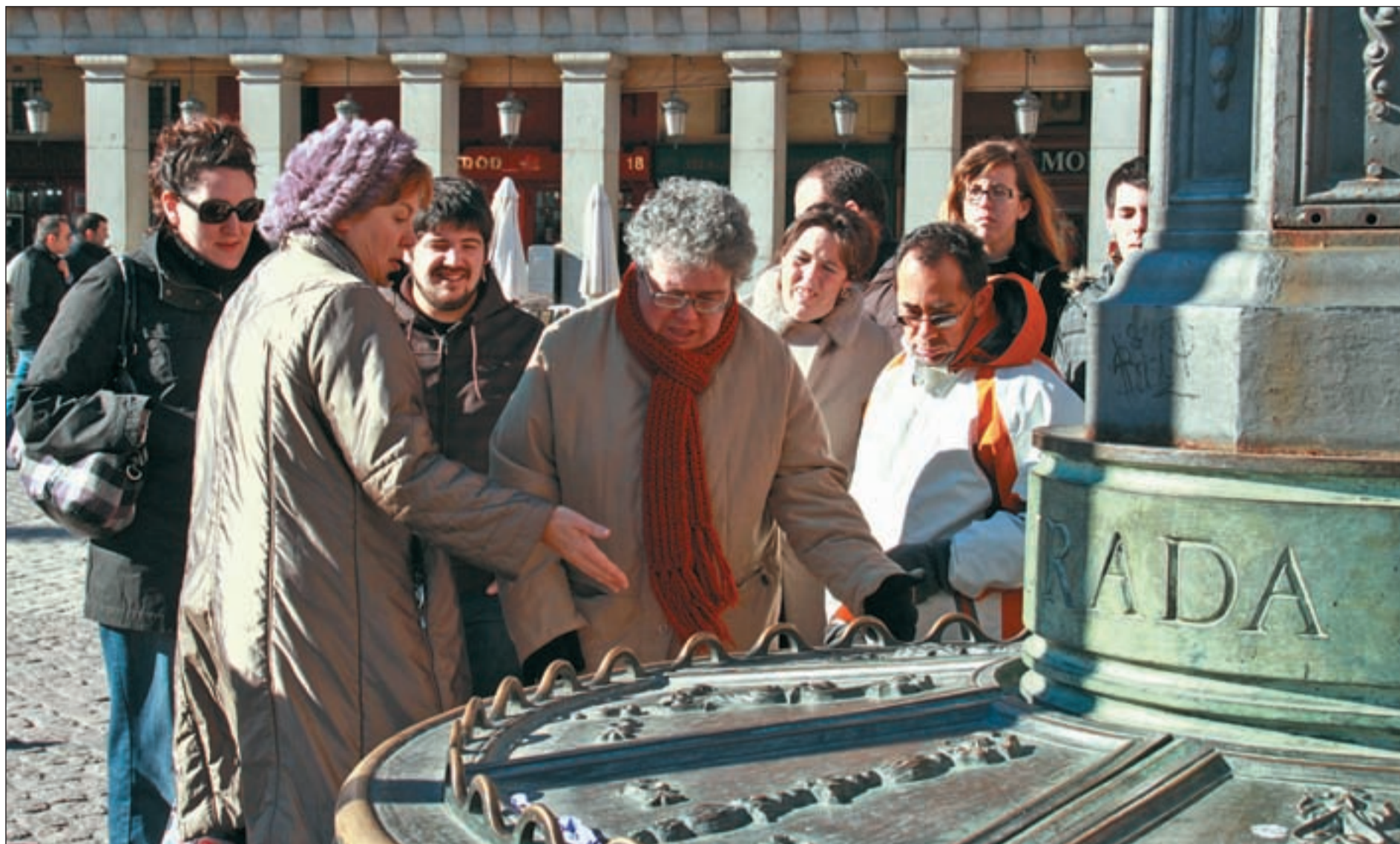
Un instante de la visita guiada adaptada sobre el 'Ayer y hoy de la Plaza Mayor' que tuvo lugar el pasado sábado JORGE LÓPEZ

LAS PERSONAS CON DISCAPACIDAD INTELECTUAL que visiten la capital a lo largo del 2011 o residan en ella pueden acceder a numerosas visitas turísticas guiadas que serán adaptadas a sus necesidades, así como a diferentes patologías con el objetivo de facilitar un mayor acceso a la cultura