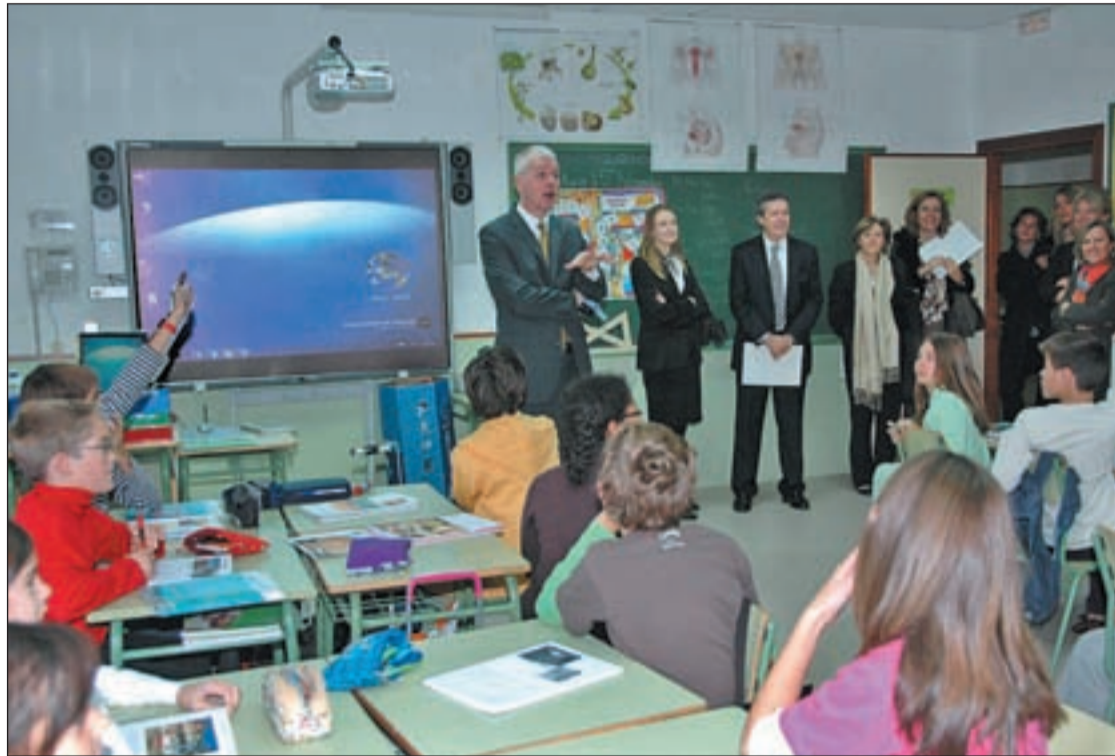
Visita a un colegio bilingüe de la Comunidad

Para ello, la Consejería de Educación publicó esta semana en el Boletín Oficial de la Comunidad la convocatoria correspondiente para la selección de los 25 nuevos colegios públicos en los que se implantará la enseñanza bilingüe español-inglés en el próximo 2011-2012.