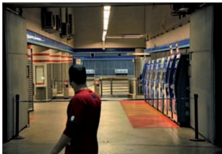
Metro de Madrid durante la huelga de junio