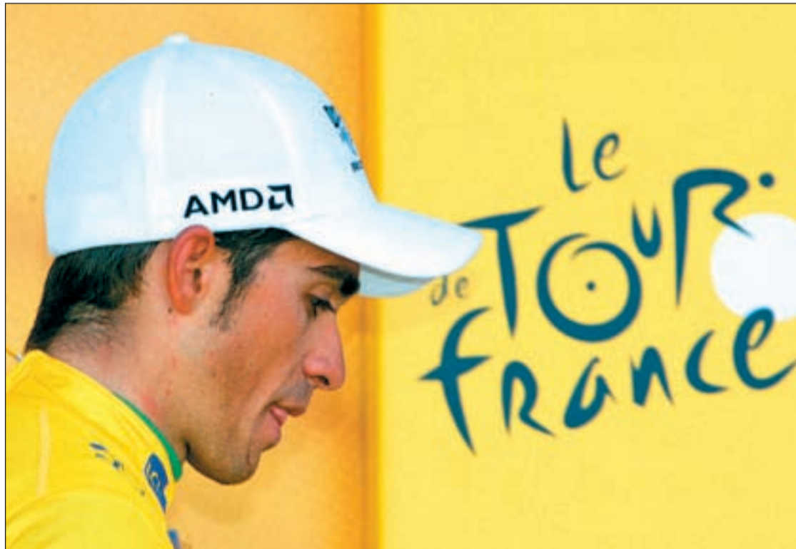
El ciclista madrileño conocerá la decisión definitiva en pocos días

La decisión de la Federación Española se queda a medio camino entre lo solicitado por las partes implicadas. Por un lado reconoce parte de la culpabilidad de