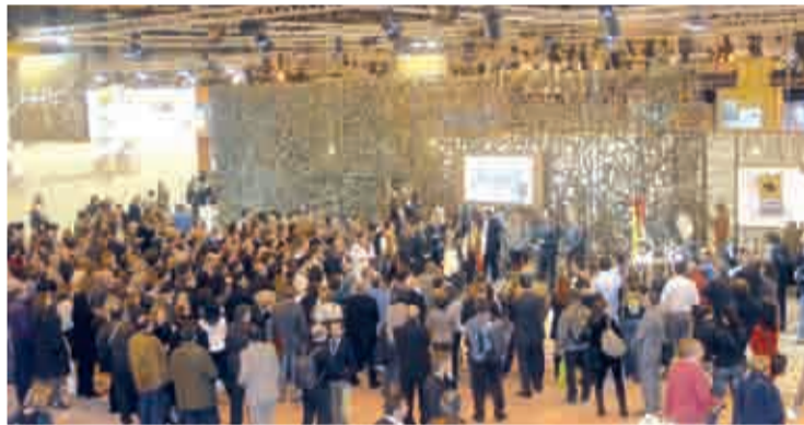
Mucha gente se acercó al pabellón de La Rioja.

atractivos, riquezas y potencialidades que ofrece a sus visitantes y que convierte nuestra tierra en un destino turístico singular".