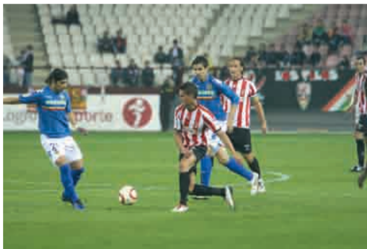
Partido de la Unión Deportiva Logroñés.