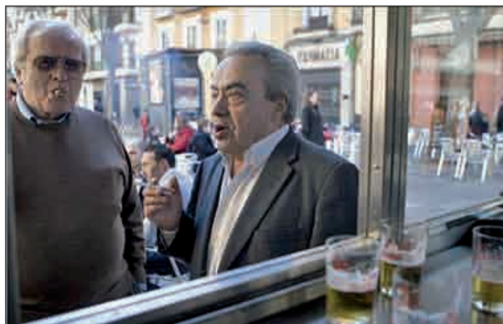
Dos fumadores en el exterior de un bar

nomos de la hostelería han reducido sus ingresos entre el 11% y el 60% tras la prohibición de fumar en sus locales y prácticamente la mitad de los que tienen una máquina expendedora de tabaco en sus locales piensa prescindir de ella. Otro 12,3% de los dueños de bares y cafeterías ha visto cómo disminuían la facturación de su negocio en menos del 10% y sólo un 5,3% denuncia que sus beneficios han caído entre el 81% y el 100% tras los primeros 15 días de la norma. Asimismo, la encuesta pone de manifiesto