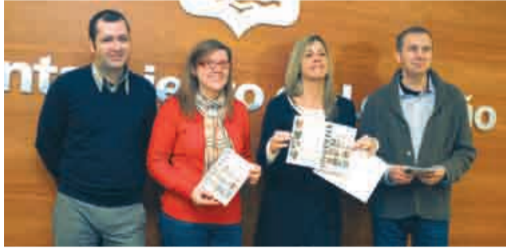
Presentación del ciclo de cine para mayores.

Las películas se desarrollarán en los cines 'Moderno' a las 17,00