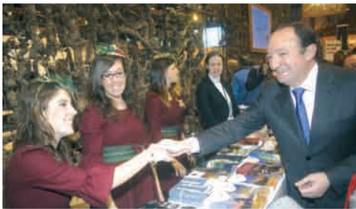
Pedro Sanz, presidente de La Rioja, en el stand de FITUR.

"La Rioja", dijo en referencia a la quinta edición de la exposición 'La Rioja Tierra Abierta', que recreará el esplendor del Imperio español durante los siglos XVI y XVII, "es barroca por la abundancia de