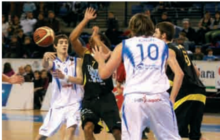
Partido del Cajarioja en el Palacio de Deportes.

Para esta cita, el club riojano ha decidido que todos los aficionados, incluidos los socios, paguen por asistir al encuentro, ya que el club necesita equilibrar los gastos que supone este partido. Unos gastos que, por reglamento, el anfitrión de la Copa debe asumir y que son, entre