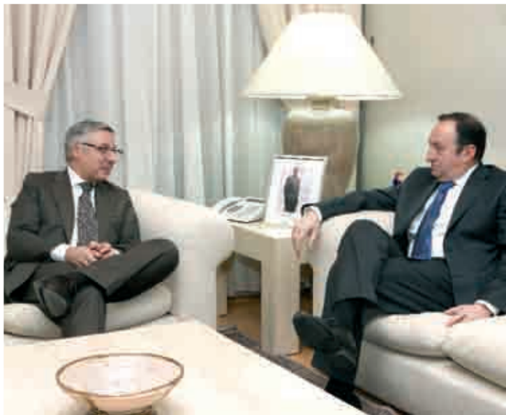
José Blanco, ministro de Fomento, y Pedro Sanz, presidente de La Rioja.

El Gobierno de La Rioja ha conseguido que el Ministerio de Fomento, en el plazo de un mes, estudie la posibilidad de financiar totalmente la gratuidad de la AP-68 entre las estaciones de Ceniceiro y Agoncillo.