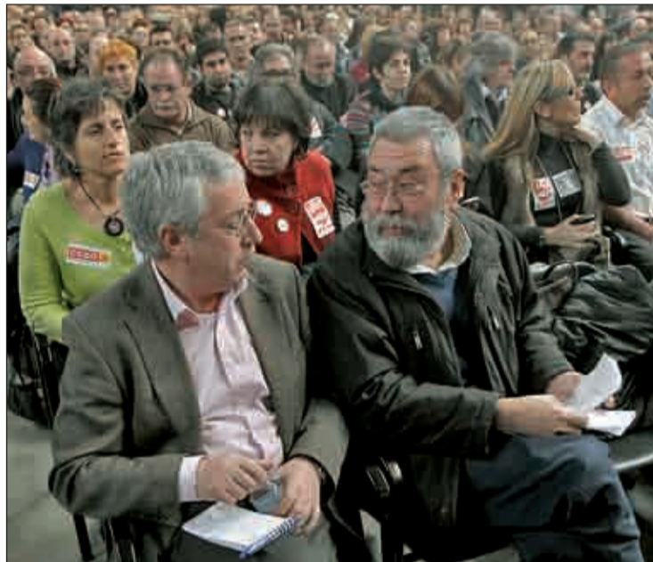
Ignacio Fernández Toxo y Cándido Méndez, líderes sindicales

Mientras, el tiempo sigue descontando margen para que las negociaciones alcancen un