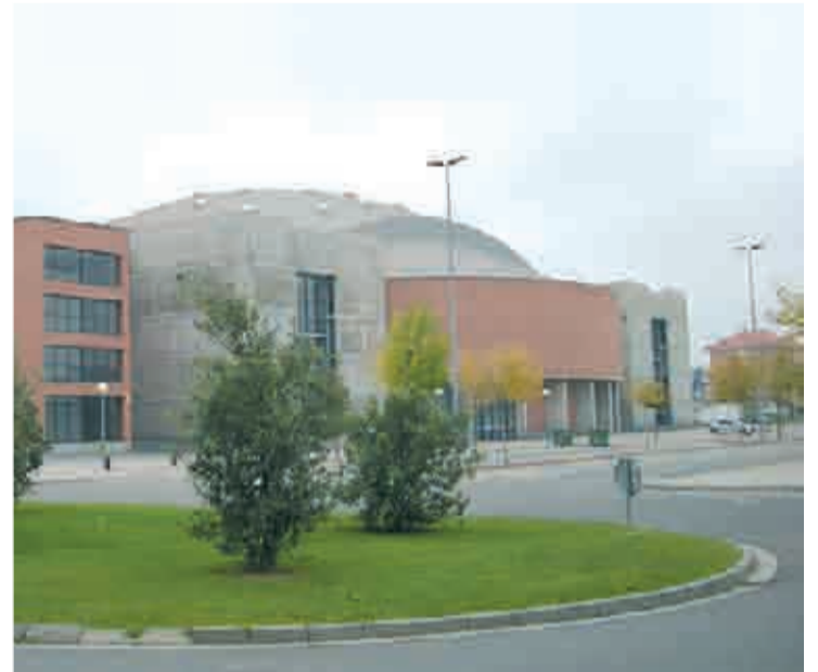
Palacio de Deportes de La Rioja.