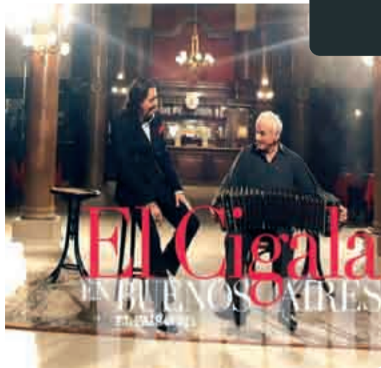
Diego 'El Cigala'.