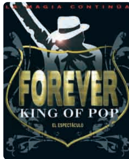
'Forever King of Pop'.

la Ópera de Cámara de Varsovia, la Orquesta de Cámara de Florencia, el musical 'El mago de Oz', Madeleine Peyroux y el Ballet Concierto Iñaki Urlezaga. También llegan a Logroño los musicales más famosos del panorama actual. 'Hoy no me puedo levantar', uno de los pocos musicales que han alcanzado el éxito de haber hecho vibrar a más de dos millones de espectadores has-