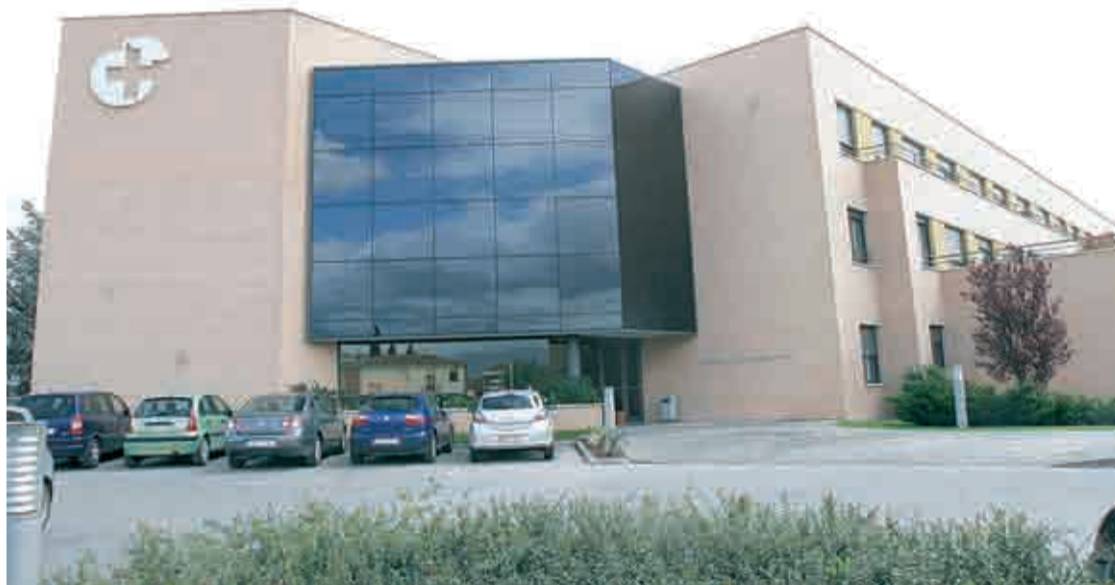
Hospital Los Manzanos de Logroño.

En La Rioja, si analizamos la mortalidad por edad, observamos que las enfermedades cardiovasculares se encuentran entre las tres primeras causas de muerte del grupo de edad de 45 a 54 años, en los hombres, y de 65 a 74 años, en las mujeres. A partir de los 75 años, estas enfermedades ocupan el primer lugar en ambos sexos.