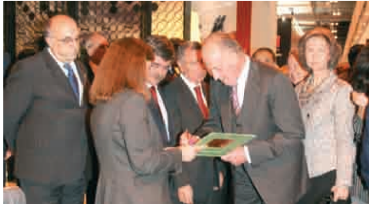
Visita de los Reyes al stand de Logroño en FITUR.