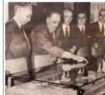
Maqueta del 'Plan Ruavieja', 1970.