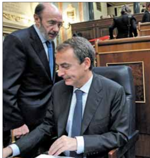
Alfredo Pérez Rubalcaba y José Rodríguez Zapatero

sas se ha anunciado la privatización de hasta el 49% de Aeropuertos Españoles y Navegación Aérea, AENA, y el 30% de Loterías y Apuestas del Estado. Así, se abre la puerta a la entrada de capital privado y a la gestión privada en régimen concesional de algunos aeropuertos, como el de Madrid-Barajas y Barcelona-El Prat. El personal de AENA ya ha convocado paros y protestas en las fiestas navideñas que concretarán la próxima semana. Una situación que complicaría más aún el tráfico aéreo de sumarse los controladores aéreos, en constantes tensiones con Fomento estos días, a estas movilizaciones generales. En cuanto a las reformas encaminadas al sector privado, se va a ampliar el concep-