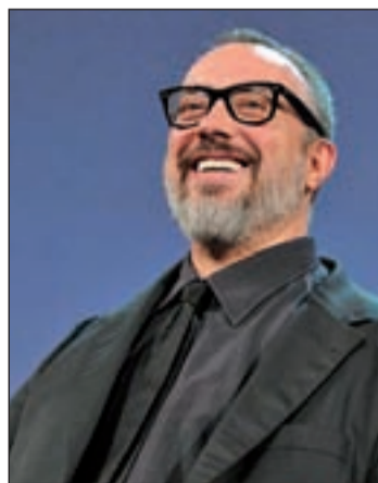
Álex de la Iglesia

una niña con faldas y ricitos de oro en mitad de la era. Tenía ganas de introducir nitroglicerina en el concepto mismo de la guerra con una imagen brutal, y la intención era precisamente destruir la imagen clásica, hacer cine español pero de otra manera", ha indicado el director bilbaíno sobre situar el inicio de la historia en la Guerra Civil.