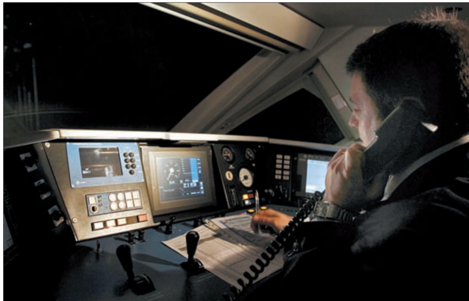
La moderna cabina desde la que el maquinista controla el avance del AVE en la línea que une Madrid y Valencia

Los Reyes inauguran oficialmente el trayecto de la Alta Velocidad Ferroviaria entre Madrid y Valencia el sábado · Más de 60.000 personas ya han adquirido sus billetes en esta línea Pág. 4