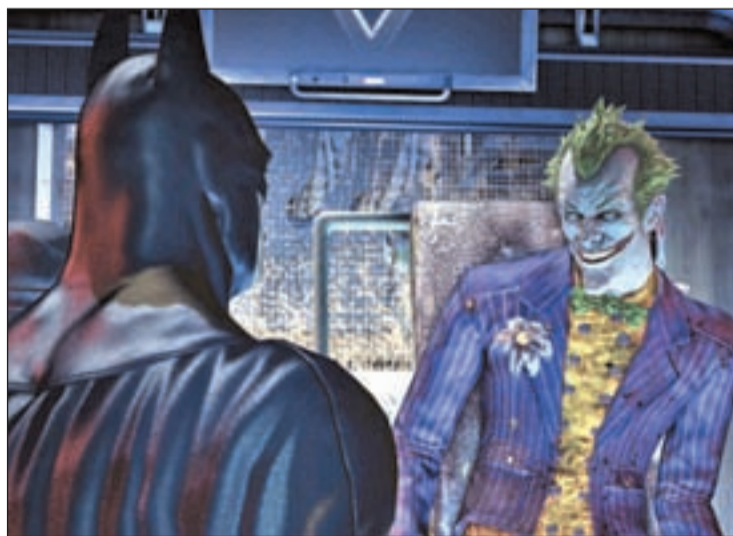
Batman también goza de buena salud como videojuego

Se trata del videojuego de carreras por excelencia y destaca, sobre todo, por unos gráficos dotados de un fuerte realismo. Para que el juego no pierda emoción, cuenta con setenta circuitos, así como veinte localizaciones distintas. Además, podemos crear nuestro propio garaje. Pero este juego súperventas ya tiene competencia. Mi-