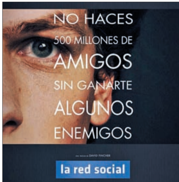
Imagen de la película "La Red Social", sobre el creador de Facebook

El diseño del mapa se basa en el número de usuarios de cada red social, de esta manera y mediante las burbujas y sus tamaños, escenificamos el valor de cada uno. De esta manera podemos observar como Facebook alcanza los 550 millones de usuarios mientras otras apenas alcanzan los 7.000 usuarios. La clasificación también se ha realizado por tipos, de manera que podemos evaluarlas por sus diferentes usos, tales como: vídeos, negocios, citas, generales u otras especializadas como pueden ser de motor, medicina, cocina, televisión, medio ambiente, literatura, etcétera.