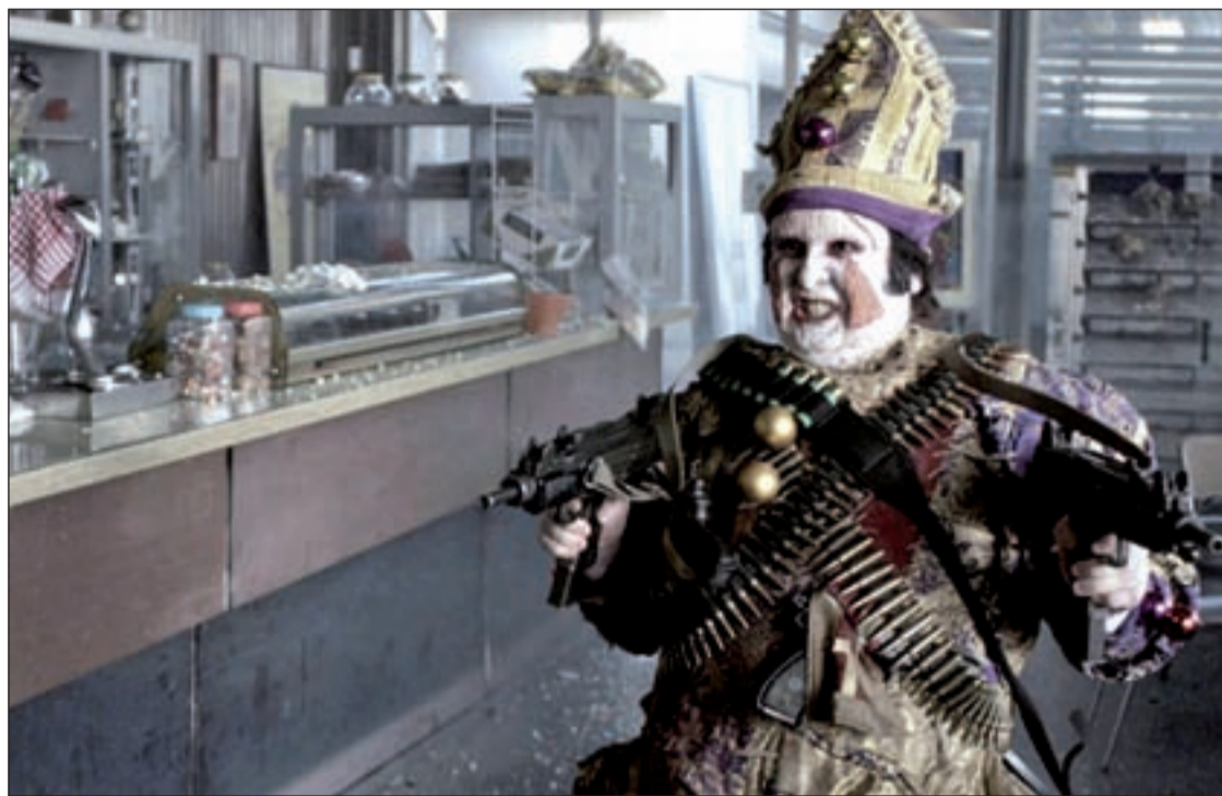
Una escena de la película, que se estrena este viernes 17 de diciembre