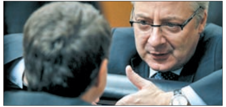
José Blanco, ministro de Fomento, tras anunciar la medida

En paralelo, el Gobierno ha decidido mantener el Estado de alarma hasta el 15 de enero porque, según ha explicado Alfredo Pérez Rubalcaba, es "necesario" para garantizar que se opere con normalidad en los aeropuertos.