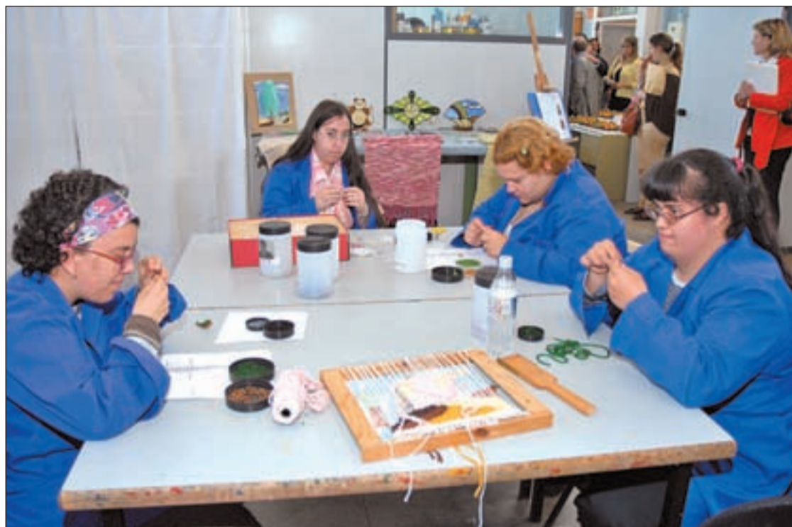
Un grupo de mujeres se forma para acceder a un mundo laboral que les da la espalda