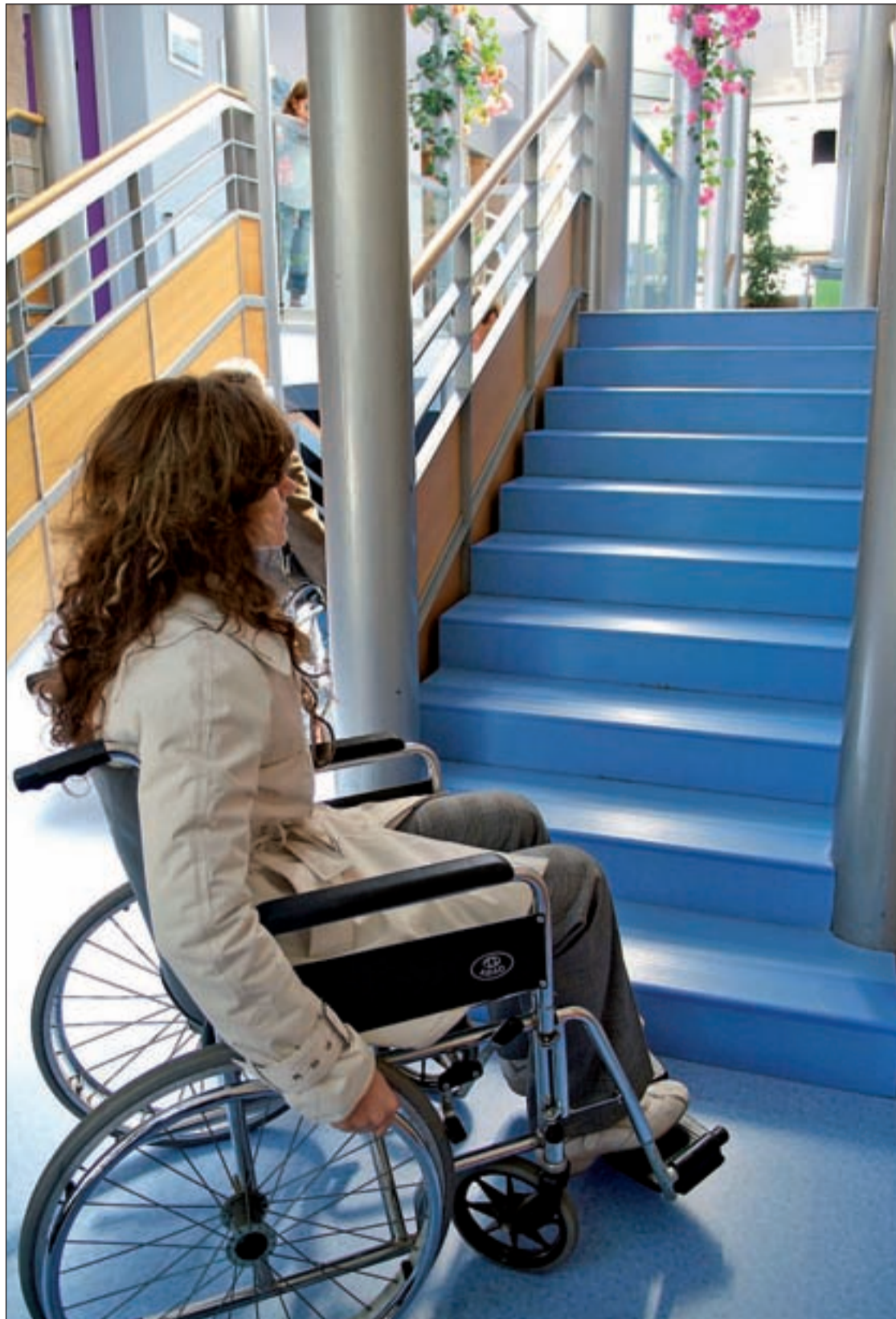
Muchas instituciones públicas aún no son accesibles ni han derribado sus barreras físicas

Por una lado, la recesión económica ha recortado el presupuesto de los Derechos Humanos, impidiendo un necesario sprint social. Un estancamiento que subraya CERMI al tiempo que reclama "como fin último de cualquier política pública" el respecto a los Derechos Humanos "sin que la circunstancia de tener una discapacidad justifique un trato menos favorable". Una meta que exige una parada previa en la transformación del "sistema asistencialista" de España por un modelo que garantice la autonomía e independencia de este colectivo. Y para ello, la Administración debe asumir el compromiso de perseguir y