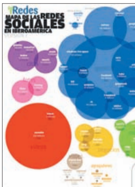
Mapa de la Redes Sociales en Iberoamérica

La profesionalización de éstas ha llegado con la integración entre los mismos profesionales, donde las instituciones y las empresas las utilizan como medio activo. Facebook, Tuenti, Twitter o YouTube se han convertido en muy poco tiempo en algo más que un divertimento para unos pocos. Desde el punto de vista