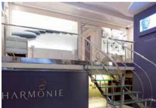
Entrada de la clínica Harmonie en Valladolid.

Un equipo médico de Clínica HARMONIE está formado por Cirujanos, miembros titulados de la SECPRE "Sociedad Española de Cirugía Plástica y Reparadora. Es