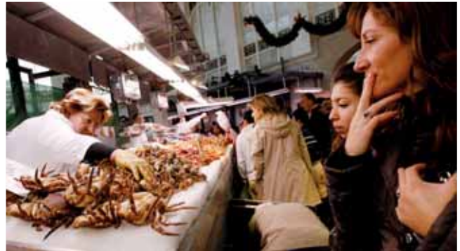
El marisco es uno de los alimentos que más se compra durante la época navideña.

La crisis económica ha provocado que en los últimos tres años haya descendido el gasto de los consumidores