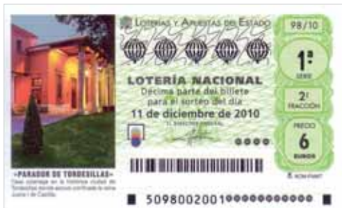
Billete de lotería con el Parador de Tordesillas.

El que será premiado el próximo sábado 11 de diciembre llevará impresa una vista exterior del esta-