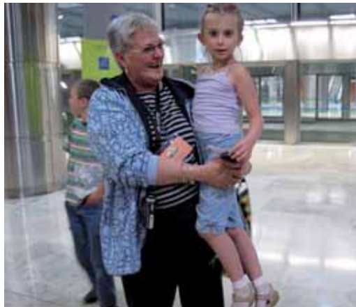
Cid muestra su alegría al recoger en el aeropuerto a una niña ucraniana.

Los niños son tan cariñosos que casi todas las familias están dispuestas a repetir el año