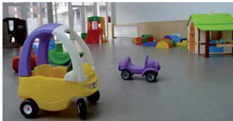
Vestibulo principal de la nueva escuela infantil 'Campanilla'.

El coste de la escuela ha sido de 1.536.556 euros, entre construcción, equipamiento, seguridad y ajardinamiento del recinto. Las obras han sido ejecutadas por la empresa Sacyr, a partir de un proyecto de los arquitectos Rosario Ruiz y Jesús Asensio, que suma una superficie cons-