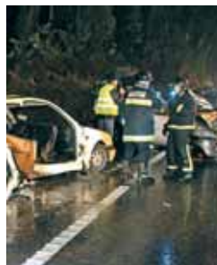
Un accidente este puente

han sido las principales causas de los accidentes, que el domingo tuvieron su jornada más negra. Hasta el 8 de Diciembre, la DGT ha computado un total de 1.633 muertos, 156 menos que hasta la misma fecha del año pasado, lo que representa un descenso del 8,8 por ciento.