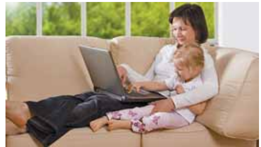
Una mujer cuidando de su hija

Comparando la situación de la mujer en los 27, el porcentaje de mujeres inactivas por razones familiares oscila desde el 1% en Dinamarca hasta el 40% en Malta. Por otra parte, el 60% de las europeas jóvenes de entre 15 y 24 años y las de entre