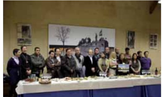
Foto de familia de los participantes en las Jornadas

Menús y tapas a base de pichón podrán degustarse en 11 restaurantes de la zona de Medina de Rioseco: la Rúa, Santamaría, Castilla, Vittoria Colonna, Pasos, todos de Medina de Rioseco; Fátima Posada La Casona de Montalegre; La Posada del Canal de Villanueva de San Mancio; La Huerta de Mantilla de Bolaños de Campos; El Atrio de Villafrechós; El