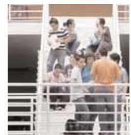
Estudiantes en el Aulario.

como el 5 de febrero desde las 9.00 hasta las 21.00 horas. Con este mismo horario, los universitarios tambi n podr n acudir a estas salas los d as 14, 15, 21, 22, 28 y 29 de mayo, 4, 5, 11, 12, 18, 19, 25 y 26 de junio, as  como los d as 2, 3, 9, 10, 16, 17 y 23 de julio del 2011.