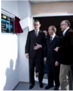
Las autoridades durante el acto.

La localidad de Mojados cuenta con un Centro multidisciplinar de Ocio Juvenil de Mojados, realizado con una inversión de 680.000 euros, cofinanciado por el Gobierno de España, el Ayuntamiento, la Junta de Castilla y León y la Diputación de Valladolid. El Centro se encuentra ubicado en el Palacio del Obispo de Segovia y consta de dos plantas en la que se ubicarán, entre otras, una zona de navegación libre, una ocioteca y una sala destinada a Sala de Exposiciones y Talleres.