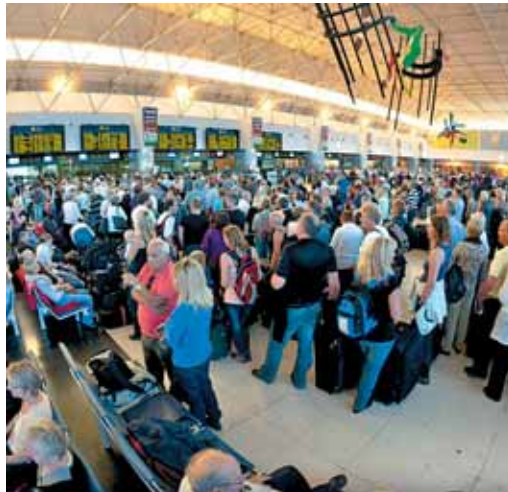
Un grupo de afectados tras el cierre del tráfico aéreo en aeropuertos

Pero no es la única demanda interpuesta contra este colectivo. La OCU y al menos 5.000 usuarios han denunciado a los controladores en los Juzgados