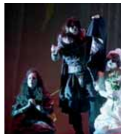
Imagen de una de las obras.

El Jurado nombrado para fallar los Premios de la XXVII Muestra de Teatro 'Provincia de Valladolid' 2010, organizada por la Diputación, ha acordado por unanimidad seleccionar los montajes escénicos presentados por los grupos 'Las Bernardas' (Santibañez), 'El Llano' (Aldeamayor), 'Marvy Teatro' (Laguna), 'El Racimo' (Serrada) y 'El Delirio' (Quintanilla de Onésimo), como premiados en la XXVII Muestra de Teatro 'Provincia de Valladolid' por la representación de sus montajes 'Atra bilis', 'De aquí a Broadway', 'Más o menos amigas', 'Carne cruda' y 'Proyecto Lisistrata', de Laguna de Duero, y 'El Capricho', de Valduquillo.