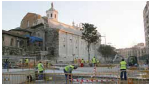
Obras en el aparcamiento de La Catedral en una foto de archivo.

En el caso de la ORA, tres calles del Cuatro de Marzo (Serrano, Chueca y Esteban Daza) tendrán aparcamiento limitado por una zona verde exclusiva para residentes a partir de enero, una vez se señalice la calzada y los vecinos que tengan derecho dispongan de la tarjeta correspondiente. Por su parte, las vías aledañas estarán limitadas por zona azul, mientras que las zonas más distantes tendrán carácter disuasorio y disfrutarán de