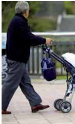
Un abuelo guía un carro.

De hecho, según revelan los datos, el 70% de los abuelos cuida habitualmente de sus nietos. Aunque este tipo de tareas y cometido suelen ofrecer un resultado satisfactorio por ambas partes, curiosamente esta obligación está causando un aumento de los casos del denominado «síndrome del abuelo esclavo», resaltan desde el Teléfono de la Esperanza de Valladolid en base a diversos estudios.