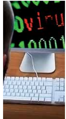
Atención con las estafas.

Los cibercriminales también aprovechan la búsqueda de regalos y viajes. Mediante la creación de páginas web falsas en las que se pide un adelanto del precio con una tarjeta de crédito o una