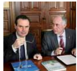
Imagen de la firma del contrato.

De esta forma, la empresa concesionaria deberá de realizar un mantenimiento y control de la red y de la estación de tratamiento de agua potable así como la conservación de las instalaciones y de la red de alcantarillado y el mantenimiento de la Estación Depuradora de Aguas Residuales. Como novedad, se incluye el mantenimiento de las fuentes ornamentales, además de la gestión y limpieza del tan-