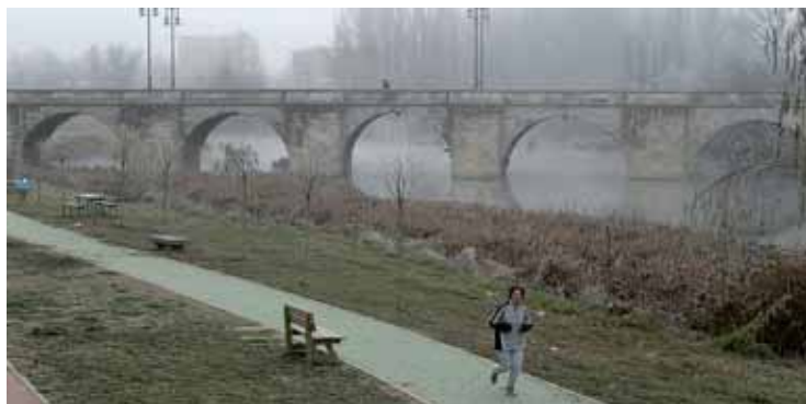
Las obras están financiadas con cargo al Fondo Estatal para el Empleo y la Sostenibilidad Local.

"Se crea un nuevo espacio verde para la ciudad y para el barrio del Carmen, en consonancia con el crecimiento que está