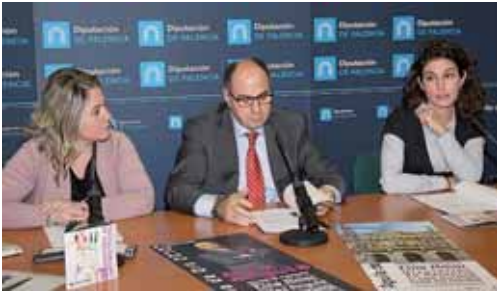
El Águila de Oro Especial será entregado a la Diputación de Palencia.

El certamen, que proyectará un total de 101 trabajos de 33 países diferentes, se celebrará entre el 4 y el 7 de diciembre