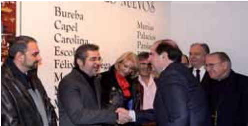
El presidente de la Junta saludó a la veintena de pintores palentinos.