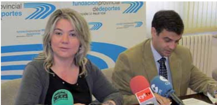
Un momento de la presentación del programa de la Fundación Provincial de Deportes.

Los esquiadores interesados en participar en 'Convivencias en la Nieve' podrán inscribirse hasta el 13 de diciembre