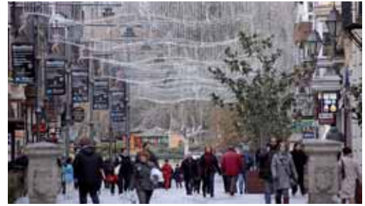
La iluminación navideña se encenderá el viernes a partir de las 18.00 horas.

Asimismo, habrá 50 arcos de hilo luminoso de bajo consumo distribuidos por todos los barrios de la ciudad y por la pedanía de Paredes de Monte. También, se han colocado arcos próximos a las sedes de entidades o Cofradías que organizan exposiciones de belenes o nacimientos. Precisamente, estos 50 arcos son nuevos y susti-