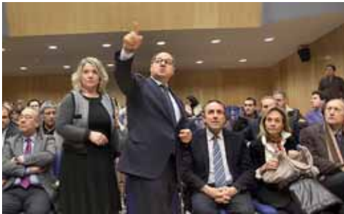
El nuevo edificio cuenta con una sala de proyecciones con 312 butacas.

En sus instalaciones se instalarán además oficinas de servicio al ciudadano sobre las restos de la antigua muralla de Aguilar de Campoo, que la Diputación de Palencia ha querido dejar visible mediante la instalación de unas vidrieras sobre el suelo.