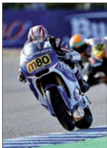
Jerez vibró con las carreras