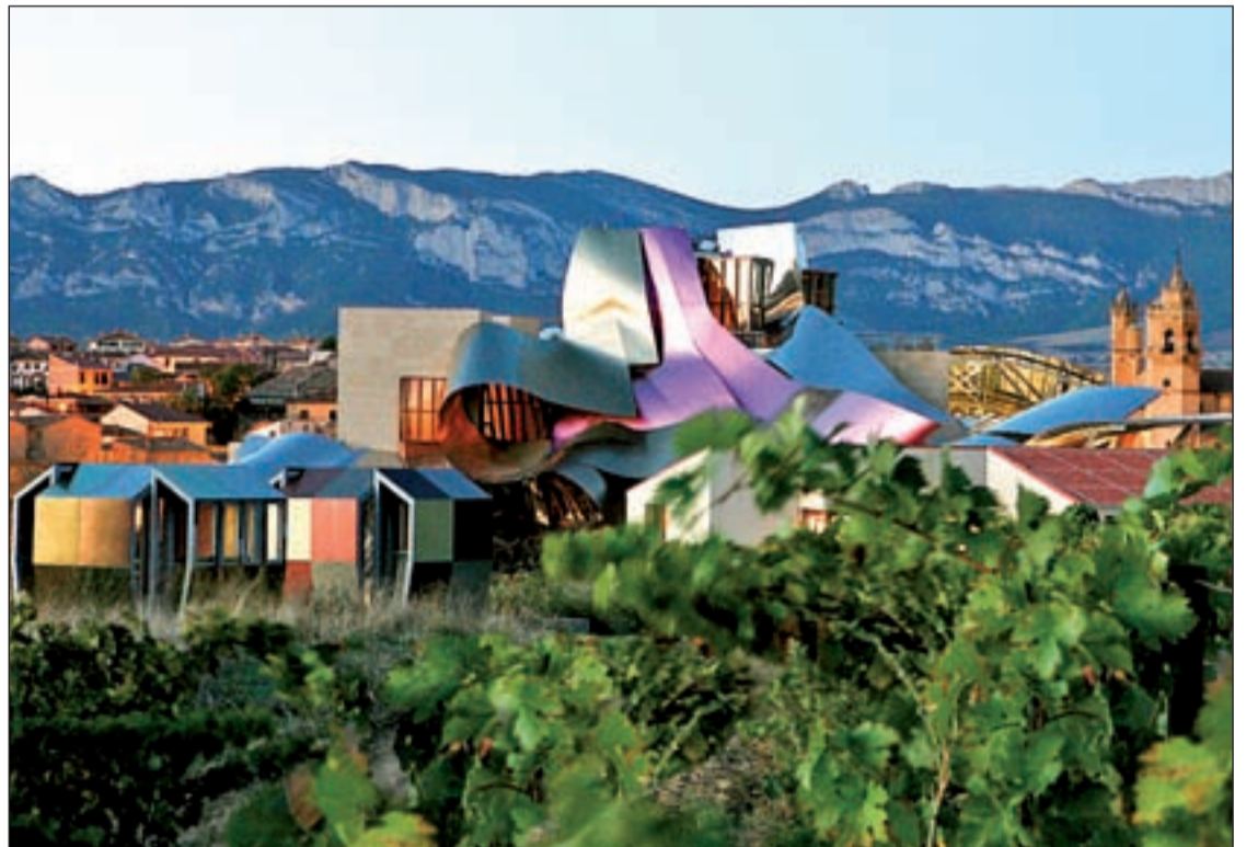
Tradición y vanguardia se combinan a la perfección en la Ciudad del Vino