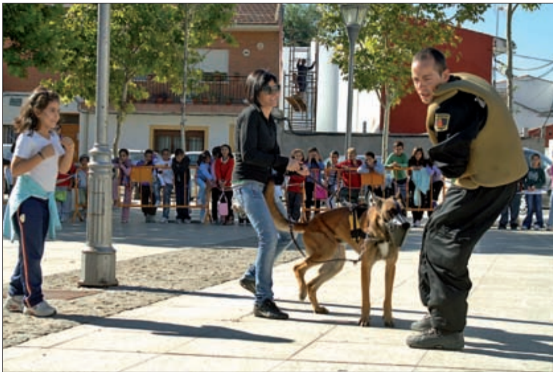
Los simulacros son fundamentales en el adiestramiento de estos animales

"Sí porque somos mayoría", "Sí porque estamos hartas de tanta cobardía escudándose en la fuerza bruta", "Sí porque nadie debe tener miedo por ser mujer". Éstos son algunos de los argumentos ciudadanos para combatir la Violencia de Género que aparecen en la web que el Instituto de la Mujer ha puesto en marcha. Pero hay muchos más. Tantos que el machismo queda acorralado en este muro virtual que da motivos para luchar por la Igualdad.