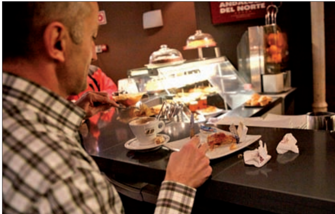
Un trabajador desayuna en una cafetería del centro de Madrid

Judith no es la única que ha recortado en su gasto de alimentación. Un estudio de la FUCI, la Federación de Usuarios-Consumidores Independientes, constata que ha crecido el número de trabajadores que se lleva la comida a su puesto laboral hasta alcanzar el 28 por ciento. Y es que seis de cada diez trabajadores en España no tiene tiempo suficiente para ir a casa a comer y regresar por la tarde al trabajo. La cifra varía mucho en función de la ciudad de la que hablemos, tanto en el número de personas 'obligadas' a comer fuera, como en el coste derivado de las comidas. Así pues, en Madrid y Barce-