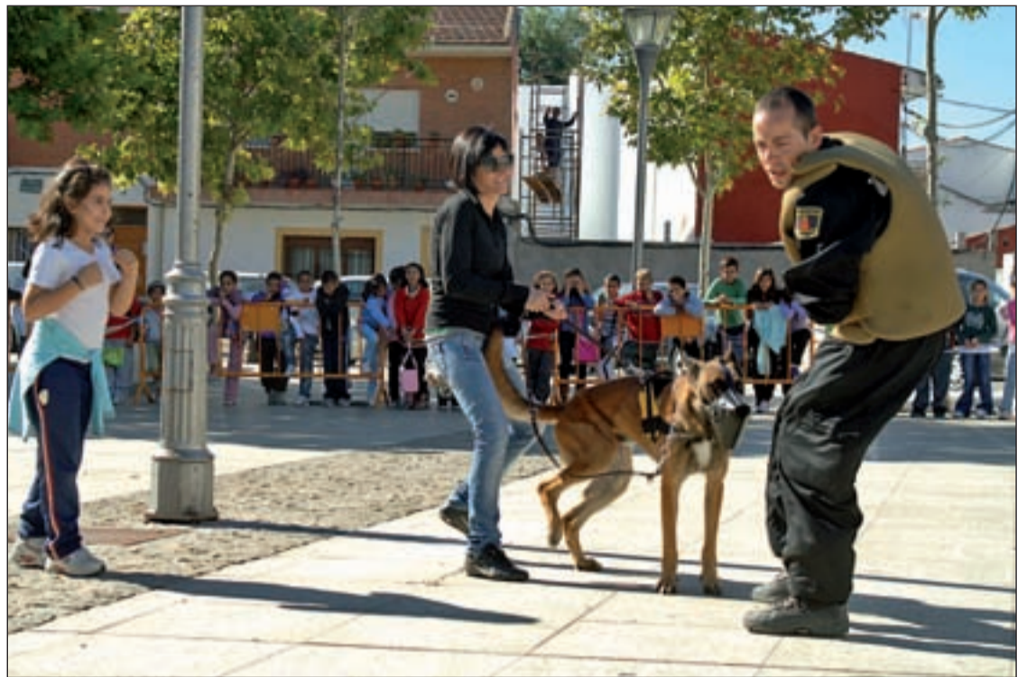
Los simulacros son fundamentales en el adiestramiento de estos animales

"Sí porque somos mayoría", "Sí porque estamos hartas de tanta cobardía escudándose en la fuerza bruta", "Sí porque nadie debe tener miedo por ser mujer". Éstos son algunos de los argumentos ciudadanos para combatir la Violencia de Género que aparecen en la web que el Instituto de la Mujer ha puesto en marcha. Pero hay muchos más. Tantos que el machismo queda acorralado en este muro virtual que da motivos para luchar por la Igualdad.