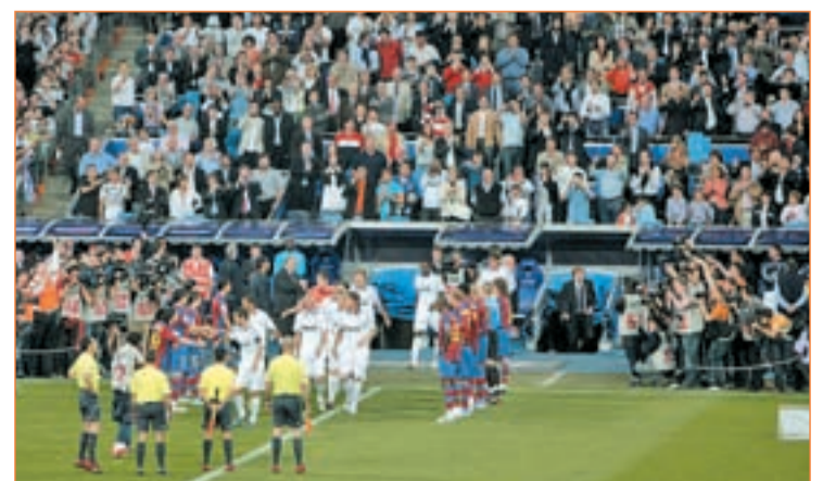
Imagen del partido disputado en el Bernabéu en la campaña 07-08

en el Camp Nou en un partido correspondiente a la séptima jornada liguera programada entre semana. En aquella ocasión ambos equipos acabaron empatando a dos goles gracias a sendos tantos de Raúl González y de Figo y Rivaldo por parte local. Aquella temporada se dio la circunstancia de que el campeón acabó siendo el Deportivo.