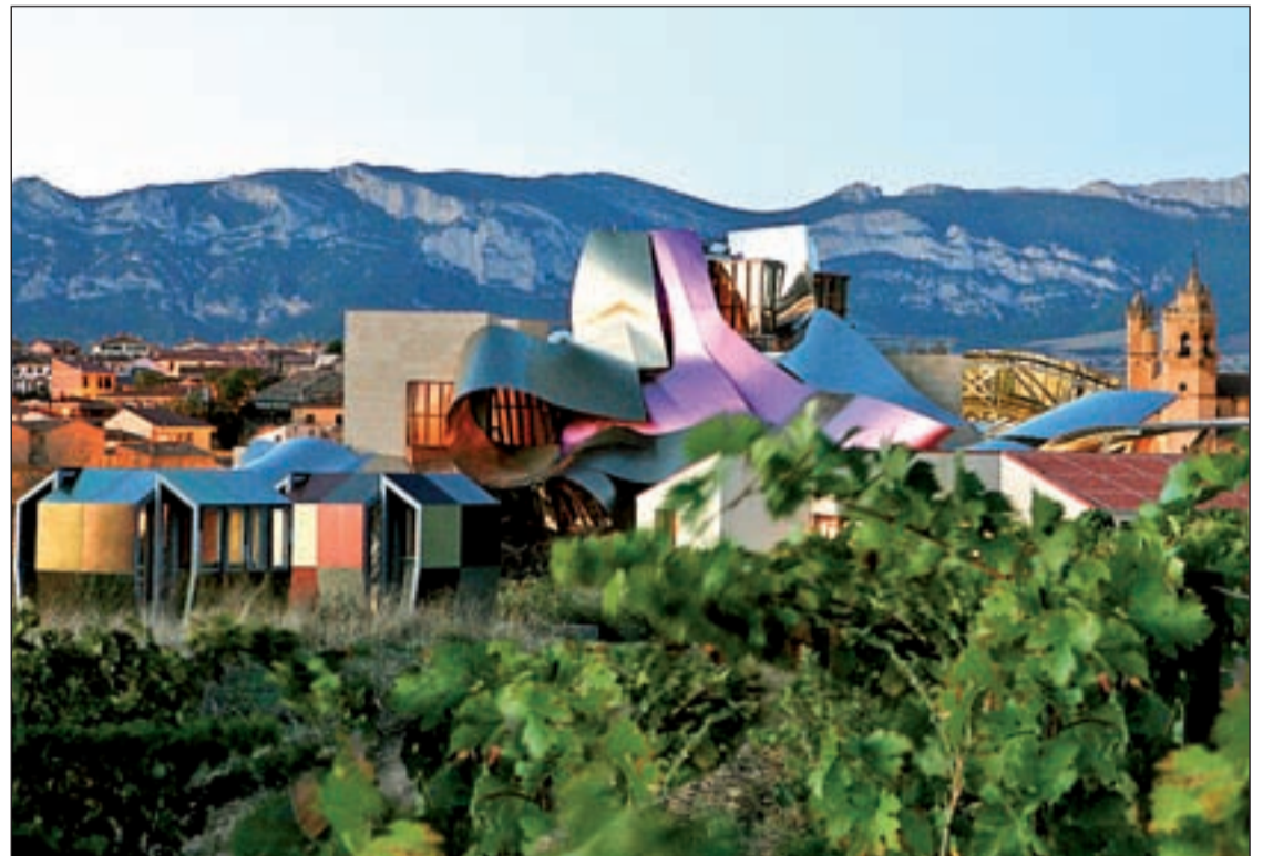
Tradición y vanguardia se combinan a la perfección en la Ciudad del Vino