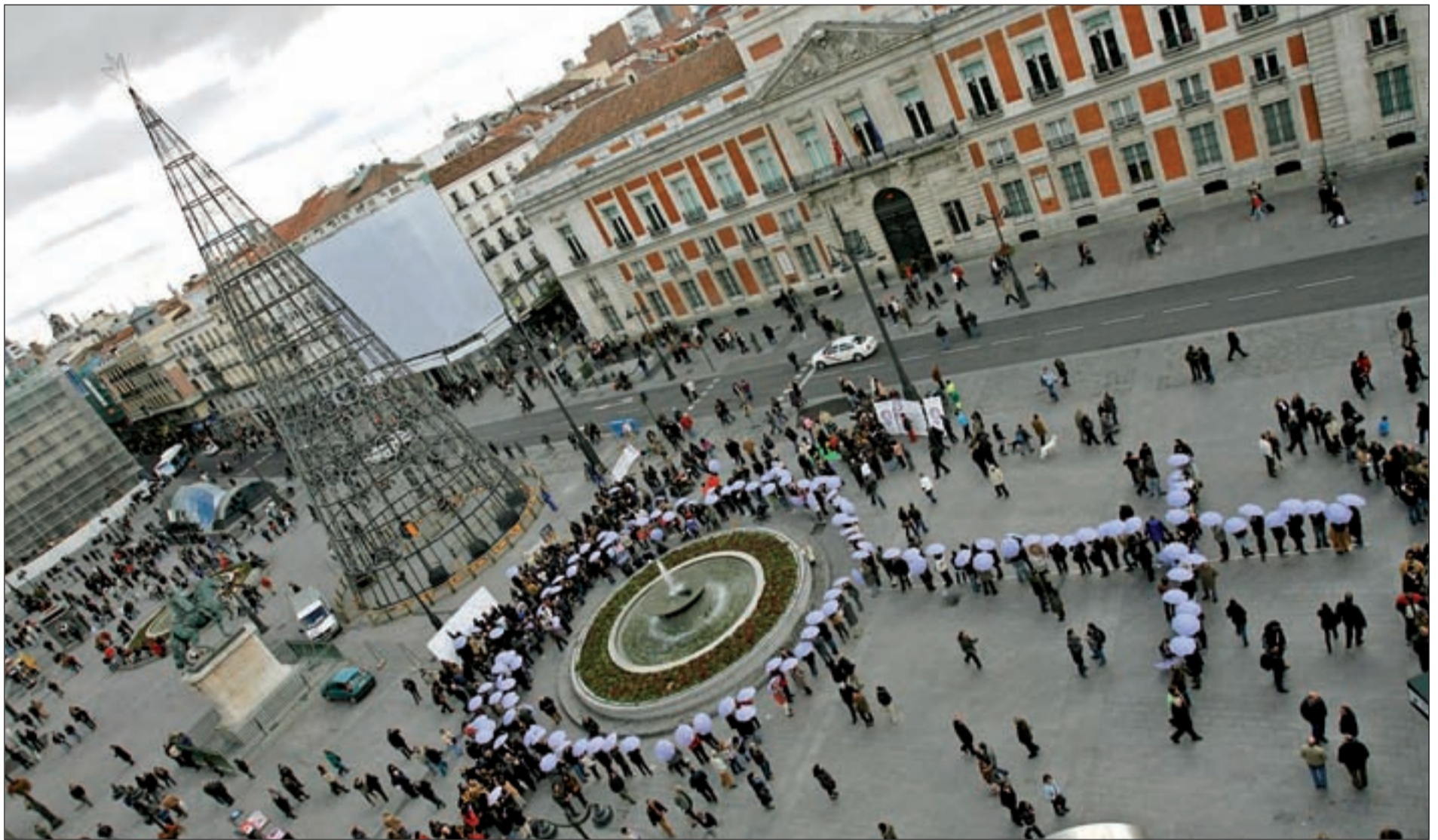
Paraguas morados en la madrileña Plaza del Sol para mostrar el rechazo social y ciudadano a la Violencia de Género

PASOS HACIA LA IGUALDAD Las calles de las principales ciudades españolas han sido una caja de resonancia del sentir y la lucha de muchas mujeres y hombres que han plantado cara a la Violencia de Género con motivo del Día Internacional de esta causa, celebrado el 25 de noviembre