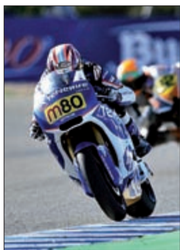
Jerez vibró con las carreras