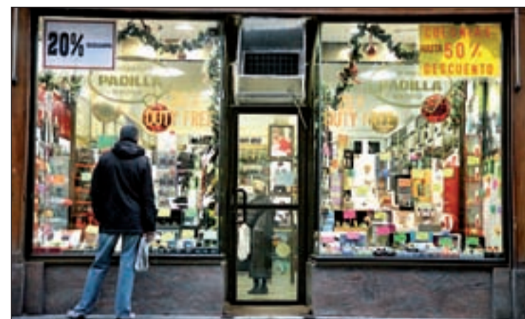
Un hombre observa un escaparate con decoración navideña M. VADILLO

contratábamos a cinco personas de apoyo, este año solo incorporaremos a dos", explica María, encargada de una perfumería donde también la calidad del envoltorio y los lazos se ha tenido que mermar. La alimentación, con la compra de productos específicos para las cenas y comidas familiares de Nochebuena o Año Nuevo son otro de las grandes partidas del gasto. En total supondrán un desembolso de media de 200 euros. Por comunidades, Madrid y Valencia encabezan las regiones cuyos ciudadanos más gasto realicen hasta llegar a los 730 euros. En el