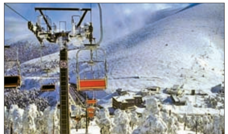
Estación de esquí de Navacerrada, la más cercana a la capital

Todas las estaciones integradas en la asociación Atudem han reforzado su oferta para mejorar la calidad de los servicios y seguridad de las pistas y más del 40% de las Estaciones asociadas (Manzaneda, San Isidro, Astún, Cerler, Javalambre, Valdelinares, Baqueira/Beret, La Molina, Massella, Navacerrada, Sierra de Bejar-La Covatilla, Valdesquí y Sierra Nevada) abrirán nuevas pistas e incrementarán su superfi-