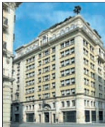
Fachada del hotel

mundo. De esa época, el actual hotel ha mantenido la fachada, distribución y el imponente hall principal, así como diversos elementos arquitectónicos y esculturales, pero ha sido totalmente remodelado para presentar un marco de lujo y relax difícilmente encontrable de otra manera en pleno centro de Barcelona.