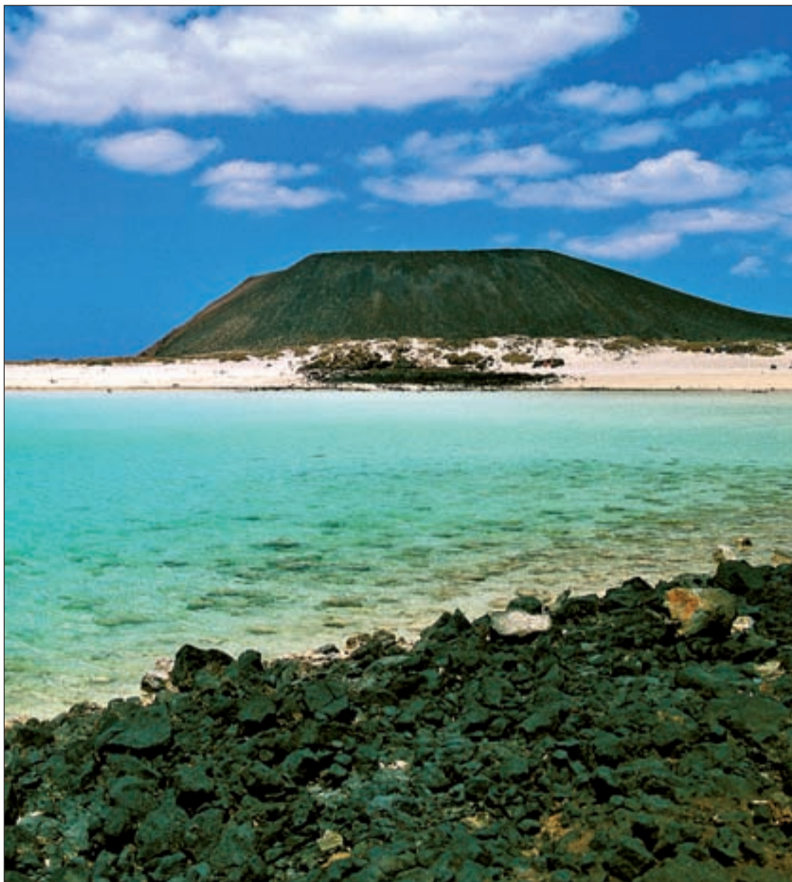
La Isla de Fuerteventura es el destino perfecto para romper con la rutina

El puente de la Constitución es uno de los más largos del año y hay que aprovecharlo • iGente sugiere algunos destinos para estas fechas