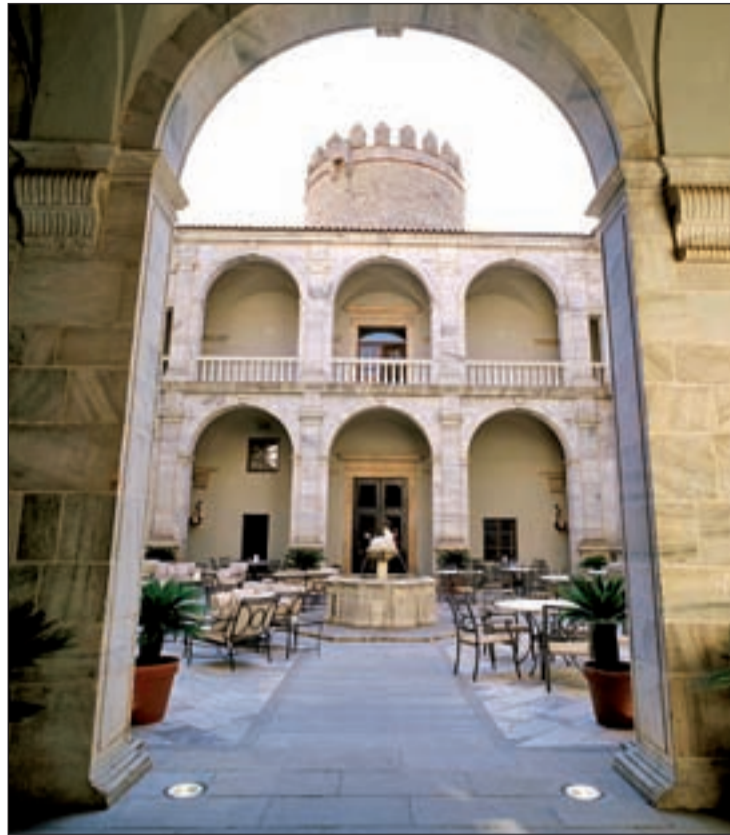
Parador de Zafra (Badajoz)

Los nueve Paradores de Turismo que se ubican en la Ruta Vía de la Plata ofrecen hasta el 12 de diciembre las delicias culinarias con más tradición de cada zona a precios que oscilan entre los 18 y los 28 euros. La Ruta Vía de la Plata es uno de los itinerarios más conocidos y llamativos de nuestro país por su historia, belleza natural y riqueza monumental. Además de conocer a fondo todos sus rincones por