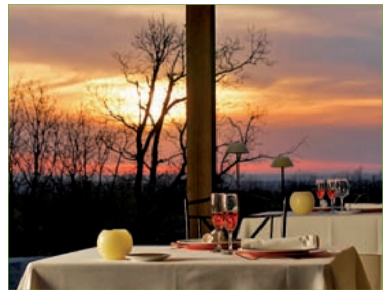
ATARDECER EN SEGOVIA. La Finca Casa Duque está situada en un enclave idóneo para conocer Segovia y sus alrededores. Decorada por Becara con un gusto exquisito cuenta con 12 habitaciones y está solo a cinco minutos del centro histórico de la ciudad.

Para muchos es la ciudad más romántica del mundo. Para