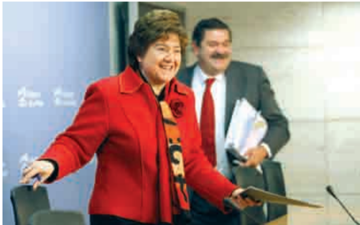
Aránzazu Vallejo, consejera de Turismo, Medio Ambiente y Política Territorial.

Las obras durarán más de tres años y supondrán la repoblación forestal de 195,4 hectáreas de superficie de montes de utilidad pública afectados en los términos municipales de Ezcaray, Ojacastro y Valgañón.