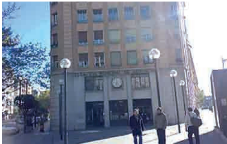
Estación de autobuses de Logroño.

La primera fase de cimentación estará terminada en dos meses aproximadamente, y, el proyecto definitivo de la estación, redactado por el arquitecto Iñaki Ábalos, verá la luz el primer trimestre de 2011. Por todo esto, Santos afirmó que el proyecto de soterramiento "está en pleno proceso de desarrollo y es una reali-