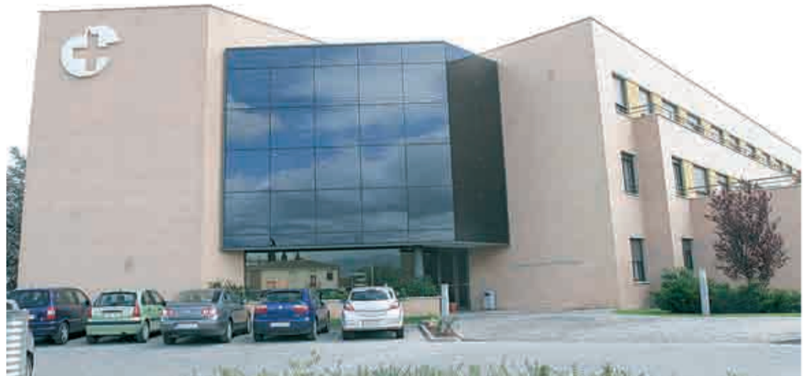
Fachada de la clínica "Los Manzanos"

Viamed posee una red de profesionales altamente cualificados y con experiencia contrastada en la gestión y asesoramiento empresarial dentro del sector sanitario.