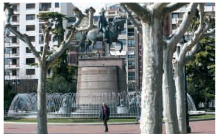
Paseo del Espolón de Logroño.