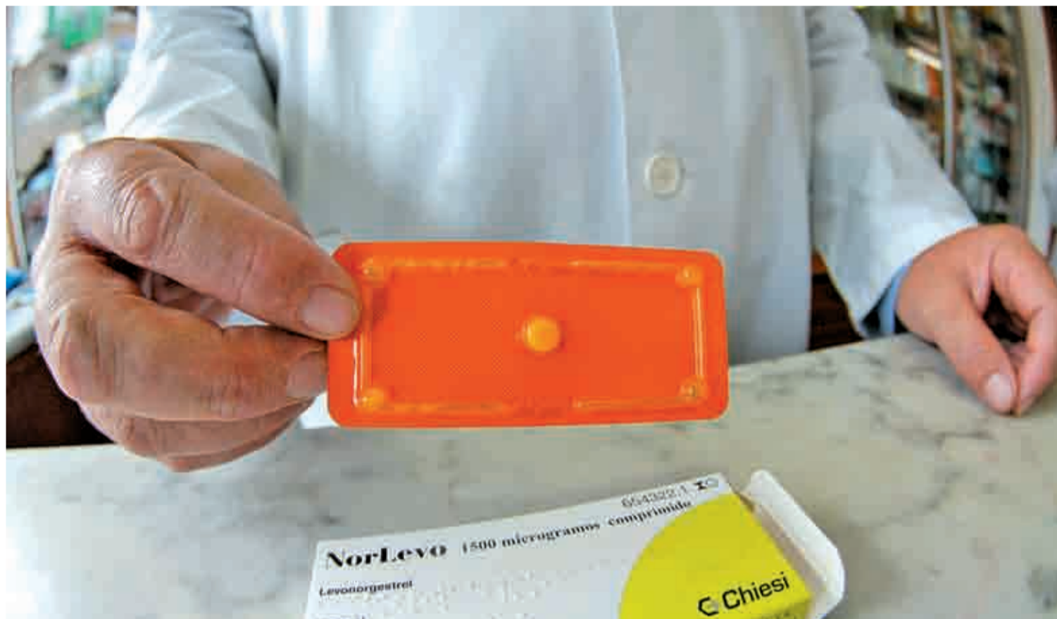
La Agencia Europea del Medicamento descarta que la píldora 'del día después' sea abortiva.

Lejos del 'boom' que supuso en septiembre de 2009 la dispensación de este medicamento sin necesidad de receta médica, un informe revela que su venta ha aumentado sólo en un 20%