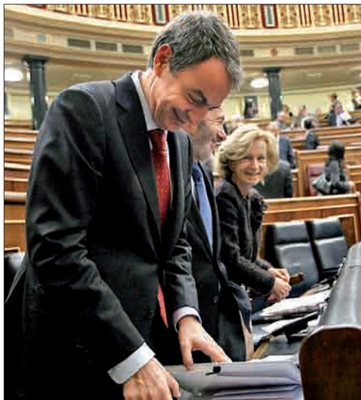
Zapatero, Pérez Rubalcaba y Elena Salgado en el Congreso

A este respecto, el Ecofín, es decir, el consejo de ministros de Economía de los 27 estados de la Unión, ha destacado la "solidez actual" en términos de sostenibilidad del modelo español de pensiones, pero alerta de que "el envejecimiento demográfico y las presiones añadidas de la crisis" repercutirán en su solvencia, y fijan 2030 co-