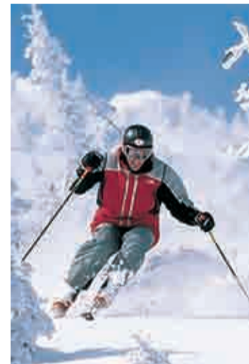
Esquiador en Valdezcaray.

Deportes Ferrer vuelve a sorprendernos con su gran fiesta de la nieve, que tendrá lugar el viernes 19 a las 21.30 horas en la sala Norma, donde, todo aquel que acuda, podrá ganar varios regalos, viajes y muchas otras sorpresas. Solo tienes que recoger tu invitación en Deportes Ferrer.