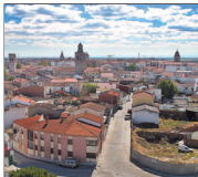
Vista general de Arévalo.

Con el Plan provincial sobre Drogas de la Diputación se pretende potenciar en los chicos la adquisición de hábitos saludables y estilos de vida sanos, así como fomentar en los escolares la conciencia sobre su salud para que vayan tomando decisio-