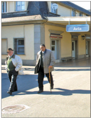
Estación de tren de Ávila.

Herrera señaló que en el resto de conexiones "buena voluntad pero incertidumbre" pues no ha concretado ni las conexiones de Ávila, Segovia y Sorja a la Alta Velocidad así como la conexión de Medina del Campo-Salamanca sigue en estudio. Ni fechas de las obras ni sobre la llegada de la alta velocidad a estas cuatro capitales de provincia, apunta.