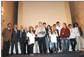
Grupo vencedor de la Olimpiada del Conocimiento del Colegio Diocesano Asociación de Nuestra Señora.