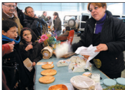
Uno de los puntos del Mercado Agroalimentario, en 2009.

El año pasado, la cita congregó a más de 5.000 personas, y la recaudación superó los 30.000 euros.