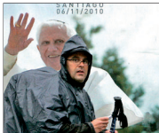
Un peregrino en Santiago cruza delante de un cartel de la visita papal

Ya está todo preparado para recibir a Benedicto XVI. Visita de Estado y visita religiosa que despierta un interés que trasciende a la comunidad católica. Más aún en el Xacobeo, y más aún para consagrar la Sagrada Familia que ideara el genio Antoni Gaudí. En su segunda estancia como santo pontífice en España, Joseph Alois Ratzinger, visitará los días 6 y 7 de noviembre Santiago de Compostela y Barcelona en un viaje de apenas 32 horas que la Conferencia Episcopal Española ha asegurado serán "muy intomas". Benedicto XVI aterrizará en el aeropuerto de Santiago el sábado y desde allí se dirigirá hasta la Plaza del Obradoiro donde cruzará como