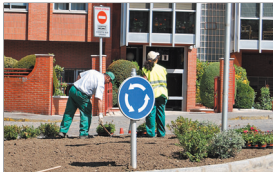
En términos anuales, el número de parados aumentó en la provincia un 12,7 por ciento.

En términos mensuales, el paro aumenta en Burgos (1 por ciento), León (3,83 por ciento), Palencia (0,89 por ciento), Salamanca (1,62%), Segovia (0,70%), Soría (1,92%), Valladolid (1,14%) y Zamora (5,30 por ciento), permaneciendo prácticamente constante en Ávila (-0,01 por ciento).