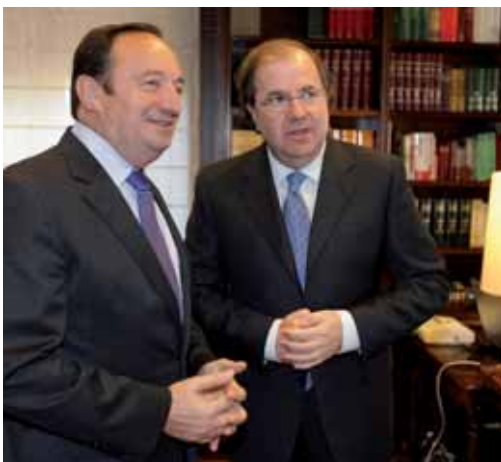
Juan Vicente Herrera y Pedro Sanz al comienzo de la reunión.