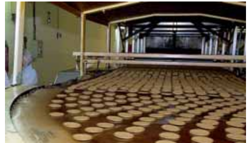
Galardonado por la inserción laboral de personas con discapacidad.