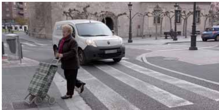
La organización Cocomfe galardonó a Palencia y su Ayuntamiento con el Premio 'Ciudad Accesible'.

Los trabajos han consistido en la eliminación de barreras arquitectónicas, rebaje de bordillos o elevación de pasos de peatones en calles, vías y avenidas de todos los