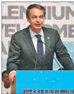
Zapatero en la cumbre del G-20.

Un revulsivo económico que, según el mandatario, el Es-