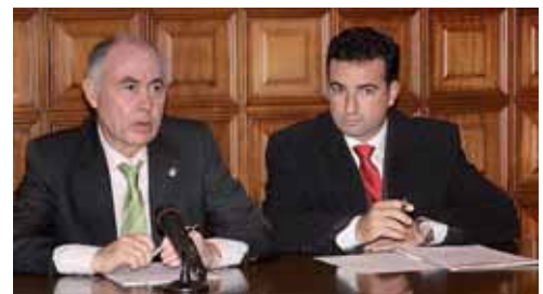
Impulsar la literatura infantil y fomentar la lectura son los objetivos.

La entrega de Premios se celebrará en el Salón de Actos del Ayuntamiento de Palencia, el 21 de febrero de 2011, un día después de que se cumplan 80 años del nacimiento de Casilda Ordóñez. El ganador recibirá un premio en metálico de 600 euros. Además del premio en metálico para el ganador, los tres mejores trabajos a elección del jurado serán publicados en la página web del Ayuntamiento de Palencia y de Cattivos . Por otro lado, no se descarta en el futuro que los trabajos ganadores puedan ser publicados.