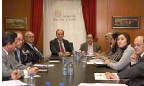
La Delegación Territorial de la Junta fue el escenario de la reunión.