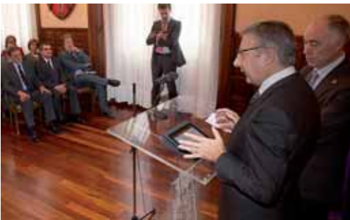
Imagen de archivo de la última visita de Blanco a la capital palentina.

El ministro subrayó que se están desarrollando "todos los trámites administrativos" en alusión a estudios informativos y proyectos, y que en la línea de alta velocidad con Madrid, hasta Palencia, está "todo en obras".