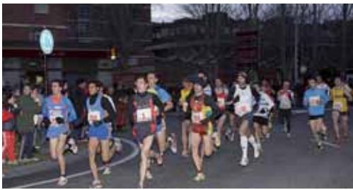
Imagen de archivo de la San Silvestre palentina.

Un reconocimiento por su contribución, fomento y apoyo a este deporte que será entregada en su vigésima gala anual