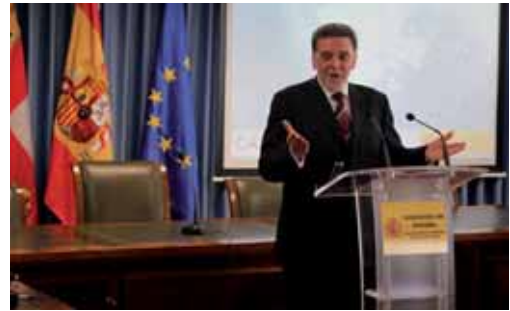
El delegado del Gobierno, Miguel Alejo, durante la rueda de prensa.

Según los datos aportados, los agentes de la Guardia Civil han recorrido, en labores de vigilancia y control, 1.213.531 kilómetros correspondientes a las rutas del Ca-