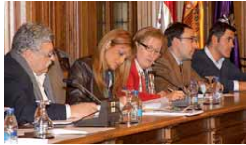
PP e IU recordaron al PSOE la dura situación económica.

Por su parte, la portavoz de IU, Rocío Blanco, mostró también su malestar por que no se congelará el IBI. "No nos parece justo hacer tabla rasa y congelar todos los impuestos, pero, al menos, si el