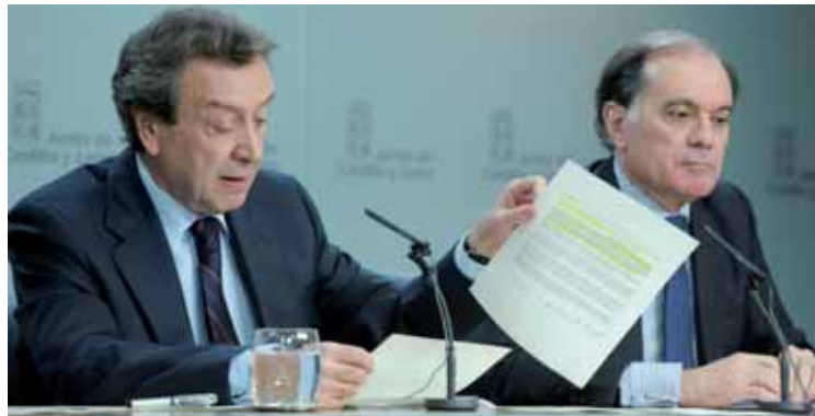
El consejero de la Presidencia y portavoz junto al vicepresidente segundo y consejero de Economía y Empleo.

El texto define la naturaleza de las Cámaras Oficiales de Comercio e Industria como corporaciones de derecho público con personalidad jurídica propia y plena capacidad de obrar para el cumplimiento de sus fines, su ámbito territorial, y la regulación de las funciones propias de las Cámaras distinguiendo entre las de carácter público-administrativo y otras de distinta naturaleza y alcance. También se definen y desarrollan los órganos de gobierno de las Cámaras. Asimismo regula su régimen electoral, económico y presupuestario, la financiación, etc.