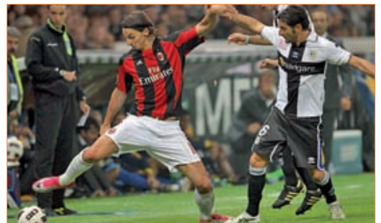
Ibrahimovic, una de las atracciones del partido en el Bernabéu

nada menos que quince Copas de Europa entre ambos. Además, los fichajes realizados el pasado verano por el conjunto rosossoneri también han servido para crear más expectación. Robinho regresará a la que fuera su casa durante tres temporadas, mientras que Zlatan Ibrahimovic volverá a España tras su polémica marcha del Barcelona.