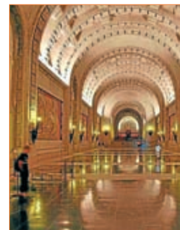
Interior de la Basílica

discurso para hablar de “monumento de reconciliación”, sin haber alcanzado dicho objetivo. De hecho el Senado ha pedido la “democratización” de la basílica, propuesta que recibió la negativa del PP, pese a que un decreto de 1957 la dota con 340.000 euros al año sin la obligación de rendir cuentas al Estado de su inversión.