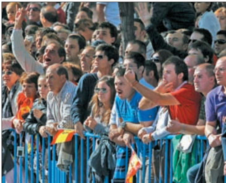
El público del desfile militar del pasado día 12 abuchea al presidente

El Gobierno ha dado un paso más al respecto y ha convocado a todos los grupos parlamentarios para consensuar un protocolo de celebración de la Fiesta Nacional que permita el "respeto" a la bandera de España, "a los caídos y a las Fuerzas Armadas", según ha asegurado la ministra de Defensa Carme Chacón, quien animó a "estos grupos reventadores" a expresar su males-