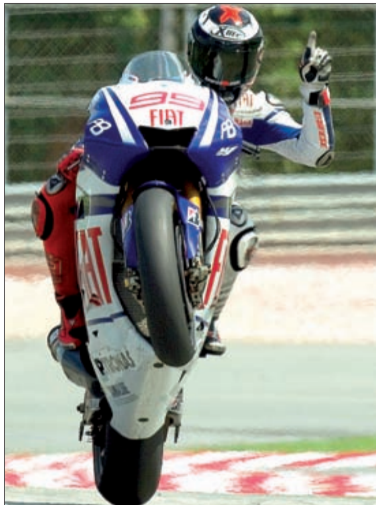
El piloto de Yamaha se aseguró el título de campeón

Pero si hay una carrera en la que la emoción estará presente esa será la de 125 c.c.. Tras su octava victoria de la temporada, Marc Márquez recuperó el liderato pero no consiguió abrir hueco con Pol Espargaró y Nico Terol. Los tres ocuparon el podio en Sepang, una imagen que se ha convertido en una constante en la presente temporada. El reinado de los españoles ha provocado