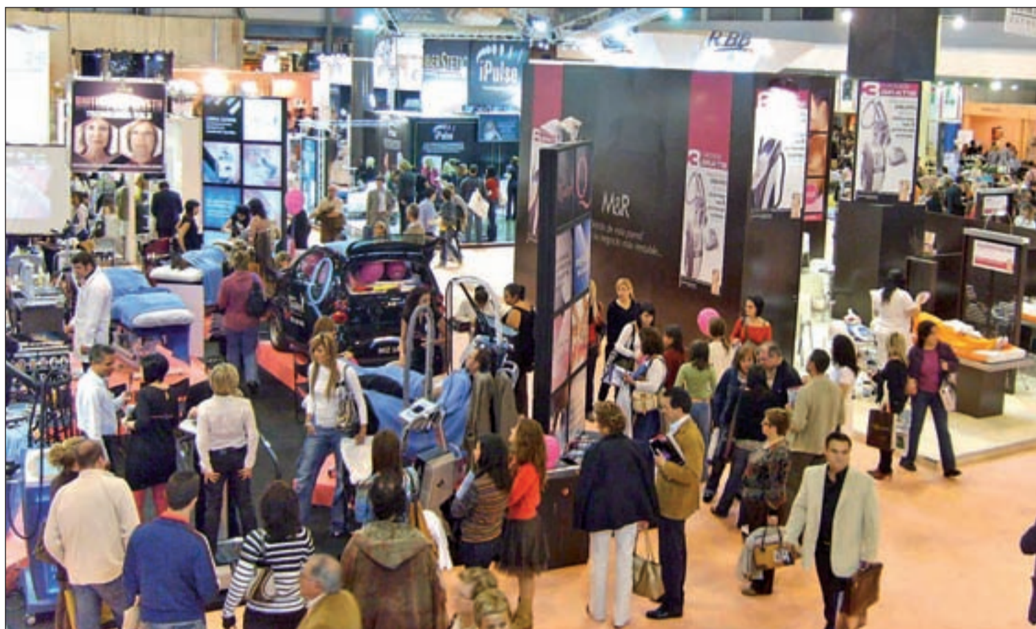
Salón Look Internacional llega a su decimotercera edición en Feria de Madrid