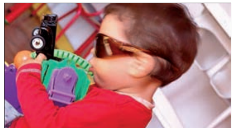
EL TDAH afecta a uno de cada veinte niños en edad escolar

por cada fármaco. “A esto se suma que en la mayoría de los casos se toma más de un fármaco y más de un afectado en la misma familia, ya que el TDAH tiene una alta carga hereditaria”, añade Madrid. “Con el régimen actual, la Seguridad Social paga el 60 por ciento del importe”, añade el presidente.