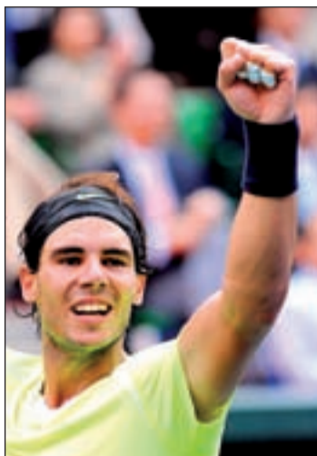
El español sigue en lo más alto

El buen momento del tenis español tiene un fiel reflejo en la lista de la ATP ya que en una semana en la que Fernando Verdasco continuaba con su condición de número nueve del mundo, otro tenista de la 'Armada' se colaba en el top-10. David Ferrer no pudo alzarse con el triunfo en el abierto de Pekín tras caer en la final con Novak Djokovic, pero el