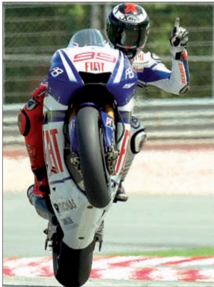
El piloto de Yamaha se aseguró el título de campeón

Pero si hay una carrera en la que la emoción estará presente esa será la de 125 c.c.. Tras su octava victoria de la temporada, Marc Márquez recuperó el liderato pero no consiguió abrir hueco con Pol Espargaró y Nico Terol. Los tres ocuparon el podio en Sepang, una imagen que se ha convertido en una constante en la presente temporada. El reinado de los españoles ha provocado