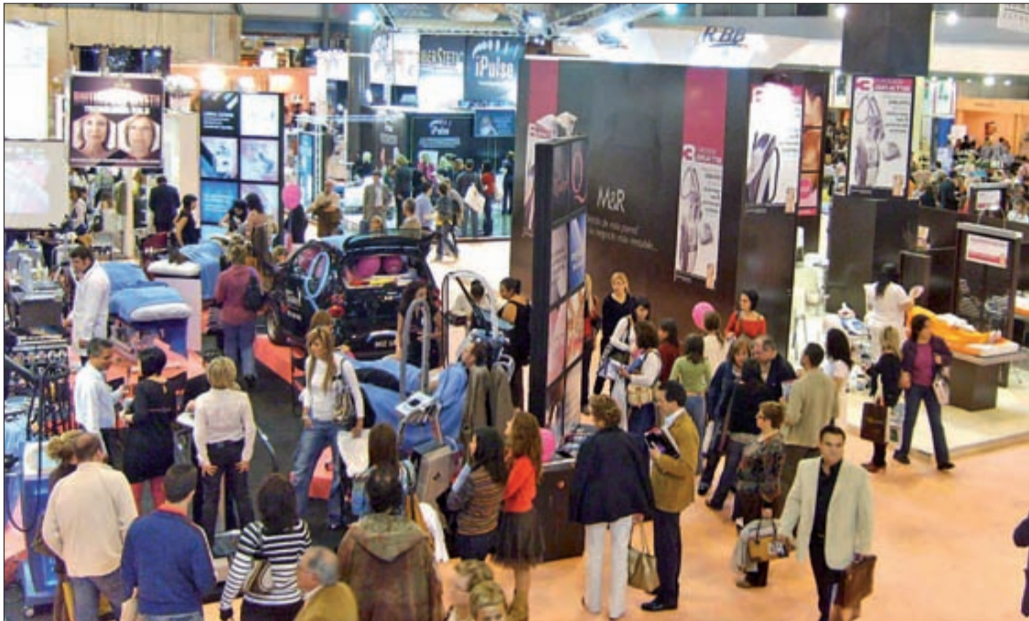
Salón Look Internacional llega a su decimotercera edición en Feria de Madrid