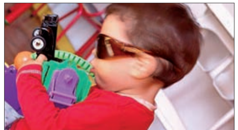
EL TDAH afecta a uno de cada veinte niños en edad escolar

por cada fármaco. “A esto se suma que en la mayoría de los casos se toma más de un fármaco y más de un afectado en la misma familia, ya que el TDAH tiene una alta carga hereditaria”, añade Madrid. “Con el régimen actual, la Seguridad Social paga el 60 por ciento del importe”, añade el presidente.