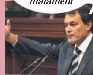
Artur Mas President de CiU

"Montilla i jo, quan estem al Parlament, parlem en català, si no ho recordo malament"