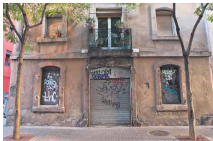
Local en desús del carrer Ginebra, al barri de la Barceloneta.

Ubicar entitats socials que no tenen seu, com ara l'Associació de Veïns, el Club d'Escacs o la