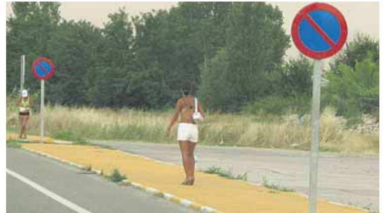
Una prostituta al costat de la C-13, entre Lleida i Vilanova de la Barca.