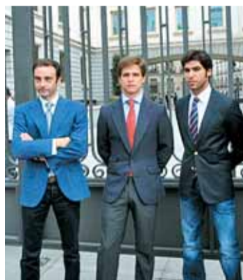
La delegación de toreros

El Pleno del Senado ha rechazado este miércoles con los votos en contra de todos los grupos salvo PP, partido promotor de la iniciativa, y de UPN, pedir al Gobierno que declare la fiesta de los toros como Bien de Interés Cultural y que inicie las gestiones ante la Unesco para incluirla en el listado mundial de Patrimonio Cultural Inmaterial. Los senadores acataron la disciplina de partido. El PSOE, por su parte, recordó que la Ley de Patrimonio establece que el Estado no es