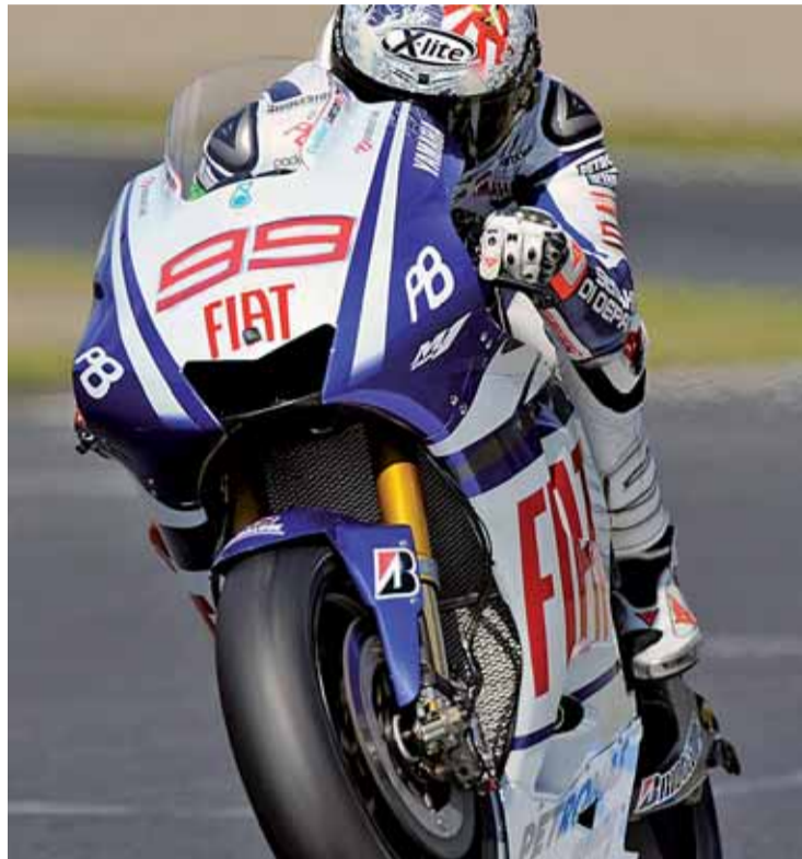
El balear no logró subir al podio en el circuito de Motegi

Mientras Dani Pedrosa se recupera de la operación que sirvió para subsanar su fractura de clavícula, el que será su compañero de equipo la próxima temporada, el australiano Casey Stoner atraviesa un gran momento. El piloto catalán