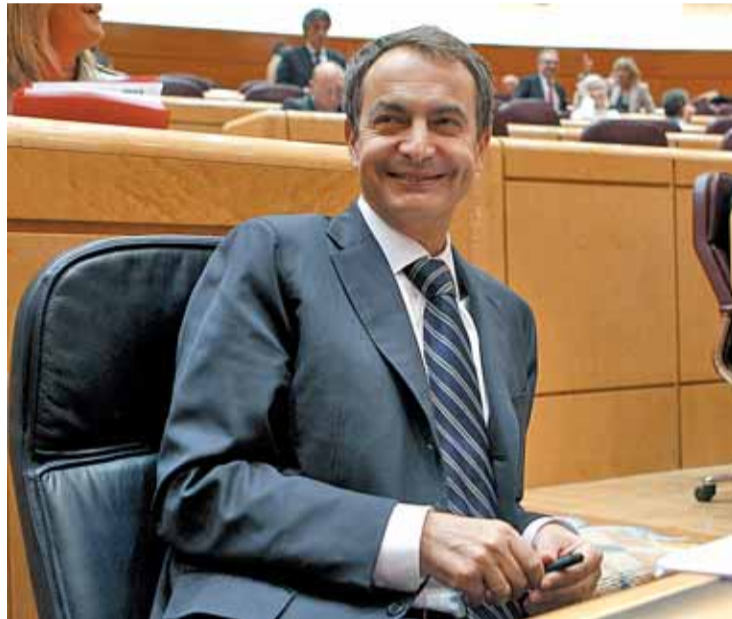
Zapatero en el Senado durante la última sesión de control

Rodríguez Zapatero ha asegurado ser consciente del "desgaste" que arrastra a consecuencia de las reformas económicas impuestas por su Ejecutivo, pero ha insistido