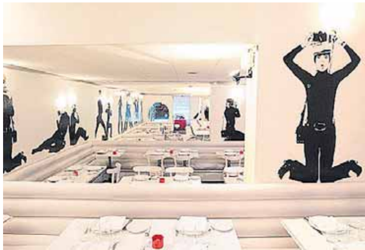
Te traslada a un mundo de cuento, magia y fantasía.

L'ambient pop, fresc i acollidor atreu a un públic sense complexos.