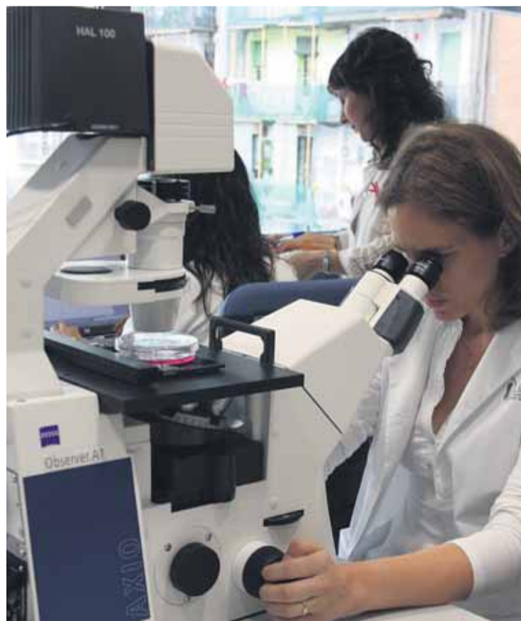
Una trabajadora del nuevo centro de investigación biomédica.

LA MALA SALUD DE LA 'POBREZA' Los investigadores contarán así con equipamiento tecnológico de última generación para reforzar líneas de trabajo como la diabetes, la obesidad, enfermedades del sistema digestivo y del hígado, hematología y oncología, además de enfermedades relacionadas con la pobreza e inmunología.