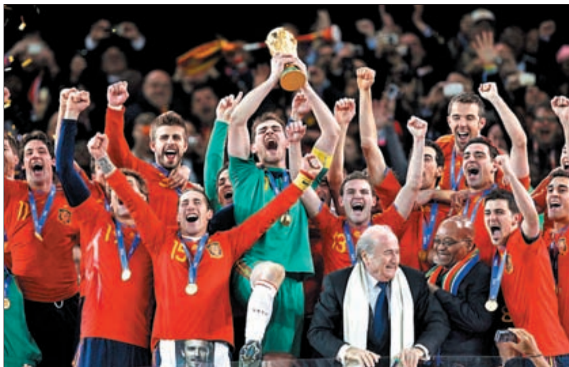
Iker Casillas fue el encargado de levantar la copa de campeones del mundo en Sudáfrica

PREMIO SUCEDE EN EL PALMARÉS A LA ATLETA RUSA YELENA ISINBAYEVA