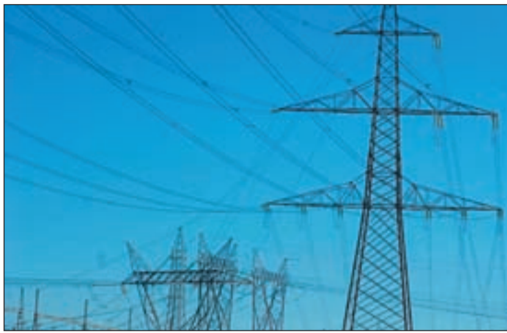
Cableado de tendido eléctrico

EL CONGRESO RECHAZA UNA MOCIÓN SOBRE ELLO