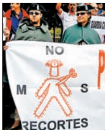
Protesta de Guardias Civiles

concentraron frente al Ministerio del Interior en defensa de sus condiciones laborales. El acto finalizó con la entrega de una carta al ministro para transmitir sus exigencias y las quejas por el comportamiento de Velázquez, contra el que estudian emprender acciones legales.