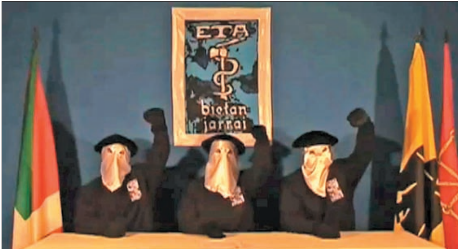
Fotograma del comunicado de la banda terrorista ETA emitido en exclusiva por la televisión inglesa BBC