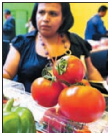
Un mercado de hortalizas

el "fuerte desequilibrio existente" entre los eslabones de la cadena alimentaria". Según Cooperativas Agro-alimentarias, dicho informe subraya además la necesidad de promover el desarrollo de las organizaciones de productores y destaca el papel de las cooperativas.