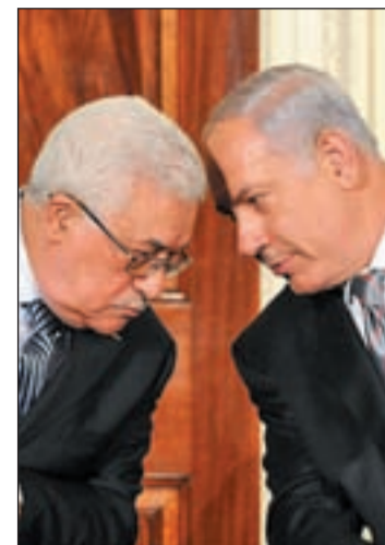
El líder de la APN, Mahmud Abás

Y pese a las declaraciones diplomáticas, el escepticismo, que muchos avalan con precedentes similares como los acuerdos de Oslo en 1978, la Hoja de Ruta o Annapolis en 2007 que sólo quedaron en papel mojado, domina la postura de las partes implicadas y la comunidad internacional. En el orden del día figuran los temas más espinosos del conflicto: las colonias judías en territorio palestino, las fronteras, la seguridad y la titularidad de Jerusalén. Las reacciones en Medio Oriente fluctúan entre el entusiasmo y el rechazo. Avigdor Lieberman, el ultraderechista ministro de Exteriores de Israel, tampoco confía en el éxito de