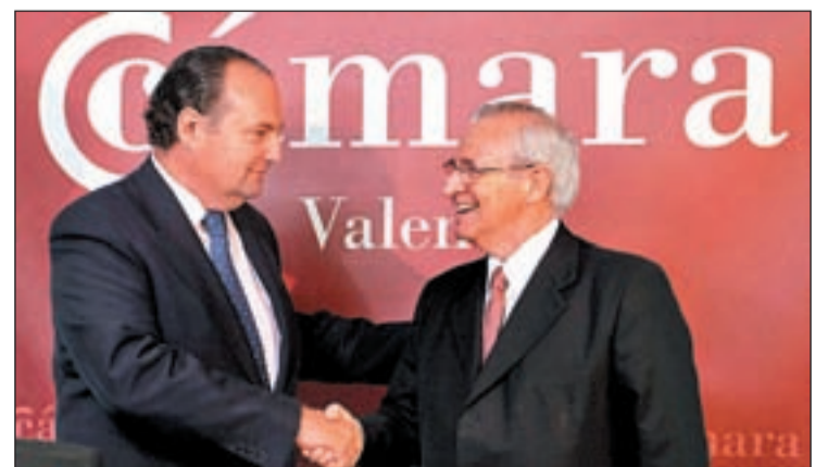
Los presidentes de las Cámaras de Comercio antes de la reunión

gestión del proyecto afirman que la conexión está atascada en tres puntos: entre Alicante y Almería; Castellón y Tarragona; y en el tramo francés de Montpellier a Perpiñán. Sin embargo arroja datos positivos. El informe cifra en un 11% la tasa de retorno de la inversión.