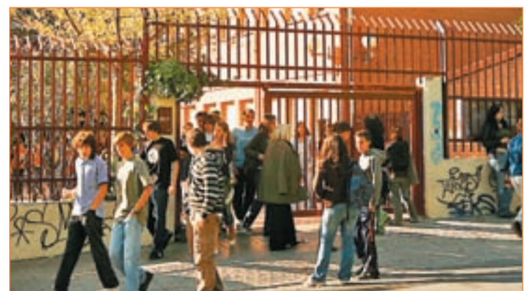
Alumnos de Secundaria a la salida de su instituto

alumnos. Desde la Federación estatal de directivos de institutos públicos, Fedadi, interpretan que este incremento se debe a que los jóvenes comprenden que con un título será más fácil encontrar trabajo: "Estudios advierten que sólo habrá un 15% de empleos que no se exijan cualificación", alertan.