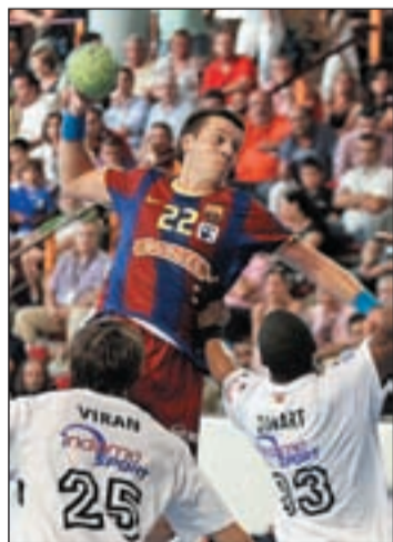
El Ciudad Real ganó la Supercopa