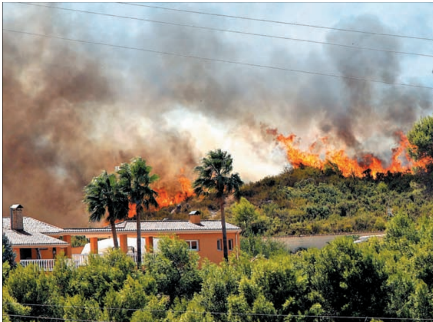
Las llamas amenazan una de las casas de las urbanizaciones desalojadas en el municipio de Ontinyent

Más de un millar de personas han tenido que ser desalojadas • La mayoría de los fuegos han sido provocados • La UME ha apoyado a los medios aéreos y terrestres movilizados por la Generalitat Pág. 4