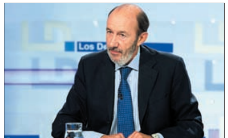
Alfredo Pérez Rubalcaba, durante una entrevista en TVE

tado en la terminal T4 del Aeropuerto de Barajas de Madrid. Por su parte las víctimas han solicitado al Gobierno delimitar al máximo el Reglamento Penitenciario para evitar “casos de falsos arrepentimientos etarras”. Esta es una de las primeras iniciativas de la Comisión de Seguimiento, entidad constituida esta misma semana.