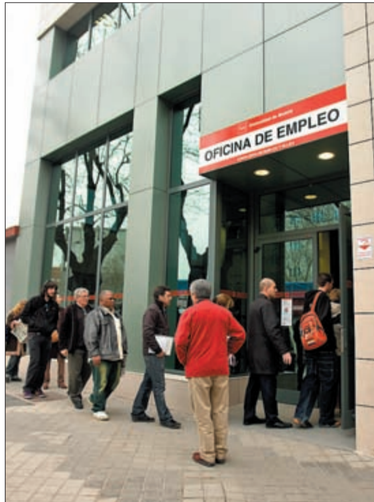
La reforma laboral salida del Congreso perjudica a la clase obrera

En el capítulo de contratación y del despido objetivo, con indemnización de 20 días por año de trabajo, la reforma salida del Congreso contempla despedir por causas económicas cuando "los resultados de la empresa denoten un situación económica negativa, es decir que tenga pérdidas o se prevean en el futuro o cuando la persistencia de los ingresos sea negativa.