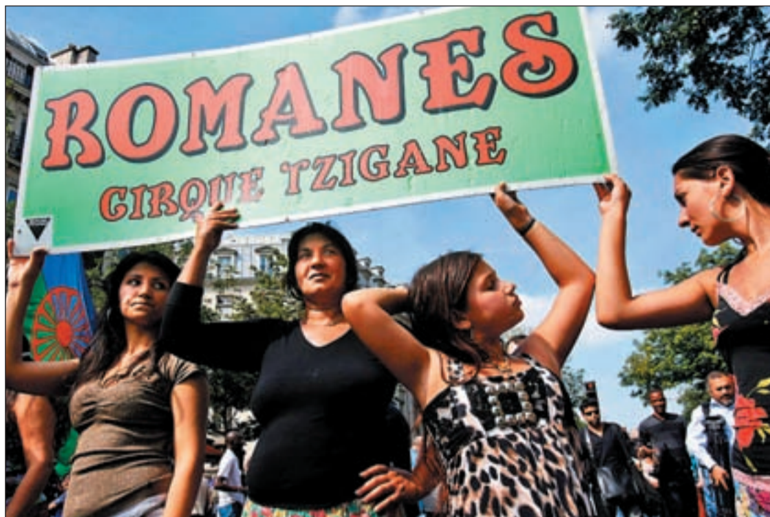
Mujeres romaníes en la manifestación de París contra las deportaciones "xenófobas y racistas"

FRANCIA DESOYE LAS EXIGENCIAS EUROPEAS Y CONTINUARÁ CON LAS DEPORTACIONES