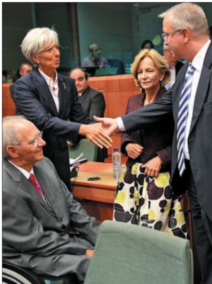
Los ministros alemán, francés y español junto al comisario Olli Rhen

Tampoco podrán adoptar ninguna decisión que pueda afectar a las responsabilidades fiscales de los Estados miembros, es decir, que le obligue por ejemplo a inyectar dinero a un banco con problemas. Esta máxima preocupación de Reino Unido, que obtuvo una cláusula de salvaguarda a tal fin que le permitirá apelar ante el Ecofin cualquier decisión de las autori-