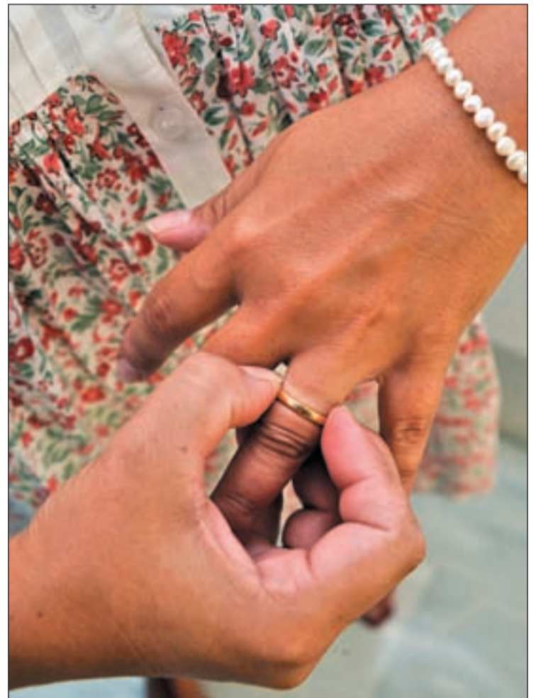
Una mujer retira su alianza matrimonial

Los últimos datos publicados por el INE esta semana confirman una reducción progresiva del número de disoluciones matrimoniales iniciada ya en 2007. El año pasado fueron 106.166 las rupturas contabilizadas, lo que supone un descenso del 10,7% respecto a 2008. El coste de la vida fuera de la pareja y los gastos derivados de la separación, unidos a la coyuntura económica actual, podrían ser, según los expertos, el origen de este retroceso. Las parejas optaron en su mayoría por escindir su relación mediante el divorcio, un total de 98.359, mientras 7.680 quedaron en separación y 127 en nulidad. Las rupturas de pareja afecta, igualmente, a los hijos. Especialmente a los menores de edad. En el 53,6% de estas separaciones había niños y en el 57,5% de los casos se asignó pensión alimentaria para ellos, que en 88 de cada cien familias rotas fue asumida por el padre, frente al 5,3% de las situaciones en que recayó en la madre y el 6% en que se acordó sufragar de forma conjunta.