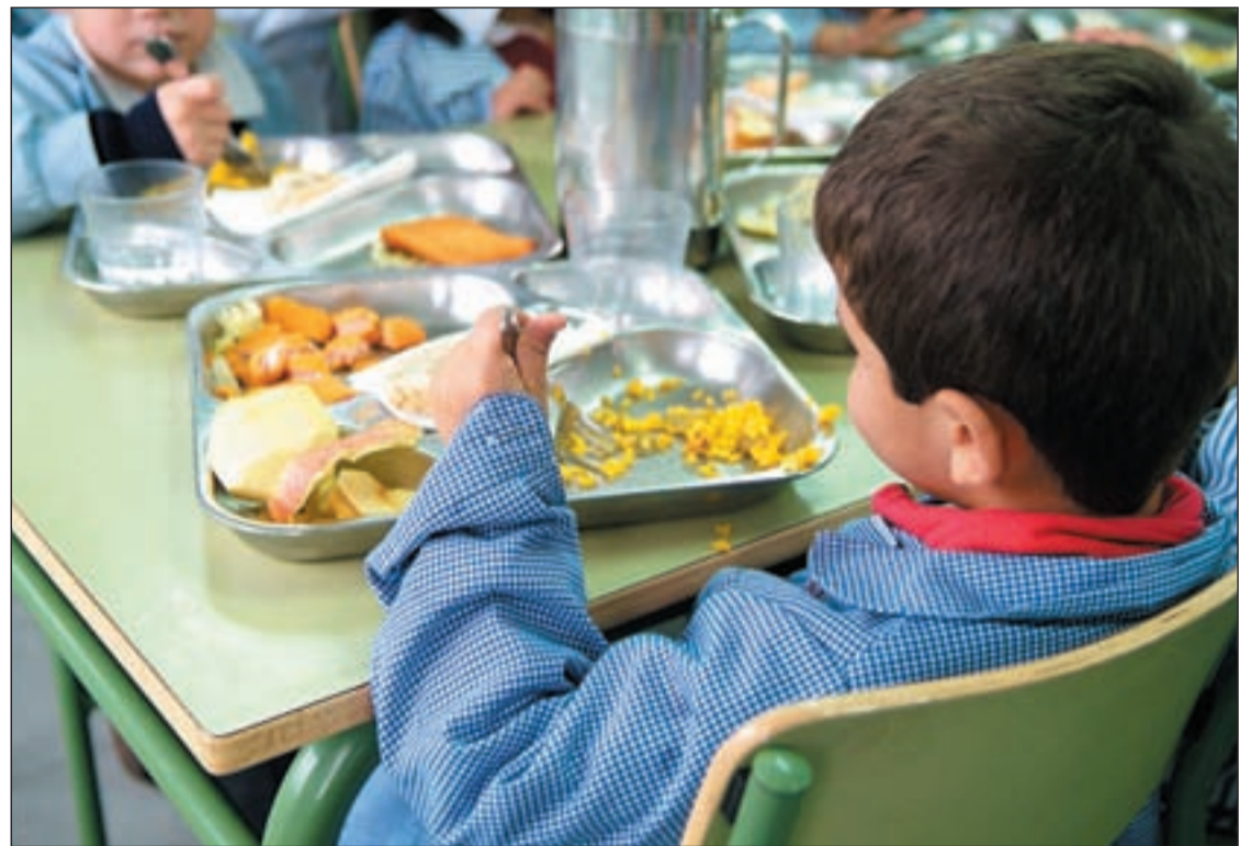
Escolares de Primaria comen en las instalaciones de su centro educativo

CONSULTA ESTA SEMANA EN LA WEB MÁS NOTICIAS SOBRE EDUCACIÓN