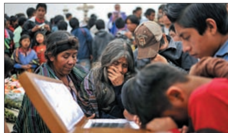
Voluntarios realizando labores de búsqueda y rescate

50% de la población sobrevive del erario estatal. Tal situación ha originado que los Presupuestos del 2011 estén enfocados en la garantía de estas prestaciones y, a su vez, sean objeto de las críticas tanto de sindicatos y la izquierda del país por los actuales recortes sociales, como de la derecha, que busca reducir el gasto público.