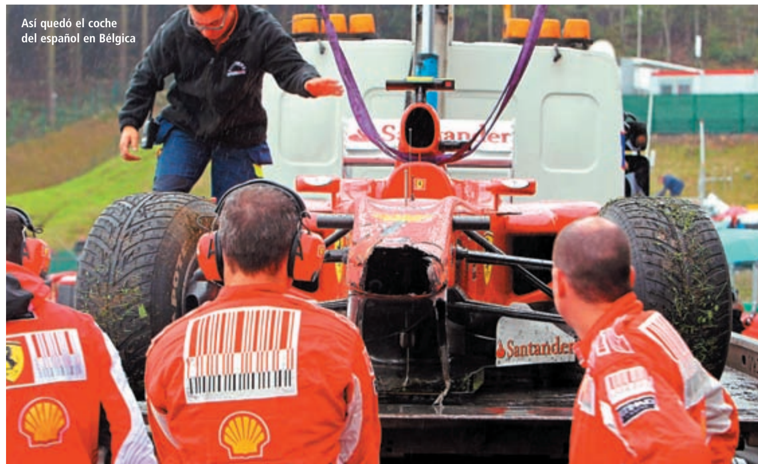
Así quedó el coche del español en Bélgica