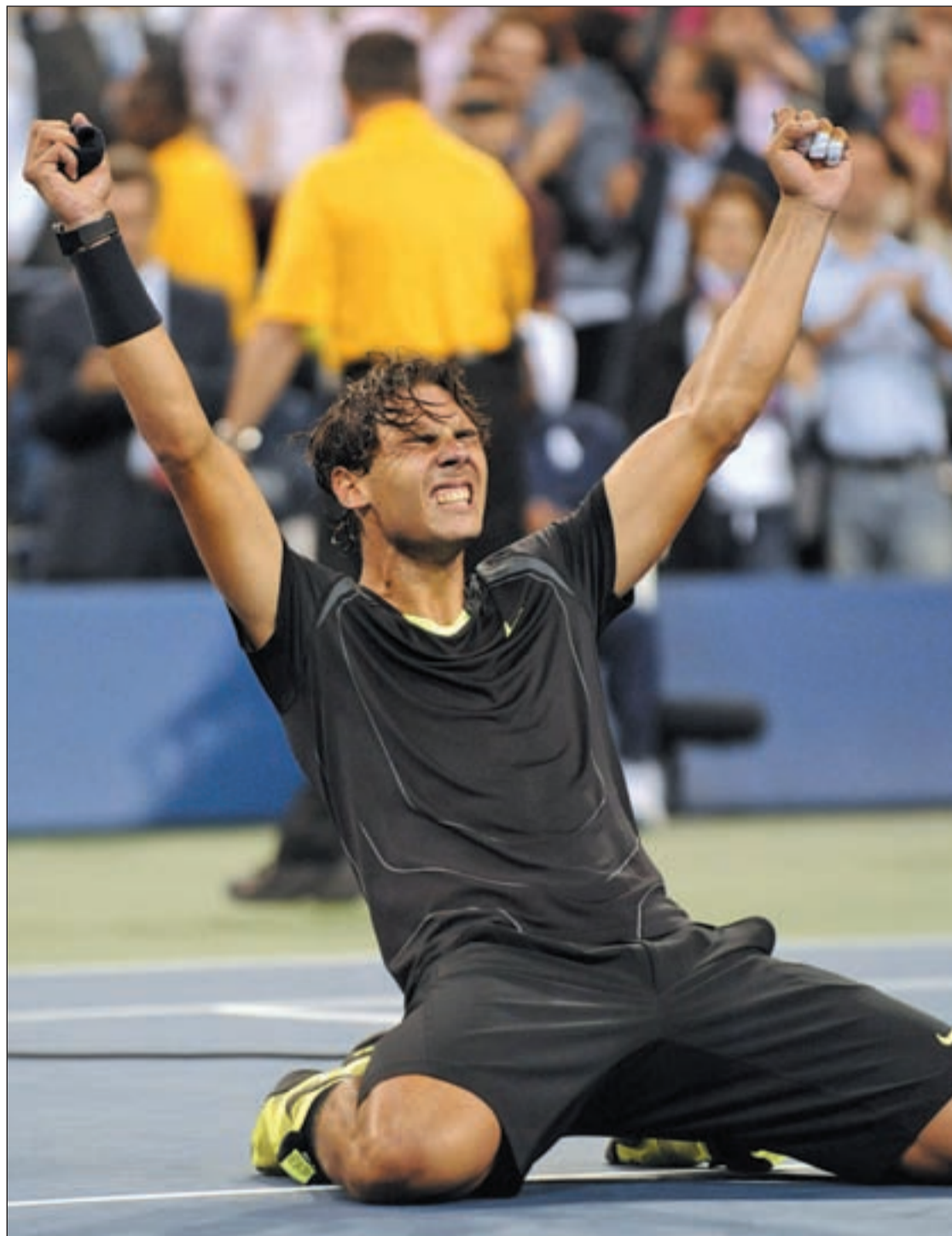
Rafa Nadal, exultante tras su triunfo ante Djokovic

En estos momentos, el ranking de la ATP sigue liderado por Nadal con 12.025 puntos por los 7.145 de Djokovic y los 6.735 de Federer. Ahora el español se ha fijado como objeti-