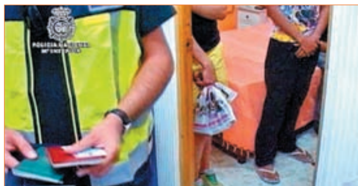
Un policía comprueba la documentación de las víctimas

El miedo frena la denuncia de las víctimas en demasiadas ocasiones. El miedo a las represalias sobre ellas y sus familias y el temor a ser deportadas impi-