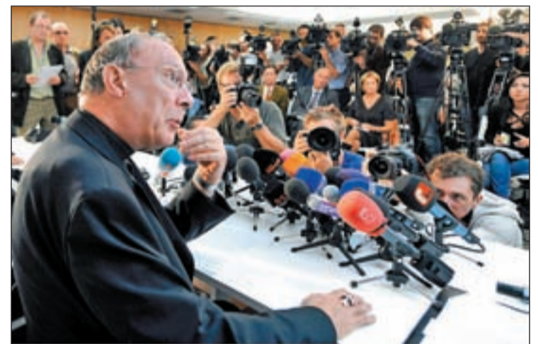
El arzobispo belga, monseñor Andre Joseph, en rueda de prensa

ron. El resto aún arrastra las secuelas psicológicas de los abusos. Tras conocer los resultados del informe, la Iglesia católica ha ofrecido una comparecencia pública donde ha tachado de “errores del pasado” los casos de pederastia y ha garantizado que los culpables que aún sigan vivos serán sancionados por la ley canónica, aunque no por el derecho penal. Pero en la declaración eclesiástica la palabra ‘perdón’ ha sido la gran ausente, tal y como denuncian y lamentan las víctimas. Tampoco ha hecho mención a posibles indemnizaciones.