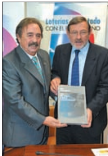
Lissavetzky recibe el dossier