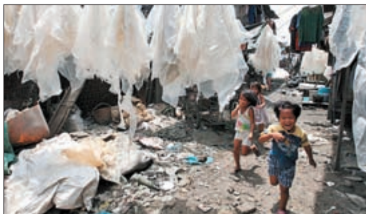
El hambre se erradicaría con el 1% de lo aportado para salvar la Banca

D.P./ Pese al descenso del hambre en el mundo por primera vez en 15 años, los 925 millones de personas aquejados de hambre o la cantidad de niños que mueren por malnutrición (uno cada seis segundos) siguen siendo cifras “inaceptablemente altas”, según la ONU.