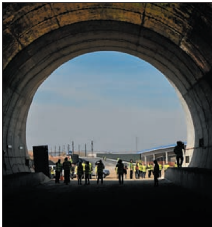
Obras de un túnel en el trayecto del AVE a Valencia

Según Mario Flores, consejero de Transportes de Valencia, “la puesta en marcha del AVE va a poner en evidencia que se trata del trazado de alta velocidad más rentable, que los valencianos vamos a ser capaces de obtener el máximo rendimiento de esta infraestructura y que debía de haber estado disponible hace mucho tiempo para toda la Comunitat”, ha manifestado Flores, quien ha recor-