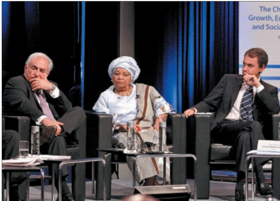
José Luis Rodríguez Zapatero, a la derecha, durante el foro del FMI en Oslo

España ha sido un ejemplo para el Fondo Monetario Internacional reunido en Oslo. Un ejemplo negativo respecto a las tasas de paro alcanzadas por nuestro país que han crecido un 10% en los últimos años. Nuestro país, junto a EE.UU., podría estar “en riesgo de histeria” dada la larga duración del desempleo y “la persistencia de los colapsos” que llevaron a la debilidad de la Economía, según señala el informe presentado en la capital noruega por el FMI. Y este foro internacional, José Luis Rodríguez Zapatero ha argumentado el incremento del paro al asociarlo con la “explosión demográfica” experimentada en nuestro estado y que ha supuesto el incremento de la población activa en 5,2 millones en la última década, “por eso la crisis nos ha dado tan duro en la tasa del paro”, explicó Zapatero.