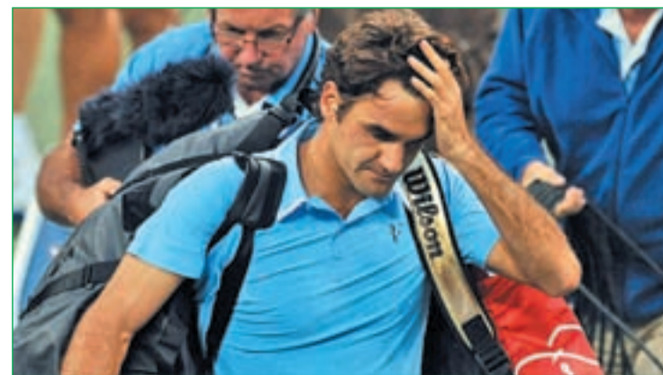
Federer ha caído hasta la tercera posición del ranking ATP

con el triunfo en el Open de Australia, ha terminado cediendo en los otros tres 'grandes' ante el empuje de un Rafa Nadal que comenzó el año en el polo opuesto, con muchas dudas y mermado por los problemas en sus rodillas que le llevaron a firmar un 2009 prácticamente para olvidar.