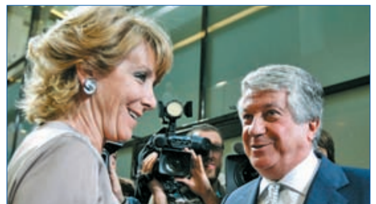
Aguirre, el martes, con el presidente de los empresarios madrileños