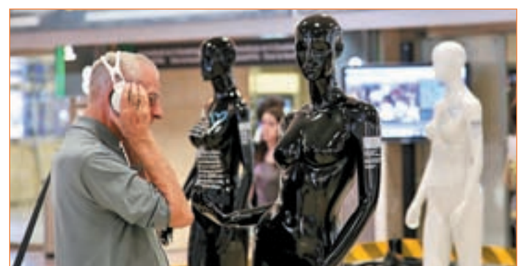
Muestra ‘Esclavas del siglo XXI’ en la estación de Chamartín de Madrid