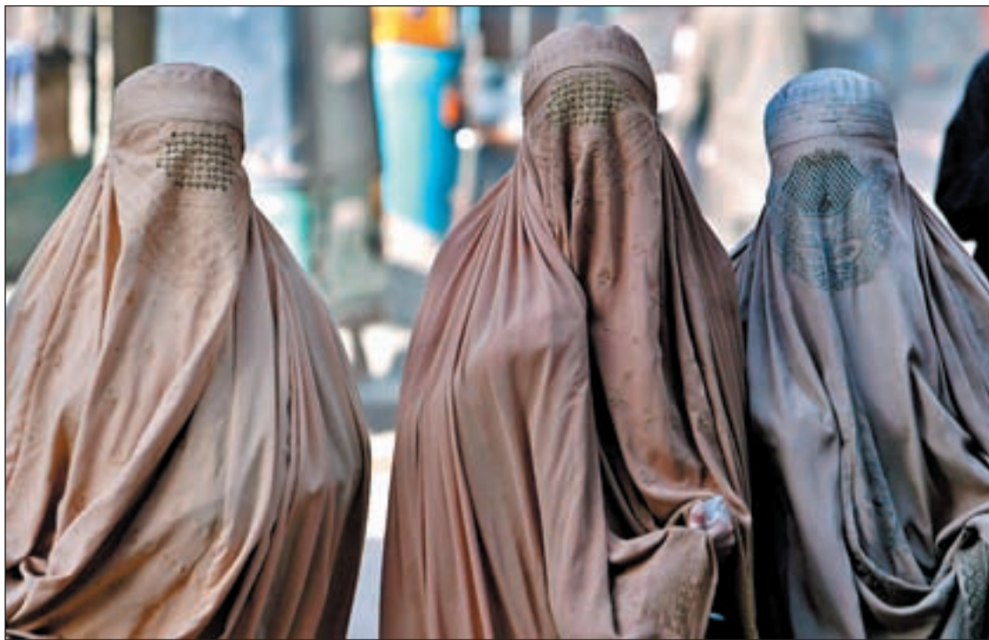
En Francia hay cerca de 2.000 mujeres que llevan burqa, según fuentes institucionales

LA LEY SANCIONA CON CÁRCEL A PERSONAS QUE IMPONGAN A LA MUJER SU USO