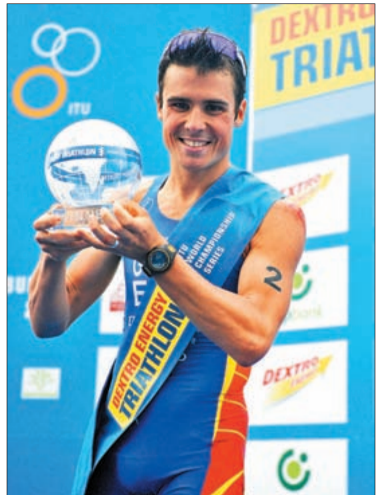
El español posa con el trofeo de campeón

El logro de Gómez Noya es mayor aún si se tiene en cuenta