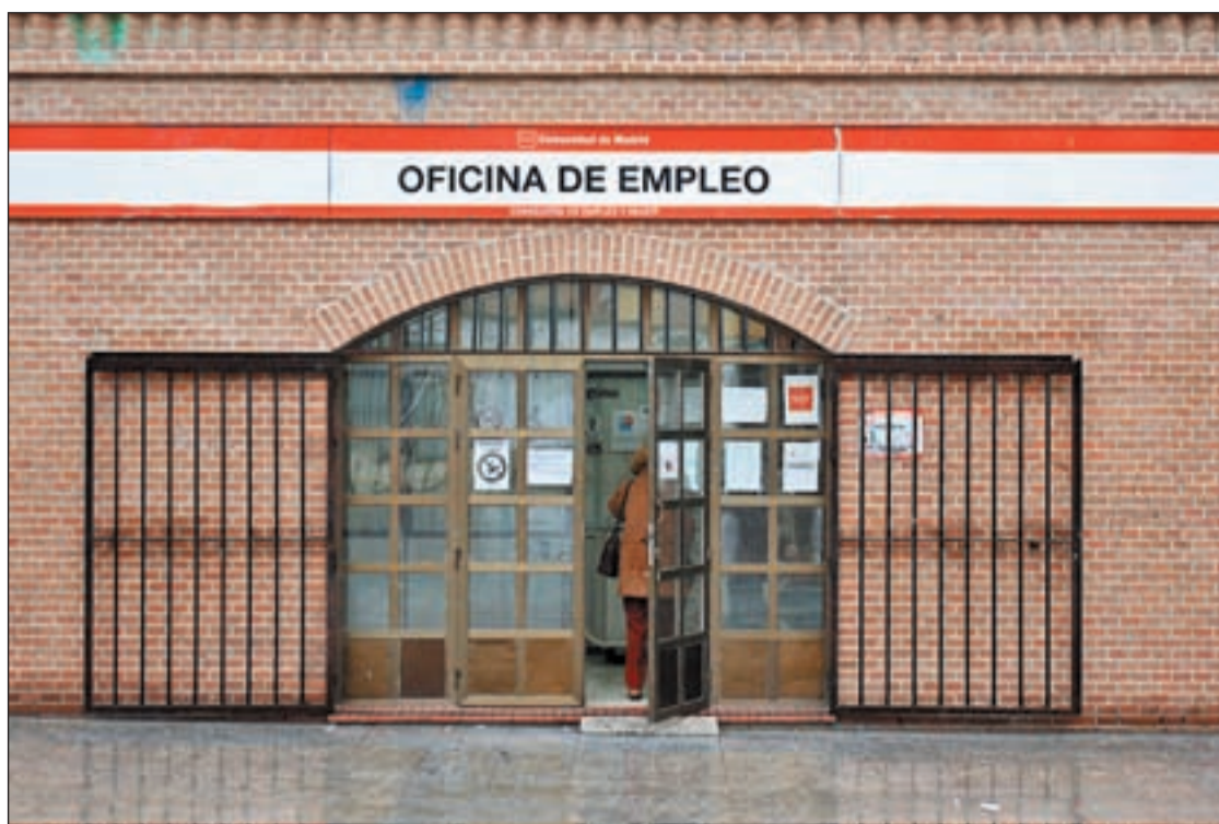
Previsiblemente las ayudas para parados de larga duración no se prorrogarán

Por último, el tráfico Calidad Best Effort pensado, sobre todo, para el acceso a internet de los usuarios domésticos.