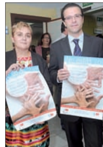
Presentación de la campaña

El consejero ha destacado la importancia de la labor que diariamente realizan las asociaciones de familiares y pacientes de Salud Mental. "No cabe duda de que los familiares de nuestros