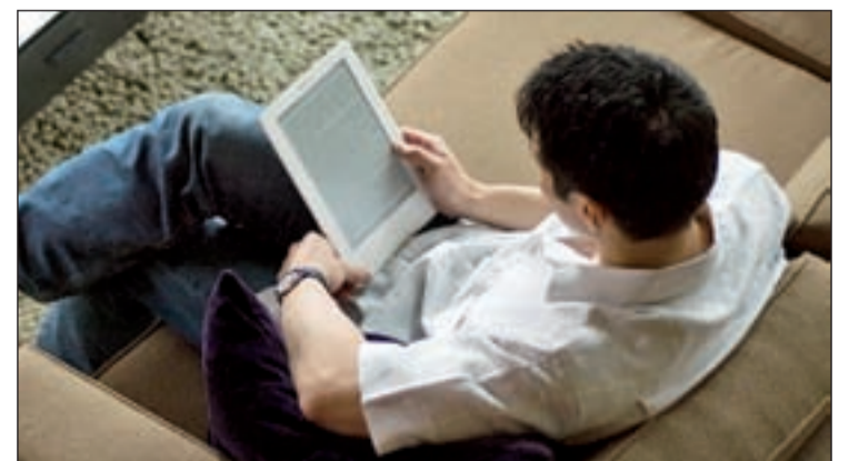
Muchos lectores comienzan a ver las ventajas de los eBooks

mos utilizar el eBook en el exterior sin que ello se resienta en la lectura. Actualmente existe en el mercado una gran variedad de opciones a elegir, destacando en sus ventas el famoso Kindle de Amazon, Reader de Sony o el Papyre de Grammat. Todos ellos a unos precios que oscilan entre los 200 y 400 euros.