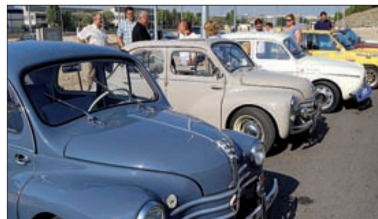
Los coches clásicos volverán el sábado a Valdemoro

La entrega de premios y menciones a los propietarios de los vehículos más votados y valorados por los asistentes tendrá lugar a las 17:00 horas y cerrará el acto la actuación del grupo musical Los Hobbies, alrededor de las 17:30 horas.