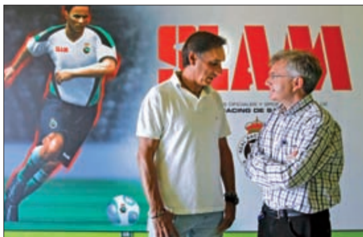
Una de las salas de las instalaciones del Racing en El Sardinero

vamos a intentar hacer buen fútbol y desde esa base y criterio tenemos que ser capaces de ganar y hacernos fuertes aquí en casa.