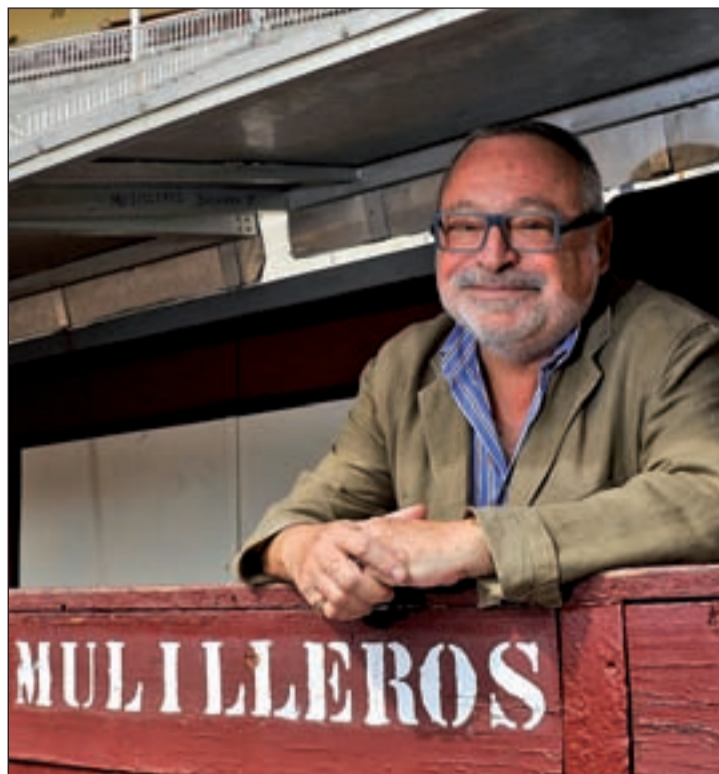
Fernando Savater, en la plaza de Las Ventas

los cosos. "La barbarie es confundir la sangre de los hombres con la de los animales", asegura Savater ante las tesis de quienes persiguen la abolición de las corridas de toros. Y es que la tendencia a vivir en las ciudades y la distancia de los ciudadanos con el campo ha mutado nuestra interrelación con los animales para el filósofo. "Por una parte los animales se van convirtiendo en algo material, algo que se come y se usa, mientras por otro lado, hay otros animales que se prestan a una humanización forzosa,