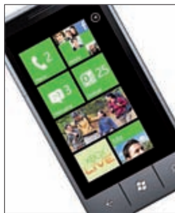
Microsoft lanzará varios modelos

ro hacia las redes sociales. Microsoft no se olvida tampoco de su programa estrella e incluirá en todos los modelos que saldrán a la venta una versión de Office. Además, los móviles que incorporen el nuevo sistema operativo de la compañía llevan una pantalla capacitiva, acelerómetro con brújula digital, sensor de luminosidad y proximidad y GPS incorporado. Los procesadores partirán de un ARMv7 Cortex con Direct 9 para el apartado gráfico.