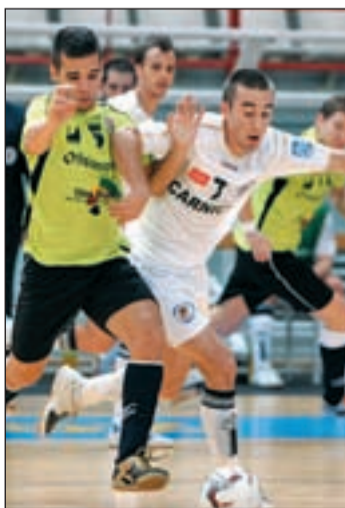
Primera derrota de Carnicer