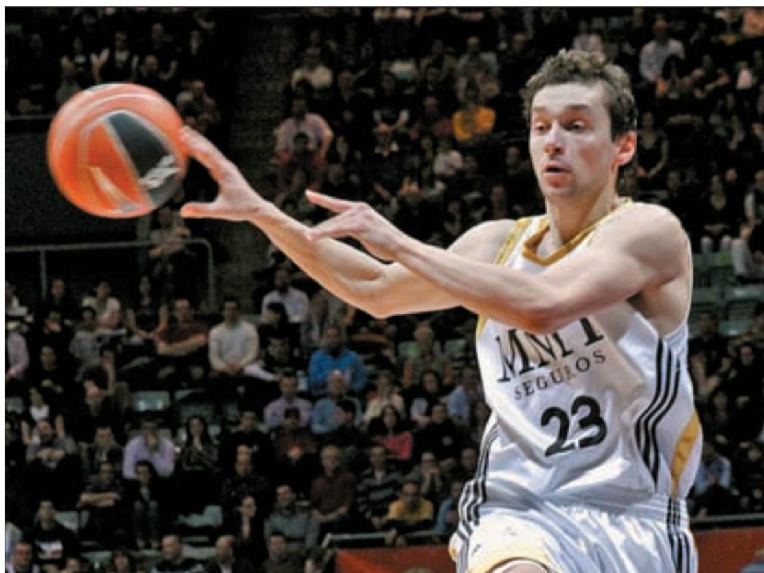
El internacional español Sergio Llull volverá a ser una de las piezas claves del Real Madrid