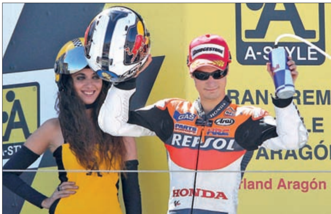
El piloto de Honda subió otra vez al podio en el Gran Premio de Aragón