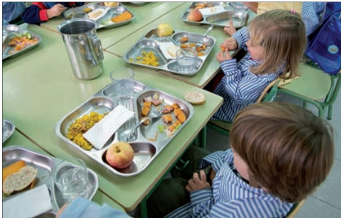
Niños en un comedor infantil de la Comunidad

Para su correcto funcionamiento, la Comunidad dispone de un abanico de normativas e instrucciones. Uno de ellos es el Programa de Comedores Escolares, documento elaborado por la Fundación Española de Nutrición (FEN) para el Gobierno regional que contempla la normativa que deben cumplir las empresas de restauración que sirven los menús de los centros docentes públicos.