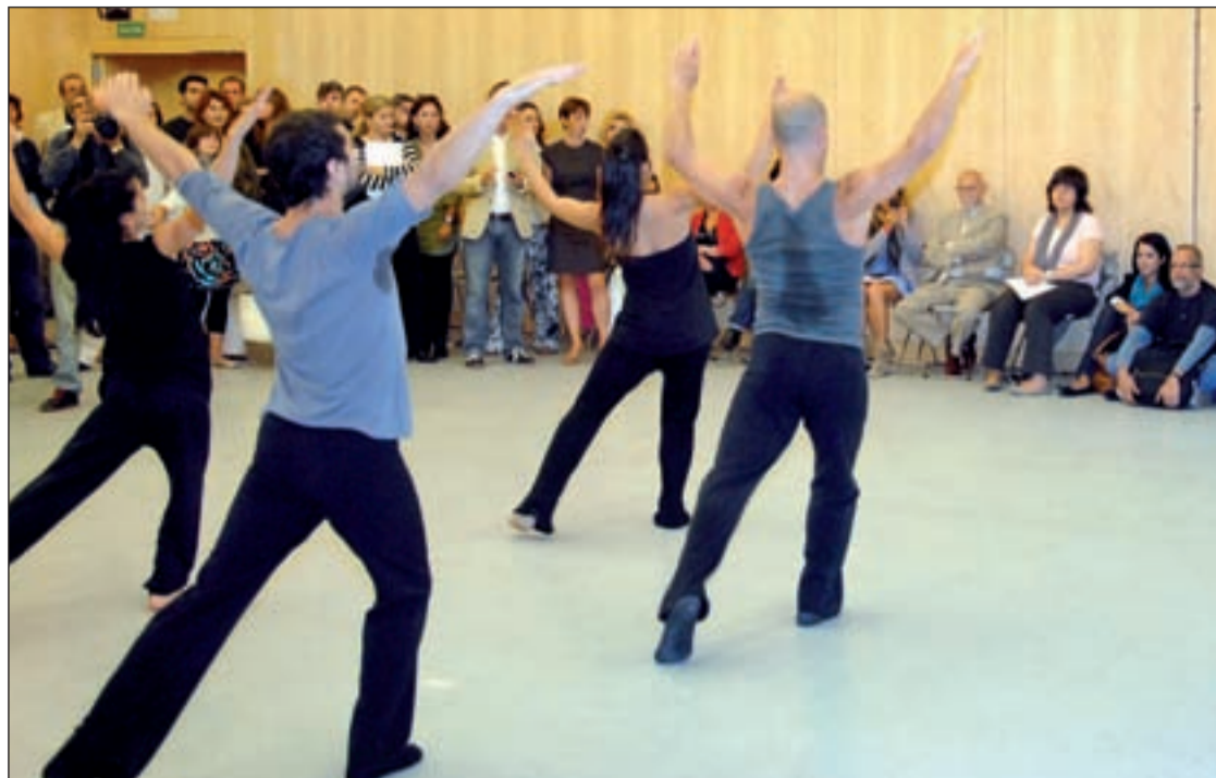
Presentación de Madrid en Danza en los Teatros del Canal