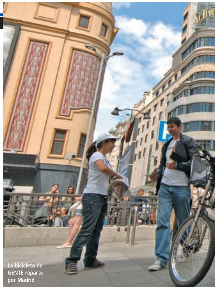
La bicicleta de GENTE reparte por Madrid

A pesar de estos cambios, el semanario no pretende dar la espalda a sus orígenes. Desde que el primer periódico del Grupo de Información GENTE nació en 1998 en Burgos como un proyecto pionero en el sector de la prensa gratuita, el semanario no ha abandonado a los vecinos y las 41 cabeceras que ahora llegan a los hogares en otras tantas ciudades españolas continúan apostando por conectar por los verdaderos intereses de los ciudadanos.