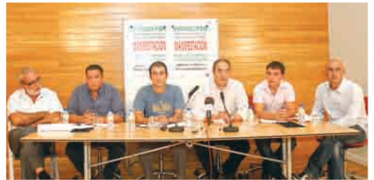
Representantes de los sindicatos agrarios.