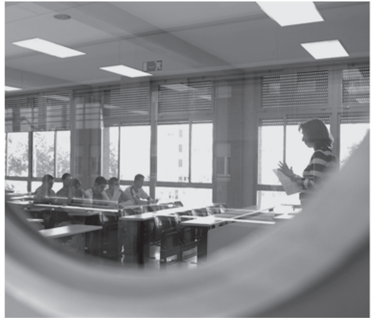
Foto de archivo de alumnos en un aula de la UR.

A lo largo de este curso 2010-2011, "deberemos proceder con la Consejería de Educación,