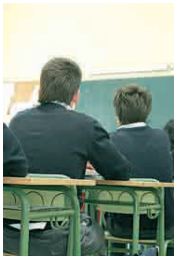
Comienzan las clases.

El número total de alumnos en el inicio de curso, en enseñanzas de régimen general, es de 48.344. En total, hay 1.079 alumnos más, lo que supone un aumento del 2,2% con respecto al curso pasado. El número total de alumnos de nacionalidad extranjera escolarizados en La Rioja, al comienzo de este curso, es 7.948, lo que supone un 16,3% de los estudiantes de régimen general. En concreto, son 328 alumnos más de