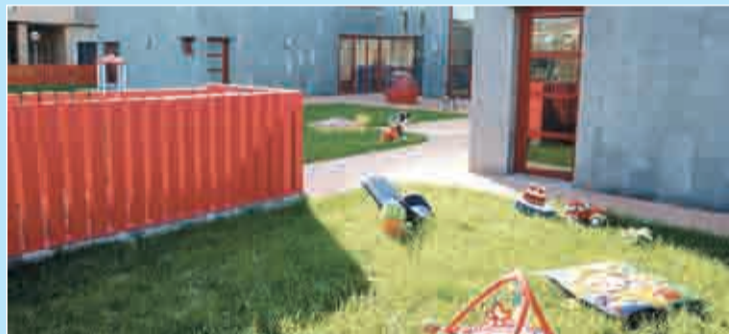
Instalaciones del centro de Educación Infantil Ding-Dong.

Confírmame tu asistencia en el teléfono 941 220 265.