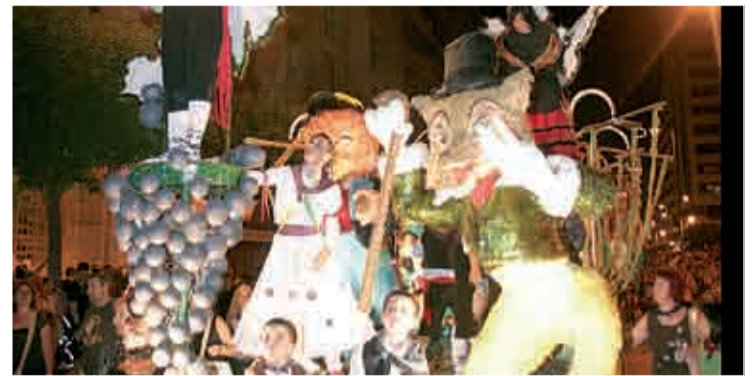
Imagen de las carrozas.