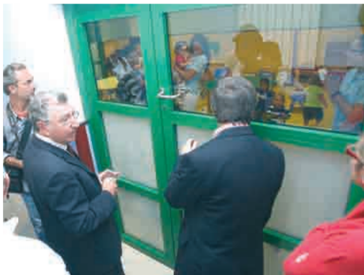
Primer día del curso del centro Infantil Casa Cuna.

Los padres que lo deseen todavía pueden formalizar la matrícula en las instalaciones de la guardería. La cual tiene 7 unidades educativas; 1 aula para niños menores de 1 año; 3 aulas para niños de 1 a 2 años; y 3 aulas para niños de 2 a 3 años. "El coste de la guardería ha sido de 1,5 millones de euros; y ha sido un compromiso de este equipo de