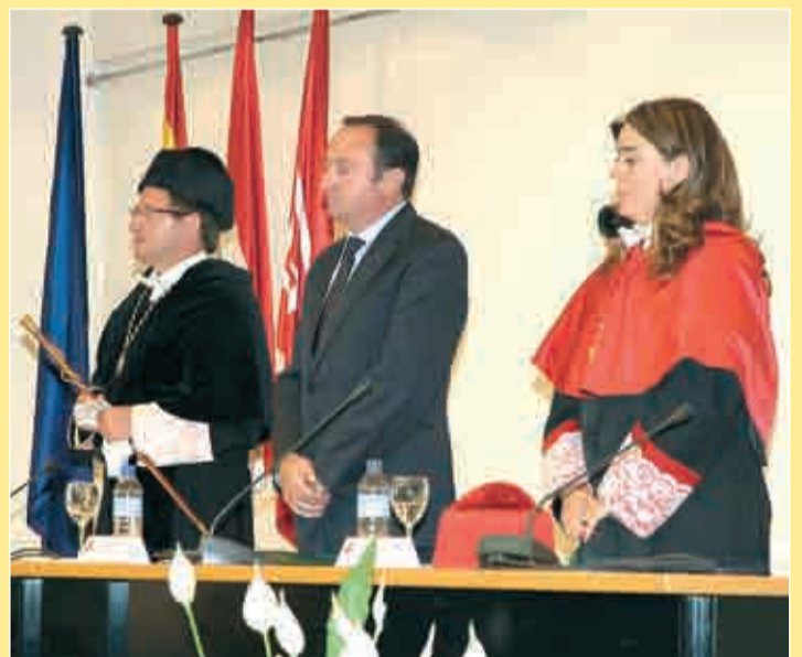
Inauguración del curso universitario 2010-2011.