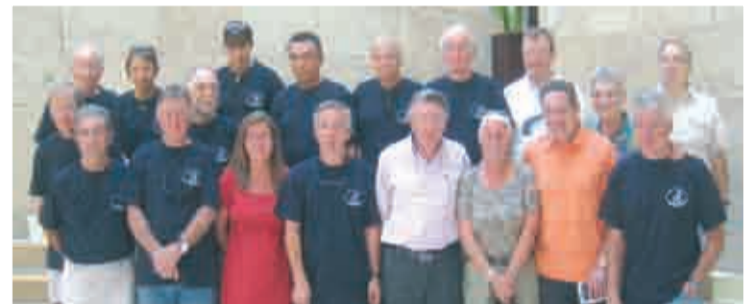
El alcalde de Logroño con los viajeros de Libourne.