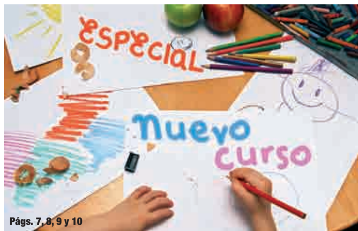
Págs. 7, 8, 9 y 10