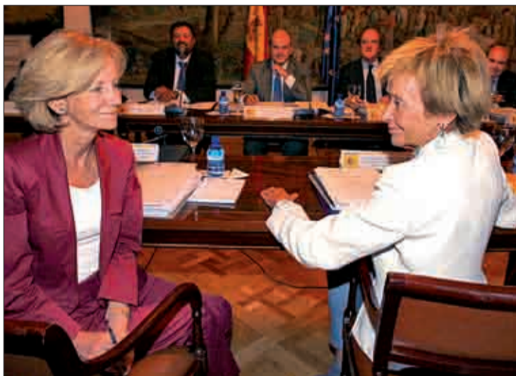
Elena Salgado charla con Teresa Fernández de la Vega

Los Ayuntamientos más prudentes, los que acumulen menos morosidad, podrán endeudarse el próximo año para financiar nuevas inversiones. La ministra de Economía, Elena Salgado, abrió esta semana las puertas a esta modificación al decreto aprobado en mayo que prohibía a los consistorios pedir créditos durante el año 2011. En concreto, podrán acogerse a esta nueva posición los entes municipales que tengan un nivel de endeudamiento inferior al 75% de sus ingresos.