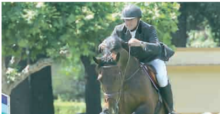
Salto de caballo y jinete ante un obstáculo situado en la pista.