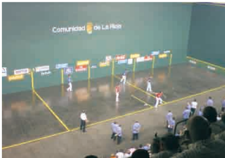
Frontón de Adarraaga en Logroño.

Además de regresar a Adarraaga los aficionados podrán el día 19 a Titín III con Barriola, Mtz. de Irujo con Pascual; ...los precios se han ajustado a la baja.