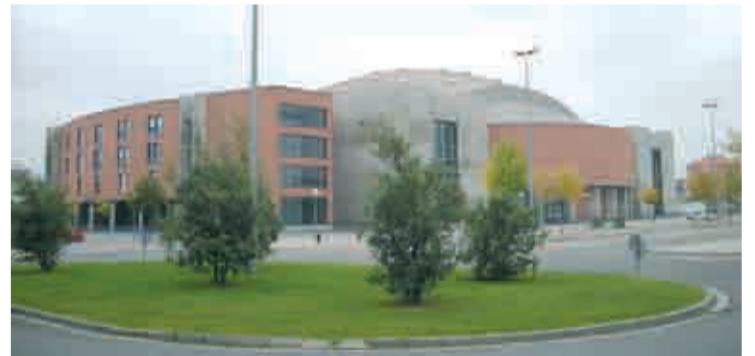
Palacio de los Deportes de La Rioja, en Logroño.

horas y de 17.00 a 21.00 horas. A través de los juegos de consolas, un elemento que es cercano a los jóvenes, el Gobierno de La Rioja quiere estimularles para que vean el deporte como una fuente de diversión y una forma de practicar ocio saludable, tanto de manera individual como en equipo. Entre todos los asistentes se sorteará una wii.