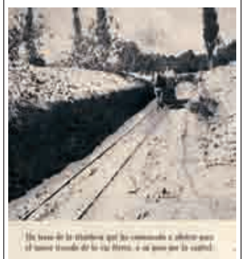
Obras en la trinchera de la vía. 1950.