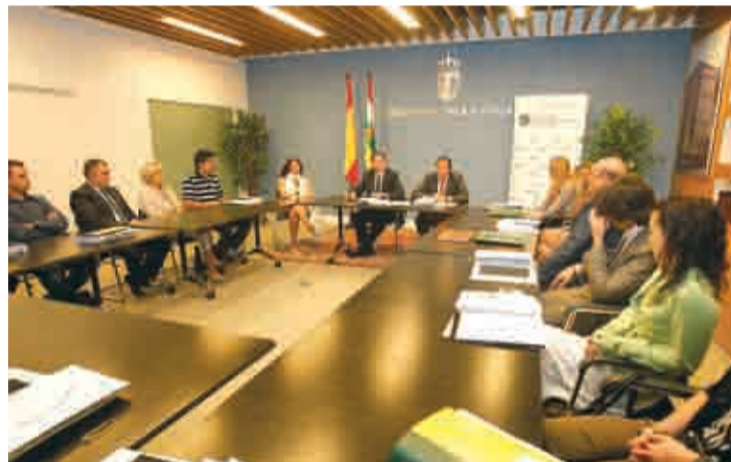
Erro presentó la misión comercial a EEUU, dirigida al sector vitivinícola.

ciones de vino de La Rioja a EEUU suponen el 66,55% del total de nuestras exportaciones a EEUU (en los últimos 15 años, este porcentaje ha aumentado un 86%). Por otro lado, el 15,77% del vino exportado por La Rioja se dirige a EEUU (en los últimos 15 años, este porcentaje ha aumentado un 167,72%).