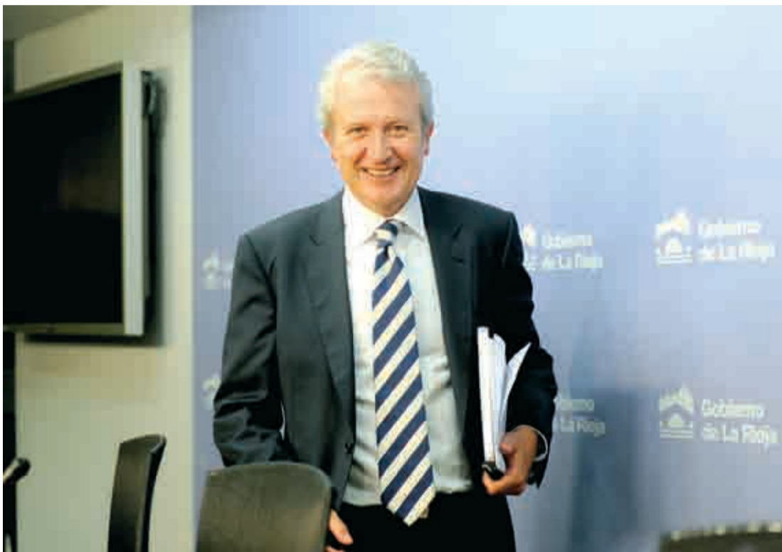
Emilio del Río, consejero de la Presidencia y portavoz, a su llegada a la rueda de prensa posterior al Consejo.

Los colegios a los que pertenezcan los equipos ganadores recibirán un premio en metálico de 2.000 euros y un diploma acreditativo para el centro.