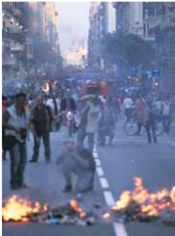
Els aldarulls es van allargar tot el dia fins al vespre del dimecres. ACN

dos romanesos –per assaltar la botiga de Levi's a la Gran Via– i un danès, un portuguès, un turc, un indi, un francès i un mexicà. La majoria tenen entre 18 i 28 anys, però també hi ha un home de 47 anys.