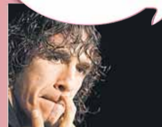
Carles Puyol Jugador del FC Barcelona

"M'han criticat que traguéssim la senyera al Mundial"