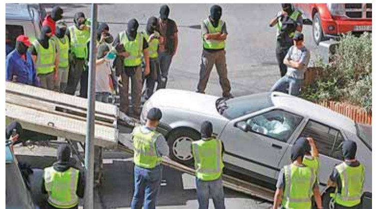
La Guardia Civil transporta el coche incautado al 'talde Imanol'

Desde que ETA emitiera su vídeo comunicado el pasado 5 de septiembre en el que comunicaba el cese de "las acciones ofensivas", la política antiterrorista no ha cambiado su férreo control sobre la banda y hasta la fecha han arrestado a 19 personas acusadas de relacionarse con la actividad terrorista, bien por su vinculación con EKIN, el brazo políti-