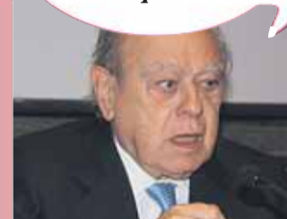
Jordi Pujol Expresident de la Generalitat

"Un alcalde de Barcelona em va dir que el moviment okupa tenia moltes coses positives"