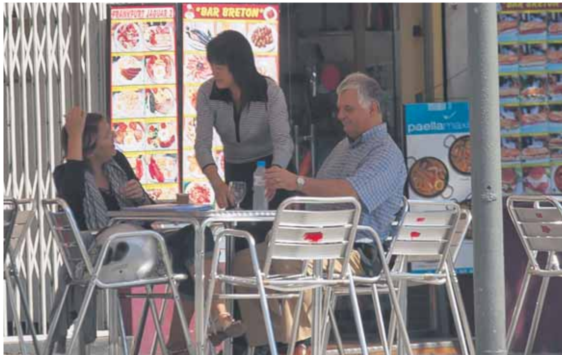
Restaurante regentado por orientales en la esquina de Diputació con Marina.

Los vecinos de la Sagrada Família temen que su barrio se convierta en Chinatown