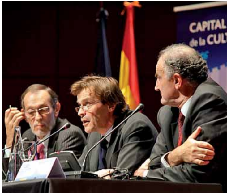
Representantes del comité de selección anuncian su fallo MANUEL VADILLO

Los más de 200 periodistas acreditados y los representantes de las delegaciones no ocultaban sus nervios en el momento en el que el representante del comité europeo que ha realizado la selección comenzaba a enumerar por orden alfabético: Burgos, Córdoba, Donosti, Las Palmas, Segovia y Zaragoza. Gritos de ale-