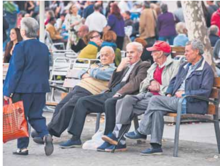
La gent gran reivindica un carnet general per a tots els jubilats. PABLO LEONI

Les tarifes reduïdes en metro i autobusos, en canvi, són per