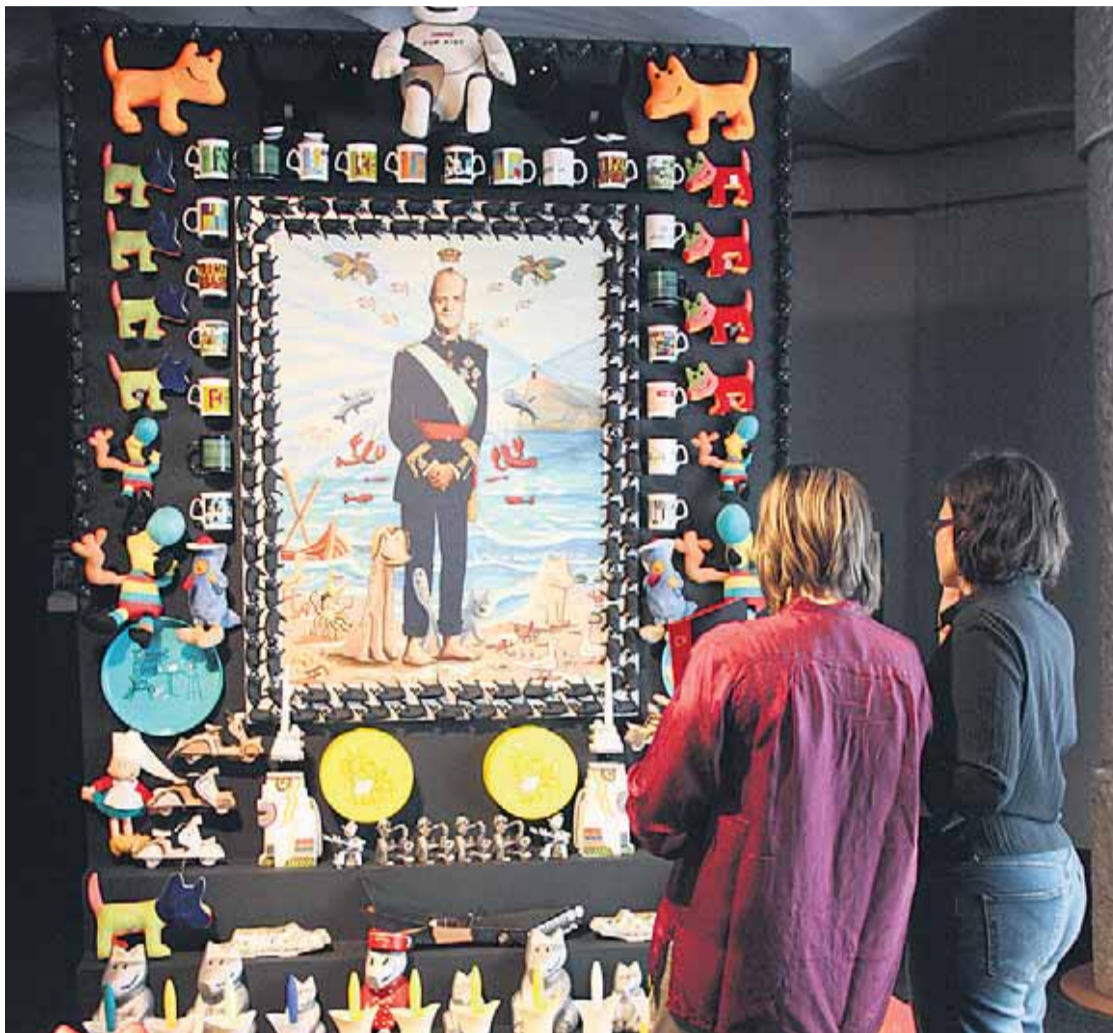
La mostra inclou una gran varietat de disciplines i formats

El dissenyador valencià exposa a la Pedrera els treballs dels seus darrers vint anys de carrera