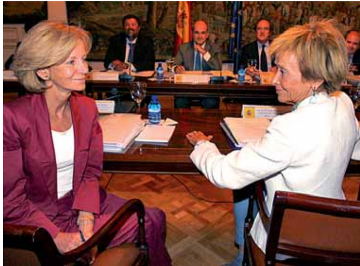
Elena Salgado charla con Teresa Fernández de la Vega

Los Ayuntamientos más prudentes, los que acumulen menos morosidad, podrán endeudarse el próximo año para financiar nuevas inversiones. La ministra de Economía, Elena Salgado, abrió esta semana las puertas a esta modificación al decreto aprobado en mayo que prohibía a los consistorios pedir créditos durante el año 2011. En concreto, podrán acogerse a esta nueva posición los entes municipales que tengan un nivel de endeudamiento inferior al 75% de sus ingresos.