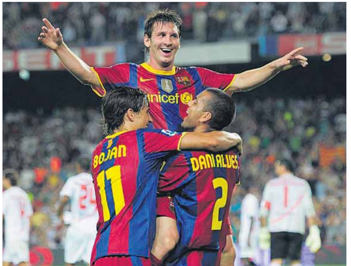
El davanter barcelonista ja suma quatre gols en els dos partits oficials que ha disputat.

Aquest any el davanter barcelonista sembla anar pel mateix camí. I és que ja suma quatre gols en els dos partits oficials que ha disputat: la tornada de la Supercopa d'Espanya i la primera jornada de Lliga contra el Racing. A més, a Messi només li falta una diana per fer el gol número cent amb la cama esquerra.