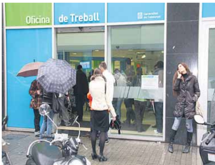
Els ciutadans critiquen la gestió davant l'alt índex d'aturats.

Els ciutadans també suspenen el tripartit en les següents matèries: equilibri territorial (4,78), justícia (4,77), estat de l'autogovern (4,59), habitatge (4,47), immigració (4,26), política econòmica