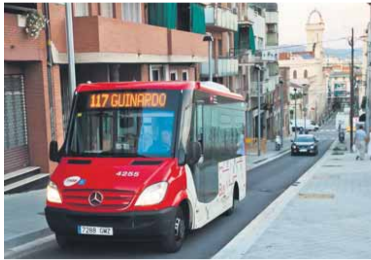
El bus de barri del Guinardó, durant el seu trajecte.

CiU dona suport a la proposta, però el Govern d'Hereu es nega a estudiar-la