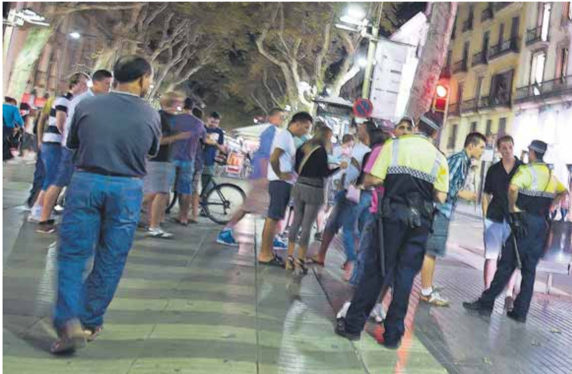
Los servicios policiales se refuerzan en los meses de verano.

Se hacen pasar por repartidores de flyers para robar a los transeúntes