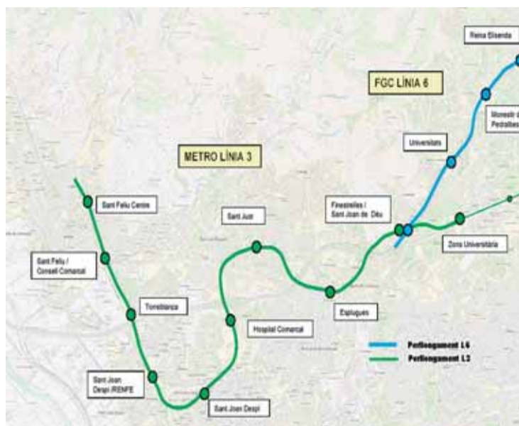
Plànol de la futura línia verda.

Les previsions apunten a que el nou tram donarà servei a prop de 57.000 viatgers diaris i que com-