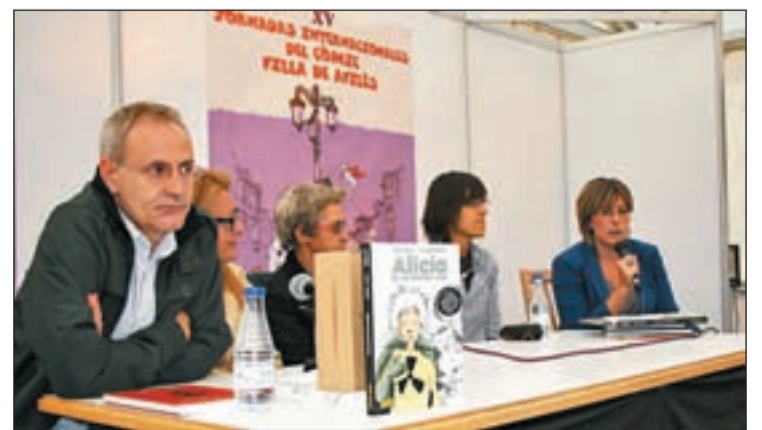
Mesa redonda 'Cómic en Femenino' de las Jornadas de Avilés

de jornadas, los aficionados disfrutarán más mesas redondas con Purita Campos o George Pérez, un acto de clausura con los autores invitados y las firmas y regalo de la lámina de Enrique Vegas. El domingo, el colofón vendrá con el Concurso de Disfraces infantiles.