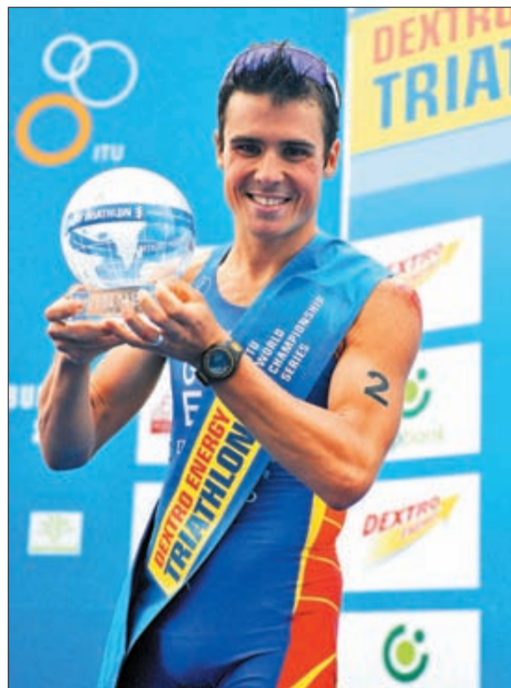
El español posa con el trofeo de campeón

El logro de Gómez Noya es mayor aún si se tiene en cuenta