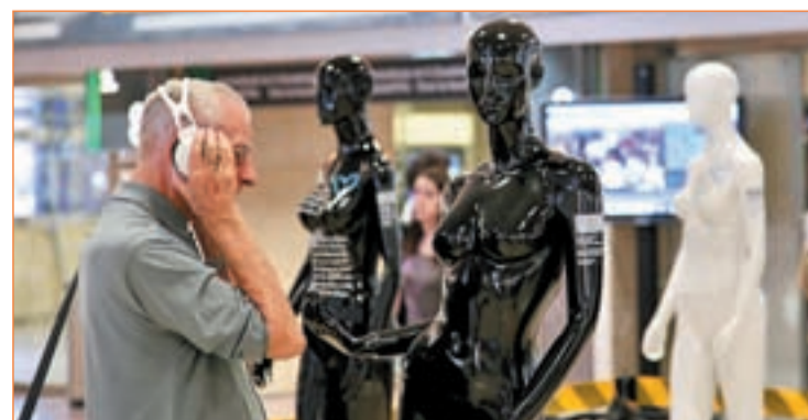
Muestra 'Esclavas del siglo XXI' en la estación de Chamartín de Madrid