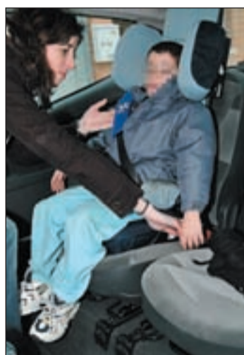
Sillita de retención para niños

Por este motivo, la Dirección General de Tráfico (DGT) lleva a cabo hasta el domingo 19 de septiembre una campaña especial de concienciación sobre la importancia de usar el cinturón de seguridad y las ‘sillitas’ infantiles. Para tratar de concien-