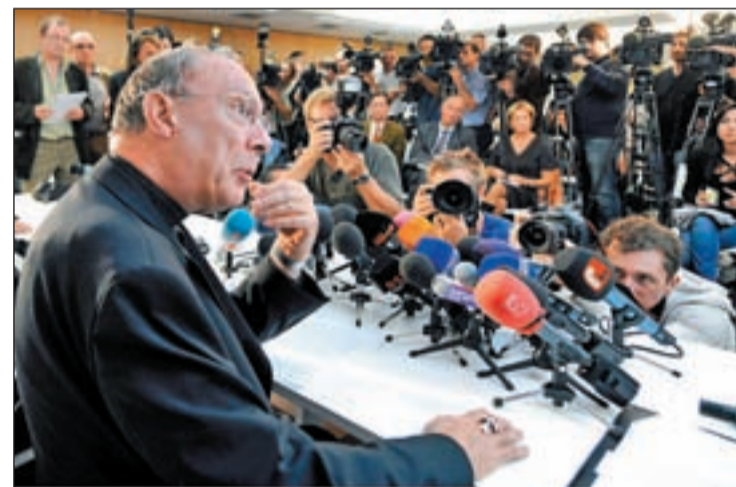
El arzobispo belga, monseñor Andre Joseph, en rueda de prensa

ron. El resto aún arrastra las secuelas psicológicas de los abusos. Tras conocer los resultados del informe, la Iglesia católica ha ofrecido una comparecencia pública donde ha tachado de “errores del pasado” los casos de pederastia y ha garantizado que los culpables que aún sigan vivos serán sancionados por la ley canónica, aunque no por el derecho penal. Pero en la declaración eclesiástica la palabra ‘perdón’ ha sido la gran ausente, tal y como denuncian y lamentan las víctimas. Tampoco ha hecho mención a posibles indemnizaciones.