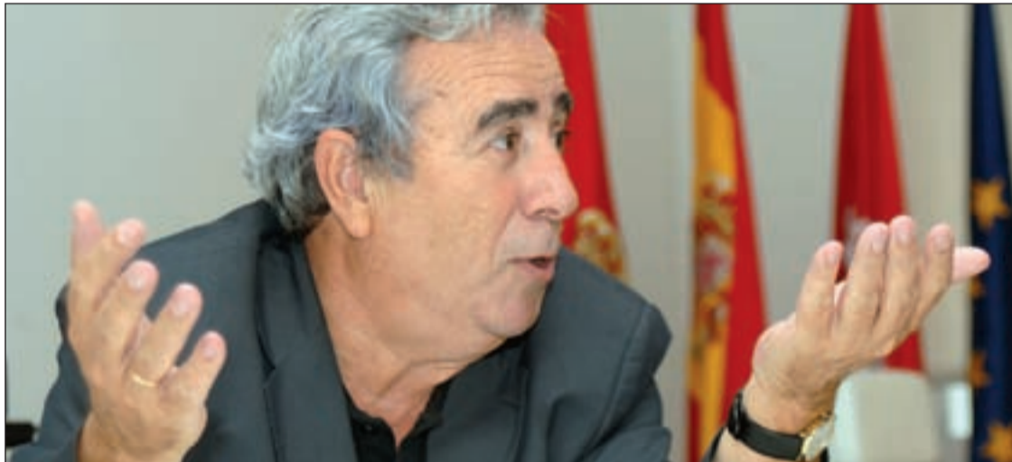
Enrique Cascallana durante la entrevista con GENTE, esta semana en su despacho

El alcalde apuesta por los equipamientos y hace balance en un número en el que GENTE estrena diseño y renueva su compromiso local Págs. 2, 3, 6 y 7