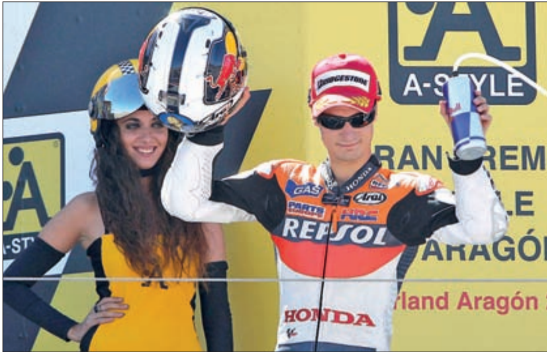
El piloto de Honda subió otra vez al podio en el Gran Premio de Aragón