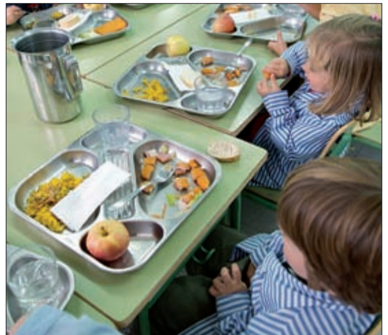
Niños en un comedor infantil de la Comunidad

Por su parte, también existe un Servicio de Asesoramiento Nutricional del Menú Escolar, a través del cual cada colegio podrá utilizar una aplicación informática que le permitirá obtener información sobre la idoneidad de las características de los menús escolares que se sirven en su centro educativo.