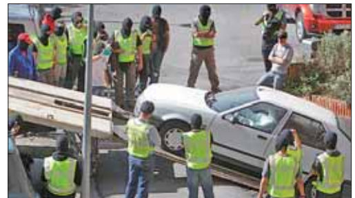
La Guardia Civil transporta el coche incautado al 'talde Imanol'

Desde que ETA emitiera su vídeo comunicado el pasado 5 de septiembre en el que comunicaba el cese de "las acciones ofensivas", la política antiterrorista no ha cambiado su férreo control sobre la banda y hasta la fecha han arrestado a 19 personas acusadas de relacionarse con la actividad terrorista, bien por su vinculación con EKIN, el brazo político más duro de