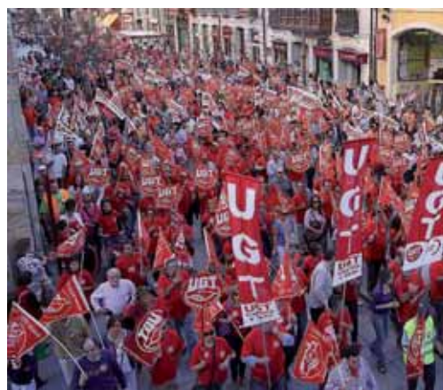
El objetivo, que el Gobierno escuche la voz de los trabajadores.

De esta forma, en el comercio, la mayoría de los comerciantes optaron por abrir las puertas de