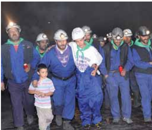
Los mineros salieron del pozo 'Las Cuevas' acompañados de sus hijos.

La Comisión Europea dió luz verde al Real Decreto de las ayudas del carbón pero con fecha de caducidad en 2014