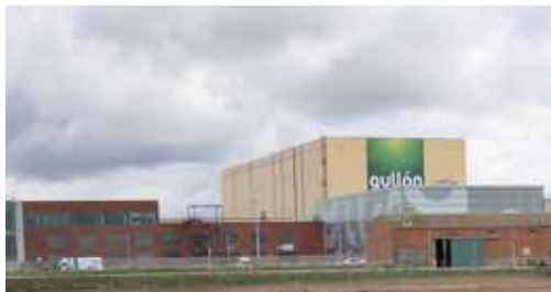
El juez fijó un plazo de diez días para ejecutar el fallo.

El juez fijó el pasado 22 de septiembre un plazo de diez días para ejecutar el fallo sobre el que el Tribunal Superior de Justicia de Castilla y León ya desestimó en julio un recurso de súplica en torno al despido considerado improcedente, que incluía además el abono de los salarios de tramitación.