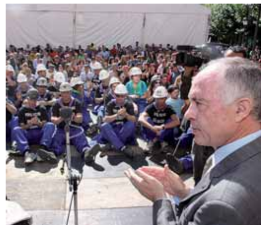
Gallego se interesó por el estado de los integrantes de la Marcha.