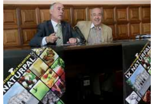
Un momento de la presentación de la Muestra en el Ayuntamiento.

Ya el sábado por la mañana, después del tradicional apaleo y recogida de la alubia, se ofrecerá una degustación popular de garbanzos guisados con la colaboración de garbanzos de Fuentesauco con sello de Legumbre de Cali-