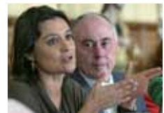
Seara durante la rueda de prensa.

También recaló la labor del programa de microcréditos cuyo objetivo "es proporcionar apoyo económico" además de "asesoramiento durante los dos años siguientes a la concesión