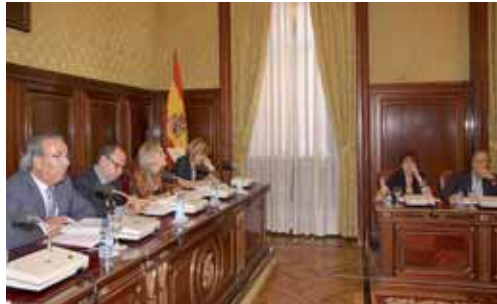
Imagen de archivo de un pleno celebrado en la Diputación Provincial.

Por otra parte, el pleno aprobó la Cuenta General de 2009, que ha de remitirse al Consejo Superior de Cuentas, y un expediente de modificación de créditos por importe de 581.000 euros destinado a los Ayuntamientos y a la cesión de dos tramos de carreteras a los