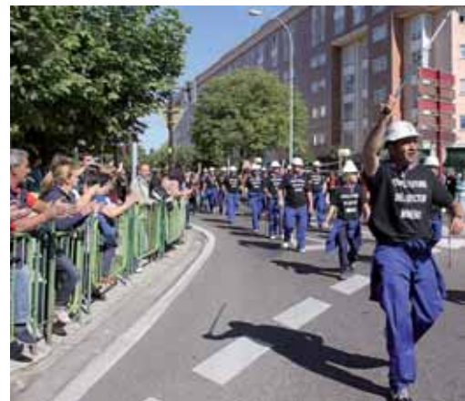
Numeroso público se acercó a recibirlos a su entrada a Palencia.

Se abre así una nueva etapa. La Comisión Europea dió luz verde al Real Decreto, pero exigió de forma firme al Gobierno español que no prorogue las subvenciones más allá del 2014. La lucha de los mineros esta ahora en conseguir que "estas ayudas no terminen dentro de cuatro años porque la minería sigue y la palentina de Guardo, debe de ser el futuro, no el punto y aparte".