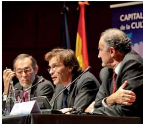
Representantes del comité de selección anuncian su fallo. MANUEL VADILLO

Los más de 200 periodistas acreditados y los representantes de las delegaciones no ocultaban sus nervios en el momento en el que el representante del comité europeo que ha realizado la selección comenzaba a enumerar por orden alfabético: Burgos, Córdoba, Donosti, Las Palmas, Segovia y Zaragoza.