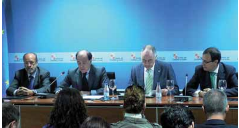
El convenio de colaboración fue alcanzado entre la Junta, los Ayuntamientos de Palencia y Valladolid e Iberdrola.

El Ayuntamiento ha elaborado un listado con las posibles ubicaciones