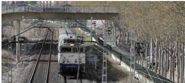
Imagen de archivo del ferrocarril a su paso por la capital palentina.

En el documento se recoge, que la partida principal de los presupuestos para Palencia será la referida al ferrocarril y, en especial, la de la construcción de la Línea de Alta Velocidad, que permitirá que el AVE llegue a la capital palentina en el año 2012.