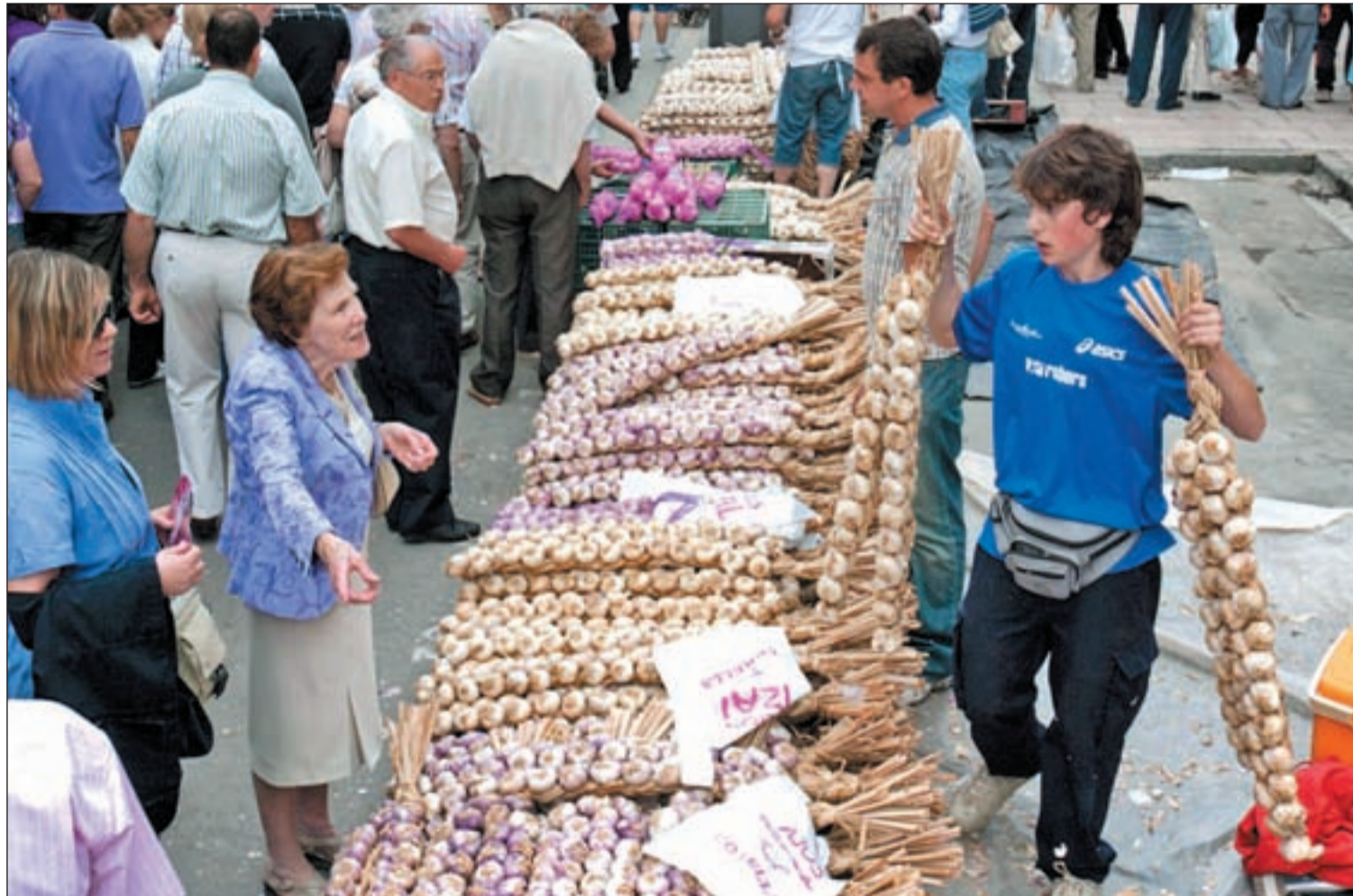
El tradicional mercado de los ajos con el que dan comienzo las primeras celebraciones de las fiestas de Vitoria

Acciones reivindicativas del cuerpo municipal durante las Fiestas • Este viernes se presentan las cuadrillas • Horarios especiales del tranvía Pág. 4