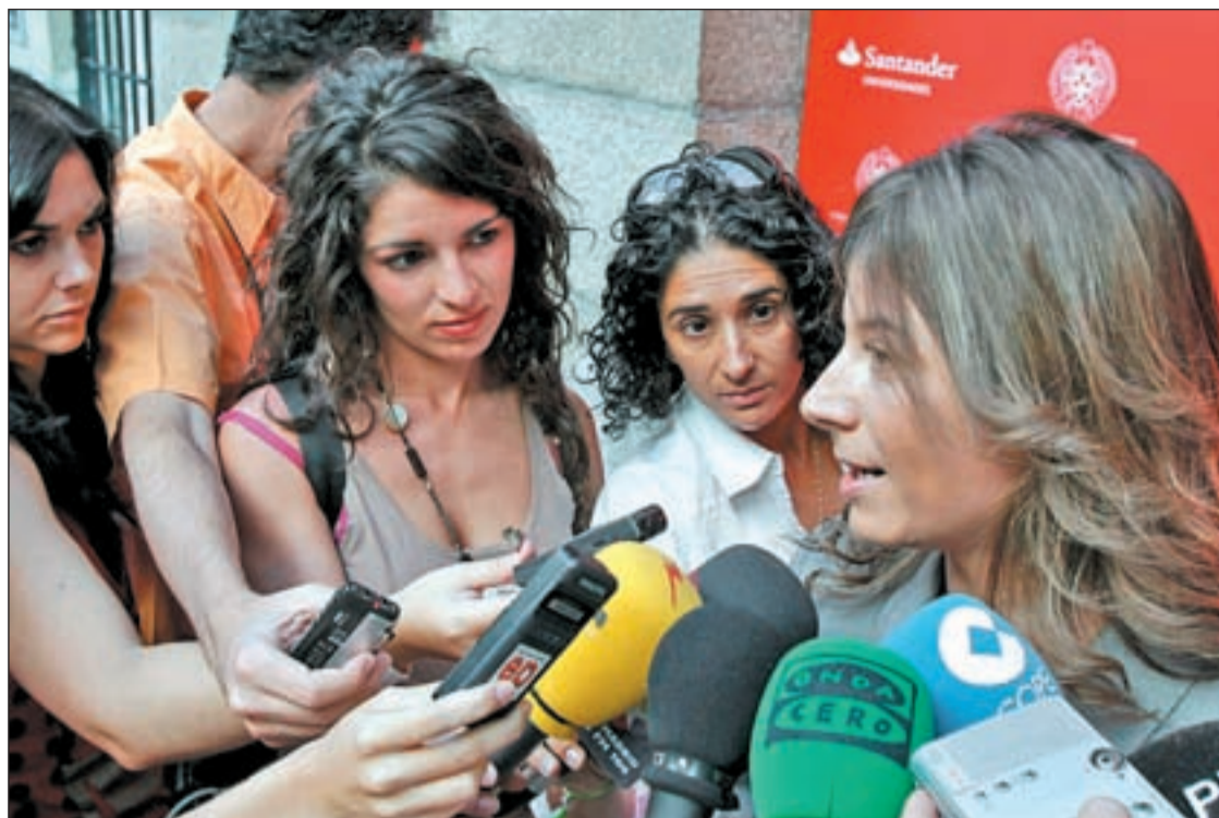
Bibiana Aído, ministra de Igualdad, atiende a los periodistas tras sus declaraciones

DATOS DE LA MINISTRA DE IGUALDAD EN UN CURSO SOBRE VIOLENCIA DE GÉNERO