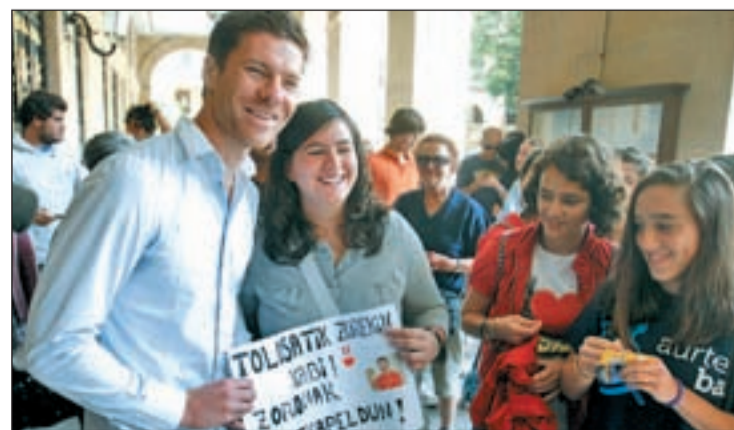
Xabi Alonso con unas fans el pasado lunes en Donostia

de los diversos actos de celebración la Cámara Vasca quiere sumarse a las celebraciones y los hará a través de la recepción oficial que ofrecerá la presidente del Parlamento, la 'popular' Arantza Quiroga a Javi Martínez, Xabi Alonso y Fernando Llorente.