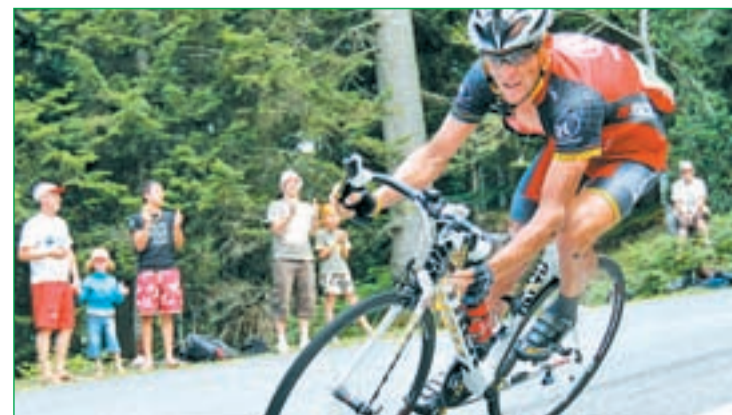
El norteamericano quedó lejos de los primeros puestos

quien no pudo lucirse en ninguna de las llegadas masivas que se dieron en esta edición del Tour. Pese a todo, Freire se retirará con un palmarés que incluye siete victorias de etapa en la Vuelta a España, cuatro en el Tour de Francia y, sobre todo, tres triunfos en el campeonato del mundo en ruta.