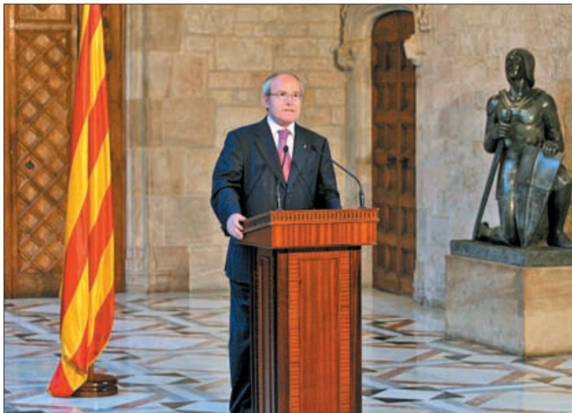
José Montilla, president catalán durante su valoración del fallo del Constitucional

El president, José Montilla ha pedido una reunión a José Luis Rodríguez Zapatero para comunicarle la necesidad de "rehacer el pacto político que en 2006 posibilitó el Estatut". Un pacto, no obstante, que el Gobierno no considera roto sino "reforzado". En estos términos se pronunció María Teresa Fernández de la Vega horas después de conocer el fallo del TC. "Satisfacción porque el Tribunal ha declarado constitucional el 99 por ciento del texto catalán". Mariano Rajoy, líder del PP, por su parte, abogó por