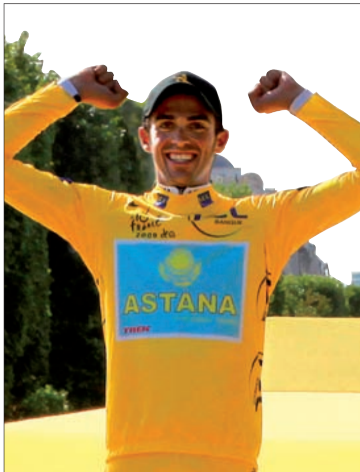
El pinteño en el podio de la edición de 2009