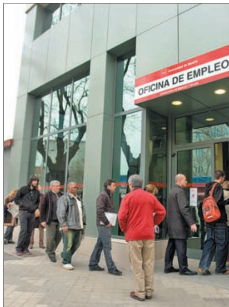
Personas frente a una oficina del INEM