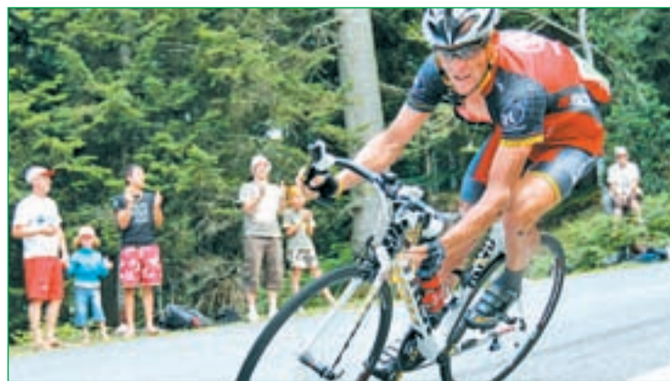
El norteamericano quedó lejos de los primeros puestos

quien no pudo lucirse en ninguna de las llegadas masivas que se dieron en esta edición del Tour. Pese a todo, Freire se retirará con un palmarés que incluye siete victorias de etapa en la Vuelta a España, cuatro en el Tour de Francia y, sobre todo, tres triunfos en el campeonato del mundo en ruta.