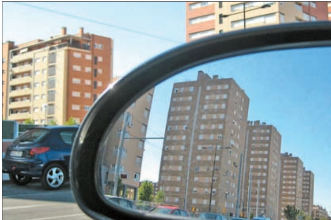
La concesión de hipotecas ha disminuido tras cuatro meses de subidas ininterrumpidas

Cuando faltan unos días para el cierre de julio, todo apunta que los últimos beneficiarios de una rebaja de las hipotecas, serán los que la firmen ahora. A partir de estas fechas todo indica que el nivel del euribor tenderá al alza, aunque de forma ligera y las revisiones serán algo más caras.