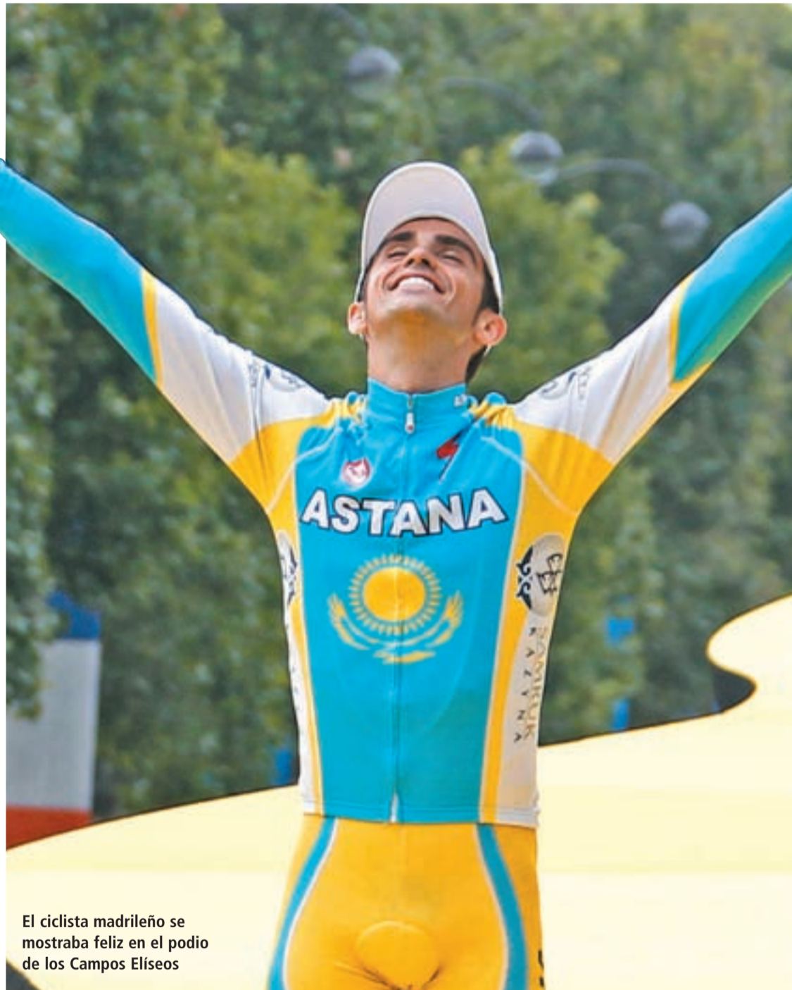
El ciclista madrileño se mostraba feliz en el podio de los Campos Elíseos

El corredor de Pinto volvió a ser el mejor en la ronda francesa y logró su tercera victoria en París · Su extenso palmarés le coloca entre los mejores