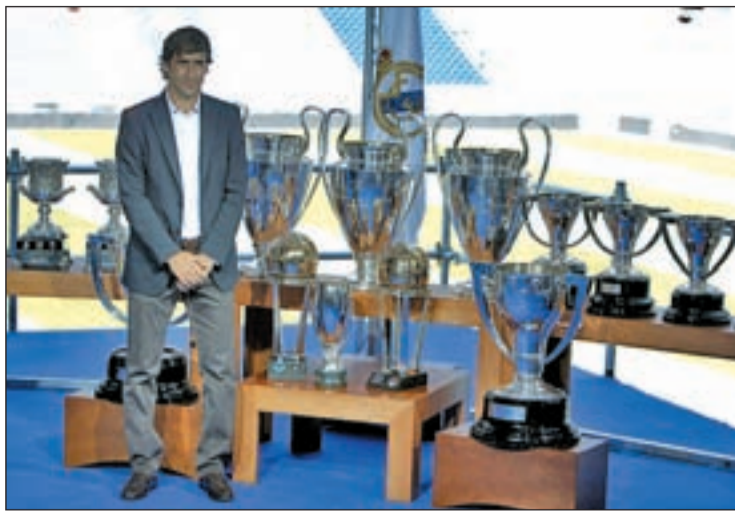
El delantero se despidió de los aficionados blancos