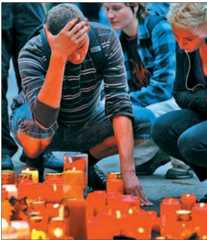
Velas y flores en recuerdo de las víctimas en Duisburg

El presidente del principal sindicato de policías en Alemania, Rainer Wendt, asegura que alertó a las autoridades locales. "Les advertí hace un año de que no era un lugar adecuado para la Love Parade. Es demasiado pequeño y demasiado estrecho", explicó Wendt, quien denunció que sus advertencias fueron ignoradas, pese a que en Bochum, sí escucharon a la Policía en 2009 y cancelaron la