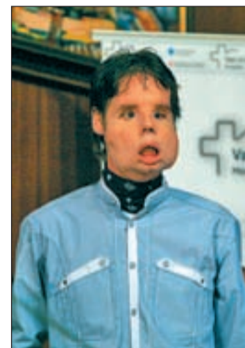
El paciente, en rueda de prensa

Pasear por la calle sin ser observado por los transeúntes, sentarse a comer en la mesa junto a toda su familia y salir a pescar y a cazar son los principales anhelos del paciente, que puede beber líquidos, y empezó a hablar dos meses después de la operación, que duró hasta