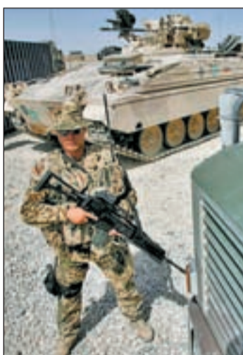
Un soldado de la ISAF

La página web Wikileaks ha obtenido más de 92.000 documentos secretos referentes a las