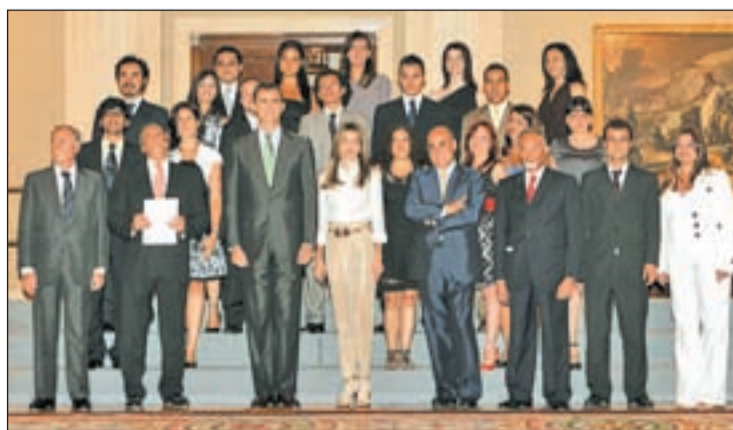
Los 19 participantes del Programa Balboa con los Príncipes de Asturias

D.P./ Los Príncipes de Asturias recibieron la semana pasada a los 19 jóvenes periodistas del IX programa Balboa. Un curso que se desarrolla en España destinado a fomentar el conocimiento y el respeto mutuo entre los países que forman la comunidad iberoamericana.