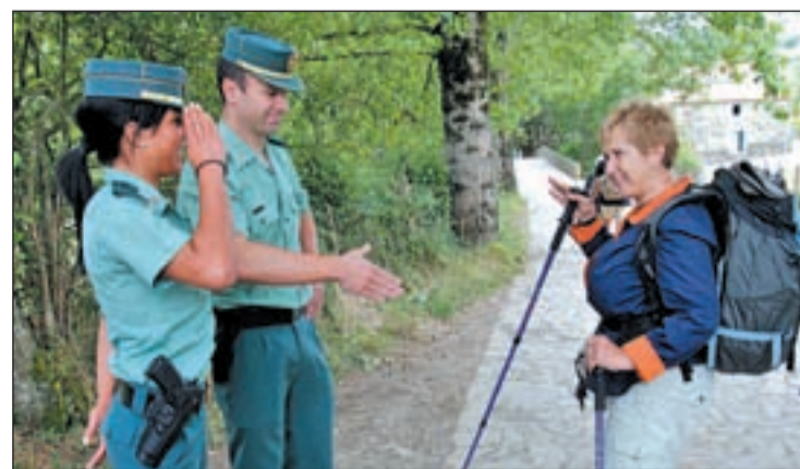
Una agente junto a su compañero y un peregrino

tiva adecuada a la conciliación familiar o a la no aplicación de la trasladada del Estatuto del empleado público", ha afirmado la asociación, que denuncia que cuando las guardias civiles son madres se enfrentan a "un problema" al no tener "medidas de conciliación reales".