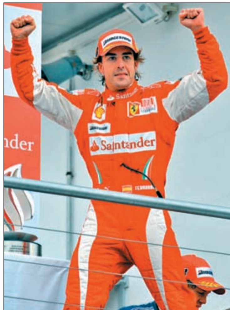
El asturiano en el podio de Hockenheim

Vettel y Webber, gracias a las buenas prestaciones de sus bólidos en las tandas de clasificación y, por supuesto, Hamilton y Button aparecen como serios candidatos a sumar los 25 puntos que se otorgan al ganador