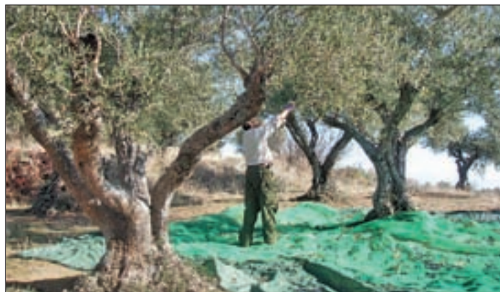
Las subvenciones comunitarias se prolongarán más allá del 2013

Uno de los beneficiados será el sector olivarero español que continuará con las subvenciones al aceite "balón de oxígeno" del mismo ante unos precios a la baja que por sí solos arruinan el campo andaluz.