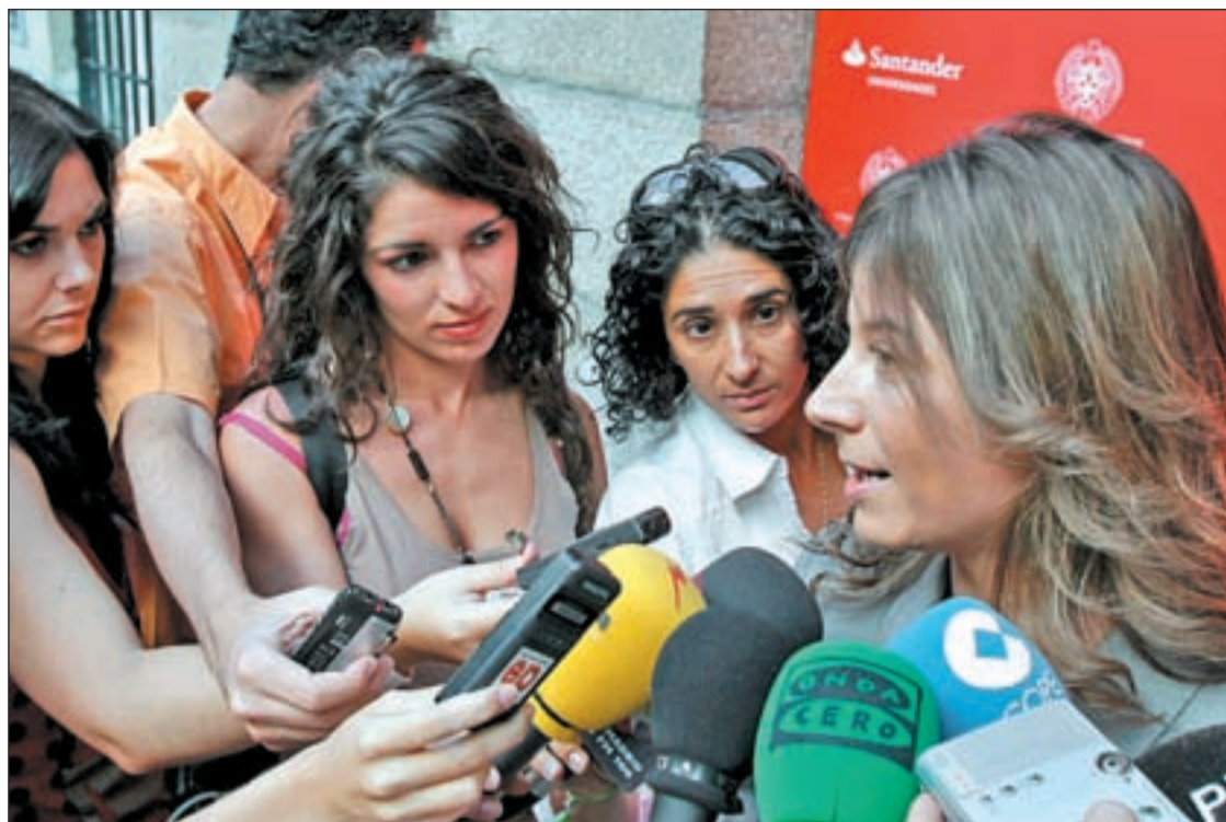
Bibiana Aído, ministra de Igualdad, atende a los periodistas tras sus declaraciones

DATOS DE LA MINISTRA DE IGUALDAD EN UN CURSO SOBRE VIOLENCIA DE GÉNERO