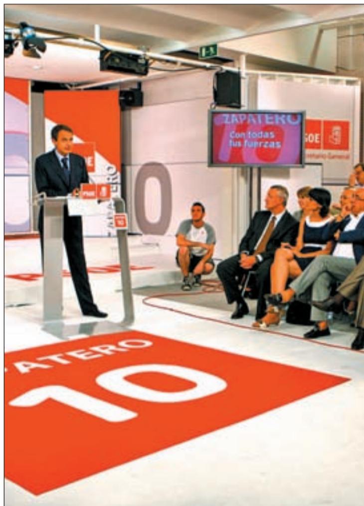
Zapatero en Ferraz durante un acto del partido

Por su parte, la secretaria de Organización del partido, Leire Pajín, se ha limitado a decir que "la dirección federal opinará sobre los candidatos en el momento oportuno". Un momento que parece que llegará en Septiembre cuando se presenten formalmente las candidaturas para los comicios locales y autonómicos. No obstante, Pajín sí ha puntualizado que Ferraz tendrá algo que decir sobre esta cuestión aunque "escucharán" a los militantes.