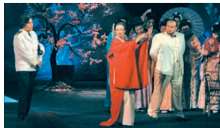
Un momento de la representación de 'Madama Butterfly' CONCERTLÍRICA

es de 20 y 25 euros. En el caso de estudiantes, desempleados y pensionistas, el coste será de 18 euros. Las entradas se pueden adquirir en la taquilla del Teatro, de 12,00 a 14,00 y de 19,00 a 21,00 horas, y a través del servicio de venta online del Teatro López de Ayala.