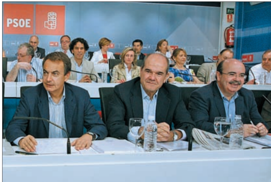
Zapatero, Chaves y Zarrías en el comité federal donde hubo muchas críticas por la adjudicación de Cajasur