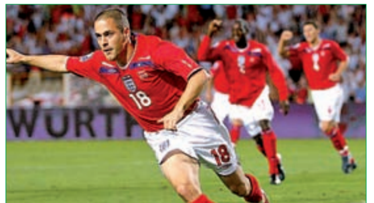
El internacional inglés Joe Cole, uno de los fichajes 'estrella'

Por contra, el Oporto no ha escatimado en los fichajes de Moutinho y James Rodríguez.