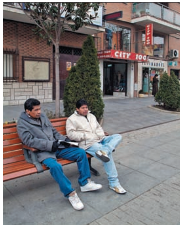
Dos inmigrantes sentados en un banco de Madrid

Según el informe 'Inmigración Internacional 2010' de la Organización para la Cooperación Económica y el Desarrollo