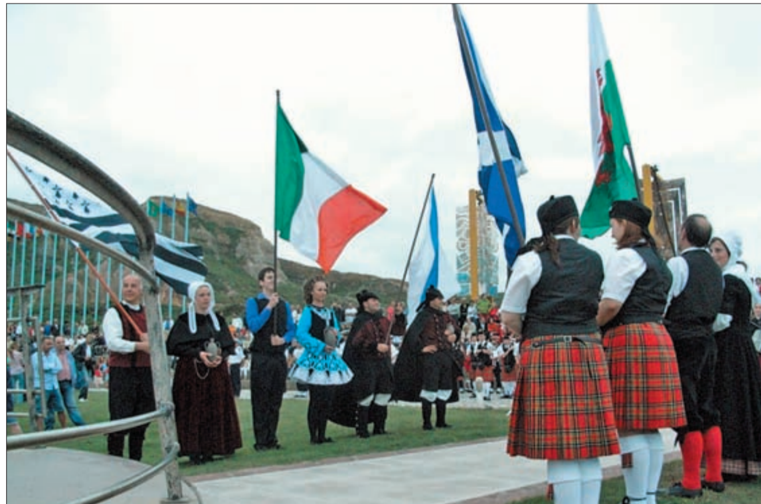
Imagen de archivo de las celebraciones del año pasado en el Festival Intercéltico de Avilés al que acuden representantes de otros países

Música, folklore y cultura de Irlanda, Escocia, Galicia y Asturias conviven en las celebraciones del Festival Intercéltico hasta el próximo 1 de agosto Pág. 4