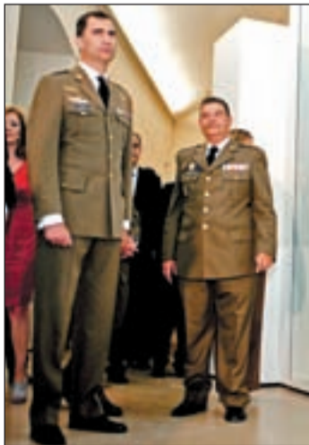
El Príncipe en la inauguración