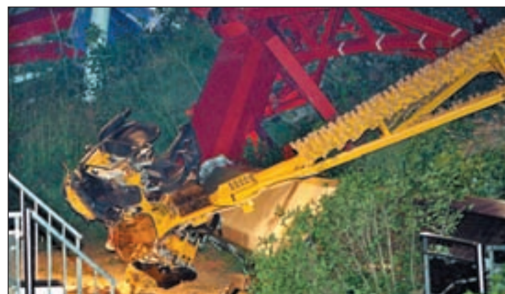
Estado de un brazo de "El Péndulo" tras el accidente

ya han recibido el alta médica, pone en el punto de mira la necesidad de extremar el "control en las atracciones" y "reforzar la seguridad". Aún no hay explicación oficial aunque un fallo en el cálculo del peso de los anclajes de 'El Péndulo' se perfila como causa del suceso.