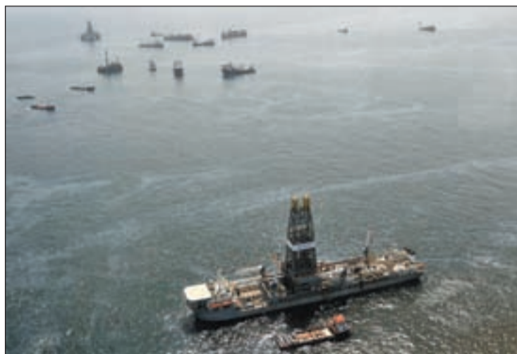
El buque de contención de petróleo Discoverer Enterprise

El Gobierno de Obama ha ordenado a BP “la reapertura de la válvula de contención” que tapona la salida de petróleo “lo más rápidamente posible” en caso de que “se confirme la filtración de hidrocarburos cerca de la boca del pozo”. La petición se ha formulado a través de una carta a la compañía británica que emitió el funcionario del gobierno de EEUU encargado de la limpieza del derrame, Thad Allen. El nuevo derrame ha sido detectado por ingenieros que vigilan el pozo. Además, miembros de la comu-