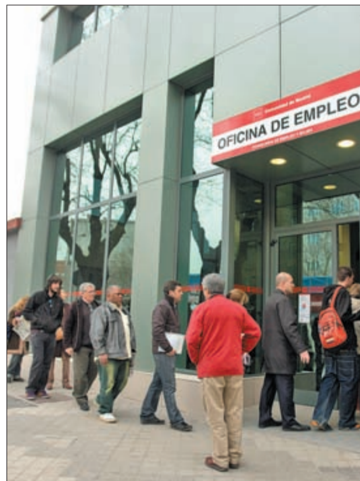
Personas frente a una oficina del INEM