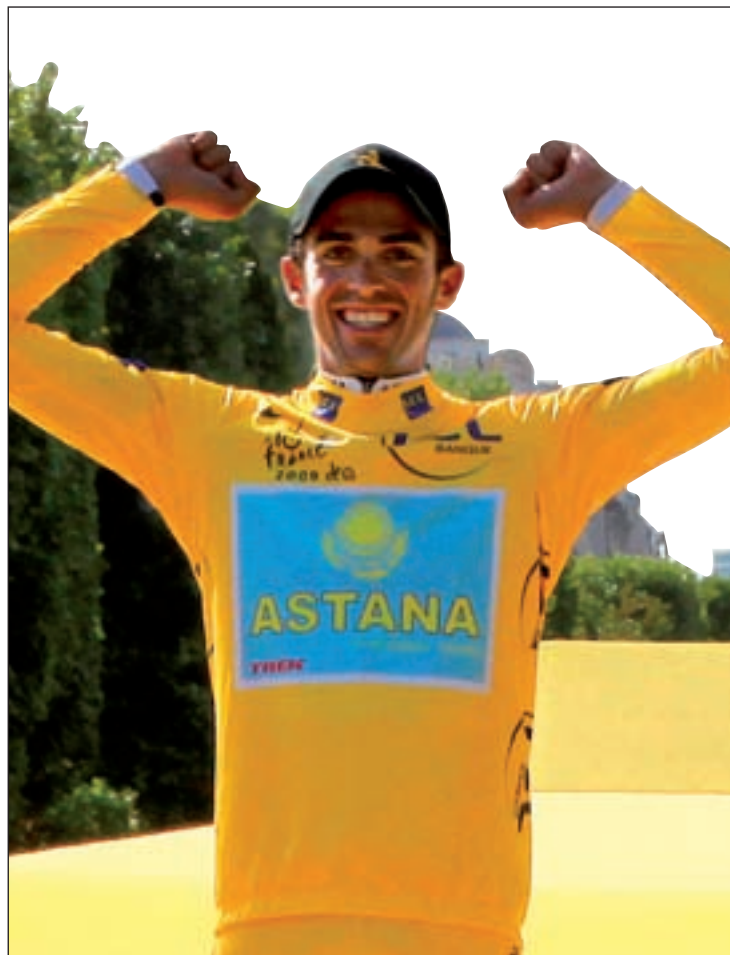
El pinteño en el podio de la edición de 2009

Con la salida de Armstrong de Astaná, el norteamericano creó junto a Bruyneel el Radio Shack Team. Con el heptacampeón como principal reclamo, el equipo de reciente creación ha conseguido aglutinar a algunos de los mejores ciclistas del pelotón internacional. Así, el alemán Andreas Klöden, el estadounidense Levi Leipheimer, o el reciente ganador de la Dauphine-Libere, Janez Brajkovic, serán algunos de los gregarios de lujo con los que contará Lance Armstrong para intentar acabar con el reinado de los ciclistas españoles. Desde 2005,