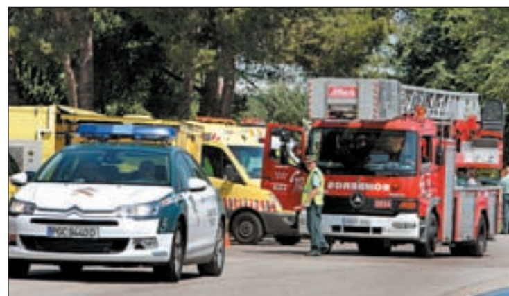
Bomberos y sanitarios en el cuartel de Valdemoro

en el Colegio del Instituto Armado. El portavoz de Protección Civil explicó que ha sido "un accidente bastante aparatoso", que ha tenido lugar en una "zona muy complicada", como "una especie de sótano". En la extinción del fuego también participaron los bomberos.