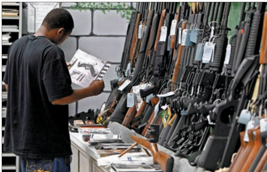
Un cliente en la tienda de armas Bulls Eye Pistol Range en Wichita, Kansas

EL TRIBUNAL SUPREMO PROHIBE NUEVAS NORMATIVAS PARA CONTROLAR LAS ARMAS