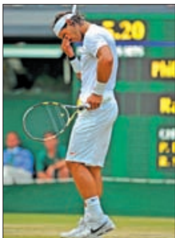
Nadal, en Wimbledon