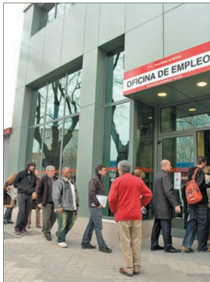
Personas frente a una oficina del INEM