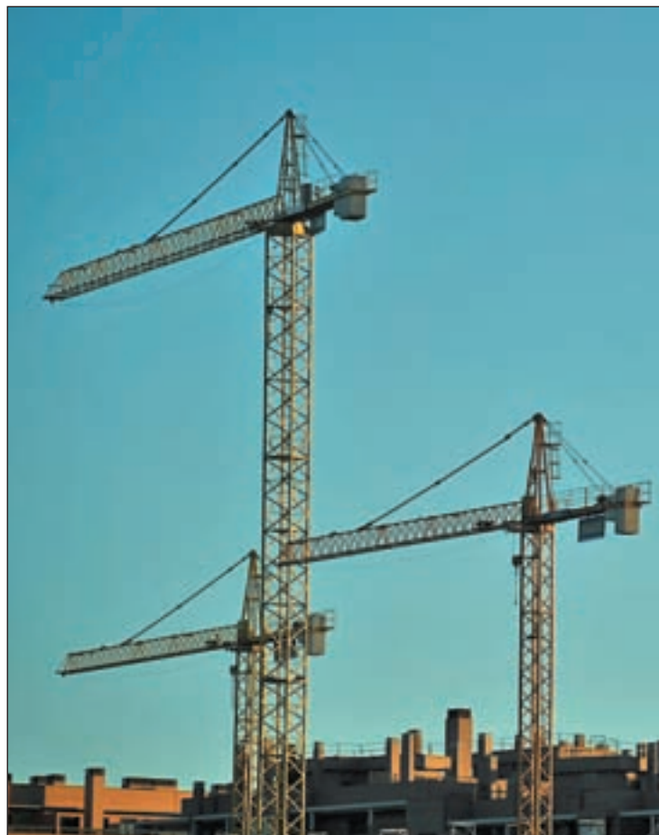
El sector de la vivienda frena su mejora

El tipo de interés medio a que se prestaron dichas hipotecas fue del 3,92 por ciento, lo que supone una caída del 16,8 por ciento en relación a idéntico mes del año precedente.