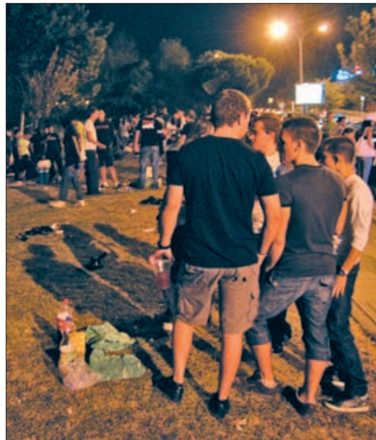
Jóvenes bebiendo al aire libre GENTE

Otro de los principales inconvenientes tampoco se ha so-