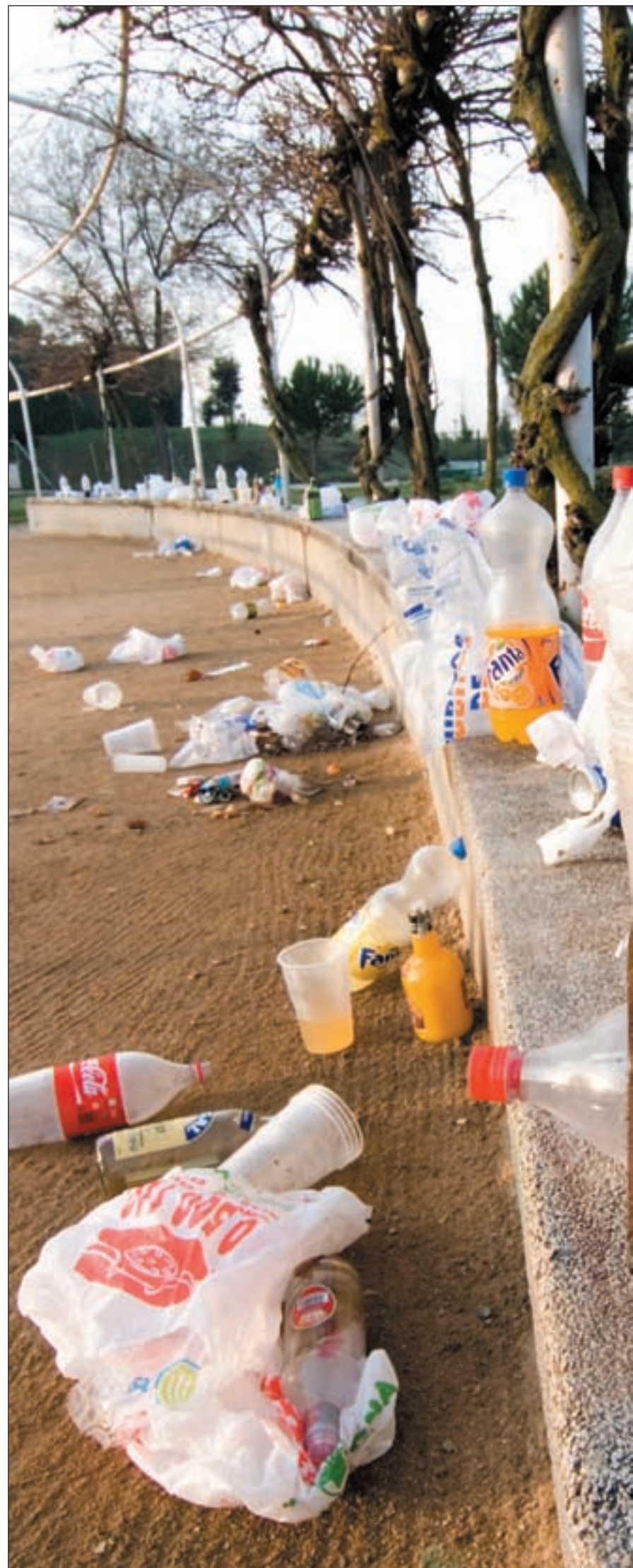
Aspecto que presentaba un madrileño parque a la mañana siguiente de acoger un mult...

La citada Junta de Andalucía, por ejemplo, prohíbe “la permanencia y concentración de personas que se encuentren