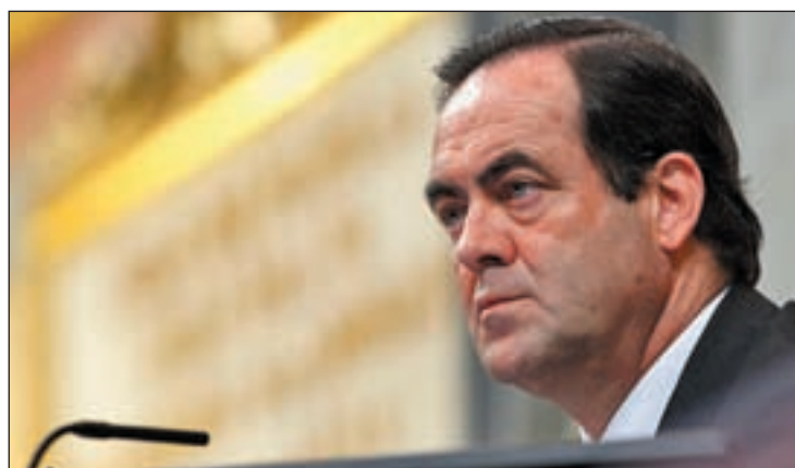
El ex presidente de C-LM y actual presidente del Congreso, José Bono

dana de Seseña. EL Tribunal cree que Bono no cumplió "adecuadamente" sus funciones de ordenación. El PP manchego pide investigaciones, mientras Bono proclama su inocencia "sonriendo y con estricta legalidad" y lamentó "sufrir una campaña de difamación".