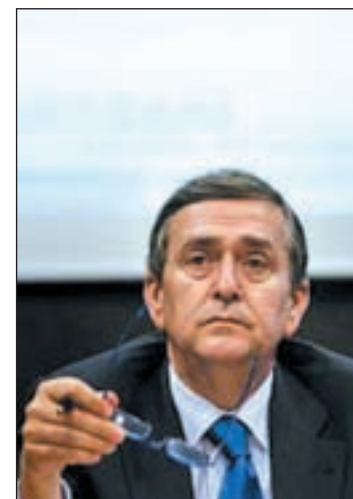
Velázquez en rueda de prensa

Durante los cuatro días, donde un total de 256.700 agentes han conformado este dispositivo policial especial, se han incautado cerca de 2000 kilos de drogas de todo tipo, principalmente cocaína, cannabis y he-