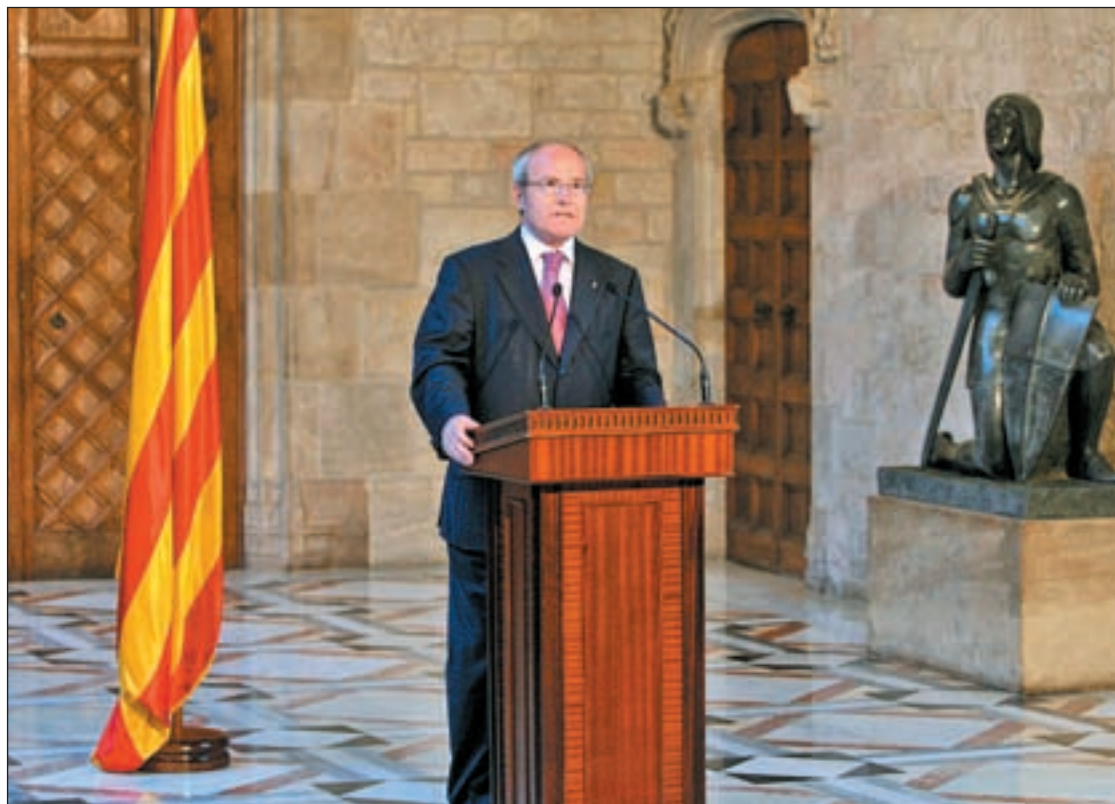
José Montilla, president catalán durante su valoración del fallo del Constitucional

El president, José Montilla ha pedido una reunión a José Luis Rodríguez Zapatero para comunicarle la necesidad de "rehacer el pacto político que en 2006 posibilitó el Estatut". Un pacto, no obstante, que el Gobierno no considera roto sino "reforzado". En estos términos se pronunció María Teresa Fernández de la Vega horas después de conocer el fallo del TC. "Satisfacción porque el Tribunal ha declarado constitucional el 99 por ciento del texto catalán". Mariano Rajoy, líder del PP, por su parte, abogó por