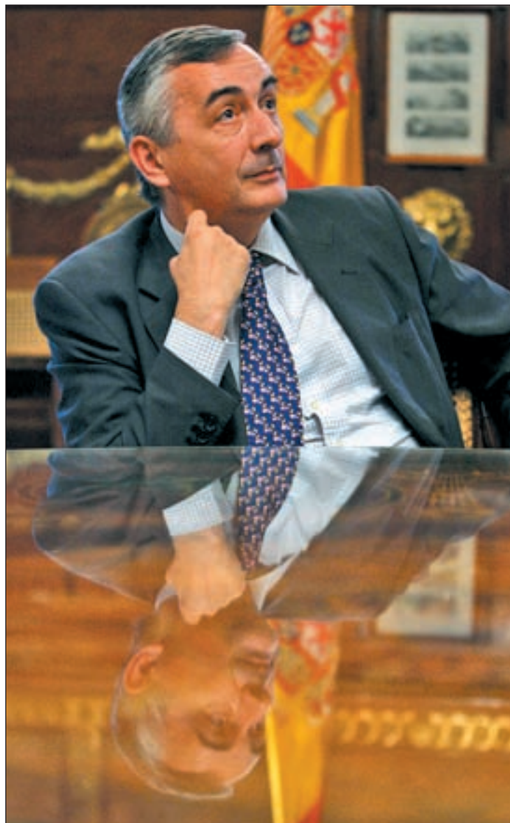
Carlos Ocaña alerta de nuevas alzas en algunos impuestos

El Secretario de Estado admitió que se pueda producir algún ajuste que garantice cierta equidad y justicia en el reparto de los costes de la crisis y añadió, en este sentido, que hay