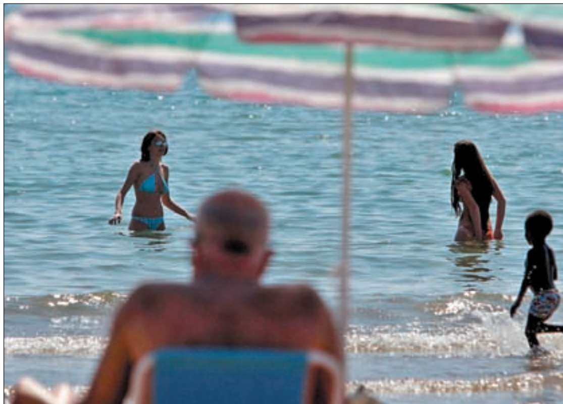
Varios veraneantes disfrutan de sus vacaciones en una de las playas de Valencia

Casi un 58% de los españoles veranean en familia. A la cabeza están los procedentes de Ceuta y Melilla, que escogen esta opción en un 71%, seguidos por aragoneses y madrileños. En el lado contrario están Galicia, con el 45%, La Rioja y Cataluña. La segunda opción de los españoles para veranear es en pareja, que es la opción para el 29,8%. Por último, los amigos son la última preferencia: sólo