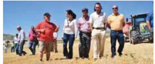
La consejera acompañada por dirigentes sindicales durante la visita.

La superficie de cereales, exceptuando el maíz, es de 1.901.603 hectáreas y una producción de 5.978.041 toneladas. Supone un incremento de un 2,2% en superficie, 40.843 hectáreas más, y un 51,2% más de pro-