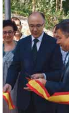
Momento del corte de cinta.

La obra de acondicionamiento de esta nueva zona verde ha sido financiada a través de los Planes Provinciales por la Dipu-