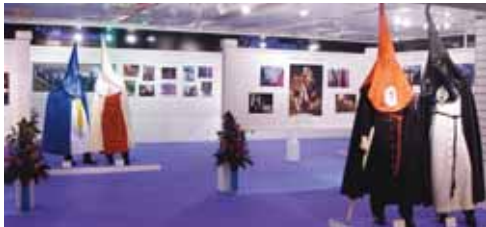
La Semana Santa de Rioseco cuenta con gran aceptación.