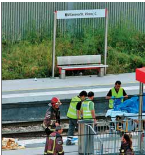
Forenses retiran los cuerpos sin vida de las vías

En ese momento apareció un Alaris que cubrían el trayecto Alicante- Barcelona. El maqui-