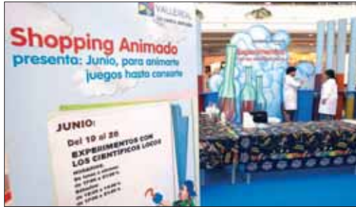
'Talleres científicos', nueva actividad del programa 'Shopping Animado'.

hemos centrado en organizar actividades que garanticen que el centro sea un referente del 'Shopping Animado'. Siempre tenemos alguna actividad para nuestros clientes, centrándonos sobre todo, en el público infantil, ya que Valle Real es un centro dedicado a la familia. Estamos