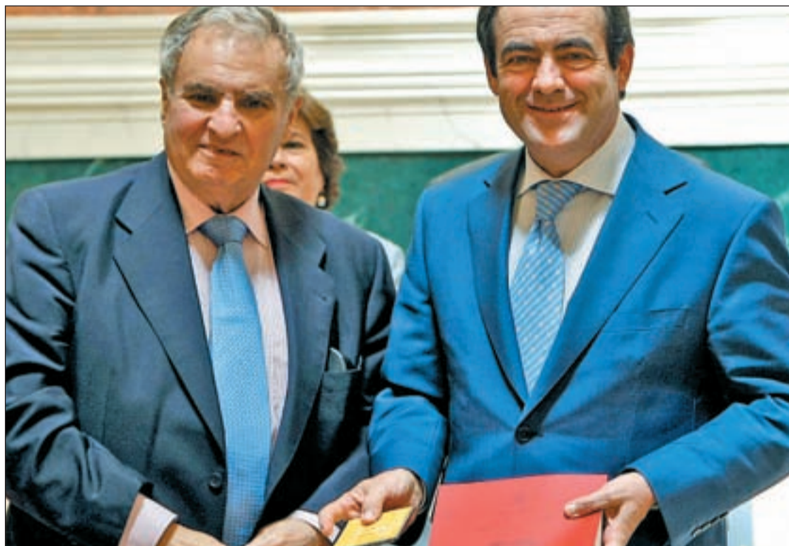
Enrique Múgica, Defensor del Pueblo, entrega su Memoria anual a José Bono en el Congreso

Las "disfunciones" en los impuestos, las telecomunicaciones, la ordenación económica y financiera o los transportes, todos ellas englobadas en el paraguas del sector económico fueron las que coparon un mayor número de quejas en 2009 ante el Defensor del Pueblo según su memoria. El número llegó hasta las 6.220. La política social y la Sanidad también moti-