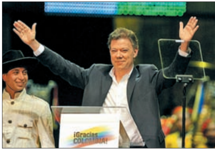
Juan Manuel Santos, presidente electo de Colombia

"A las FARC se les agotó su tiempo". Éste ha sido uno de los principales mensajes que lanzó el presidente electo de Colombia, Juan Manuel Santos, en su primer discurso como mandatario. "Colombia está saliendo de su pesadilla del secuestro y la violencia; mientras insistan en sus métodos terroristas, mientras insistan en atacar al pueblo colombiano no habrá diálogo y las seguiremos enfrentando con toda la dureza, con toda la firmeza", apostilló Santos.