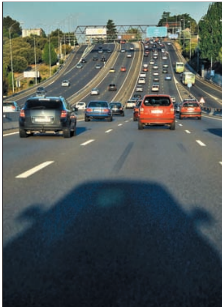
El nuevo IVA hará que suba el precio de los coches

Sin embargo, si que se aplicará una subida en las bebidas alcohólicas del 16 al 18, lo que a juicio de CEACCU, va a suponer por familia unos 617 euros. En el caso del ocio, espectáculos y cultura la subida a aplicar será de un punto.