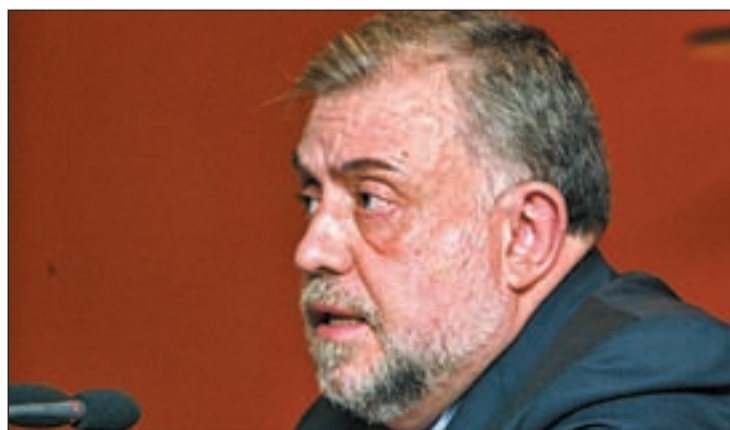
Octavio Granados, secretario de Estado de Seguridad Social

más en los primeros cuatro meses, según Octavio Granados Secretario de Estado de la Seguridad Social. En estos datos han influido el adelantó de compras por la subida del IVA en julio y la austeridad y racionalización en la contención del gasto, según Granados.