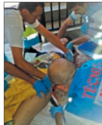
Apuñalamiento en Madrid

de protección han bajado un 10% en comparación con el año 2009, irónicamente en uno de los peores periodos para las víctimas. Desde enero 2010 hasta el 16 de junio esta lacra social ha sumado ya 32 mujeres asesinadas a manos de su parejas o ex parejas.