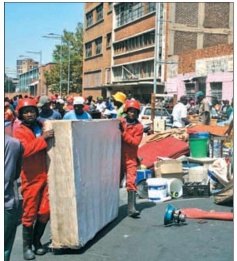
Las hormigas rojas ejecutando un desalojo SARA HJALMARSON

En Durban, el puerto clave de África oriental, se ha ubicado una de las sedes del Mundial. En sus inmediaciones, la nota discordante la pone un mercado tradicional, el Early Morning Market. Un mercado donde cerca de 7.000 personas consiguen ingresos para sobrevivir y que sin él su día a día aún sería más complicado. Un mercado que es una golosina para inversores, como el grupo Isolenu que propuso al Ayuntamiento crear un moderno centro comercial para turistas. Finalmente, y ante la resistencia de los comerciantes, el merca-