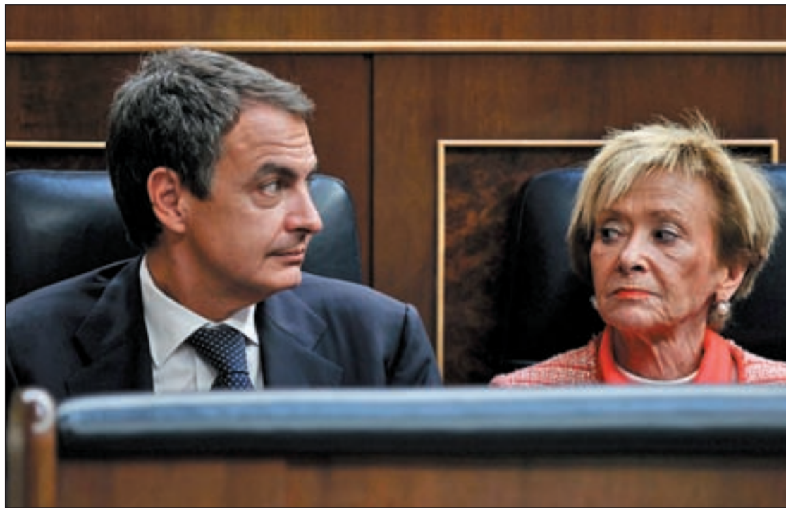
José Luis Rodríguez Zapatero, presidente del Gobierno, junto a María Teresa Fernández de la Vega

Los consejos de administración de Caja Madrid y Bancaja aprobaron el 10 de junio iniciar el proceso para la formación de un SIP entre estas dos entidades y Caja Ávila, Caja Segovia, Caja Rioja, Caixa Laietana y Caja Insular de Ahorros de Canarias. La integración dará lugar a la primera caja de España en volumen de activos por delante de 'La Caixa'. Sumará más de 339.000 millones de euros en activos y desbanca a 'La Caixa' y Caixa Girona como primera caja de ahorros.