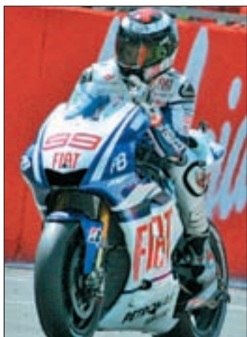
El mallorquín ya es primero