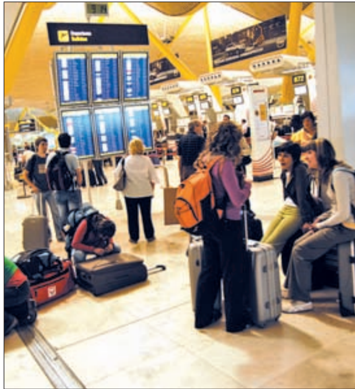
Pasajeros esperan en una terminal aeroportuaria

de los controladores, cambios sustanciales en la organización del servicio. "La opinión pública nos ha condenado por nuestros salarios, pero es necesario explicar que las horas extras que AENA demandaba de nosotros porque no se ha preocupado de formar a más controladores, eran lo que duplicaban los mismos", apunta Cabo, al tiempo que matiza que "ganar mucho no significa perder los derechos. AENA habla de dinero y nosotros de condiciones laborales". USCA, el sindicato que engloba al 97% de los 2.400 que operan en nuestro país, denuncia que la empresa ahora impone trabajar de manera "inexcusable" cuando desee fuera de los turnos estableci-