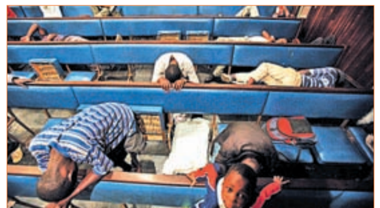
Solicitantes de asilo en la Iglesia Metodista ROBIN UTRECHT

este mes donde muchos migrantes buscan las migajas del Mundial. La zona caliente para estas miles de personas es Musina, frontera con Zimbabue. Una media de 300 personas al día solicitan asilo en la Oficina de Recepción del Refugiado. Sólo un 1% obtienen el estatus de refugiado.