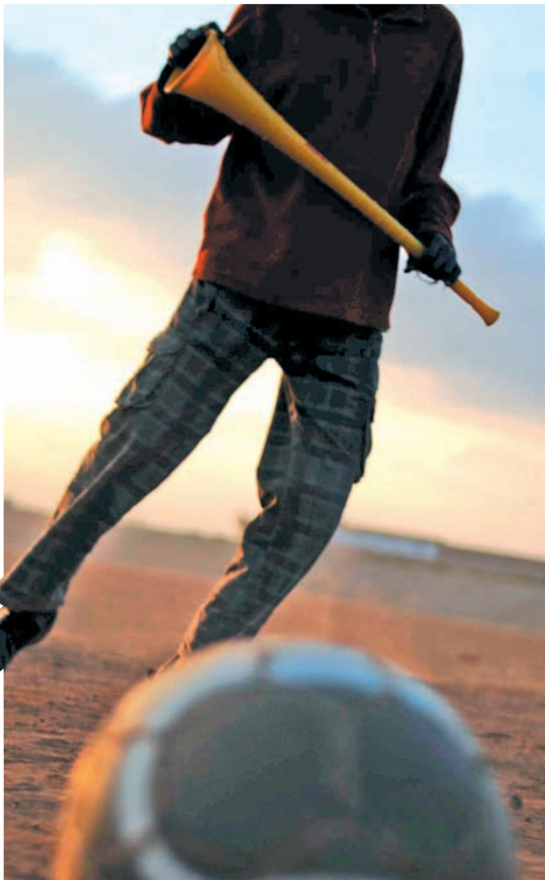
Un niño sudafricano juega al fútbol sin césped, ni primas económicas, ni vuvuzelas

Según la FIFA, del cómputo total, que cifra en 6.269 millones de dólares el coste de la organización del torneo, el anfitrión desembolsará más de 2.500 millones de dólares. Es decir, un 1% de su PIB y un 3,4% de su deuda externa. Una inyección económica que se ha materializado en la construcción de nuevos estadios, carreteras, aeropuertos y un lavado de imagen de los principales centros urbanos que Sudáfrica exhibe con orgullo. El Mundial es un hervidero de sueños, aunque algunos temen que se conviertan en pesadillas. Según datos ofrecidos por el ministro de Economía del país, Pravin Gordhan,