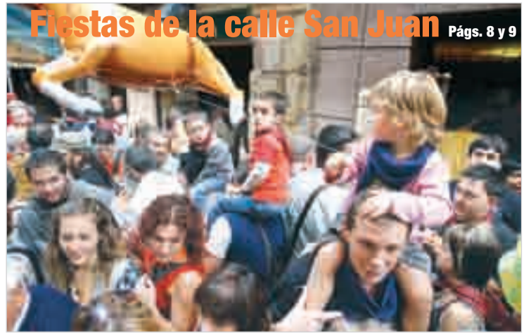
Fiestas de la calle San Juan Págs. 8 y 9