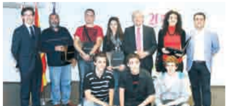
Entrega de premios en el IRJ del concurso.