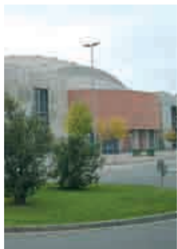
Palacio de Deportes de La Rioja.

Con el partido que enfrentará España y Chile el viernes 25 de junio a partir de las 20.30, dará comienzo el calendario de retransmisiones. Las puertas del Palacio de Deportes se abrirán una hora antes del inicio del partido.