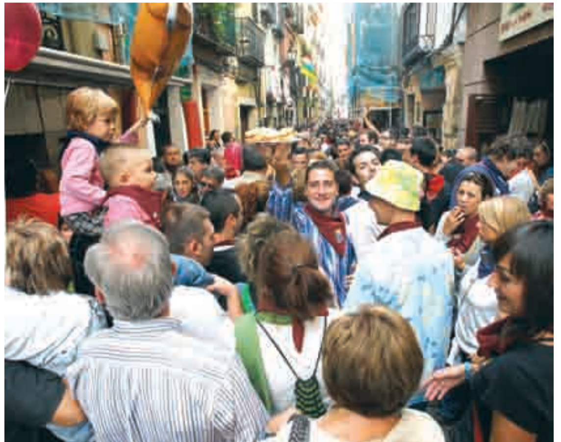
Ambiente de la San Juan, se llenan los bares, y la calle también.