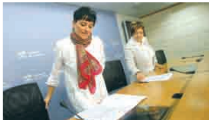
Sagrario Loza, consejera de Servicios Sociales, en rueda de prensa.