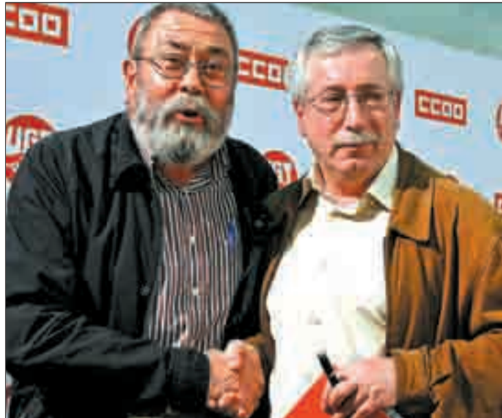
Cándido Méndez e Ignacio Fernández Toxo, de UGT y CC OO

Los dos sindicatos mayoritarios, UGT y CC OO, coinciden en reseñar que la reforma laboral no sólo es lesiva para los derechos de los trabajadores sino que la forma de desarrollarse ha sido "un duro golpe a la negociación" entre