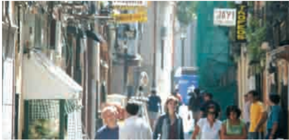
Ambiente en la calle San Juan del Casco Antiguo de Logroño.