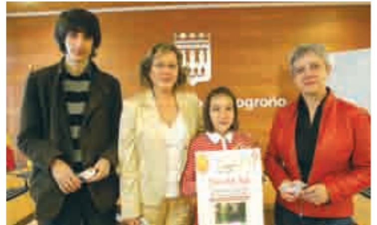
Presentación del concierto.