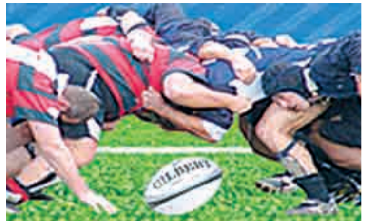
Partido de rugby.

En la competición, en la que participarán 8 equipos, dos de ellos internacionales, partirá como local el equipo de la ciudad, el cuál, según los organizadores, puede ser uno de los aspirantes al título según el juego desarrollado esta temporada.