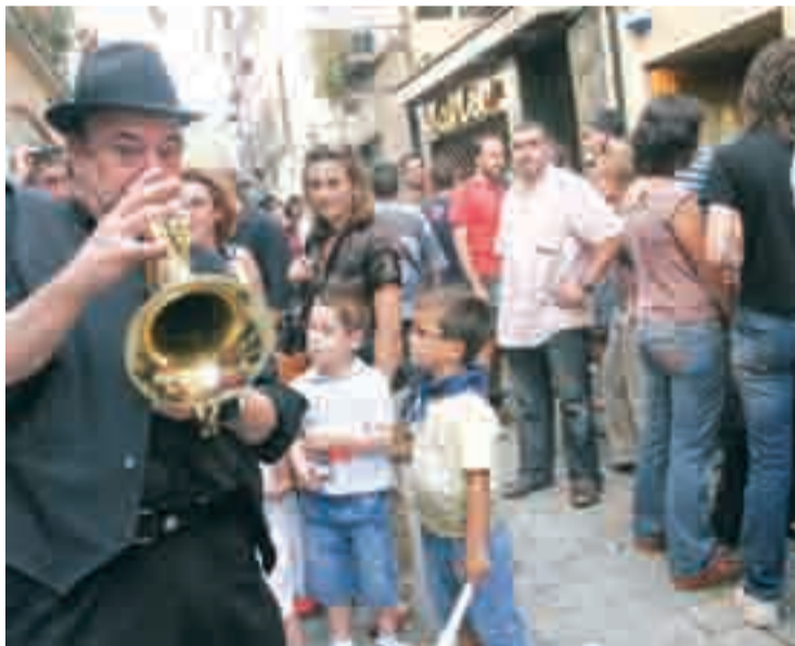
Un músico ameniza la fiesta.