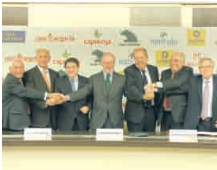
Presidentes de las 7 entidades.

Esta unión vía SIP permitirá al Grupo establecer sinergias y reforzar la liquidez y solvencia así como ampliar la cobertura geográfica para dar mejor servicio a familias y empresas.