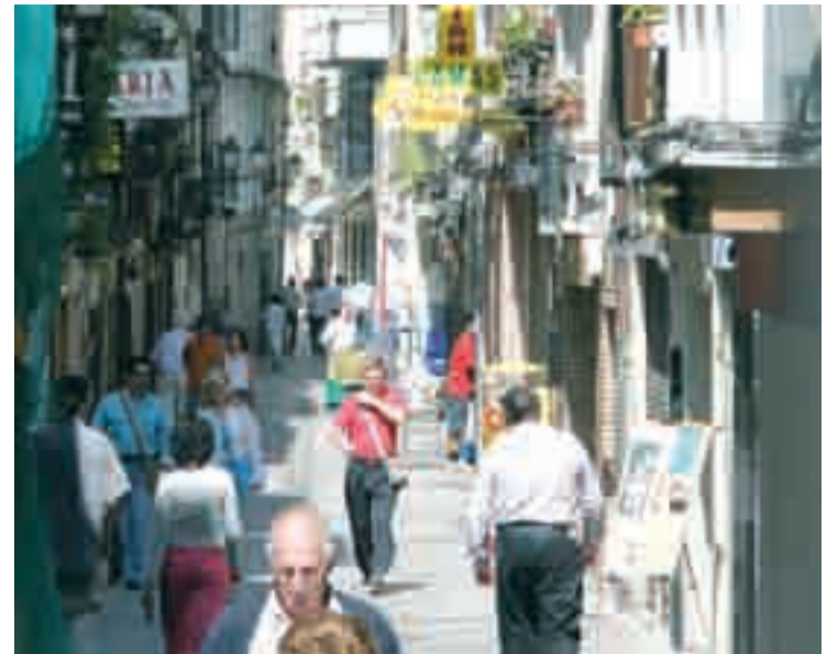
Fiesta o no fiesta, siempre transitada.

En los últimos años incluso se les ha dado un plus de sabor con iniciativas singulares, como fue recuperar los nombres de los establecimientos de hace 40 o 50 años o la edición de un juego de postales con las estampas de Eguluz sobre la calle.