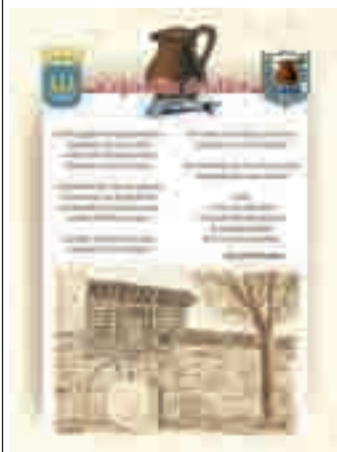
Cartel del himno.

Frente al galo enemigo acechante, logroñeses de brío y valor resistir junto al Ebro supieron liberando el asedio invasor. Cofradía del pez, que en Logroño rememoras con bondo fervor del pasado la fecha que marca unidad, fortaleza y honor. Revellín: cada once de junio orgullosos de la tradición, con el pez, con el pan, con el vino, voto ofrece a su santo patrón. Con grandeza hoy te canta Logroño, mil gargantas y una sola voz: ¡Y viva San Bernabé! es nuestro patrón glorioso. La Cofradía del pez, de ti se siente orgulloso.