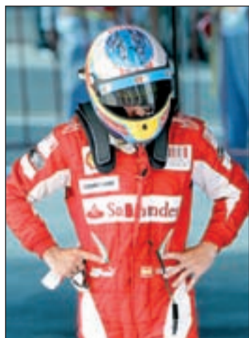
El piloto asturiano