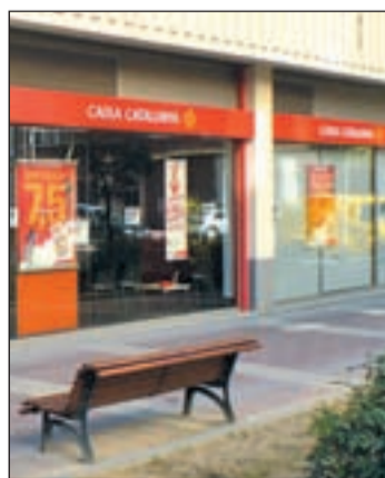
Despidos en las cajas catalanas

cial señala que se hace así por motivos de rentabilidad y que se ofrecen puestos en Cataluña a los afectados. No obstante, desde fuentes menos afines a las mismas se señala que esto es consecuencia de un pacto alcanzado en su día con los sindicatos de Cataluña.