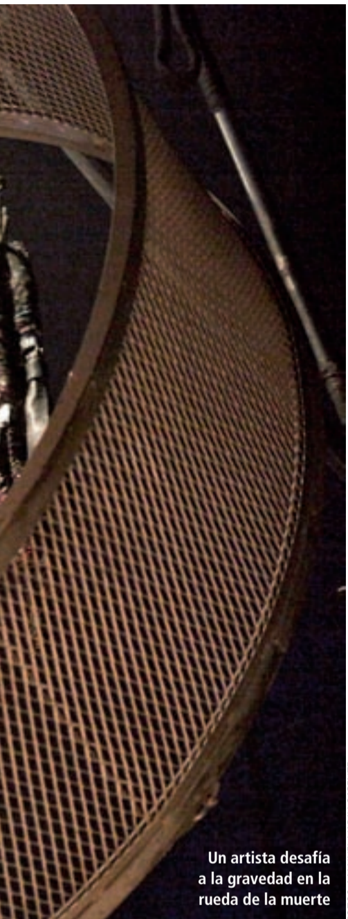
Un artista desafía a la gravedad en la rueda de la muerte