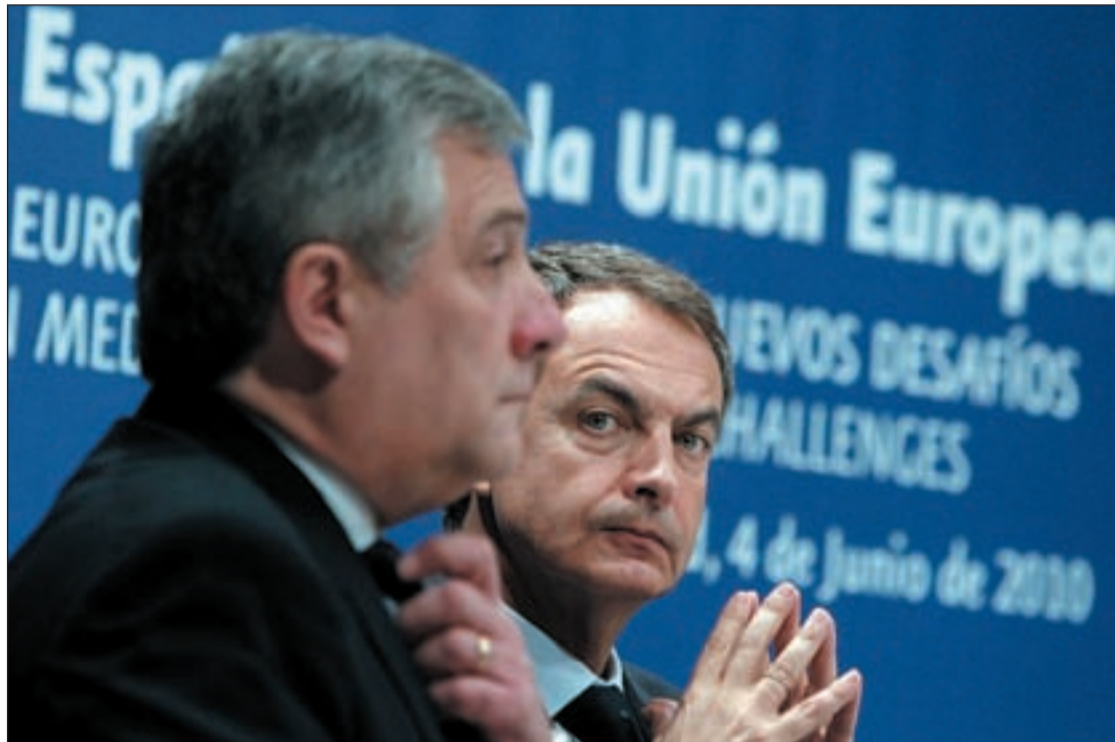
José Luis Rodríguez Zapatero durante una de las últimas reuniones en el marco de la presidencia de la UE

Decenas de ministros y mandatarios han visitado España, han celebrado reuniones formales e informales, cumbres, seminarios y jornadas. Bruselas ha sentido el flamenco y ha probado nuestros sabores. Pero el semestre de la presidencia española de la UE ya encara su final. Seis meses más convulsos de lo previsto, debido a las medidas de recorte del Ejecutivo español y a la presión del núcleo duro de Europa para acometer estas medidas y para solventar el problema de la deuda helena, entre otros grandes temas y tensiones. Pero también han quedado imágenes para la historia, como la cita con los países latinoamericanos y del Caribe en Madrid o la foto de un presidente español en el día de la oración en la Casa Blanca.