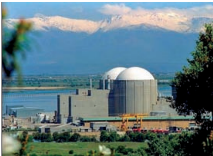
Imagen reciente de la central de Almaraz, en Cáceres