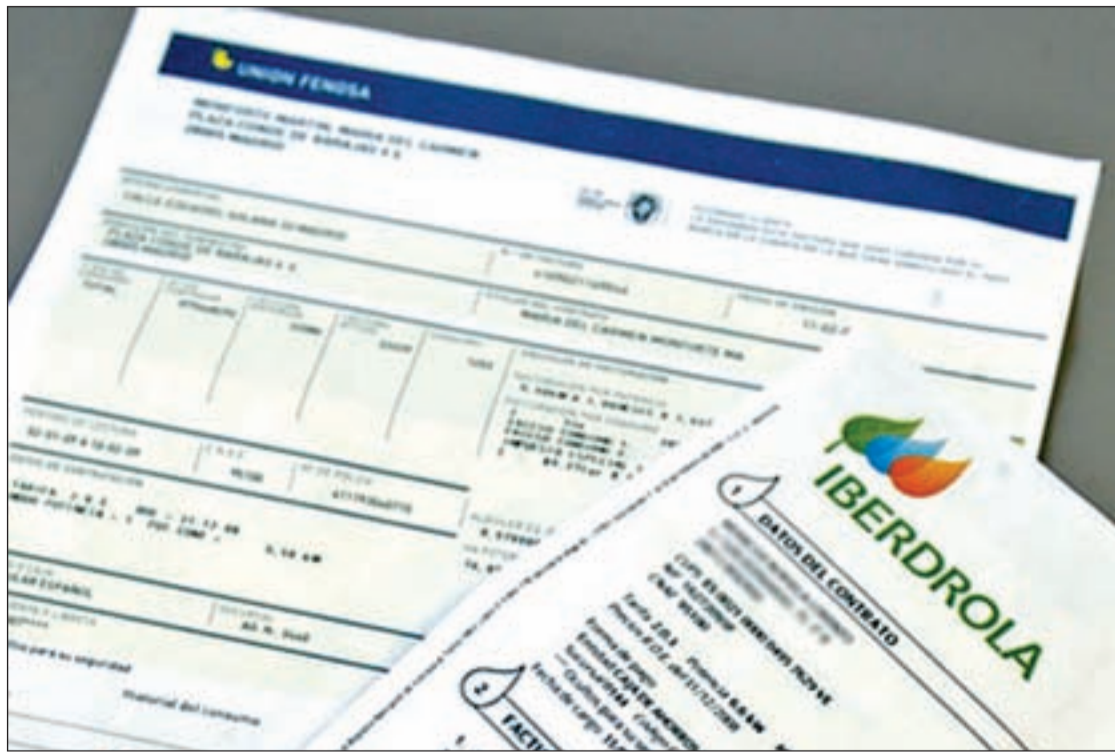
Facturas de dos compañías eléctricas que verán incrementadas sus tarifas

En el resto de zonas, por orden de descensos, de mayor a menor, presentaron los siguientes resultados en esta apartado: Costa Mediterránea, un -21,5 por ciento, Áreas Metropolitanas, (-17,7), Grandes Ciudades (-17,1) y Baleares y Canarias con un (-13,5 por ciento).