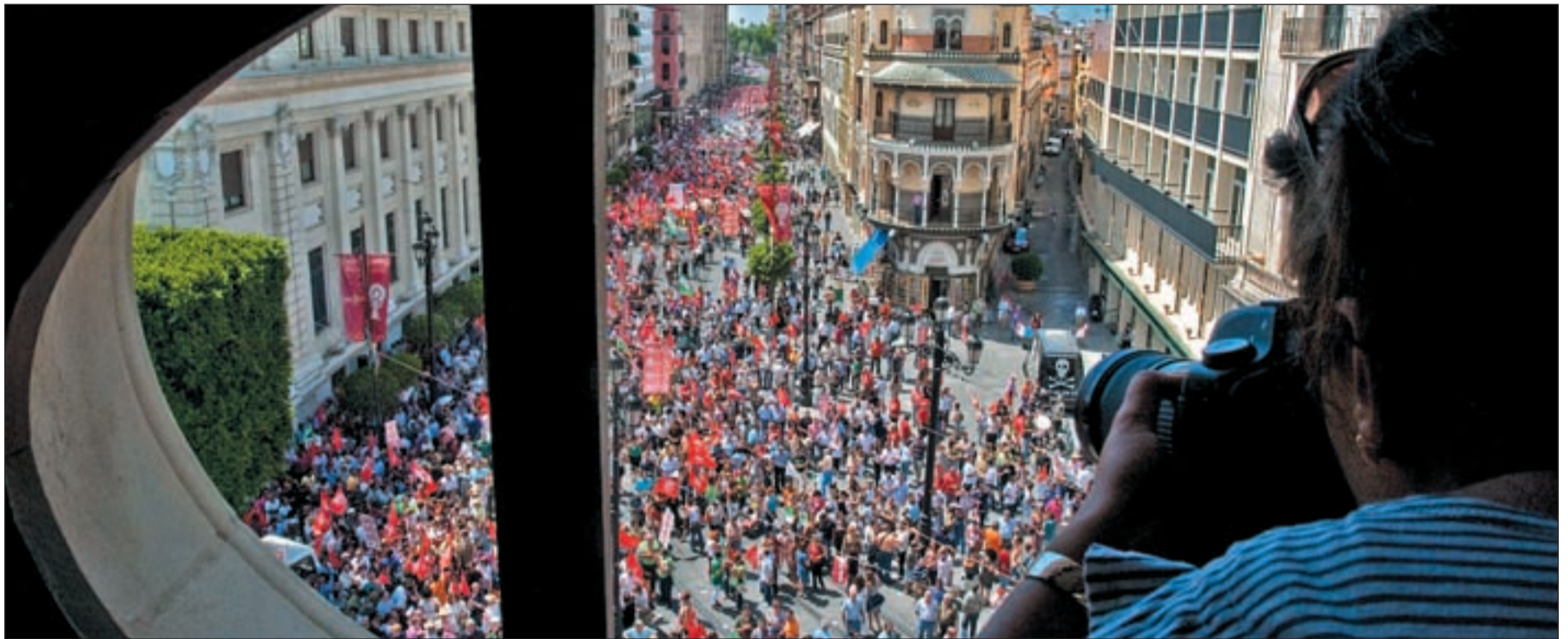
Imagen aérea de la manifestación de empleados públicos por las calles de Sevilla el pasado martes