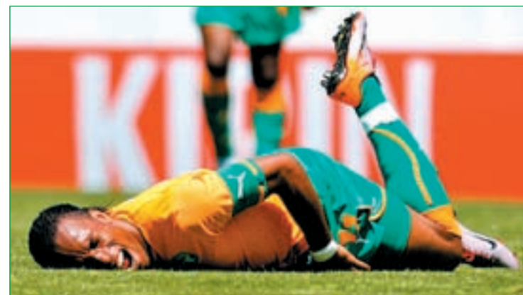
El delantero de Costa de Marfil cayó lesionado ante Japón

frica aunque no se encuentren al 100%. El ex jugador del Real Madrid sufrió una lesión muscular ante Hungría y se llegó a especular con su baja, al igual que Didier Drogba quien ha sido operado de una fractura de cúbito. El último en sumarse a esta lista de ausentes es el extremo de Portugal Nani.