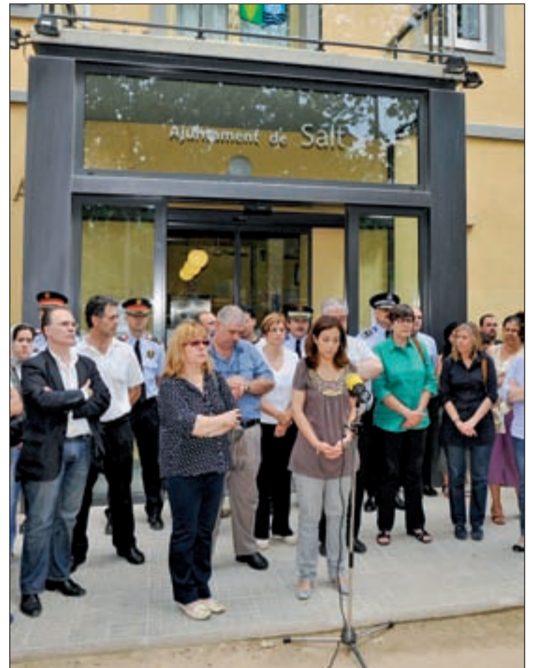
Minuto de silencio en Salt por sus dos vecinas asesinada

Y es que hasta la fecha, en 2010, ya son 32 las mujeres asesinadas por su parejas o ex parejas. "La mayoría de ellas cuentan con un denominador común. Ninguna o muy pocas habían presentado denuncia. Ni ellas ni sus entornos", señaló Bibiana Aído, ministra de Igualdad, quien pidió a familiares y amigos estar atentos y denunciar el maltrato para evitar trágicas muertes como las registradas en los últimos días.