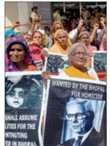
Familiares reclamando justicia

"Sólo dos años de cárcel para los autores del peor crimen cometido contra la población de la India". Así es como resume el diario 'The Times of India' las sentencias dictadas por un tribunal de este país contra los responsables de la tragedia de Bhopal. A los dos años de condena hay que sumar 100.000 rupias, unos 1.800 euros de multa para cada uno de los once directivos indios de la filial norteamericana Union Carbide. La fábrica de pesticidas de esta empresa sufrió un escape en 1984, expulsando más de 40 toneladas de gases tóxicos que provocaron la muerte de entre 15.000 y 25.000 personas, según las cifras no oficiales. La sentencia se ha hecho esperar 26 años y resulta insuficiente para gran parte de la población del país asiático, según se desprende de declaraciones como