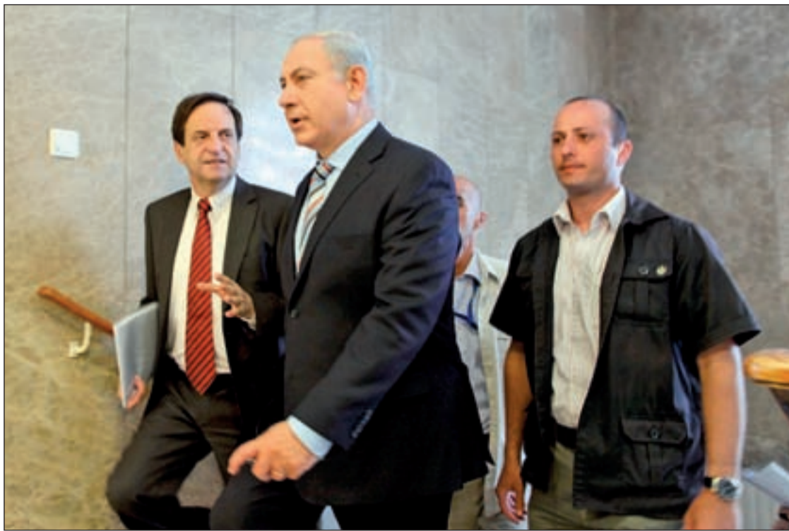
Netanyahu conversa con el viceprimer ministro, Dan Meridor, antes de una reunión del Consejo de Ministros

NETANYAHU RECHAZA LA PRESENCIA EXTRANJERA EN LA COMISIÓN COMO PIDE LA ONU