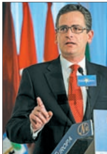
Antonio Basagoiti, líder PP vasco

En este clima de entendimiento en el Gobierno vasco, Antonio Basagoiti ha remarcado que "es un secreto a voces.