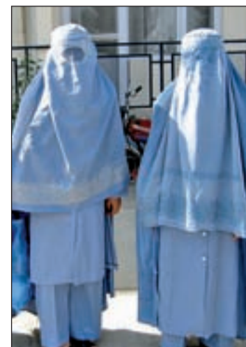
Dos mujeres con burka

Ni con burka ni con niqab. Los espacios municipales de Lleida vetan el paso a toda mujer que porte estas prendas asociadas a distintas vertientes del Islamismo. El Ayuntamiento, con la abstención de ERC y la negativa de IC, ha convertido a Lleida en la primera ciudad española que delimita su acceso a instalaciones públicas por motivos de símbolos religiosos. Medida que tampoco ha sido respaldada por el Ejecutivo central y la Generalitat que la han tachado de “desproporcionada” y “contraproducente”. Un estudio de los servicios jurídicos del Consistorio ha impedido que esta moción se extendiera a las calles. El informe concluye que el gobierno municipal “no tiene atribuidas expresamente competencias para prohibir, con carácter general o indiscriminado, que en la vía pública cualquier