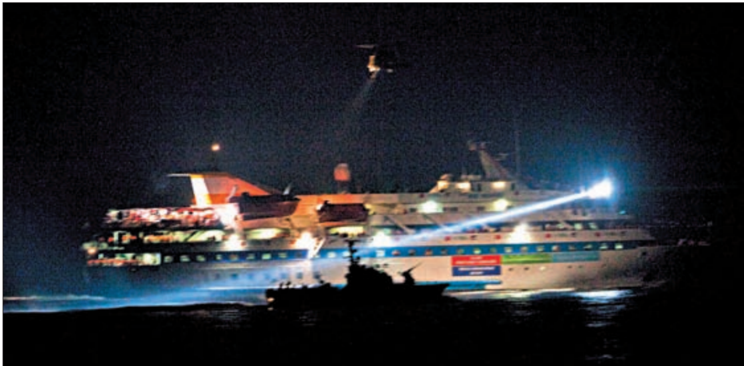
Imagen del bote patrulla israelí acercándose al 'Mavi Marmara' minutos antes del asalto que se saldó con más de una decena de muertos y heridos

LOS MÁS DE 600 ACTIVISTAS DE LA FLOTILLA HUMANITARIA AFRONTAN SU DEPORTACIÓN INMEDIATA