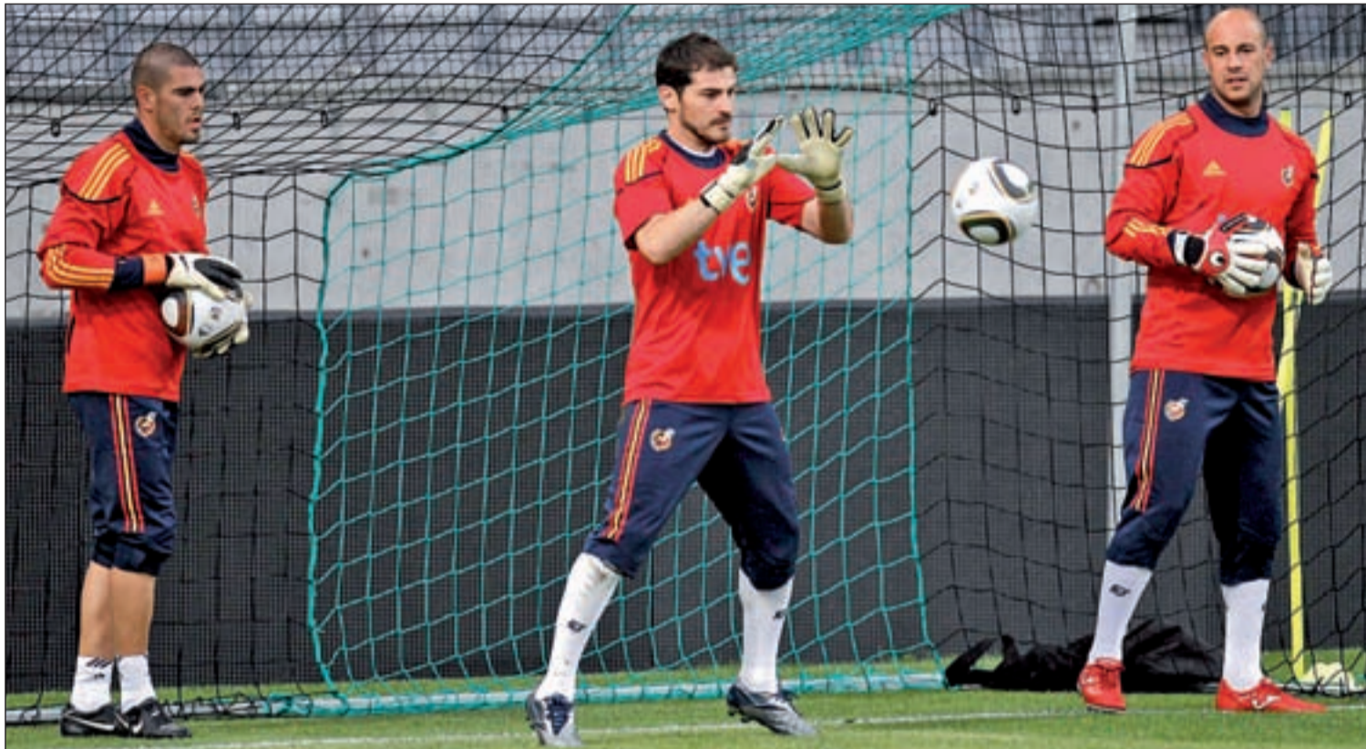
Valdés, Casillas y Reina durante un entrenamiento en tierras austriacas

de los rumores que hablaban de una mala relación entre él y Pepe Reina: “No hay ningún problema como se ha hablado, al contrario, nos hemos llevado siempre muy bien. No hay amistad cercana, porque nos separamos desde jóvenes, pero, cuando hemos coincidido, nos hemos ayudado entre los dos, así que a la vista está que es totalmente falso que tengamos una mala relación”, aclaró.