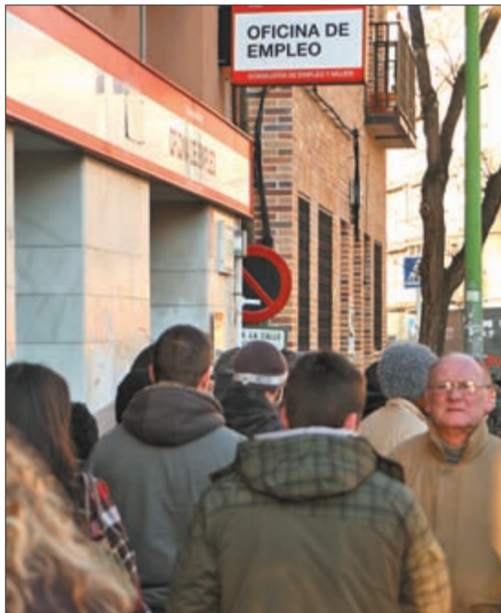
Una de las muchas e interminables colas de parados en el INEM

Todas estas cifras son más alarmantes, cuando se producen con una cantidad de perso-