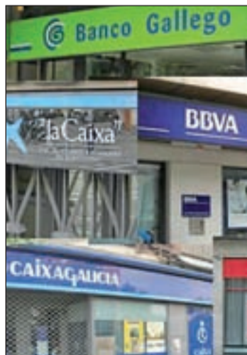
Todas las cajas pierden depósitos

Esta retirada de dinero ha complicado la liquidez de las mismas, justo en un momento en que los mercados están prácticamente cerrados para entidades y es uno de los motivos por el que se ha agilizado, en los últimos meses, el número de fusiones en el sector.