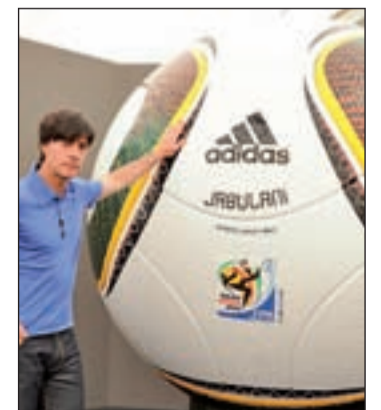
La pelota, centro de la polémica

En la misma línea van las declaraciones del arquero titular de Brasil, Julio César quien dijo en tono irónico que esta pelota “parece a las que compras en un supermercado”.