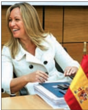
La ministra, Trinidad Jiménez

las comunidades autónomas. Modificarán el baremo de valoración de dependencias incorporando la frecuencia con que los solicitantes pueden realizar tareas, mejora los manuales de aplicación e incluye guías para enfermedades mentales y neurodegenerativas o demencias.