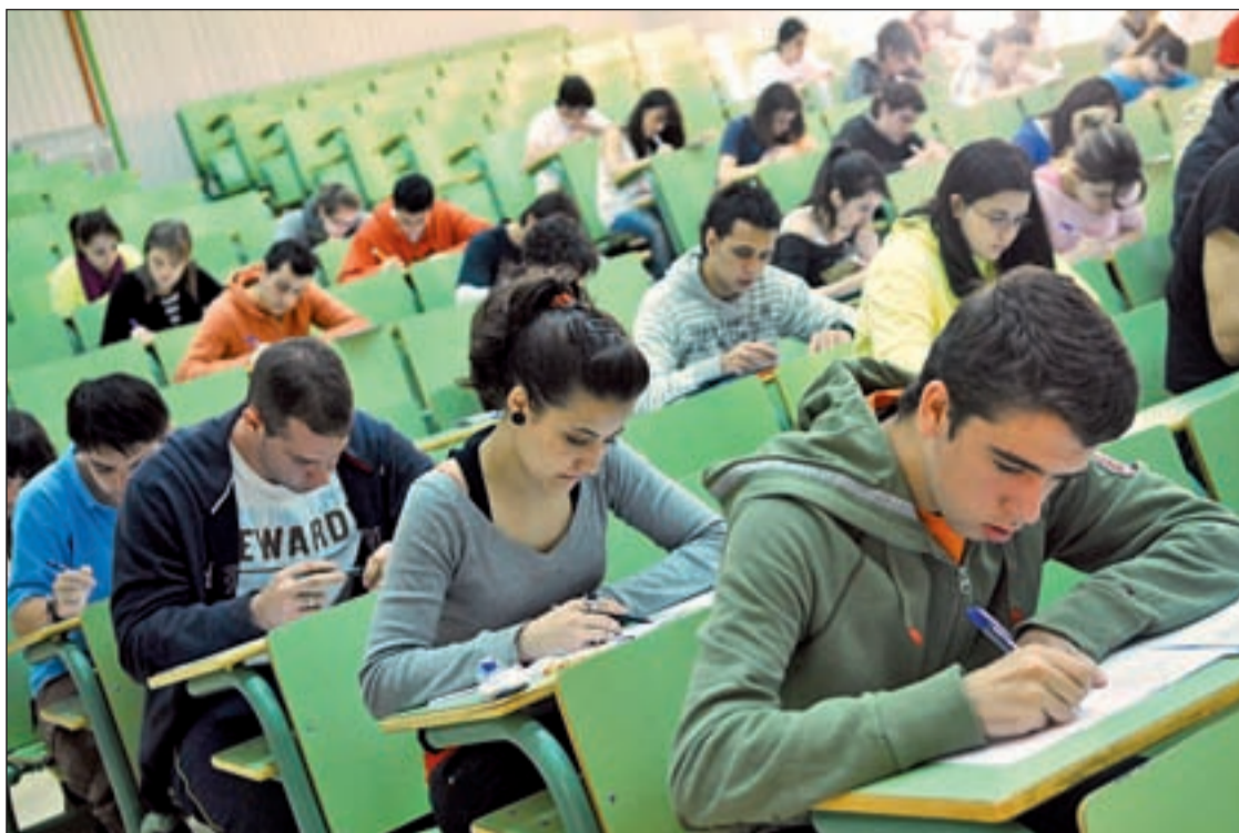
Foto de archivo de estudiantes realizando las pruebas de selectividad para la Universidad

BOLONIA EXIGE MENOS EXÁMENES PERO INCLUYE UNA PRUEBA PARA SUBIR NOTA