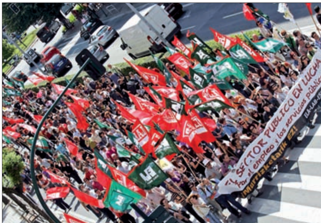
Protesta de trabajadores del sector público el pasado 25 de mayo en las calles de Pamplona

Y es que según los datos que baraja su sindicato, el 25%, o lo que es lo mismo, una cuarta parte de los empleados públicos son interinos “cuya plaza, con contrato de obra y servicio o temporal, ha sido creada por decisión política y por la misma puede desaparecer”, remarca el portavoz de UGT, un sindicato convencido de que el plan de reducción del déficit público