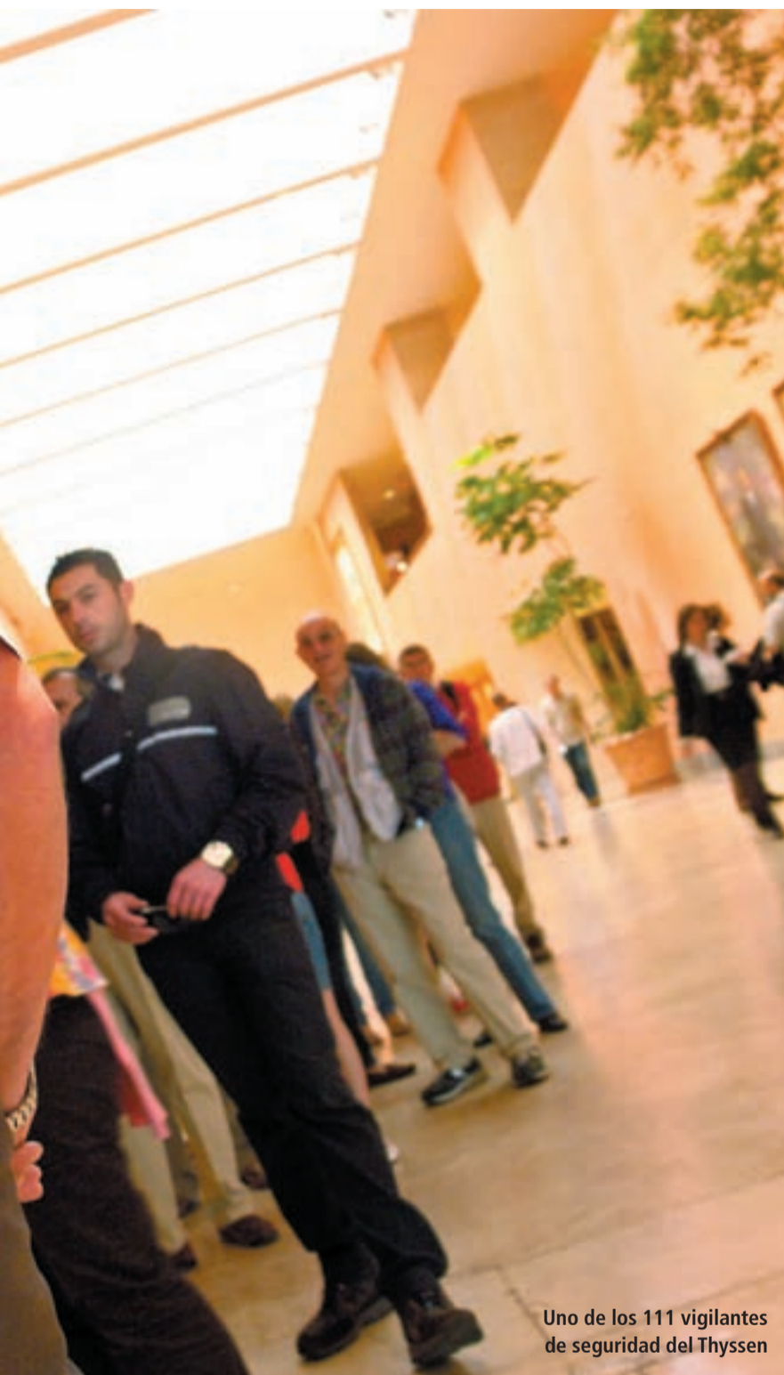
Uno de los 111 vigilantes de seguridad del Thyssen