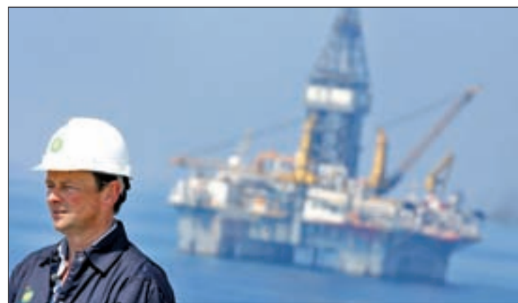
El director ejecutivo de BP, responsable de la catástrofe medioambiental

ción. La petrolera utilizará robots submarinos para canalizar el vertido a una tubería para su extracción a barcos de limpieza, aunque son conscientes que el triunfo no está garantizado. Los expertos del Gobierno calculan que es posible que el crudo siga manando hasta agosto.