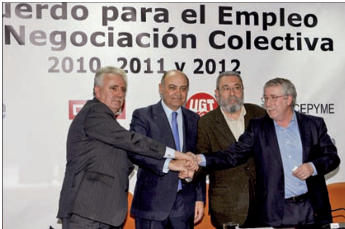
Patronales y sindicatos, convencidos que la reforma laboral no saldrá adelante con el consenso de las partes

El Ejecutivo está convencido, como los sindicatos y patronal, de que es prácticamente imposible un acuerdo de reforma laboral pactado, a no ser que ocurra un cambio radical de rumbo en la misma, que no parece vislumbrarse por ninguna parte. A pesar de todo ha prorrogado la fecha fijada el 31 mayo, pero lo ha hecho, sobre todo, para no hacerla coincidir con el 8-J de la huelga de funcionarios. Con casi toda probabilidad el Gobierno tendrá las manos libres para aprobar la misma incluso en el consejo del próximo 11 ó 18 de junio y lo podrá hacer por Real Decreto Ley, que convalidaría después