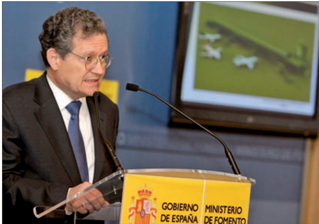
Juan Lema, presidente de AENA, durante la presentación esta semana del proyecto para el aeropuerto de Vigo

Los recortes de Fomento no afectarán a la terminal de Peinador que triplicará su superficie y su número de viajeros, que serán cuatro millones en 2011 Pág. 4