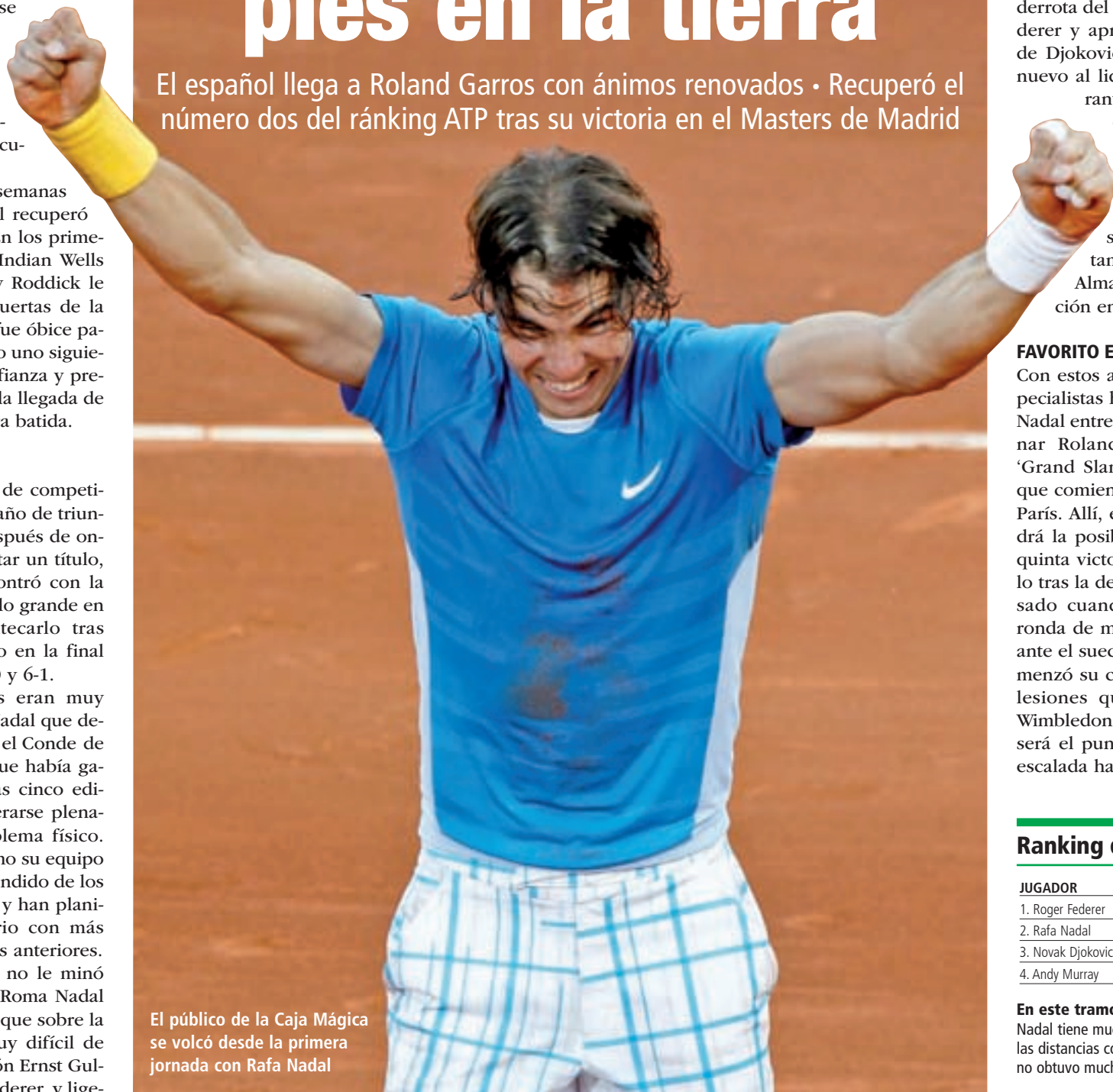
El público de la Caja Mágica se volcó desde la primera jornada con Rafa Nadal

El español llega a Roland Garros con ánimos renovados · Recuperó el número dos del ránking ATP tras su victoria en el Masters de Madrid