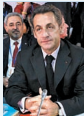
Nicolás Sarkozy en la Cumbre

Nicolás Sarkozy, pese a llegar hora y media tarde a la cita, fue uno de los rostros más buscados de una Cumbre que quedó ensombrecida por la ausencia de hasta 26 mandatarios. Faltaron la canciller alemana Angela Merkel, quien abandonó Madrid el lunes tras la cena de gala, también Silvio Berlusconi y el nuevo premier británico David Cameron. No acudieron tampoco ni Hugo Chávez, ni Raúl Castro, ni el dirigente nicaragüense Daniel Ortega.