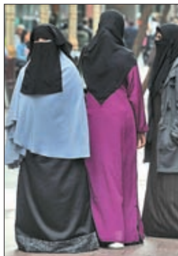
Mujeres con el 'niqab'

En cambio, el Ayuntamiento de Lleida debatirá en un pleno municipal, a instancias de una moción presentada por CIU, el uso de esta prenda asociada a una rama del islamismo, en los espacios públicos de la ciudad. En esta propuesta de la coalición nacionalista se incluye también cualquier otra vestimenta que cubra totalmente el rostro como el 'niqab'. A CIU se ha sumado el alcalde socialista, Àngel Ros, quien afirma que