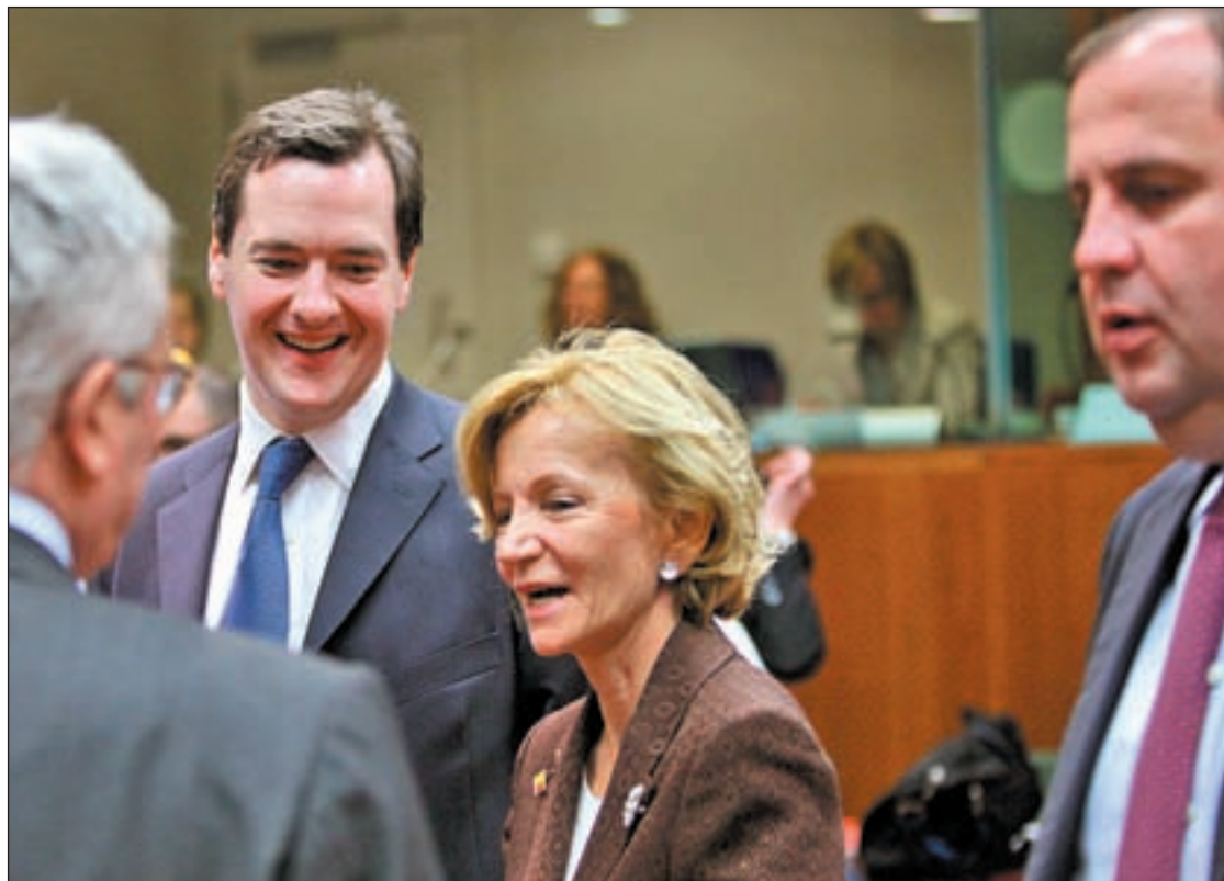
Elena Salgado con los ministros de Finanzas británico, George Osborne y el austriaco, Josef Proell

La ministra Salgado, por su parte, se mostró confiada en que sean suficientes. Ministra que convenció a sus colegas de la UE explicando el plan detalladamente al tiempo que les