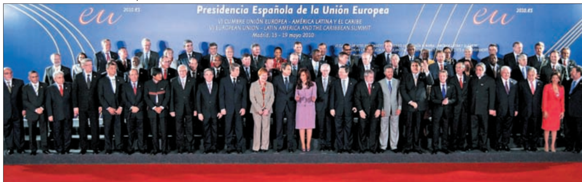
Foto de familia a las delegaciones de Europa, América Latina y Caribe en la Cumbre de Jefes de Estado del pasado martes en Madrid