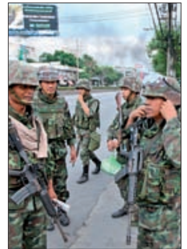
El Ejército toma la capital