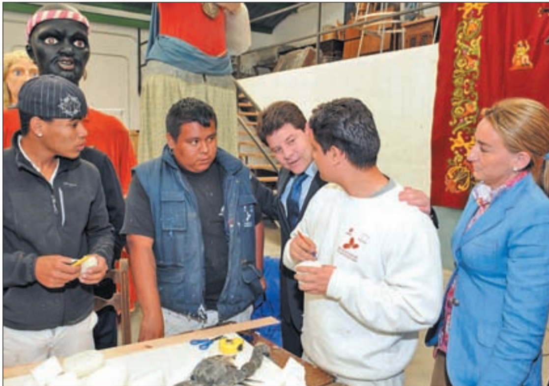
Alumnos de la Escuela Taller de Restauración ultiman la decoración para la celebración del Corpus

Restauran el altar Rosario de la Aurora y doce arcos de forja, entre otras piezas únicas • Alumnos de la Escuela Taller ultiman los preparativos Pág. 4