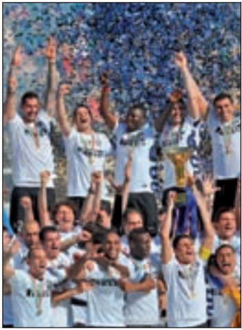
El Inter, campeón del 'Scudetto'