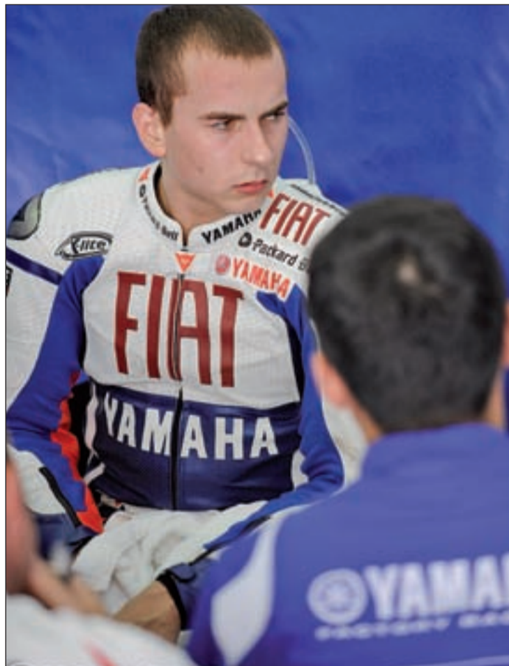
El mallorquín es líder del Mundial

El piloto talaverano de Suzuki, Álvaro Bautista, se ha visto obligado a pasar por el quirófano tras lesionarse la clavícula en unos entrenamientos. Bautista estará en la parrilla de salida de Le Mans pero afirma que "aunque me he operado, me hace bastante daño, pero estoy totalmente concentrado en el fin de semana que tengo por delante". El otro aliciente para Bautista es que tiene una