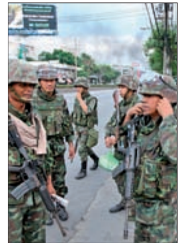
El Ejército toma la capital

Los dirigentes de los camisas rojas ondean la bandera blanca. “Os pido perdón a todos, pero no quiero más pérdidas. Nos rendimos”, anunciaba desolado uno de los líderes de los disidentes tailandeses, Prompan. La violenta incursión de un Ejército armado con munición real para desalojar del campamento a los opositores de Vejjava ha forzado la capitulación de los camisas rojas. Al menos cinco personas han muerto, entre ellas un fotoperiodista italiano, en los cruentos combates. Pese a la retirada anunciada por sus cabecillas, muchos camisas rojas continúan con su lucha y afirma que “prefieren morir” antes que continuar sometidos a un Gobierno “ilegítimo”. Mientras los focos de resistencia combaten en busca de la disolución del Parlamento, las tropas militares derrumban