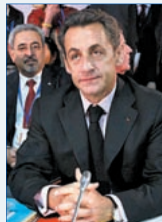
Nicolás Sarkozy en la Cumbre

Nicolás Sarkozy, pese a llegar hora y media tarde a la cita, fue uno de los rostros más buscados de una Cumbre que quedó ensombrecida por la ausencia de hasta 26 mandatarios. Faltaron la canciller alemana Angela Merkel, quien abandonó Madrid el lunes tras la cena de gala, también Silvio Berlusconi y el nuevo premier británico David Cameron. No acudieron tampoco ni Hugo Chávez, ni Raúl Castro, ni el dirigente nicaragüense Daniel Ortega.