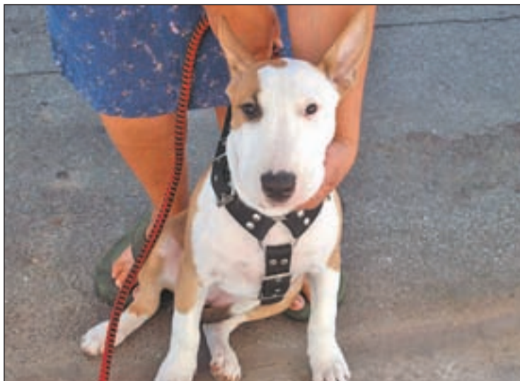
Ejemplar de una de las razas catalogadas como peligrosas