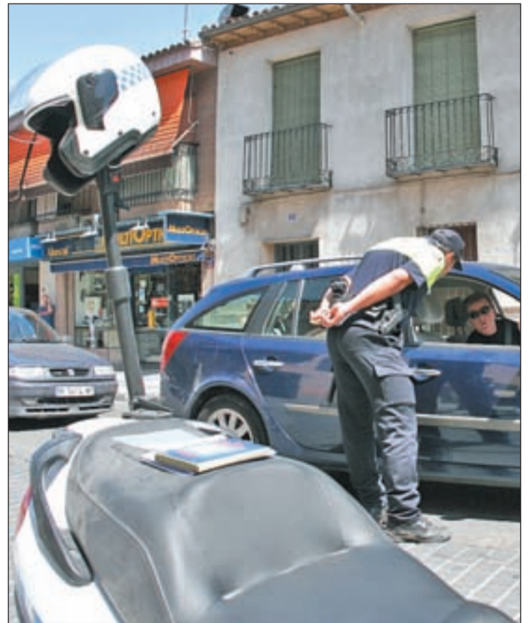
Un agente local pide la documentación a un conductor

Otra de las grandes novedades de esta Ley vial es que se eliminará la suspensión del carné de conducir como sanción, que hasta ahora se aplicaba por faltas graves y muy graves. Cada año se suspendían alrededor de 100.000 carnés de conducir. Del mismo modo, se ha aumentado de uno a cuatro años el plazo de prescripción de sanciones pecuniarias y todo el dinero que se recaude en multas irá destinado a la mejora de la Seguridad Vial, una de las tradicionales demandas de asociaciones de conductores. Los responsables de tráfico han informado, además, de que la nueva normativa va a permitir des-