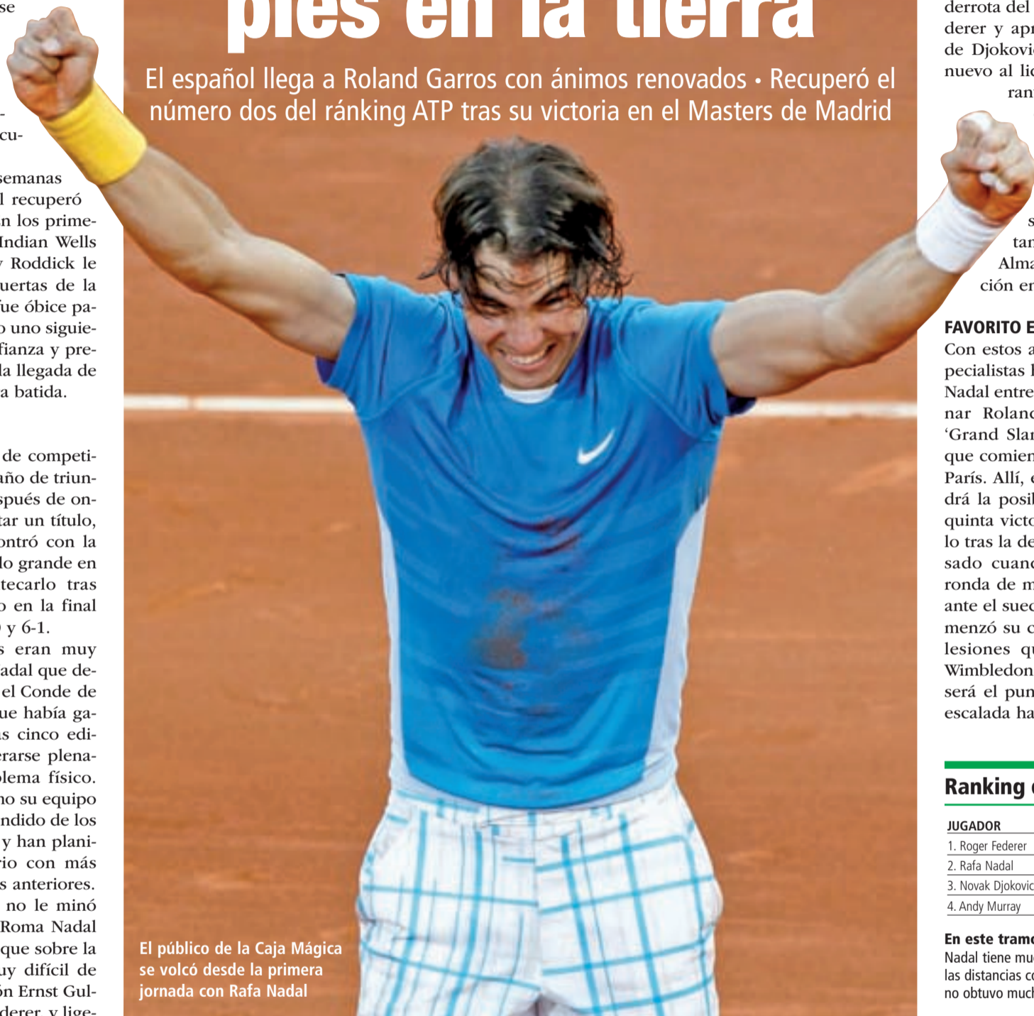
El público de la Caja Mágica se volcó desde la primera jornada con Rafa Nadal

El español llega a Roland Garros con ánimos renovados · Recuperó el número dos del ránking ATP tras su victoria en el Masters de Madrid