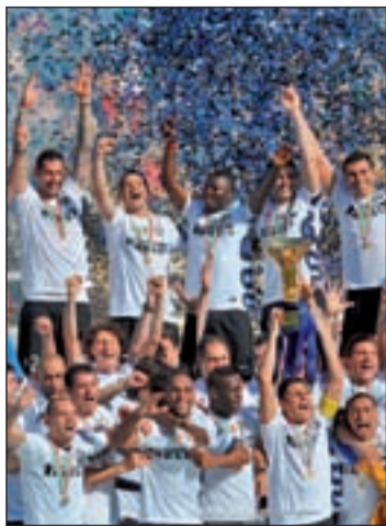
El Inter, campeón del 'Scudetto'