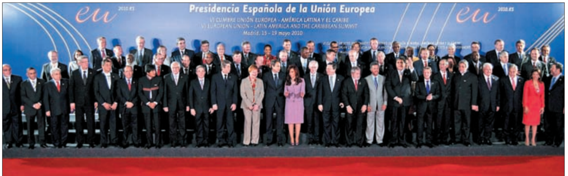
Foto de familia a las delegaciones de Europa, América Latina y Caribe en la Cumbre de Jefes de Estado del pasado martes en Madrid