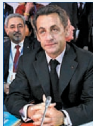
Nicolás Sarkozy en la Cumbre

Nicolás Sarkozy, pese a llegar hora y media tarde a la cita, fue uno de los rostros más buscados de una Cumbre que quedó ensombrecida por la ausencia de hasta 26 mandatarios. Faltaron la canciller alemana Angela Merkel, quien abandonó Madrid el lunes tras la cena de gala, también Silvio Berlusconi y el nuevo premier británico David Cameron. No acudieron tampoco ni Hugo Chávez, ni Raúl Castro, ni el dirigente nicaragüense Daniel Ortega.