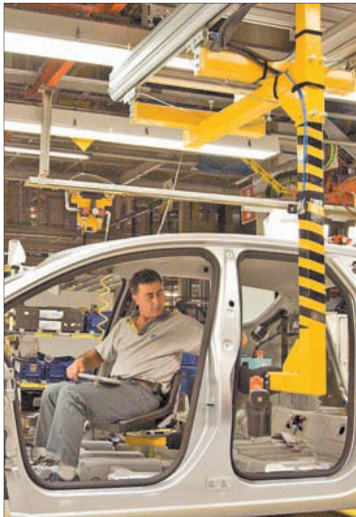
Un operario en un proceso industrial de automoción

En la Conferencia, celebrada el pasado martes, el Ejecutivo central lanzó un guante a las autonomías a las que solicitó su colaboración y participación con objeto de que las medidas adoptadas se sustenten en coherencia y complicidad entre las diferentes administraciones.