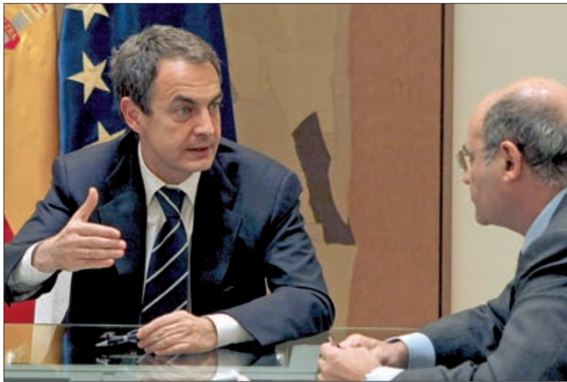
Zapatero advierte a Ferrán que hay poco tiempo para llegar a un acuerdo en la reforma laboral

El Banco de España aún no ha dado respuesta, pero todo apunta a que no es descabellado que así lo haga. De esta forma banco y cajas verían reducir sus provisiones de forma importante y de paso agilizar sus cuentas de resultados. Hasta tal punto es importante la petición que por el momento el BE señala que los ladrillos adjudicados totalizan al menos 59.700 millones de euros, de los que los bancos y cajas sólo han provisionado unos 13.000, es decir el 21 por ciento.