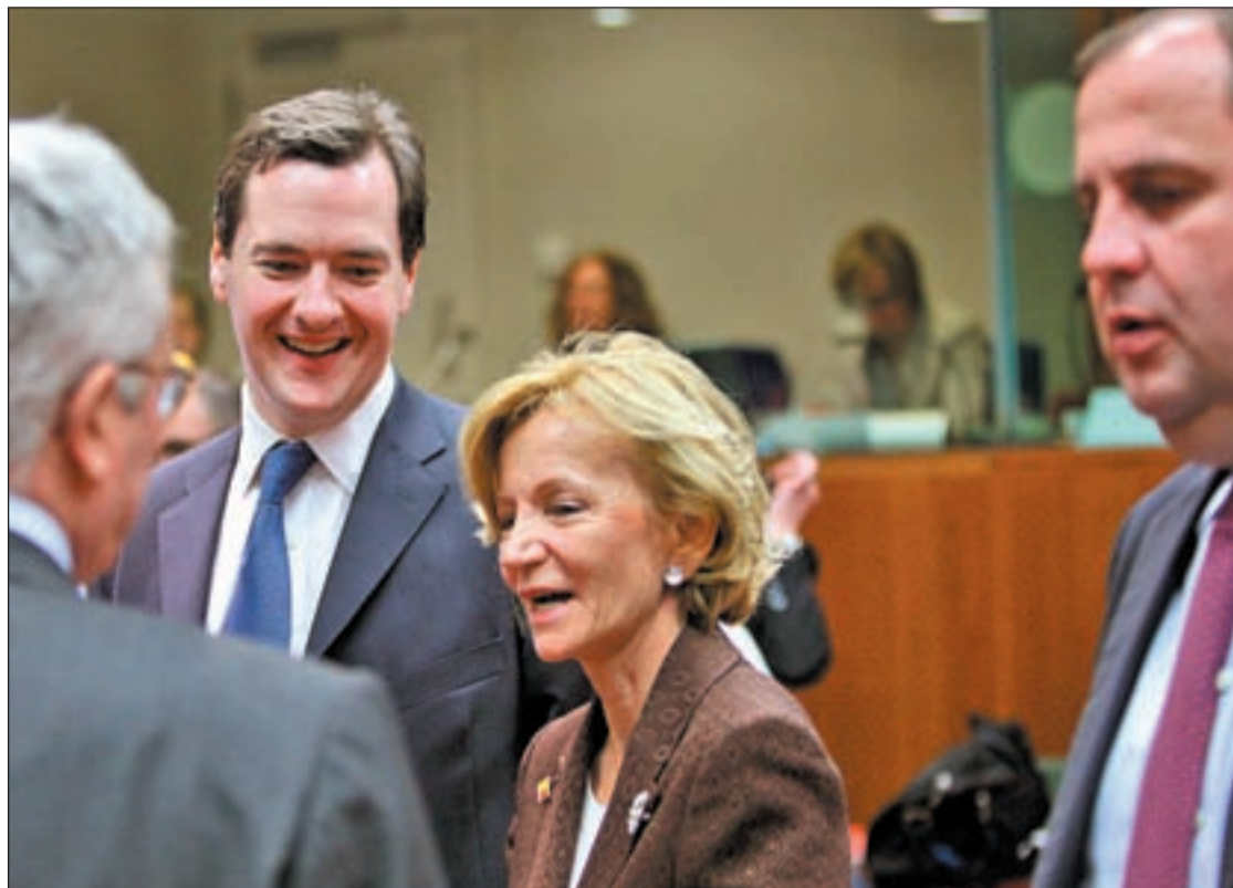
Elena Salgado con los ministros de Finanzas británico, George Osborne y el austriaco, Josef Proell

La ministra Salgado, por su parte, se mostró confiada en que sean suficientes. Ministra que convenció a sus colegas de la UE explicando el plan detalladamente al tiempo que les