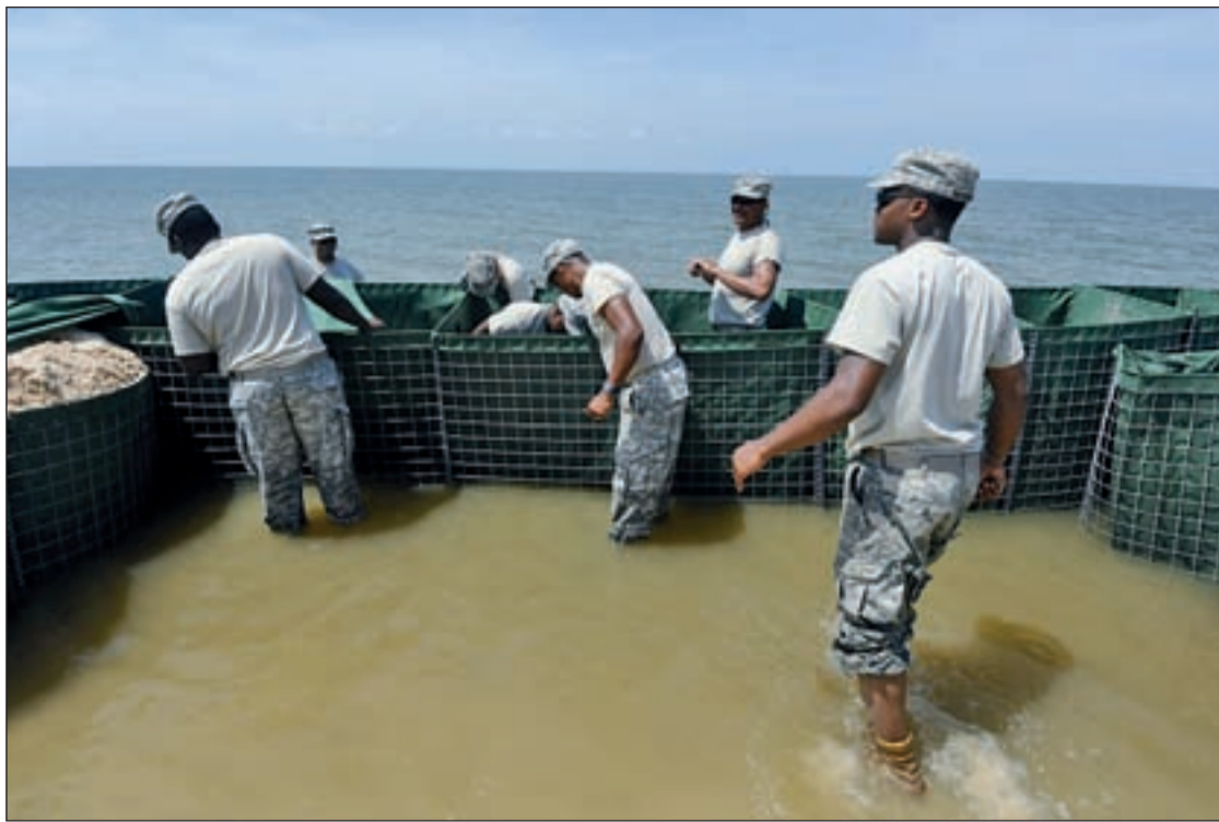
Operarios de Alabama levantan muros de contención para evitar que la fuga llegue a su costa

EL GOBIERNO DE EEUU AFIRMA QUE LA PETROLERA TIENE PROBLEMAS DE SEGURIDAD