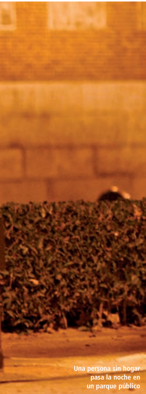
Una persona sin hogar pasa la noche en un parque público