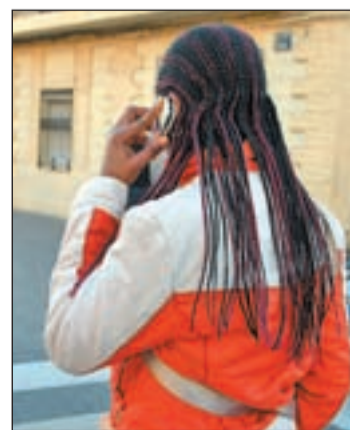
Una chica hablando por el móvil

cuentos del 50% en el importe de la multa si los infractores abonan su cuantía durante los quince días siguientes a la notificación de la sanción. Igualmente, Pérez Rubalcaba señaló que el 25% de los conductores que no pagan sus multas y que "son la gente que más acumula" no van a poder "escaparse de pagar mediante farragosos procedimientos administrativos". La reforma persigue agilizar el cobro que antes oscilaba entre los cinco meses y dos años hasta un máximo de 5 meses. El ministro aseguró que no hay afán recaudatorio en la reforma ya que con los descuentos anunciados "seguramente la recaudación disminuirá".