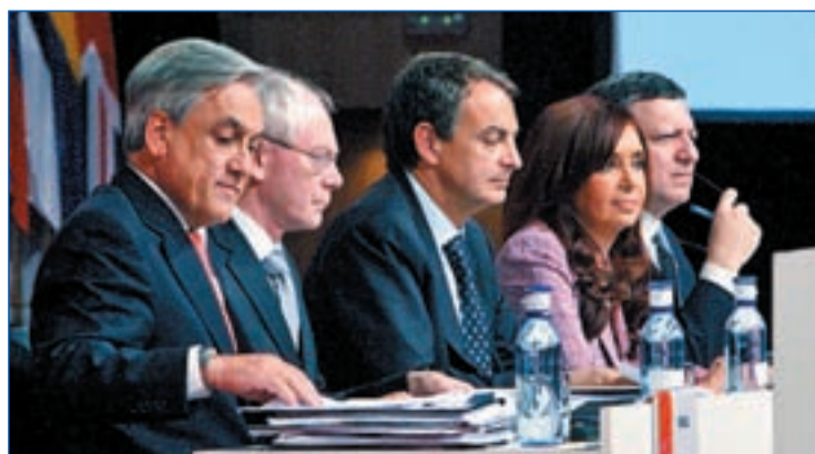
Piñera, Van Rompuy, Zapatero, Fernández y Durao Barroso

Pese a dicho aplazamiento de las propuestas vertidas en Madrid ha sido imposible no abordar en este marco las consecuencias de la crisis económica. "Hemos constatado que es imprescindible cambiar el sistema financiero", afirmó Zapatero a la conclusión de la Cumbre. Los mandatarios reunidos expresaron al respecto su voluntad de "trabajar juntos en pro de una nueva arquitectura financiera internacional que incluya la reforma de las instituciones financieras, dando mayor voz y derechos de votos a los países en desarrollo que están subrepresentados". Del mismo modo, los 60 países se comprometieron a evitar "el proteccionismo en todas sus formas", así como a coordinar esfuerzos para la obtención de "una conclusión rápida, ambiciosa, plena, equilibrada y rápida de la Ronda de Doha".