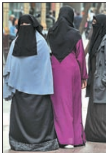
Mujeres con el ‘niqab’