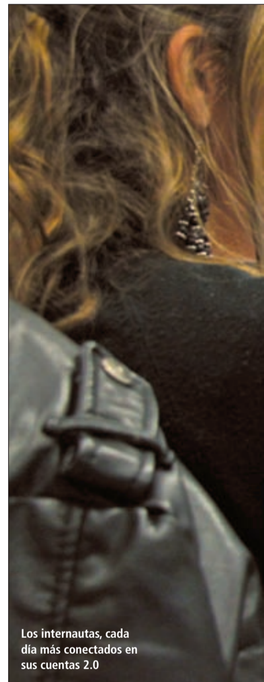
Los internautas, cada día más conectados en sus cuentas 2.0

De la misma forma que Facebook obtiene gran parte de su éxito en la facilidad de uso, Twitter simplifica todo aún más. Esta red social basa su éxito en el microblogging, servicio web donde escribimos pequeños mensajes con un número limitado de caracteres. En Twitter simplemente escribimos hasta un máximo de 140 caracteres