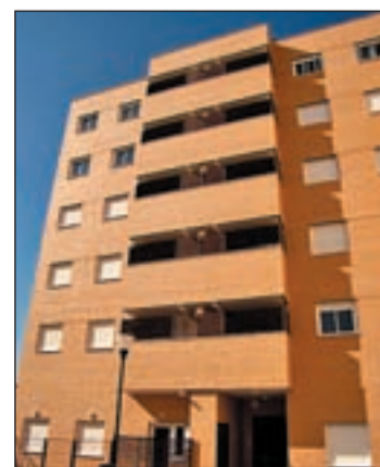
Mas ventas de inmuebles

ciento fueron para la vivienda libre y 10,5 sobre vivienda protegida. Ello ha supuesto un incremento del 9,2 por ciento en las libres y 1,7 por ciento en las de protegida. En vivienda usada se registra el mayor aumento desde 2008. Son ya cinco meses seguidos de subidas.