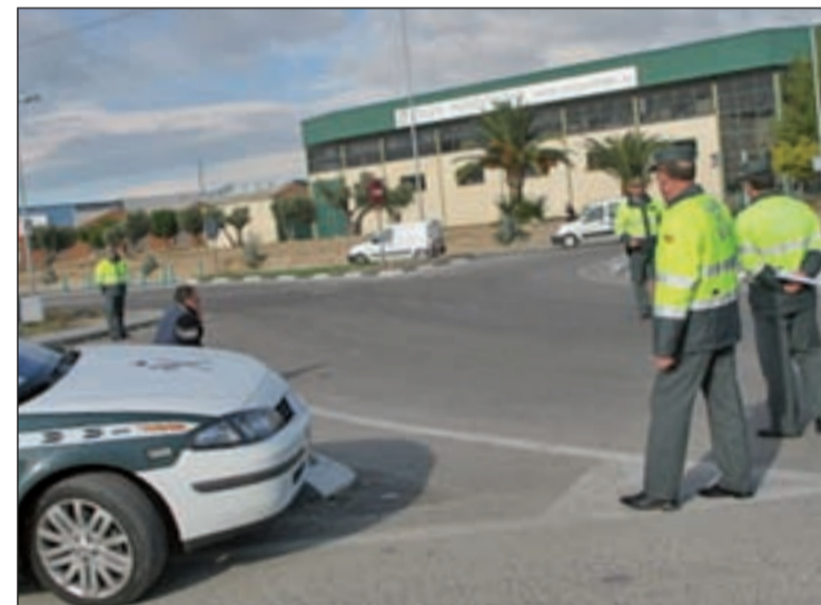
Varios guardias civiles realizando un control de alcoholemia

De esta forma, los consejos sobre cómo optimizar costes en la Benemérita giran entorno a realizar una conducción eficiente evitando frenazos o acelerones, al tiempo que se postula por la utilización de vehículos tipo turismo frente al todo terreno o la motocicleta. También los coches camuflados deberán de reducir el kilometraje en la medida de los posible.