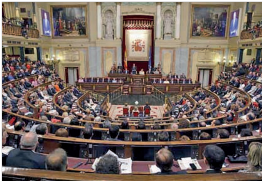
Imagen general de una sesión parlamentaria en el Congreso

Cuando los problemas se trasladan al plano subjetivo de