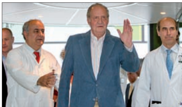
El Rey, acompañado de sus doctores a su salida del Hospital

propio pie, y aseguró: "En España debemos estar orgullosos de la sanidad pública que tenemos". Dijo sentirse bien, y se abrió la chaqueta para evidenciar su buen estado de forma, con una sonrisa. Antes de retirarse, envió un beso a una espontánea que le saludó.