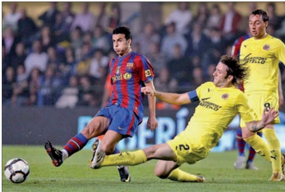
El extremo canario en un partido de Liga reciente ante el Villarreal

DEL BOSQUE HACE PÚBLICA LA LISTA DE 30 JUGADORES PRESELECCIONADOS