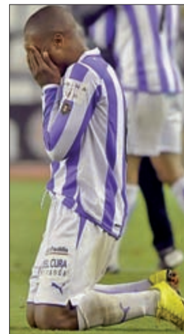
El Valladolid visita el Camp Nou

sito a Chapín sirvió de estímulo para los jugadores azulones que llegan con opciones a esta última fecha tras derrotar al Zaragoza. Una victoria en el Reyno de Navarra y las derrotas de Valladolid, Málaga y Tenerife mantendrían a los xerecistas en Primera al menos un año más, algo impensable al comienzo del curso cuando Ziganda sólo disponía de trece jugadores profesionales a su llegada al club. Los partidos de los equipos implicados se jugarán el domingo. Tres de ellos jugarán el próximo año en Segunda.