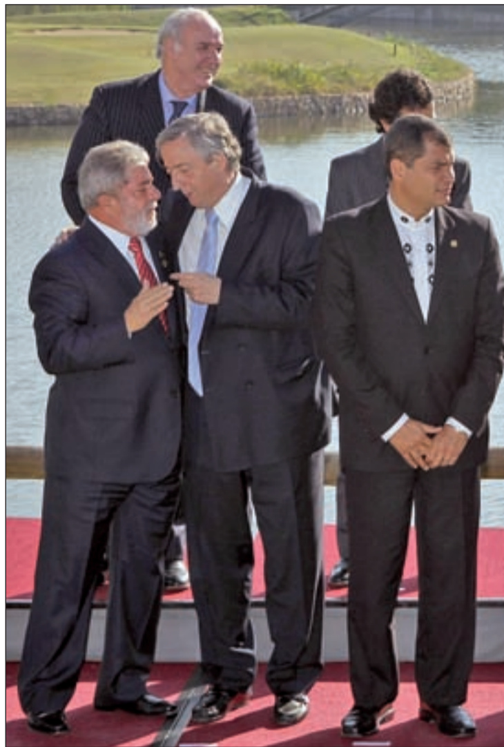
Algunos de los mandatarios que asistirán a la reunión en Madrid

Pero en Madrid también se está fraguando otra convención. Movimientos sociales y organizaciones de derechos humanos preparan un encuentro alternativo a esta cita oficial. Bajo el nombre de 'Cumbre de los Pueblos-Enlazando Alternativas', se congregarán activistas procedentes de Europa y América Latina para denunciar el papel de la UE en el continente sudame-