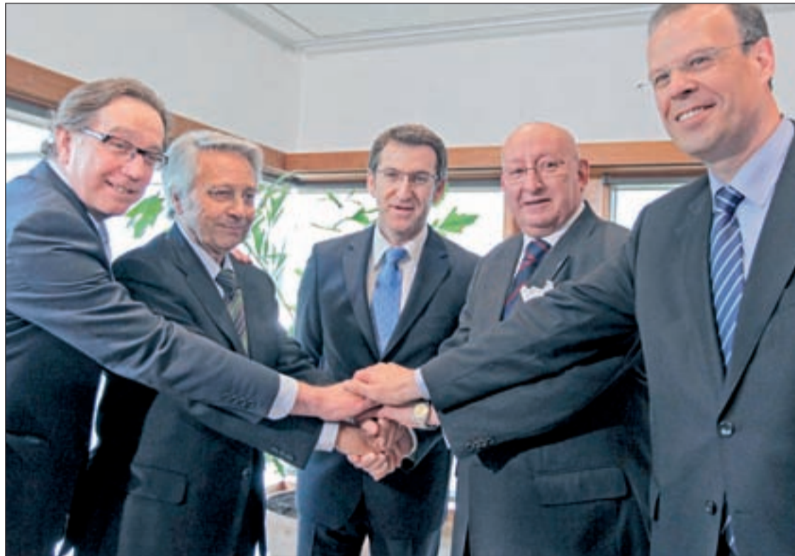
Alberto Núñez Feijóo, en el centro, rodeado de los responsables de las cajas gallegas, tras firma el acuerdo

El acuerdo entre Caixanova y Caixa Galicia establece una presidencia doble rotativa para cada caja durante el periodo de transición de tres años Pág. 4