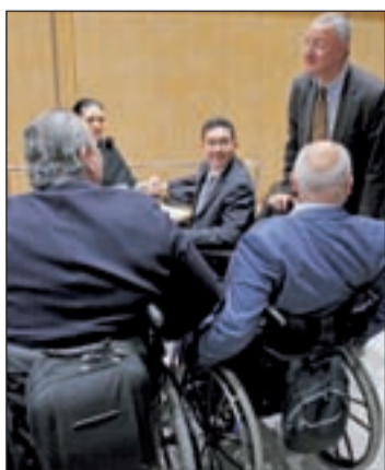
Reunión sobre discapacidad