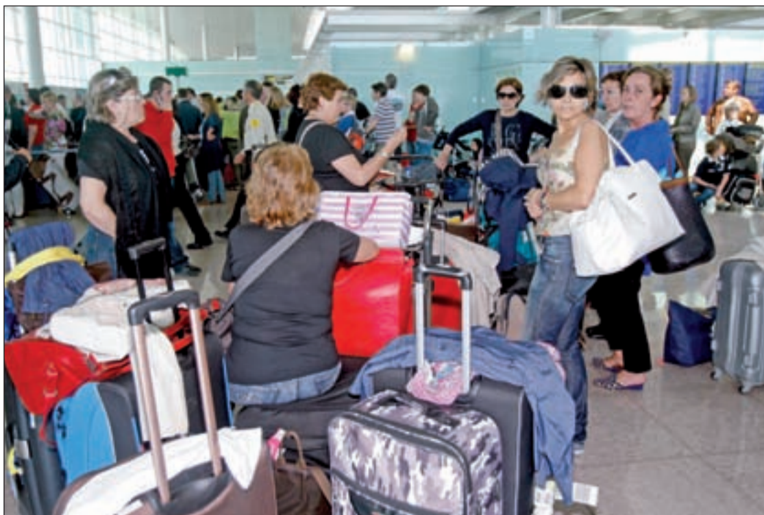
Cientos de viajeros esperando en El Prat de Barcelona una solución para llegar a sus destinos

MILES DE VUELOS HAN SIDO CANCELADOS O RETRASADOS