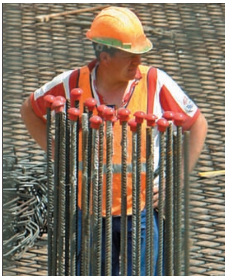
Los autónomos contra la próxima subida del IVA

En cuanto a las causas de este decrecimiento generalizado en el sector, los autónomos apuntan a la caída de las ventas y la pérdida de actividad (44,7 por ciento), los impagos de los clientes (29,4 por ciento) y la