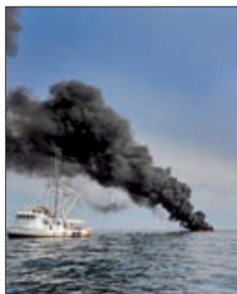
El petróleo avanza en el mar

catástrofe. El enorme embudo que se erigía como la receta mágica ha sido retirado por ineficaz, aunque se estudian nuevas alternativas. Mientras BP continúa construyendo otro pozo con el que extraer el crudo pero que podría llevar tres meses en completar.