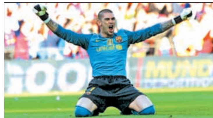
Víctor Valdés es una de las novedades de la lista

En la lista también destacaba la presencia de Fernando Llorente en detrimento del delantero del Sevilla, Negredo, que había gozado de la confianza de Del Bosque hasta ahora.