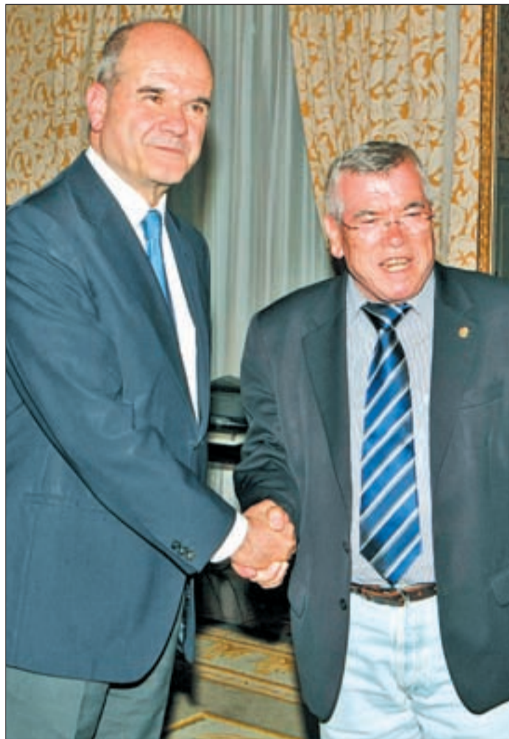
Manuel Chaves junto a Pedro Castro, presidente de la FEMP

ducir la carga financiera, el plazo de amortización, o ambas cuestiones. El Decreto estipula que el ahorro de las entidades locales derivados de la reducción del gasto de personal en 2010 y 2011 se destinarán a sanear primero los remanentes negativos y en segundo lugar a reducir su nivel de endeudamiento a largo plazo, quedando la financiación de las inversiones en el último lugar de la je-