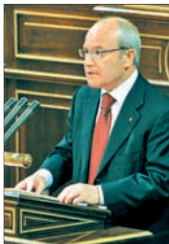
José Montilla en el Senado

El president catalán quiso reiterar su respeto por el Tribunal Constitucional aunque insistió en la necesidad de subsanar el hecho de que cuatro magistrados hayan sobrepasado el tiempo de su mandato desde el año 2007. Entesa y CiU presentaron