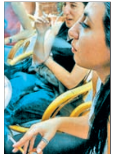
Varias chicas fumando

Camps quiere que entiendan que con el tabaco “perjudican a sus amigos no fumadores” y señala que “a esta edad es más fácil la deshabituación”. El porcentaje de adolescentes fumadores es alto, el 16% lo hacen esporádicamente y el 13% de forma habitual, pero consumen