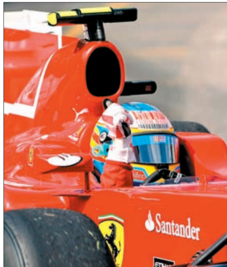
Alonso sólo pudo ser sexto en Mónaco

Si hay algún piloto que se desenvuelva a la perfección en el trazado otomano ese es Felipe Massa quien ha ganado las tres de las cinco pruebas disputadas en Estambul. El brasileño ha experimentado un bajón en su rendimiento que algunos acha-