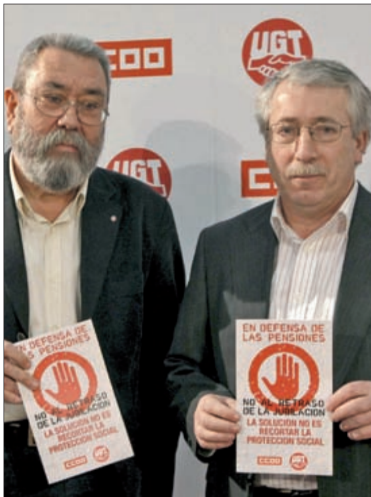
Méndez y Toxo quieren el acuerdo pero no el retraso de la jubilación

El inconveniente mayor surge a la hora de plasmarlo en realidad ya que quieren que se haga de forma tal que no parezca, es decir manteniendo el despido improcedente de 45 días, con lo que "salvarían la cara". No obstante, el mismo quedará bajo mínimos al ampliarse de forma significativa los requisitos para el despido de 20 días por año.