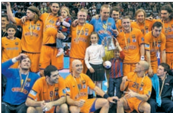
El conjunto azulgrana ya ganó la Copa del Rey esta temporada