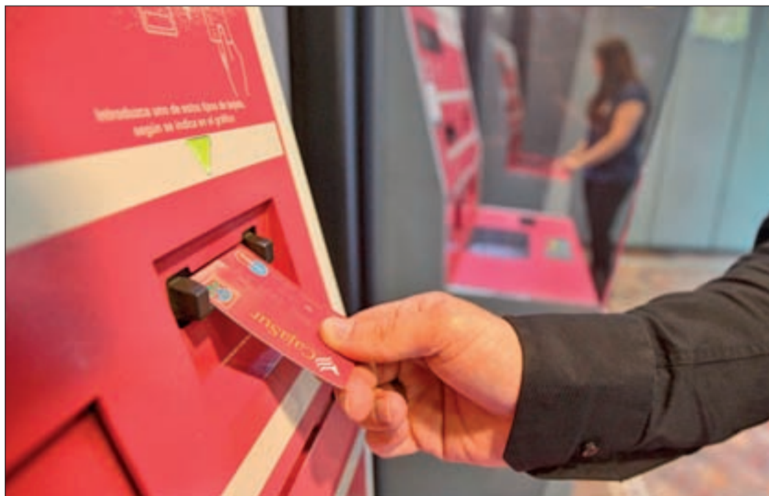
Los ahorros están garantizados por el Fondo de Garantía de Depósitos hasta los 100.000 euros por titular

No obstante, en el comunicado emitido por los mismos, se señala que son "conscientes" de que su condición de funcionarios públicos adscritos al Ministerio de Justicia les exige sumarse a las medidas de recortes implantadas por el Ejecutivo.