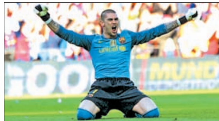
Víctor Valdés es una de las novedades de la lista

En la lista también destacaba la presencia de Fernando Llorente en detrimento del delantero del Sevilla, Negredo, que había gozado de la confianza de Del Bosque hasta ahora.