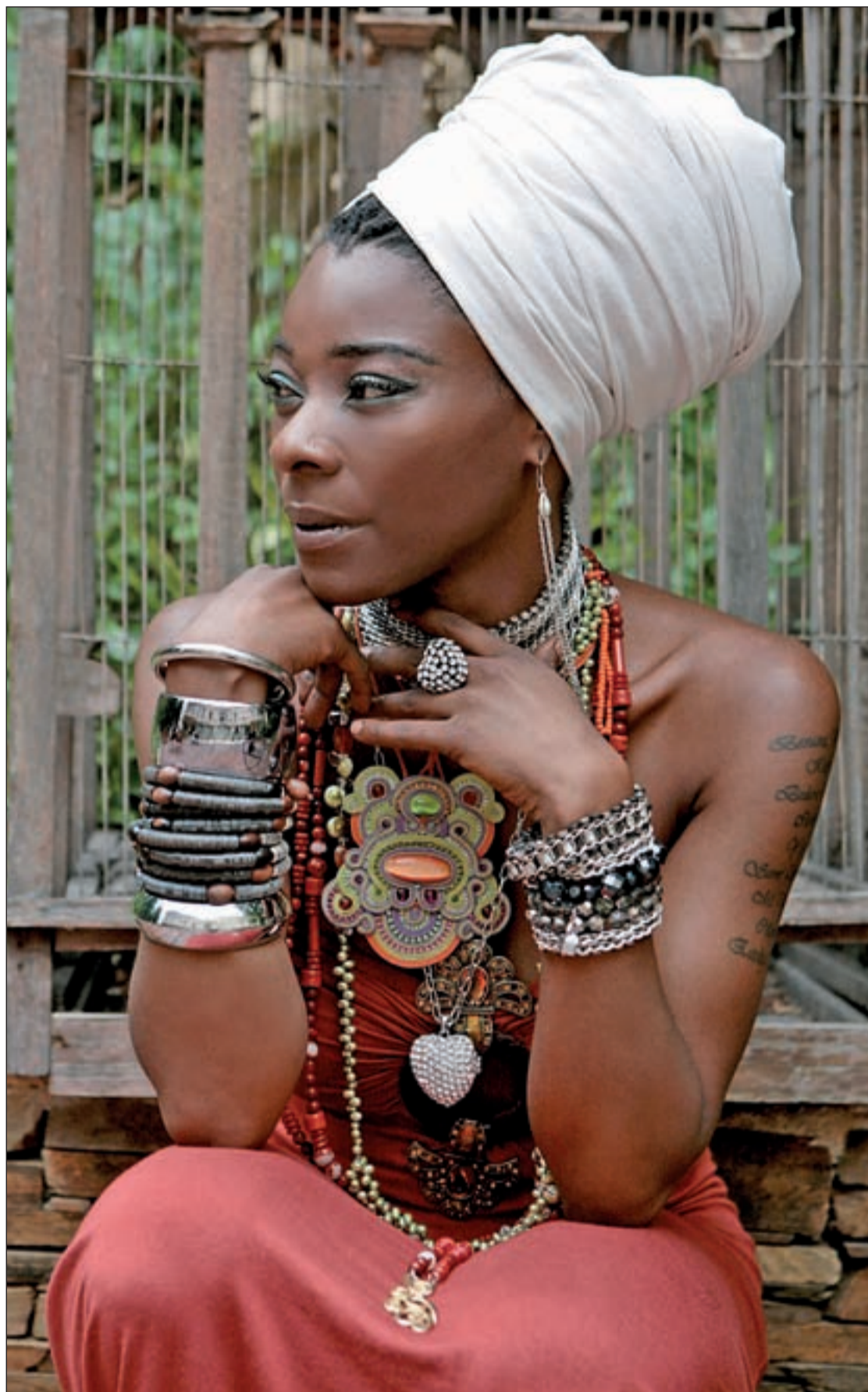
La cantante y compositora Concha Buika

Buika no se imagina ni a ella ni a la vida sin música. Es la forma de expresión más libre “porque en el arte no hay miedo”, subraya. La cantante mallorquina define la música como “un espejo que escuchas llenos de secretos, a través del que oyes lo que quieres y lo que te dicta el deseo”. Y en su espejo, la soledad, el amor y el desamor se reflejan de manera universal siempre lejos de cánones preestablecidos o de estereotipos sociales. Buika canta “al dolor desde la solemnidad”. Canta para “exorcizar la tristeza” y “vence el miedo a la soledad”. Estos ánimos que están demo-