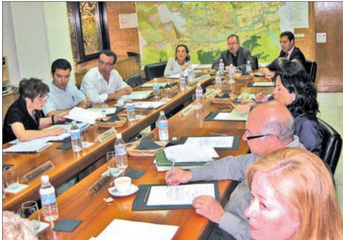
Reunión de trabajo en la que se aprobó de manera definitiva el plan de remodelación AYTO. MURCIA

Habrà 1.300 nuevas viviendas, de las que el 20% serán protegidas • El proyecto incluye grandes zonas verdes y aparcamientos públicos Pág. 4