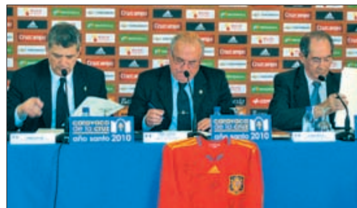
Representantes de Murcia, Caravaca y la RFEF firman el acuerdo A.M.

La Federación Española se compromete a realizar varias presentaciones del evento y organizará la entrega del Premio especial al equipo ganador y al 'Most Valuable Player'.