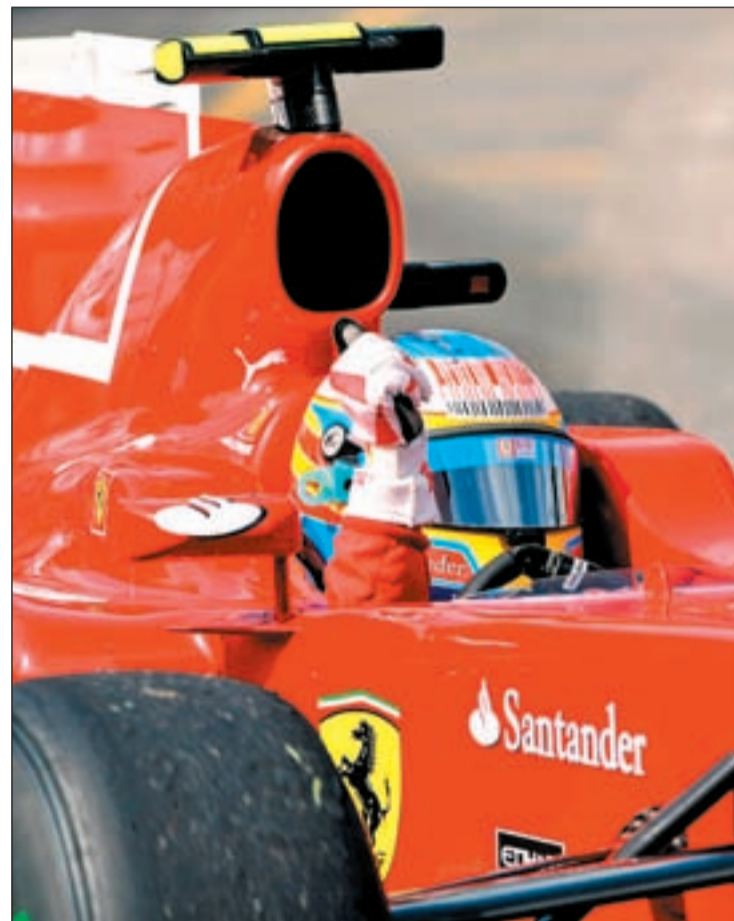
Alonso sólo pudo ser sexto en Mónaco

La última carrera disputada en Mónaco fue un claro reflejo de la superioridad del equipo de Christian Horner. Webber y Vettel subieron a los escalones más altos del podio y se auparon a los primeros puestos de la clasificación general seguidos de Fernando Alonso quien protagonizó una gran remontada tras salir el último. Ahora, el Mundial llega a Turquía donde Ferrari espera acabar con la racha de Red Bull.