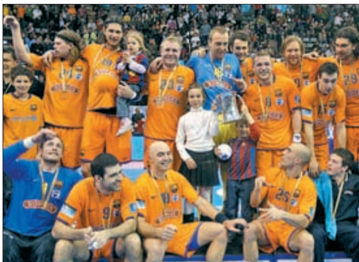
El conjunto azulgrana ya ganó la Copa del Rey esta temporada