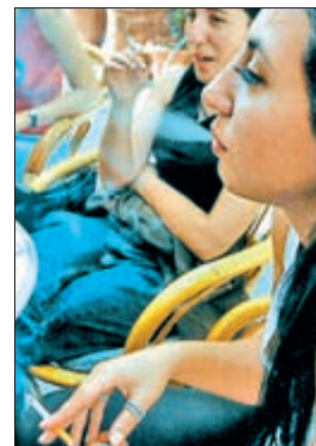
Varias chicas fumando

Camps quiere que entiendan que con el tabaco “perjudican a sus amigos no fumadores” y señala que “a esta edad es más fácil la deshabituación”. El porcentaje de adolescentes fumadores es alto, el 16% lo hacen esporádicamente y el 13% de forma habitual, pero consumen