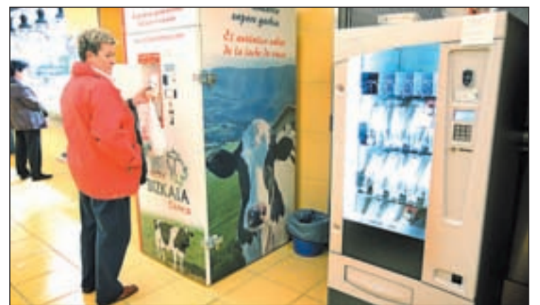
Una mujer coloca su botella en la máquina para llenarla de leche fresca

hay implantadas 17 de estas 'fuentes lácteas', de las que seis están en Araba. Fueron los propios ganaderos, siguiendo el modelo ya en vigor en Suiza o Italia, los que propusieron este nuevo servicio al ciudadano, eso sí modificando detalles para ajustarse a la normativa.