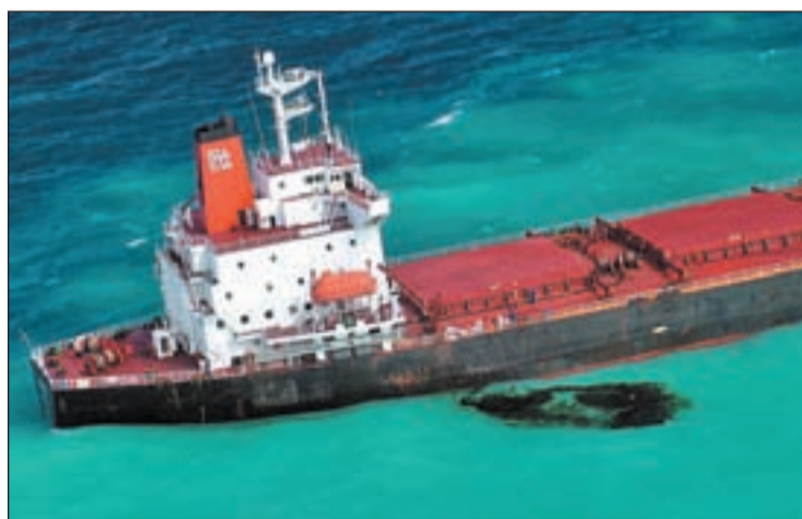
Fugas de fuel del buque chino ya han inundado la Gran Barrera

Una de las maravillas más reconocidas del mundo, la Gran Barrera de Coral, está en alerta máxima. Su amenaza directa son las más de 950 toneladas de petróleo que porta el Shen Neng 1, un buque de origen chino que se ha quedado varado a 70 kilómetros de la costa de la isla Great Keppel tras chocar con un arrecife. Los equipos marítimos se afanan en el rescate de esta embarcación cuyo riesgo de rotura aumenta progresivamente. Las primeras estimaciones cifran en al menos