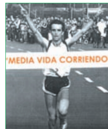
Portada del libro

DEJE ESTA SEMANA EN LA WEB SUS OPINIONES RESPECTO A ESTE CARNET