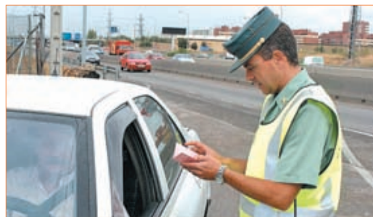
Un guardia civil requiere la documentación a un conductor

una causa de distracción que puede ocasionar accidentes. Sin embargo, fuentes de la DGT han confirmado a GENTE, que entre sus prioridades no se encuentra prohibir este hábito a los conductores y centran sus campañas en el uso de medidas de protección para los menores y del cinturón de seguridad.