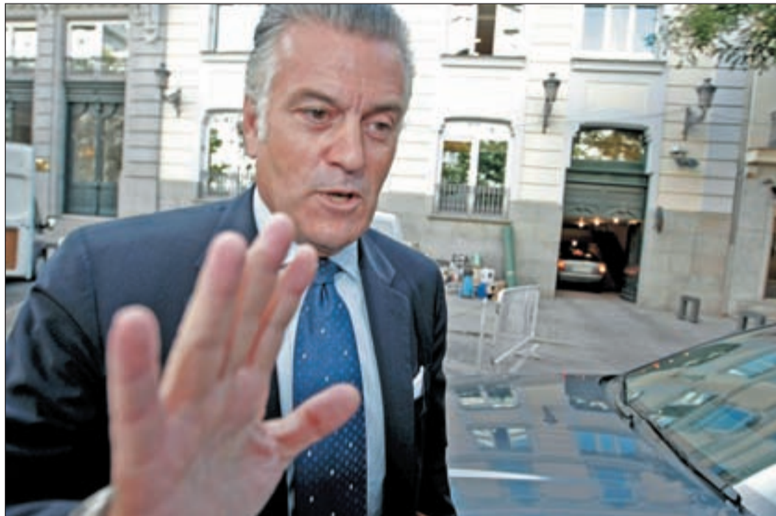
Luis Bárcenas, ex tesorero del PP, ahora investigado por el Tribunal Supremo por su implicación en Gürtel

En paralelo, el sumario asegura además que el que fuera tesoro en Génova, Luis Bárcenas, cobró un total de 1,3 millones de euros en calidad de comisiones por su intermediación entre las empresas investigadas y los dirigentes del Partido Popular. Una vez cobrado este dine-