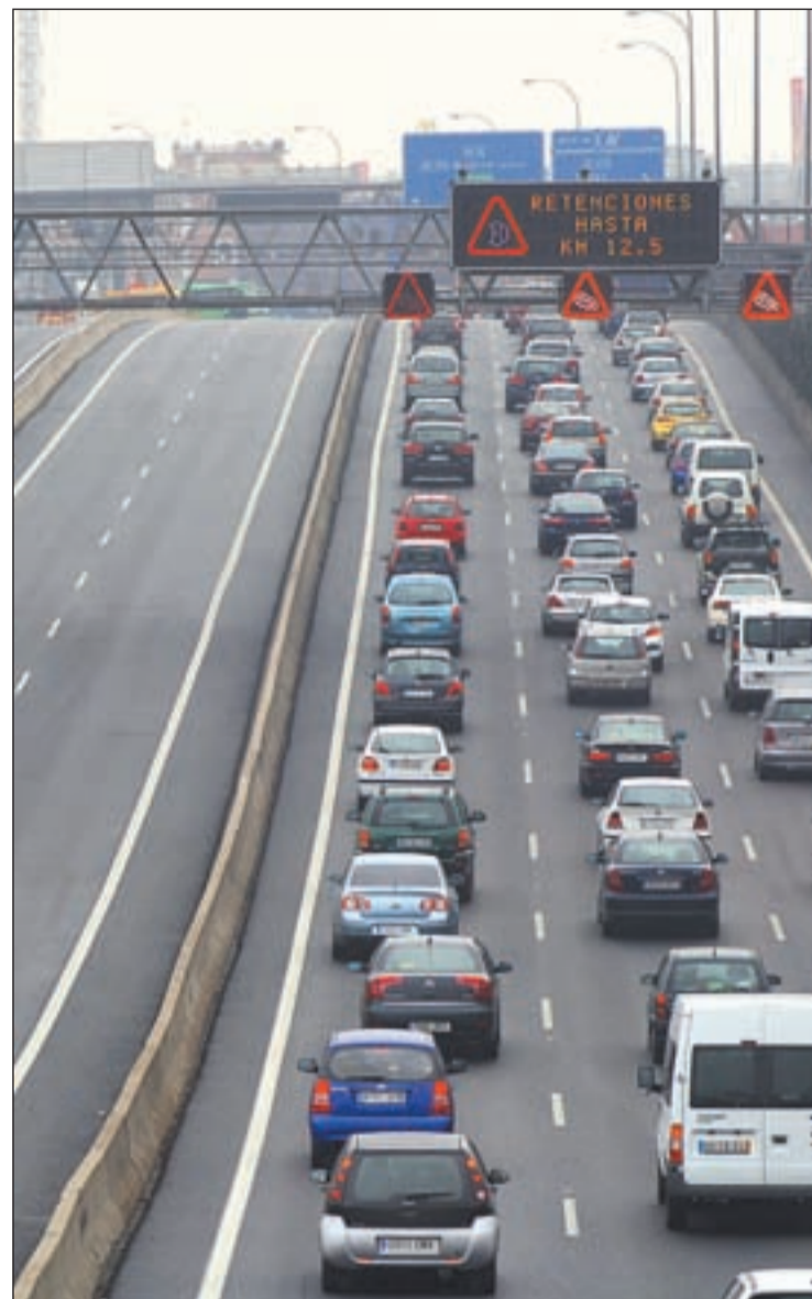
Retenciones a causa de un accidente

El mal tiempo jugó a favor en esta ocasión como un aliado para reducir el número de accidentes mortales entre los motoristas, al no invitar a usar este medio de transporte como ocio. No obstante, seis de ellos