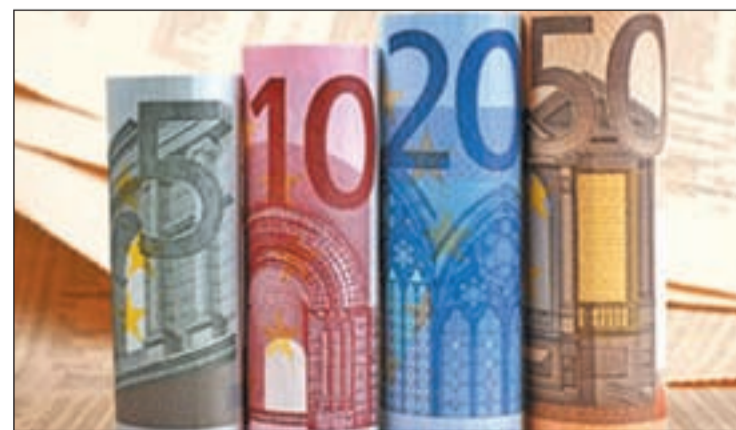
El endeudamiento exterior de nuestro país continúa subiendo

Para hacerse una idea de lo que esto supone hay que tener en cuenta que en 2001 nuestra deuda exterior era de 311.000 millones de euros, es decir, que en apenas ocho años se ha triplicado ampliamente.