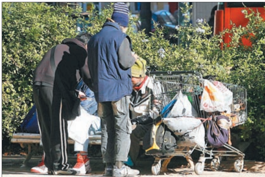
Varias personas que se han visto obligadas a vivir en la calle, reunidos en un parque de Madrid

EL FIN OFICIAL DEL INVIERNO CIERRA PLAZAS EN ALBERGUES PESE A QUE EL FRÍO SIGUE