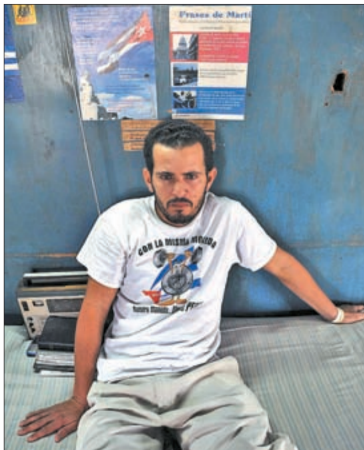
El opositor cubano Pelegrino continúa en huelga de hambre

Castro ha anunciado que no liberará los presos políticos reclamados por el disidente Fariñas como condición para terminar con su huelga de hambre.