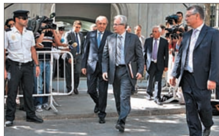
Baltasar Garzón, que se sentará en el banquillo del Supremo

La postura de la acusación, y también del juez que ha dado