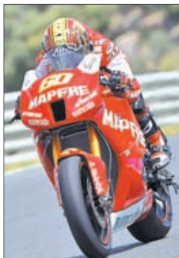
El toledano, con su nueva moto

Respecto a la representación española lo más destacable es el regreso al Mundial de Fonsi