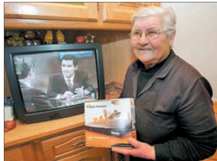
Una anciana muestra el adaptador de TDT para su televisión

los repetidores necesarios para dotar a estas zonas de cobertura digital y donde el gobierno ha comenzado a ubicar parabólicas como solución al problema. Según Francisco Ros, secretario de Estado de Telecomunicaciones, esta situación afecta a un 1,6% de la población. El cambio de modelo, que convierte a España, en el país europeo con el mayor espectro de televisión digital ha costado 288 millones de euros. Los nuevos canales se repartirán antes de 2011 entre los operadores.