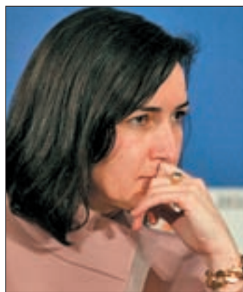
La ministra González-Sinde

sidad Carlos III establece que en la red social Twitter la reacción ha sido masiva: 37.000 'tweets' van acompañados del 'tag #Manifiesto'. En referencia al 'Manifiesto en defensa de los derechos fundamentales en Internet', que fue secundado por gran cantidad de ciudadanos.