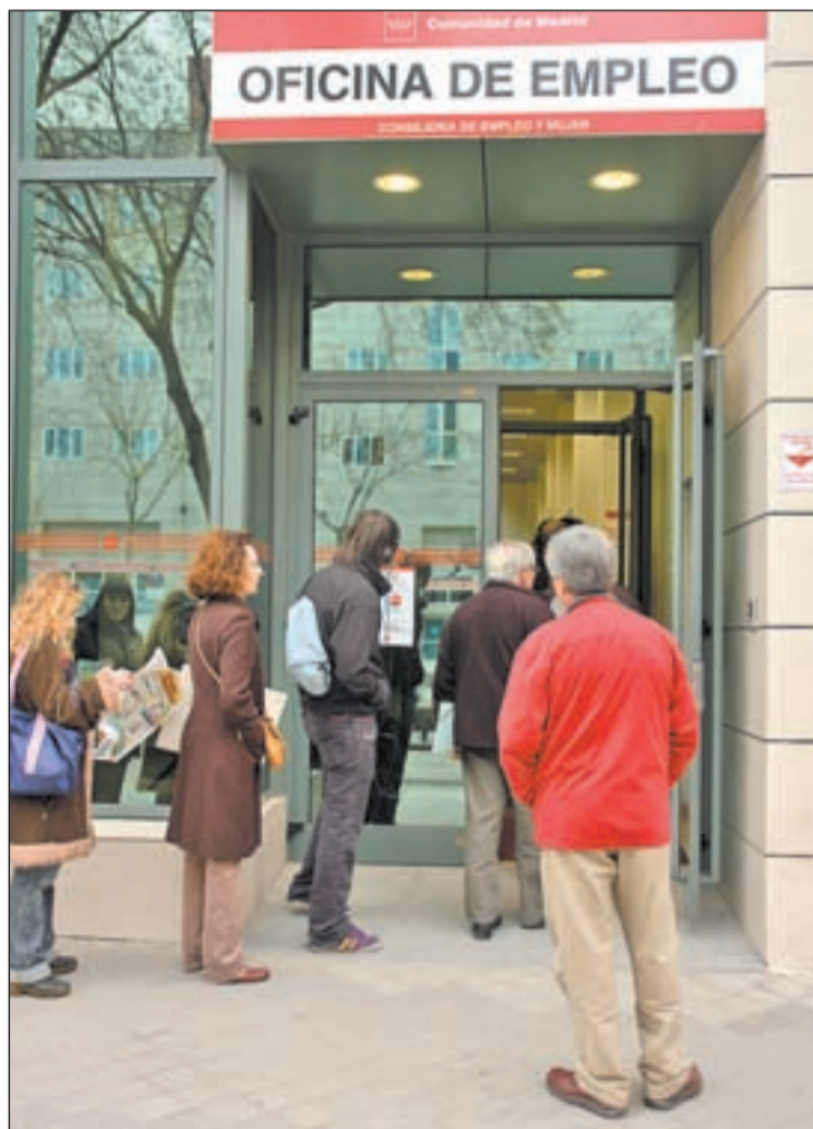
Cola de ciudadanos en una oficina de Empleo

De cara al segundo trimestre del año, el Indicador Laboral de Comunidades Autónomas (ILCA) estima que la economía española seguirá perdiendo empleo aunque a un ritmo "sensiblemente moderado" y ello no será consecuencia del ansiado inicio de la recuperación, sino del hecho de que "ya no quedará empleo por destruir".