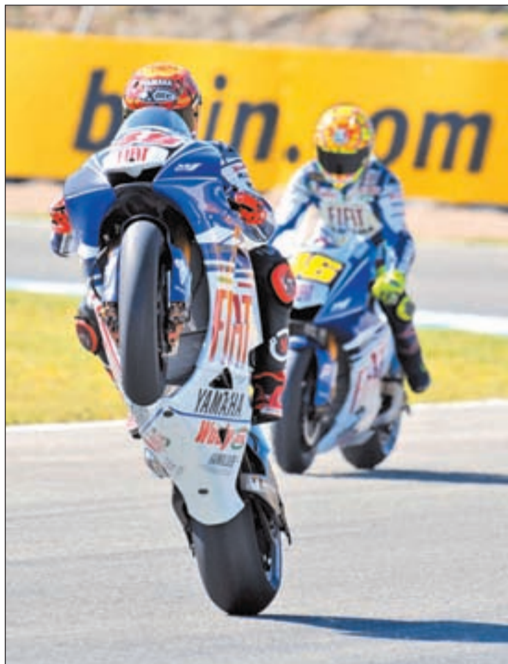
Los dos pilotos de Yamaha dominaron el pasado campeonato

Con la intención de terminar con el reinado de Rossi, Casey Stoner cuenta con una moto que se ha mostrado rápida y fiable en los meses previos a la competición. Junto al australiano aparecen como opositores de Rossi dos pilotos españoles. Jorge Lorenzo llega a Qatar con algunas dudas tras no haber podido rodar todo lo que quisiera durante la pretemporada al haber pasado por el quirófano