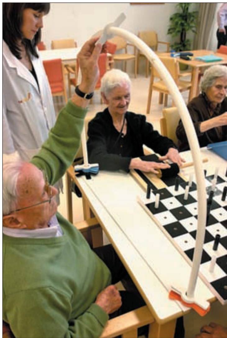
Mayores participan en talleres en Sanchinarro

“Queremos que los ciudadanos vean en esta iniciativa la voluntad de la Comunidad de Madrid de gestionar cada día con mayor eficiencia y total transparencia las necesidades y expectativas de todos los ma-