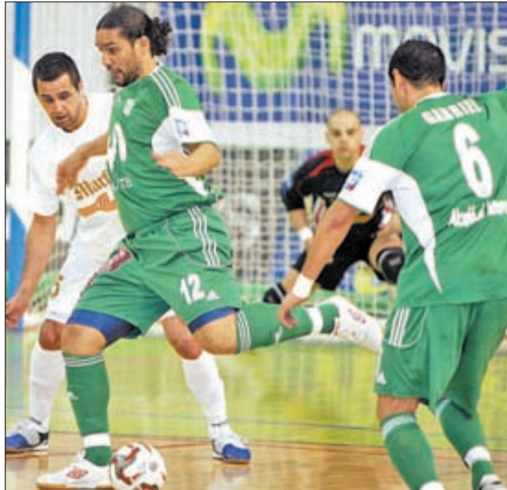
Betao es uno de los referentes del equipo de Alcalá de Henares

La 'máquina verde' inicia su andadura en la fase final este viernes a las 19:00 horas frente a la revelación del torneo, el Araz Naxçivan de Azerbaiyán que es entrenado por el brasileño Alesio, un ex jugador que figuró en la plantilla del Barcelona durante la década de los noventa. A pesar de la diferencia de calidad, a priori, entre las dos plantillas, Candelas ha concienciado a sus jugadores para que no caigan en la relajación.