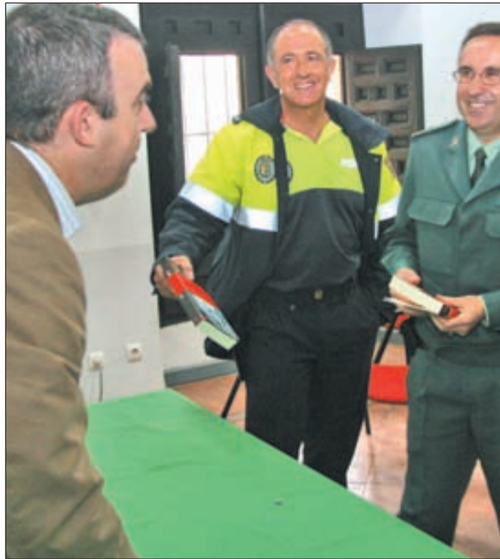
Lorenzo Silva entrega ejemplares a miembros de los cuerpos policiales

“No creo en las leyes que se diseñan a golpe de sucesos, bien sea la ley del Menor o la de Violencia de Género”, señala. Quizá por su pasado de abogado, los jueces de sus novelas tampoco salen bien parados. “La Justicia en España es problemática. Es una institución que ejerce mucho poder y demuestra poca calidad para solucionar los conflictos. Algunas veces, incluso los genera”.