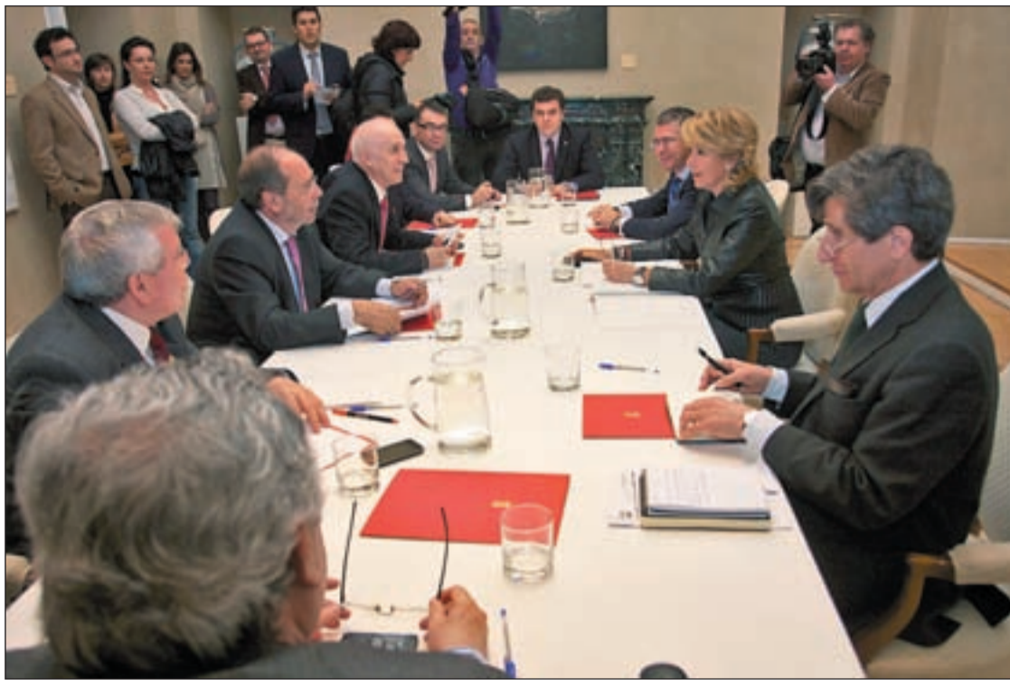
Un momento de la reunión entre los alcaldes socialistas del sur y Esperanza Aguirre

LA PRESIDENTA LES DIJO QUE NO HAY DINERO PARA CUMPLIR SUS PETICIONES