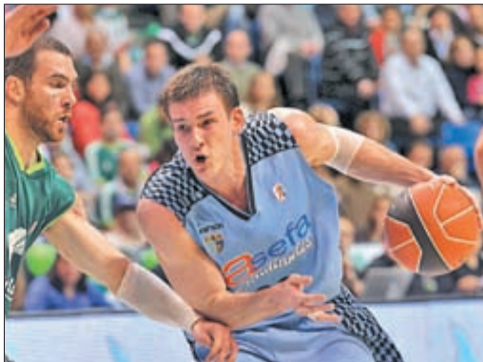
Los madrileños reciben al colista en el Telefónica Arena