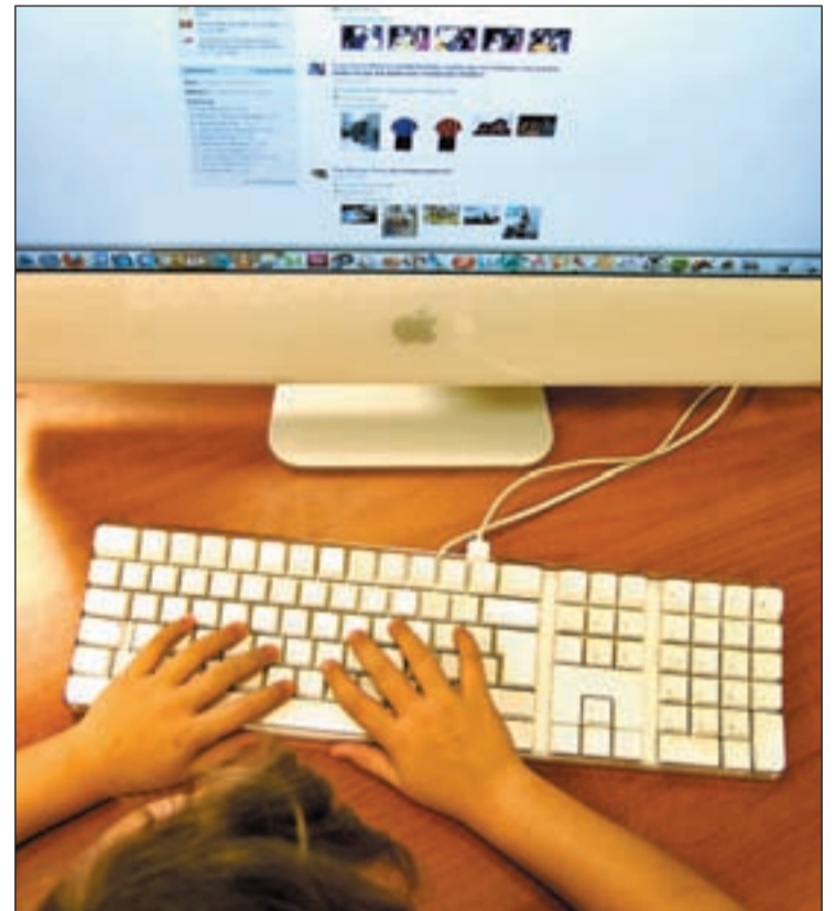
Una niña mira la página de una red social

Como medidas de prevención, el Defensor del Menor recomienda un mayor control sobre las nuevas tecnologías. Así, el ordenador debe estar en zonas comunes de la casa, activar el control parental, asegurarse que los controles de verificación de edad estén implementados, la instalación correcta del bloqueador de contenidos, comprobar que los menores conocen los riesgos de subir fotos o vídeos a las redes sociales, que los niños utilicen un 'nick' en lugar de su nombre y que los padres vigilen el perfil revisando la información que su hijo pone a disposición de los de-