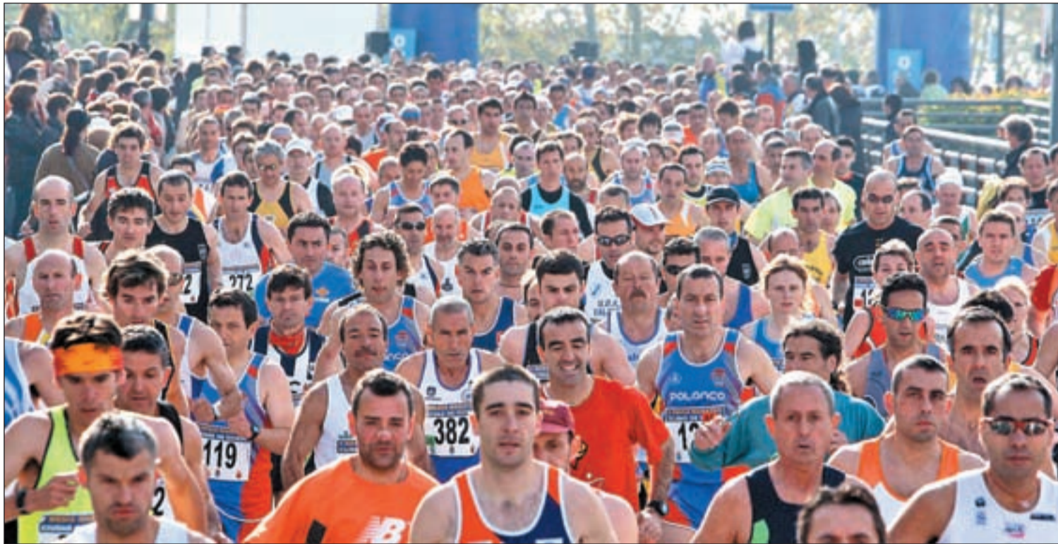
El maratón es una prueba a la que cada vez se unen más atletas amateurs

ATLETISMO UNA DE LAS GRANDES CARRERAS DEL CALENDARIO SE CELEBRA ESTE DOMINGO