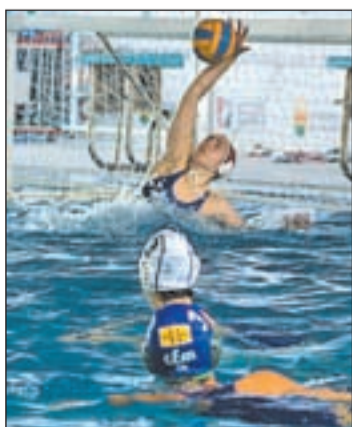
Las alcorconeras perdieron

triedad del rival, los jugadores alcobendenses esperan dar una alegría a sus aficionados. La derrota del pasado martes del Octavio Pilotes Posada hará que los locales salgan sin presión, un factor que puede ser clave para que ofrezcan su mejor versión. La cita es el sábado a las 18:30 en el Amaya Valdemoro.