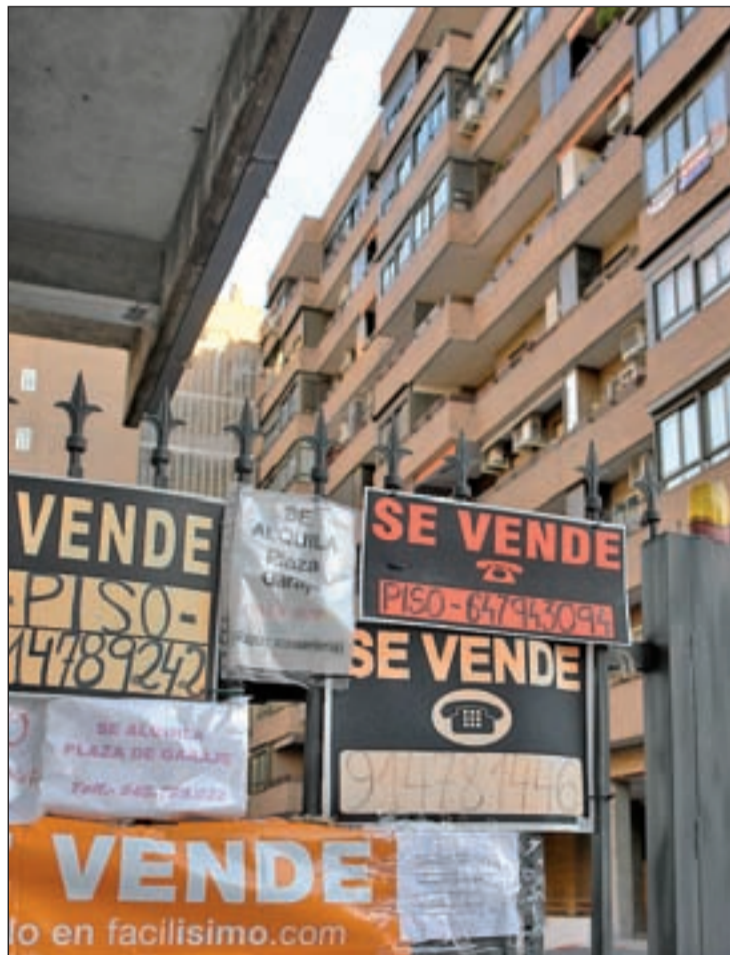
La venta de pisos se anima en paralelo a las menores caídas de precios

El Ministerio de Vivienda espera que las compraventas de viviendas sigan animándose como en los últimos meses, lo que seguiría drenando el 'stock'