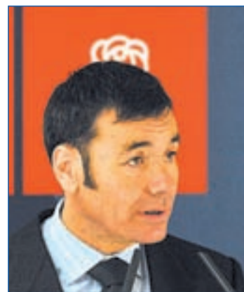
Tomás Gómez, líder del PSM

con fines “partidistas” y explicó que el cobro de las ayudas es retroactivo. Además, pidió lealtad institucional a Gómez para reivindicar un marco de financiación adecuado ya que, en la actualidad, los Presupuestos Generales del Estado sólo cubren el 20 por ciento de los gastos de Dependencia.