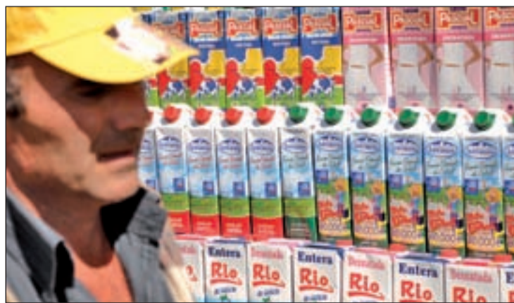
Productores de leche y Medio Ambiente condenados a entenderse

Desde el Ministerio de Medio Ambiente y Medio Rural y Marino se están manteniendo "contactos en profundidad" con la industria y la distribución "para evitar guerras que poco tienen que ver con el sector lácteo".