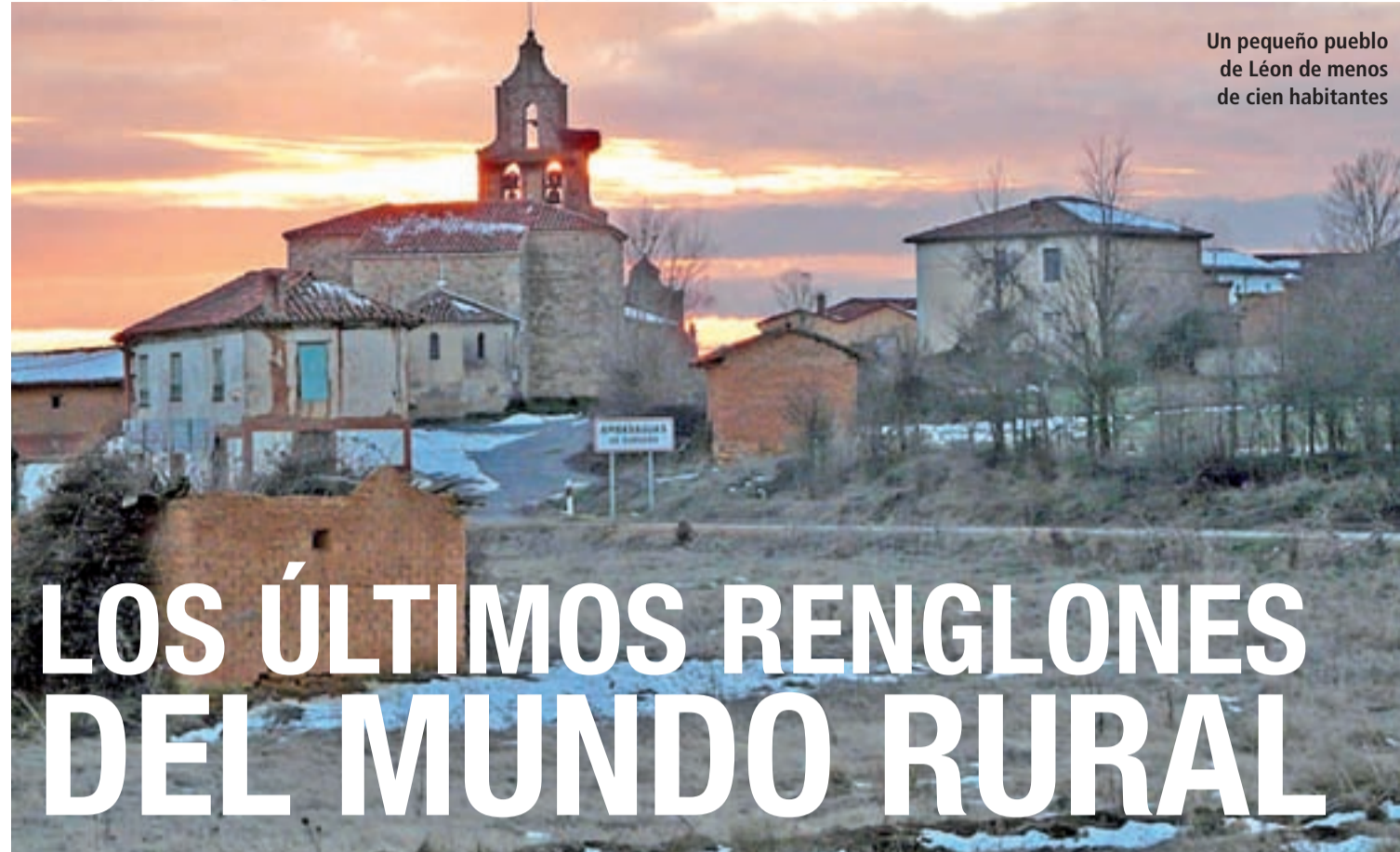
Un pequeño pueblo de León de menos de cien habitantes