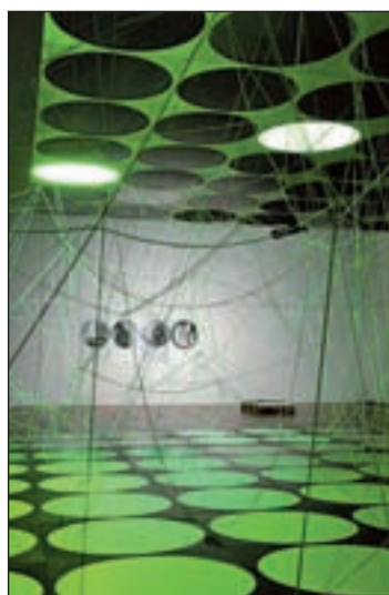
El arte de reflejar el sonido

A su alrededor orbitarán múltiples actividades que completan el programa y acercan al público a este tipo de arte que puede compren-