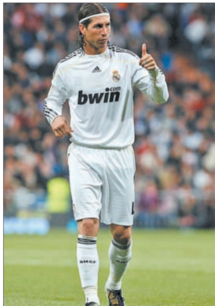
Sergio Ramos fue uno de los destacados contra el Valencia

Para este partido, Quique no podrá contar con el centrocampista Paulo Assunção que debe-