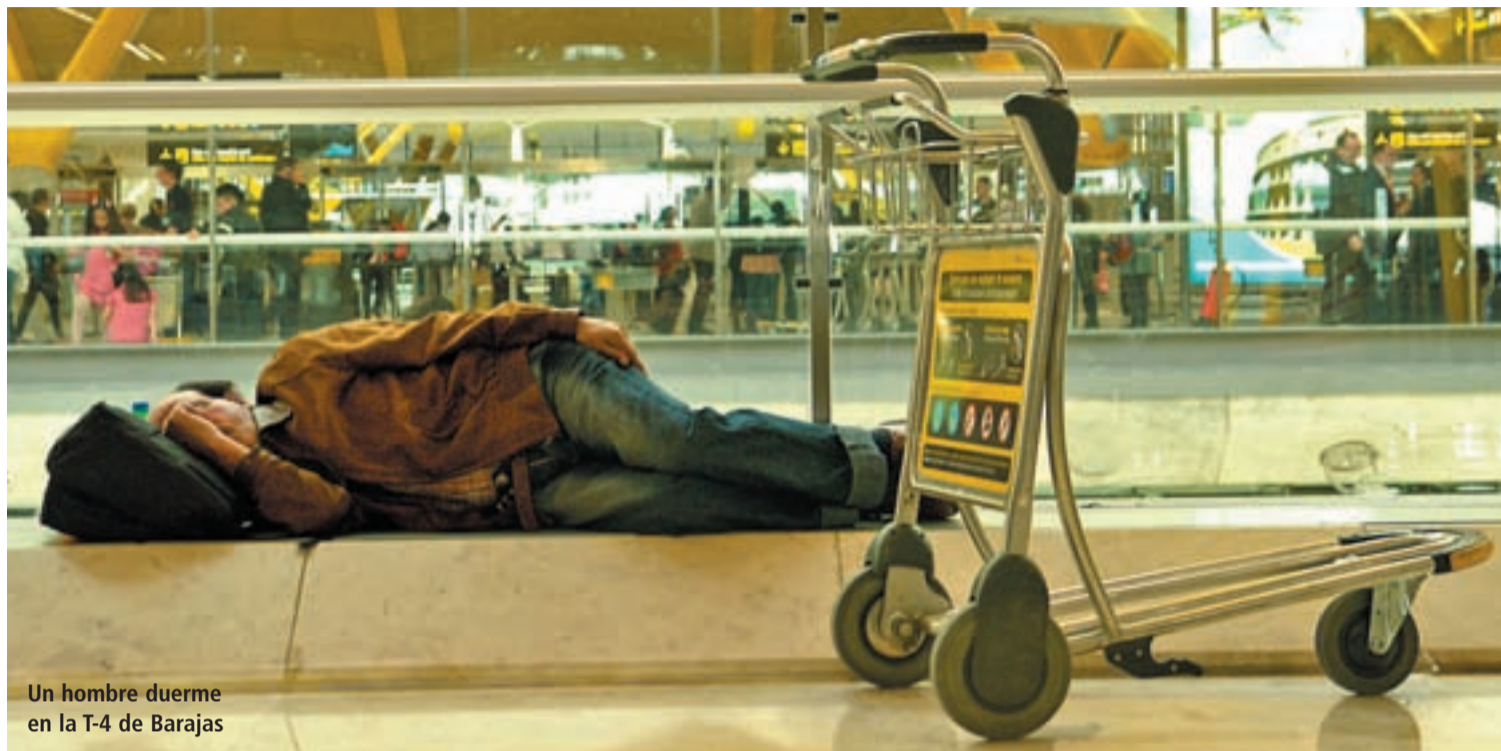
Un hombre duerme en la T-4 de Barajas