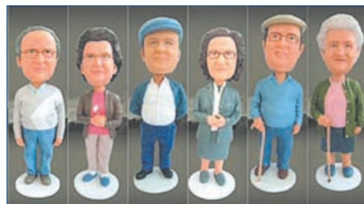
La réplica en plástico de algunos de los habitantes de Miravete

la aldea conocían a todos sus habitantes. A los doce. Además, la web vende los muñecos de cada uno de estos adorables octogenarios para sufragar la reconstrucción de la iglesia, y un juego virtual permite participar en el I Open Internacional de ordeño de cabras. Y en Miravete... empezaron a pasar cosas.