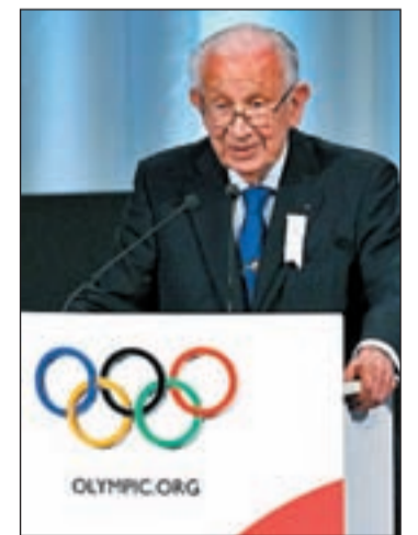
El ex presidente del COI

Su vida estuvo ligada profundamente al mundo del deporte. Practicó diversas especialidades como el boxeo, el hockey sobre patines o el fútbol antes de pasar a una faceta más institucional. Primero fue concejal de deportes en el Ayuntamiento de Barcelona y después presidente de la Federación Española de Patinaje, en lo que fue su trampolín hacia el COI al que llegó en el año 1966. Juan Antonio Samaranch será recordado por divulgar los valores olímpicos.