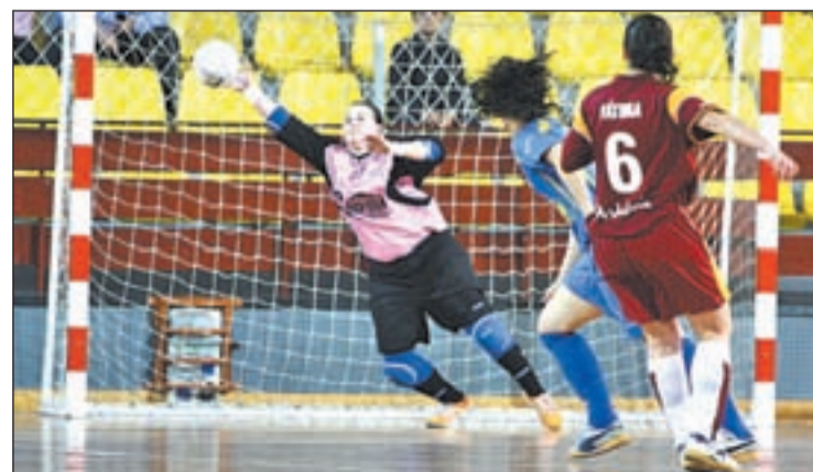
El líder visita la pista del Móstoles

bla y rival directo por la permanencia. El otro equipo madrileño de la División de Honor, el Atlético de Madrid Navalcarnero espera resarcirse de su última derrota liguera ganando al Burela FS Pescados Rubén con el que está empatado a puntos en la sexta posición.