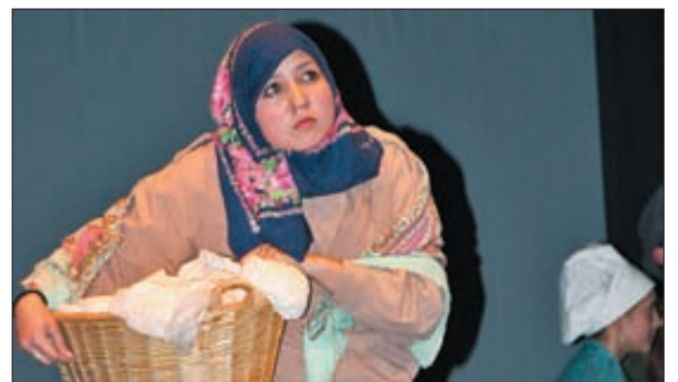
Los estudiantes de Parla representarán varias obras

primera sesión, la de las 12:00 horas, será sólo para estudiantes. En el programa de la semana que viene habrá espectáculos como El avaro , La Corte del Faraón , El andén de los sueños y fragmentos de obras de autores como Anton Chejov o Samuel Beckett.