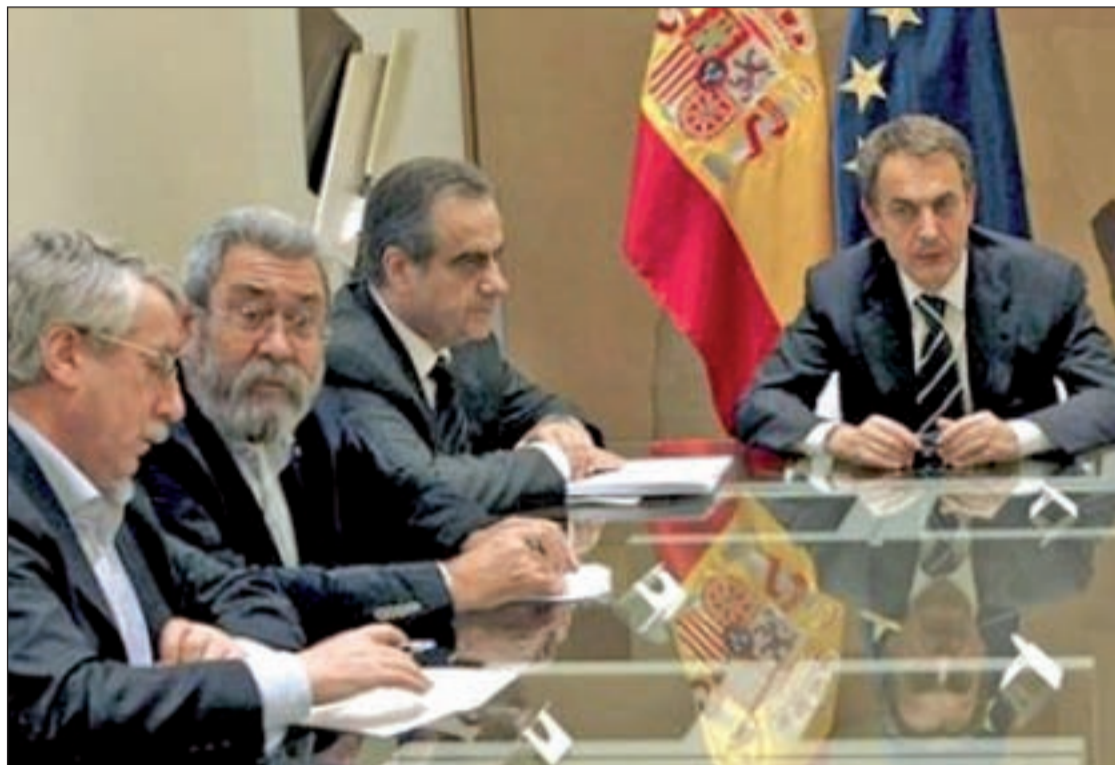
Fernández Toxo, Cándido Méndez, Celestino Corbacho y Rodríguez Zapatero, en una reunión del diálogo social

También parece claro, que el documento no convence a nadie, pero tampoco les disgusta. Sobre todo en el capítulo de igualar la indemnización del despido improcedente y por causas objetivas a 20 días por año de trabajo en los contratos de fomento de la contratación indefinida. Con las novedades de que el Fondo de Garantía Salarial se haga cargo del 40 por ciento de los 20 días.