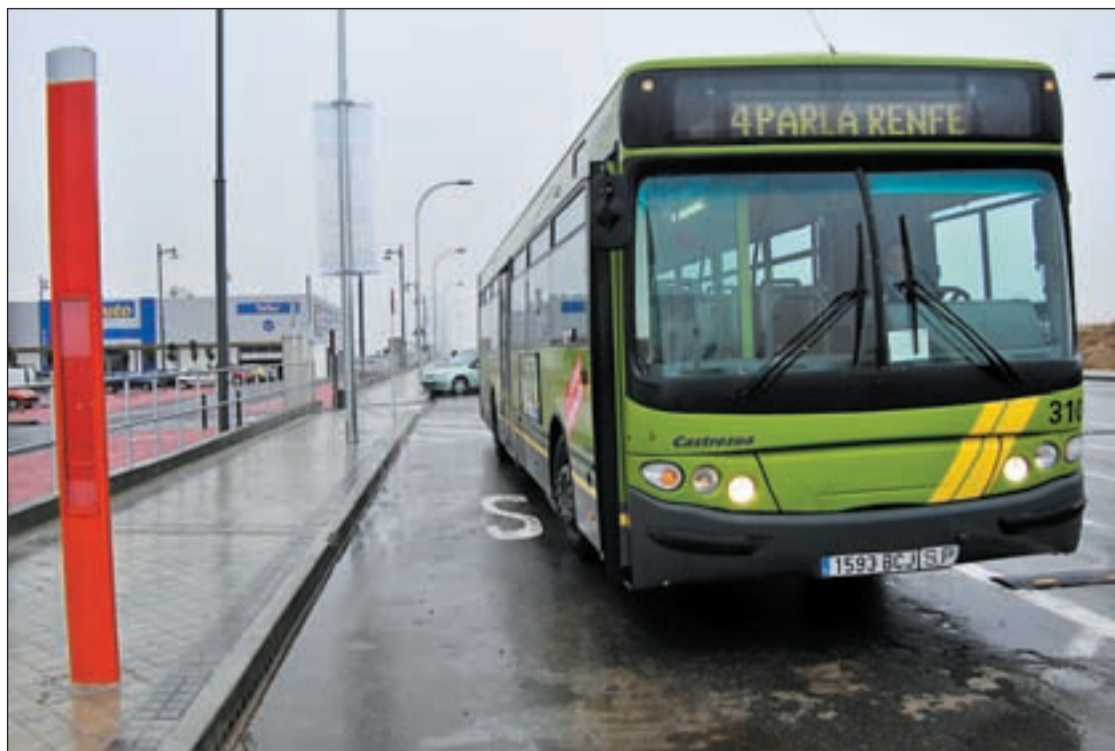
Uno de los nuevos vehículos con los que contará la flota de autobuses de Parla

Valdemoro también realizará su tradicional lectura de El Quijote . Será de 12:00 a 14:00 horas y de 18:00 a 19:00 horas en las instalaciones de la biblioteca Ana María Matute.